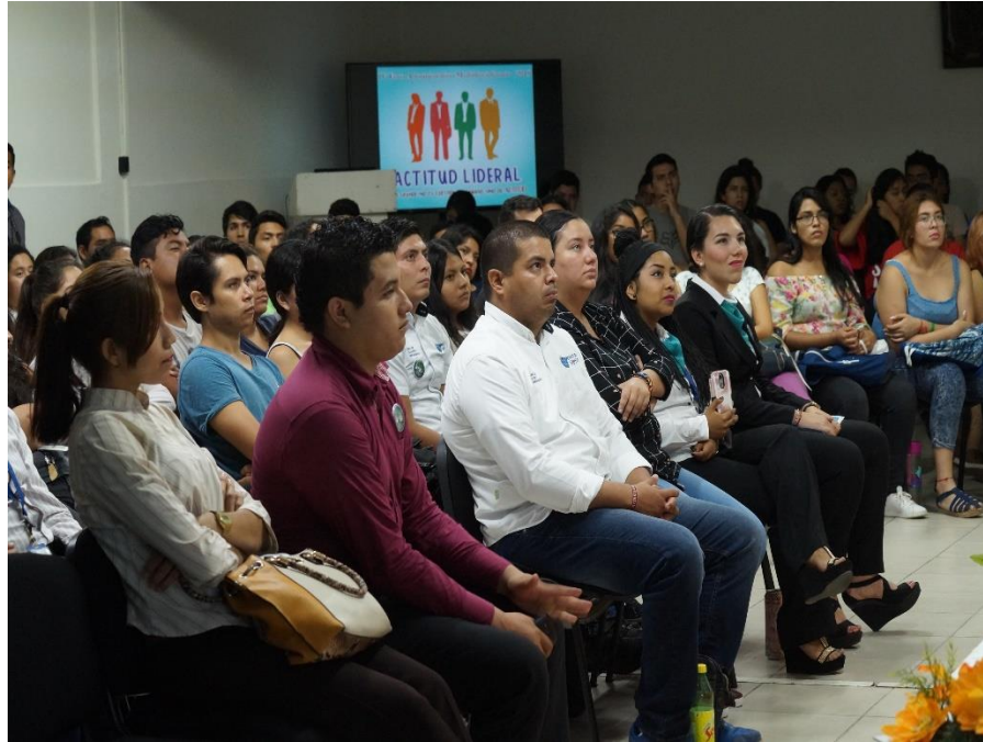
Sede de eventos IV Foro Multidisciplinario Administrativo