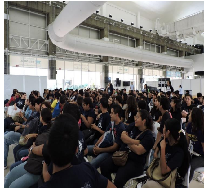
Sede de eventos IV Jornadas Tecnológicas