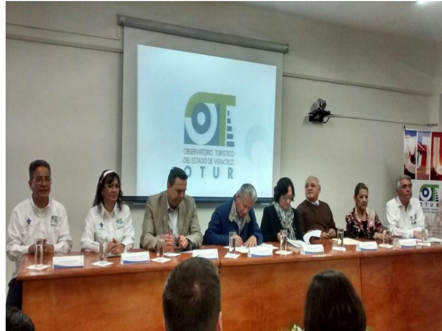
Observatorios universitarios Observatorio turístico del estado de Veracruz