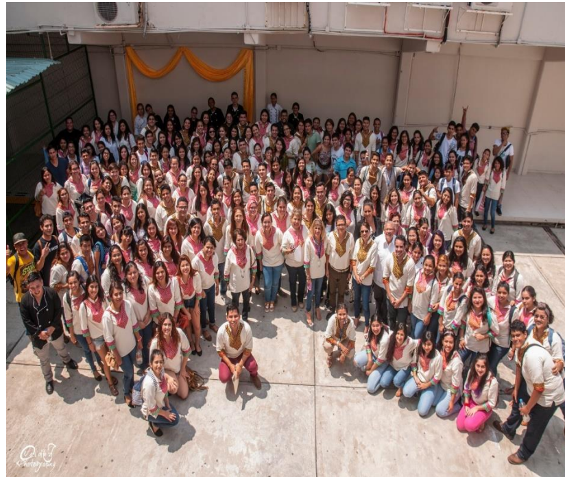
Difusión cultural Foro del Día Mundial de Turismo 2017