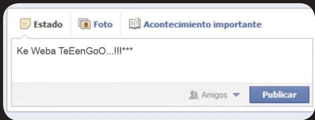
Imagen 2. Escritura disortográfica en la red social: Facebook.