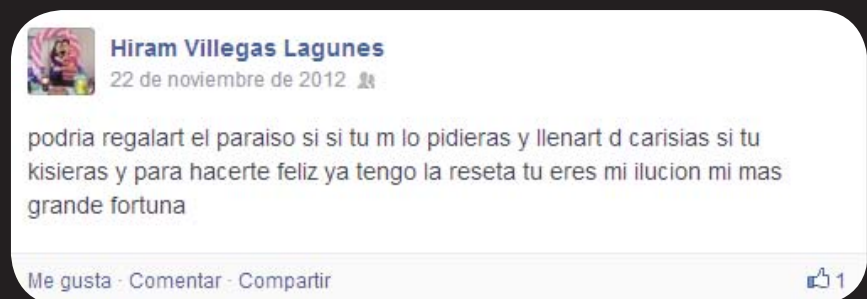
Imagen 3. Muestra escritural. Fuente: Hiram Villegas Lagunes. Prestador de servicio social en la Universidad Veracruzana.