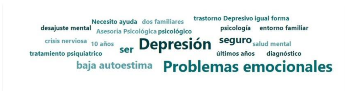
Ilustración 2. Motivos para solicitar la consulta

Los motivos para solicitar consulta fueron diversos, sin embargo, entre los más comunes fue la depresión, la ansiedad o el reconocimiento de problemas emocionales, en la ilustración 2, se presenta una nube de palabras de los motivos.