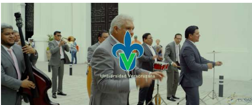
Video Musical “Tres Veces Heroica 45 Aniversario” Orquesta Tradicional Moscovita