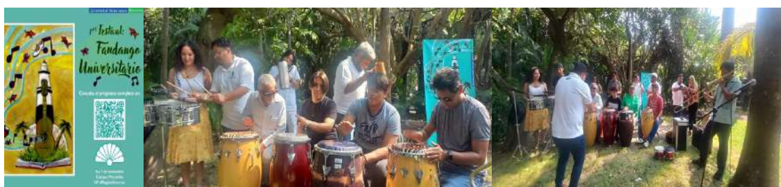
Taller del 6 de octubre 2024 en el marco del festival Fandango Universitario

Con el objetivo de enriquecer la formación artística de la comunidad universitaria de la región Veracruz, la Orquesta Tradicional Moscovita impartió un curso-taller de percusiones y sección de metales afrocaribeños en el campus Mocambo en tres fechas distintas: el 6 de noviembre de 2024 y el 13 y 14 de marzo de 2025. Esta iniciativa académica, que contó con una asistencia aproximada de 250 participantes (incluyendo estudiantes, académicos y personal de la Universidad Veracruzana), fue un éxito notable. El taller facilitó una experiencia inmersiva en la exploración de instrumentos musicales de ascendencia africana, su integración con instrumentos de tradición europea y el análisis de los géneros musicales resultantes de estas fusiones culturales.