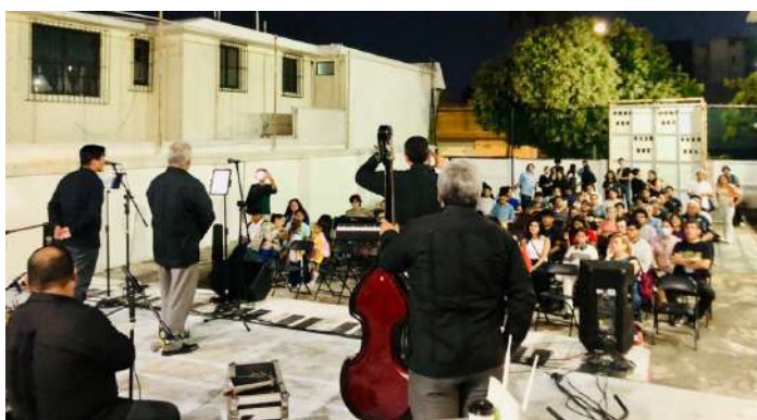
Concierto didactico ofrecido a los estudiantes y docentes de la Escuela Municipal de Bellas Artes (EMBA).

El 14 de noviembre del 2024, la Orquesta Tradicional Moscovita ofreció a la comunidad estudiantil de la Escuela Municipal de Bellas Artes (EMBA) de Veracruz el significativo concierto "Una Historia Musical del Gran Caribe". Este evento trascendió la mera interpretación musical, configurándose como un profundo viaje sonoro que exploró la historia y la trascendental importancia de la interculturalidad y la afrodescendencia en la vasta región caribeña, con una audiencia de 150 estudiantes y docentes.