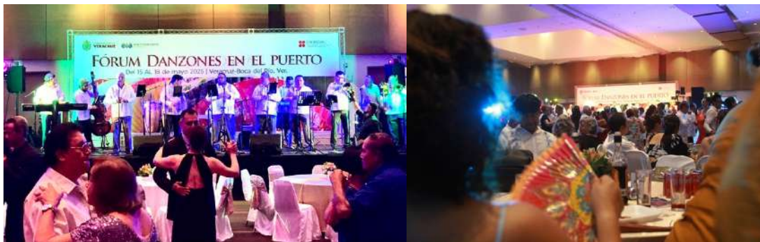
Presentación el día 17 de mayo del 2025 “Forum Danzones en el puerto”

a través de una expresión artística que fomenta la cohesión social y el bienestar de la comunidad de la tercera edad.