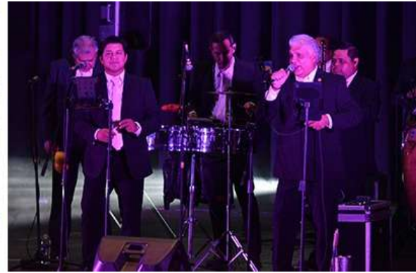
Concierto “¿Quién es el que canta ahí?” en el Auditorio metropolitano de Orizaba el día 29 de abril del 2025.