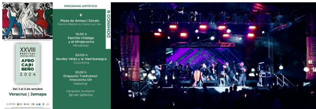
Festival Internacional Afrocaribeño 2024 XXVIII edición.

La Orquesta Tradicional Moscovita ha demostrado un compromiso sostenido con el Festival Internacional Afrocaribeño, evidenciado por sus más de once años de participación ininterrumpida en el evento. Durante la XXVIII edición del festival, llevada a cabo el 6 de octubre de 2024, la orquesta ofreció una actuación destacada en el puerto de Veracruz, presentando un repertorio que combinó piezas tradicionales de índole internacional con la riqueza musical veracruzana, captando la atención de más de 2,000 asistentes.