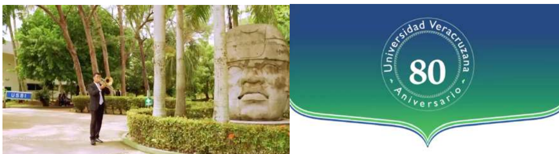
Video oficial del 80 Aniversario de la Universidad Veracruzana

Entre las actividades más destacadas se encuentran su participación en eventos de gran relevancia, como el Festival Internacional Afrocaribeño 2024, organizado por la Secretaría de Turismo del Estado de Veracruz, y la Feria Internacional del Libro Universitario 2025 (FILU). Asimismo, la orquesta realizó un concierto significativo en la ciudad de Orizaba titulado "Quien es el que canta ahí", también participó en el Foro de Danzones Nacional. Su labor también incluyó la producción del tema musical y el video oficial conmemorativo del 80 Aniversario de la Universidad Veracruzana, la participación en la producción del Festival Fandango Universitario 2024, y la creación del video musical "Tres Veces Heroica" en el marco de su propio 45 Aniversario. Adicionalmente, presentaron un espectáculo de Carnaval en el Teatro de la Reforma, con la colaboración del Ballet Folklórico del Puerto de Veracruz.