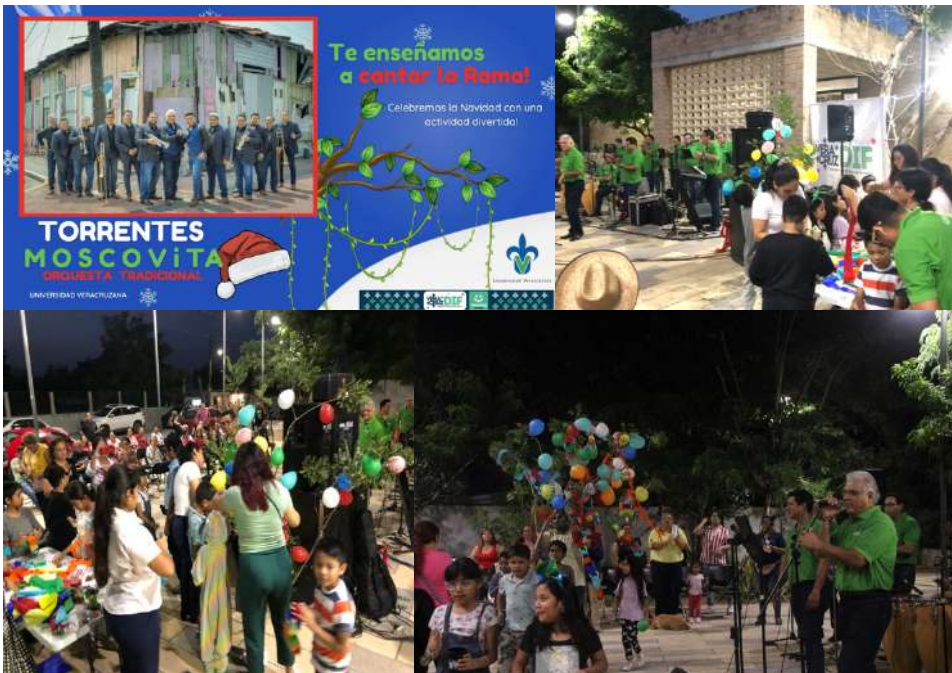
Actividad de preservación y difusión de nuestras tradiciones en la población. SIVU Nodo torrentes el día 5 de diciembre, se contó con 300 asistentes.

Por más de 10 años consecutivos, la Orquesta Tradicional Moscovita de la Universidad Veracruzana ha desempeñado un papel central en el Festival Nacional de "Foro de Danzones". En este evento anual, la orquesta contribuye activamente a la preservación y disfrute de una de las tradiciones culturales más arraigadas en México, congregando a más de 1,000 adultos mayores. Su participación constante subraya el compromiso de la Universidad Veracruzana con la difusión cultural y el mantenimiento de la memoria histórica,