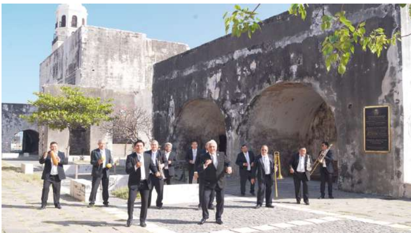
Video Musical “Lindo Veracruz 45 Aniversario” Orquesta Tradicional Moscovita

En su compromiso con el derecho humano al acceso a la cultura y el arte, la Orquesta Tradicional Moscovita ofreció seis conciertos en espacios públicos de acceso libre, incluyendo plazas, parques y colonias durante este periodo. Estas acciones buscan atender las necesidades tanto de la comunidad universitaria (alumnos, docentes, administrativos, investigadores y personal de apoyo) como de la sociedad en general, con un énfasis particular en niños y jóvenes.