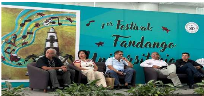
"La Afrodescendencia y su contribución en las expresiones artísticas sonoras de Veracruz"

Tradicional Moscovita fungió como ponente, abordando la significativa influencia de la herencia africana en el patrimonio musical regional ante una audiencia de 200 personas reunidas en el patio central de la USBI Veracruz.