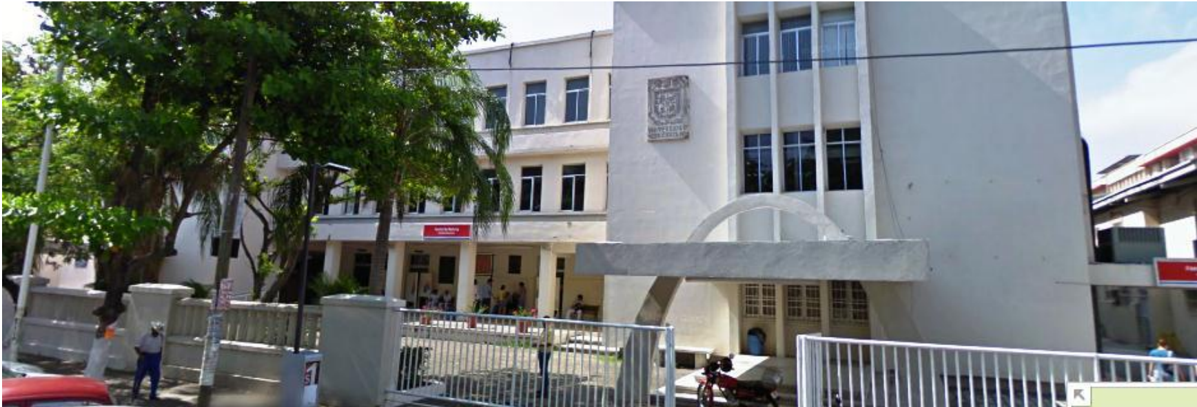
FACULTAD DE MEDICINA DE LA UNIVERSIDAD VERACRUZANA –CAMPUS VERACRUZ, VER Fotografía tomada en Febrero del 2020