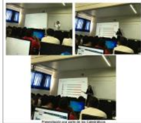
Fotografado por parte de los Catedráticos. * Se anexa en el apartado de anexos el documento original.