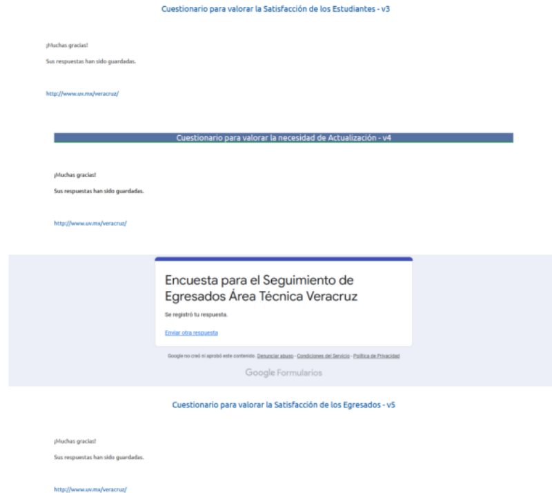
Ejemplo comprobante de encuestas realizadas