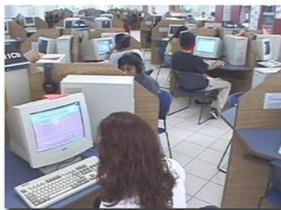
Taller multimedia y video