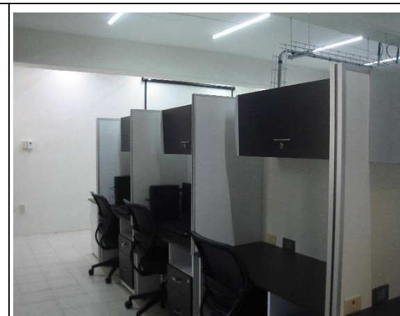
Laboratorio de posgrado