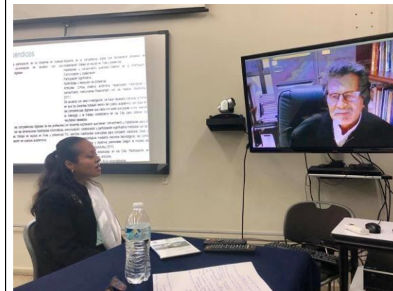
Sala de usos Múltiples