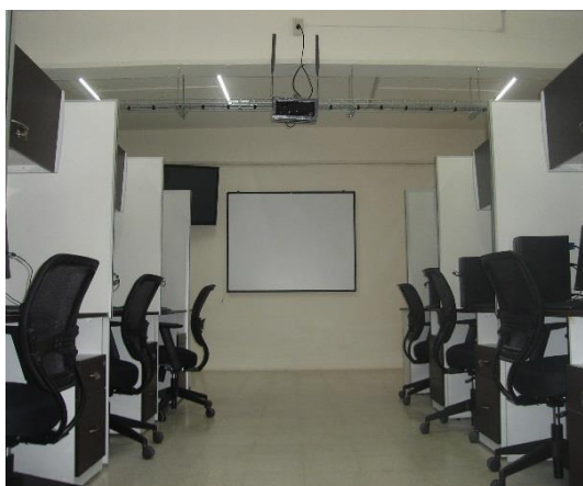
Laboratorio de posgrado

Los estudiantes del doctorado, tienen la oportunidad de enriquecer su formación a partir de experiencias de aprendizaje multimodal, de tal suerte si el programa de trabajo o el diseño de actividades docentes lo demanda, pueden tener acceso a: