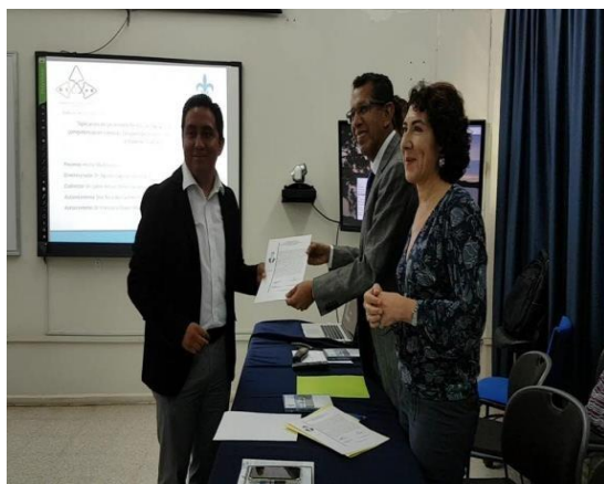
Sala de usos Múltiples