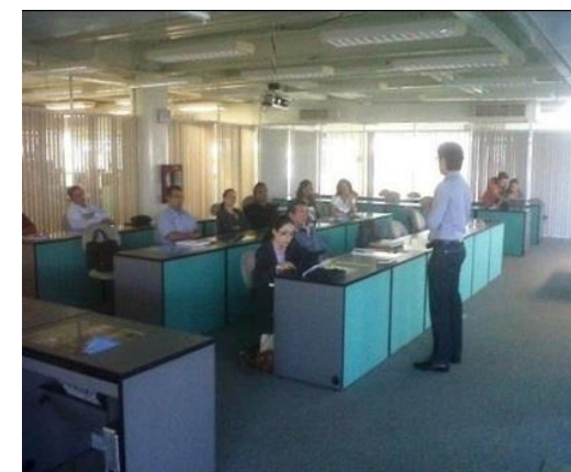
Taller sobre Biblioteca Virtual