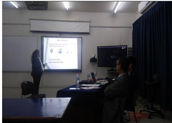
Sala de usos Múltiples