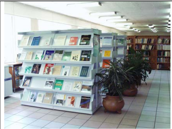
Exhibidor de revistas y libros nuevos