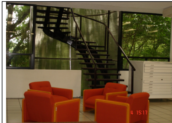
Sala de lectura y mapoteca