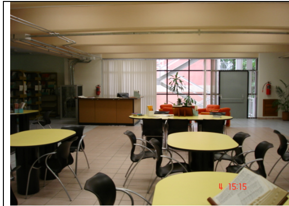
Sala de lectura y modulo de atención