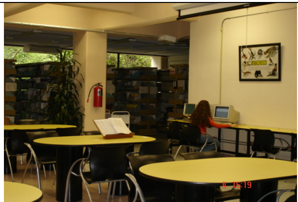
Área de consulta