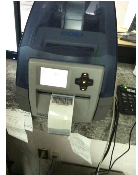
Elaborando nuestros insumos