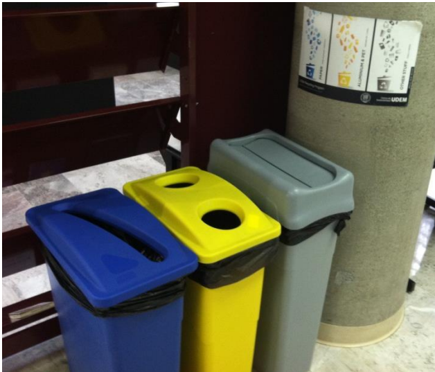
Separación de residuos