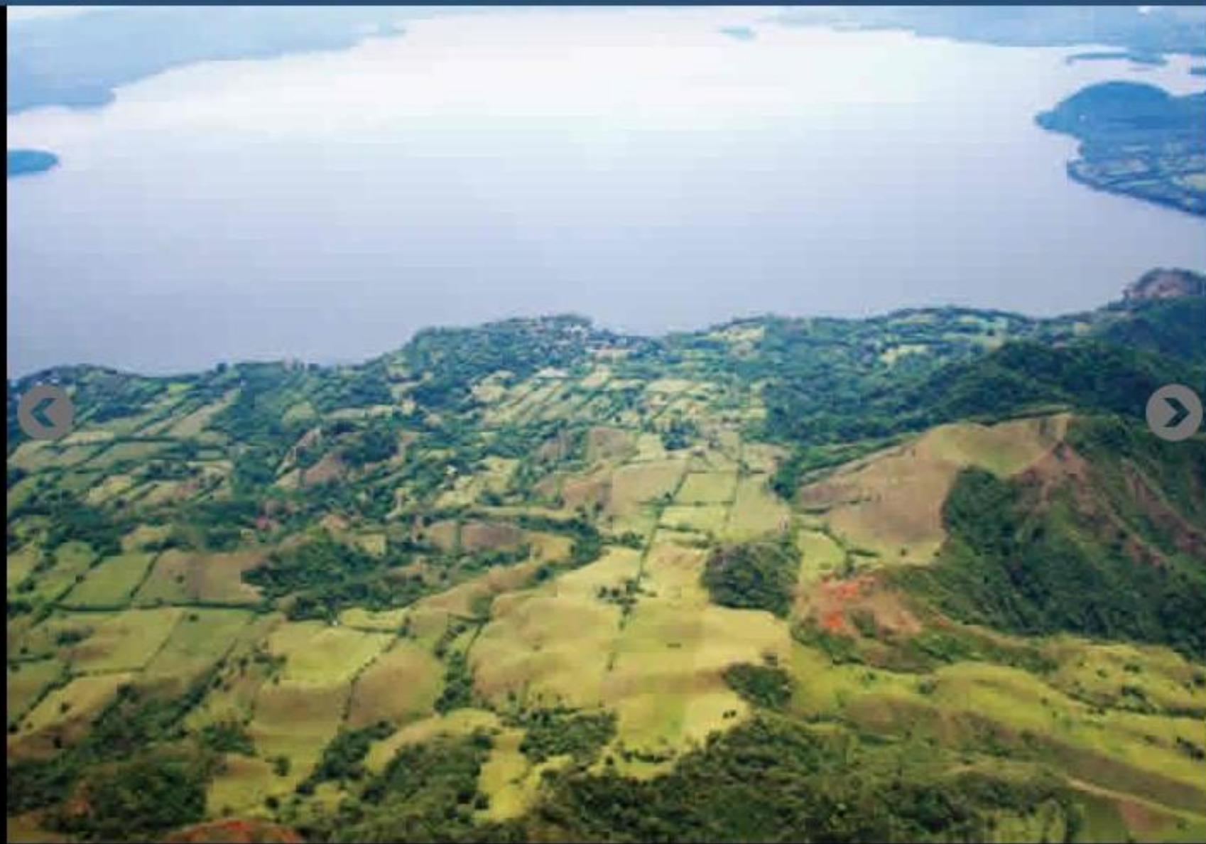
Avance de la franja agropecuaria a orillas del Lago de Catemaco, en Los Tuxtlas FOTO: