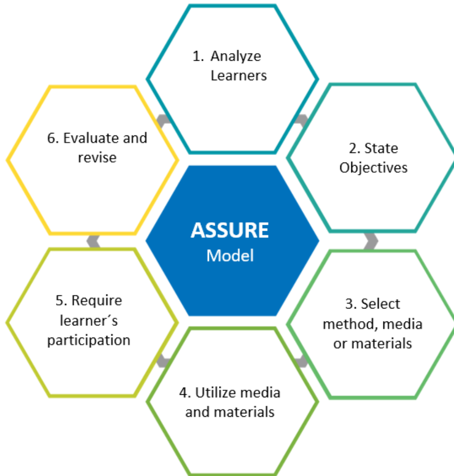
Ilustración 2.- Modelo ASSURE (Mothudi, 2014).

En la Universidad Veracruzana, independientemente del modelo de Diseño Instruccional que una determinada entidad o dependencia seleccione para su desarrollo, la Institución considera importante especificar que para lograr el aprendizaje auténtico en los estudiantes, toda EE o recurso educativo debe diseñarse, de acuerdo con diversos autores como Thorpe (1995), Chickering y Ehrmann (1996), Horton (2000), Bernard y Abrami (2004), citados en Mercado del Collado (2007), incluyendo algunos elementos mínimos necesarios que son: