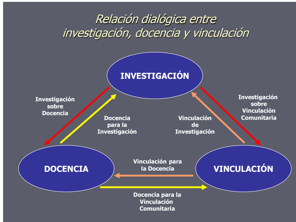
Gráfica 1: Investigación, docencia y vinculación en la UVI (Dietz & Mateos Cortés 2007)

Dicha falta de integración se percibe aún más entre la docencia áulica y la vinculación comunitaria: hay muy pocas experiencias con la necesaria hibridación entre ambos ámbitos, “sacando” los procesos docentes del aula así como integrando a sabedores/sabios de las comunidades en la docencia áulica. Nuevamente, se produce un abismo entre el papel del docente, completamente áulico, y el sabedor, frecuentemente reducido a “fuente de información” extra-áulica para los estudiantes.