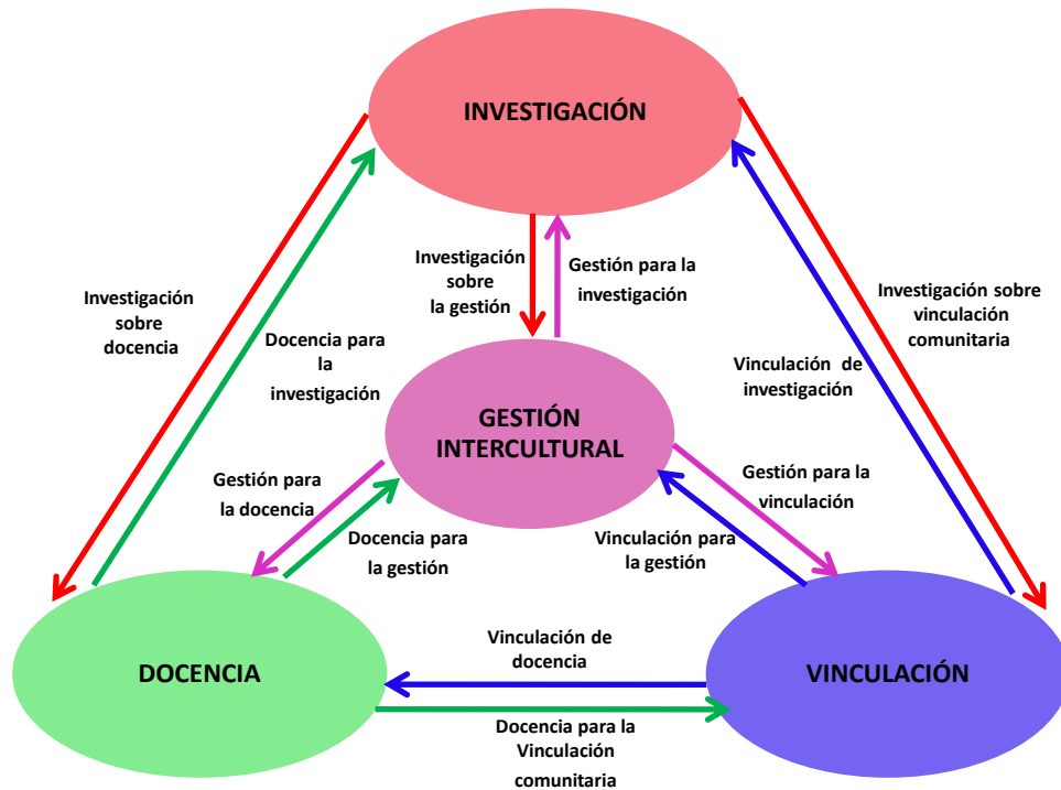
Gráfica 2: El papel central de la gestión intercultural (elaboración propia)