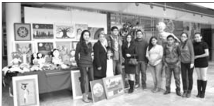
Estudiantes de Arte Popular crearon piñatas, muñecas y cuadros