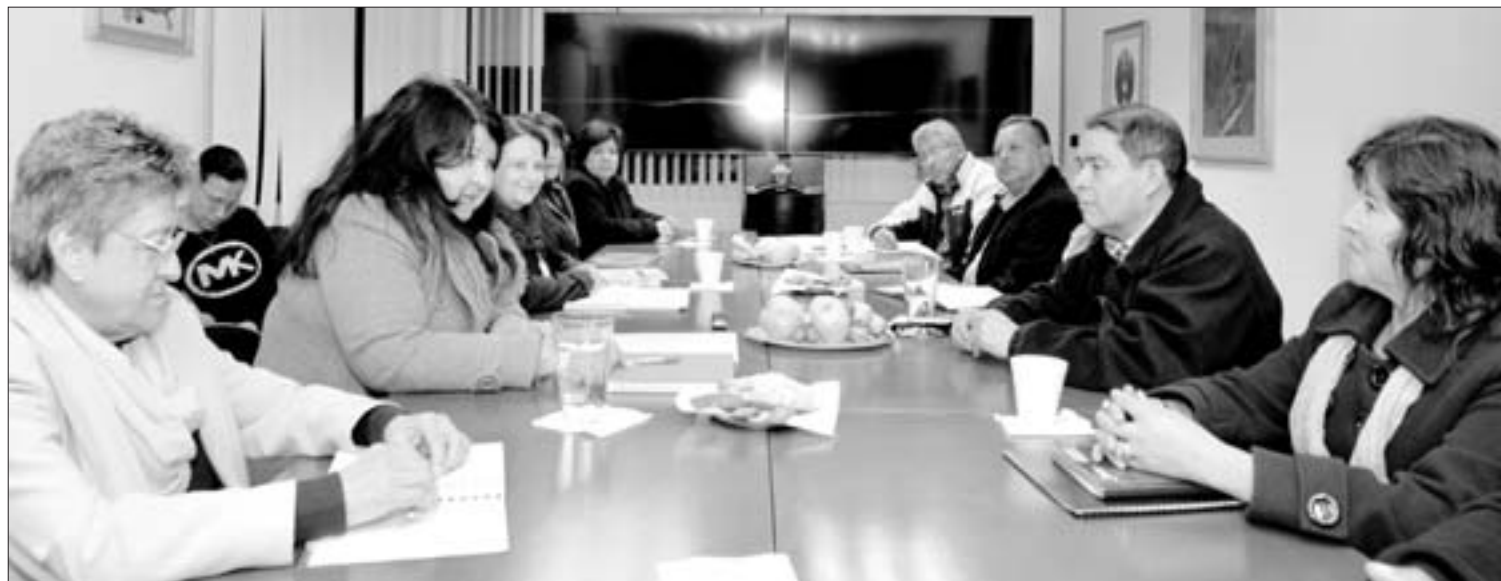
Ambas partes manifestaron su voluntad de llegar a acuerdos favorables