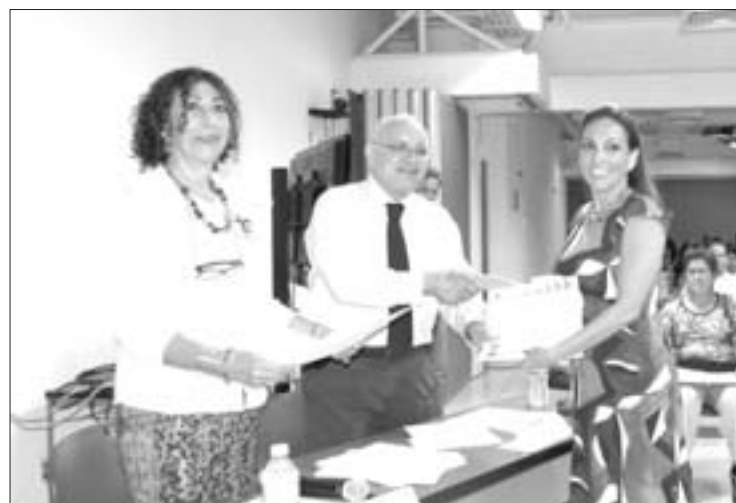
El diplomado cuenta con reconocimiento internacional