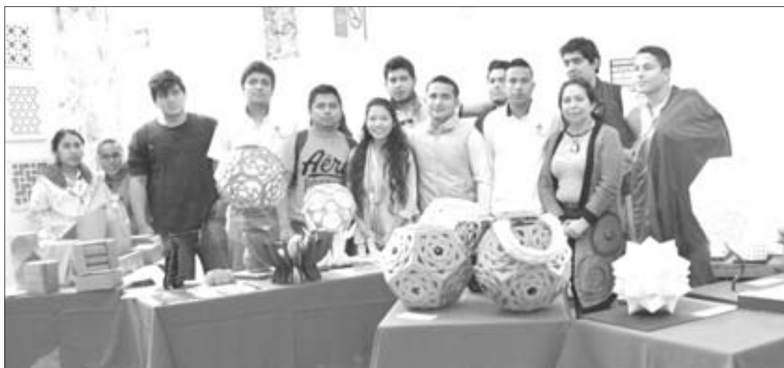
Lámparas realizadas en los talleres de Grabado, Geometría y Creatividad