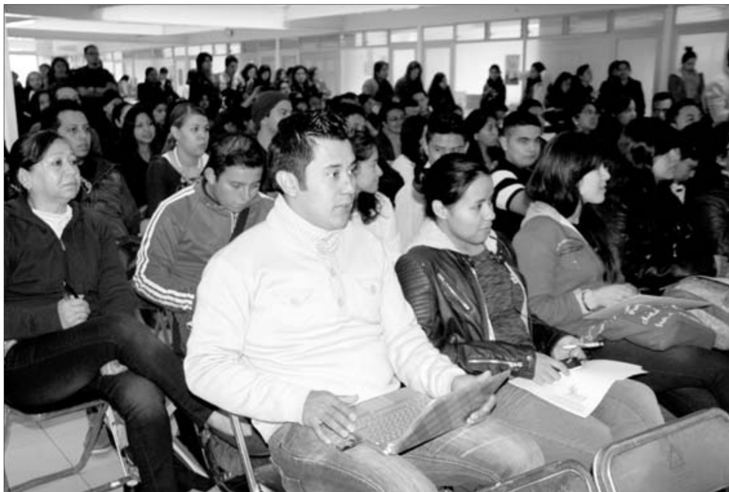
En el marco del festejo se llevó a cabo el Segundo Foro "Horizontes de Cambio"

"A medida que pasó el tiempo el número de alumnos creció y ahora son más jóvenes,