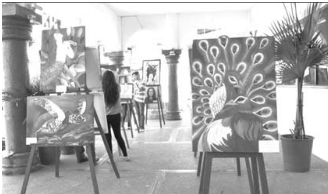
Exposición en el Palacio Municipal de Tuxpan