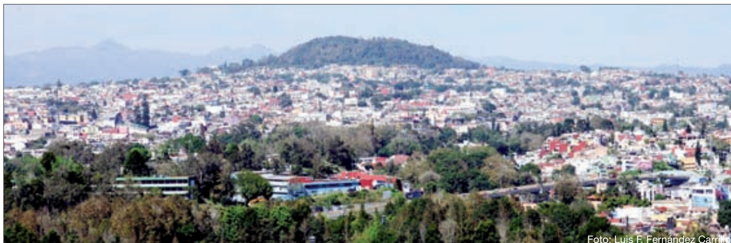
El cerro Macuilitépetl, “pulmón” principal de la ciudad

Poco a poco la vivienda del Estado fue sustituida por la de empresas privadas, inmobiliarias que ofrecen casas a través de créditos hipotecarios. Muchas de ellas, privilegiando el lucro y sin supervisión gubernamental,