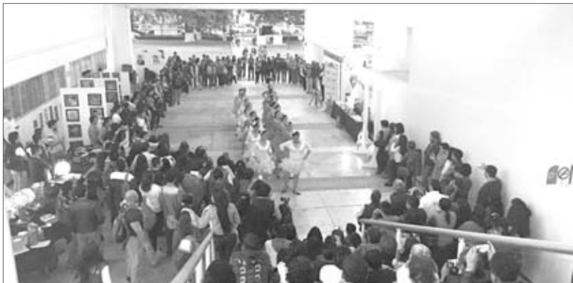
Alumnas de Bailes de Salón presentaron coreografías