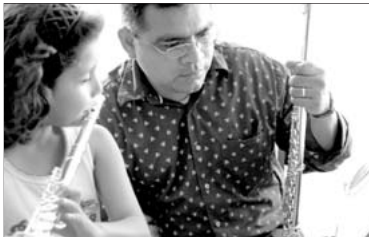
Las clases serán impartidas por músicos profesionales

Del 1 al 12 de febrero se realizarán las inscripciones, en las oficinas ubicadas en Juárez número 81, en el centro de Xalapa