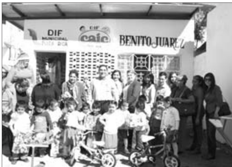
Entrega en el CAIC "Benito Juárez García"