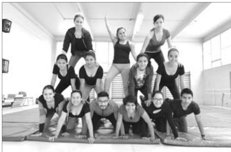
Demostración de alumnos participantes

► Albergará concentración de la Selección Nacional de Aeróbics