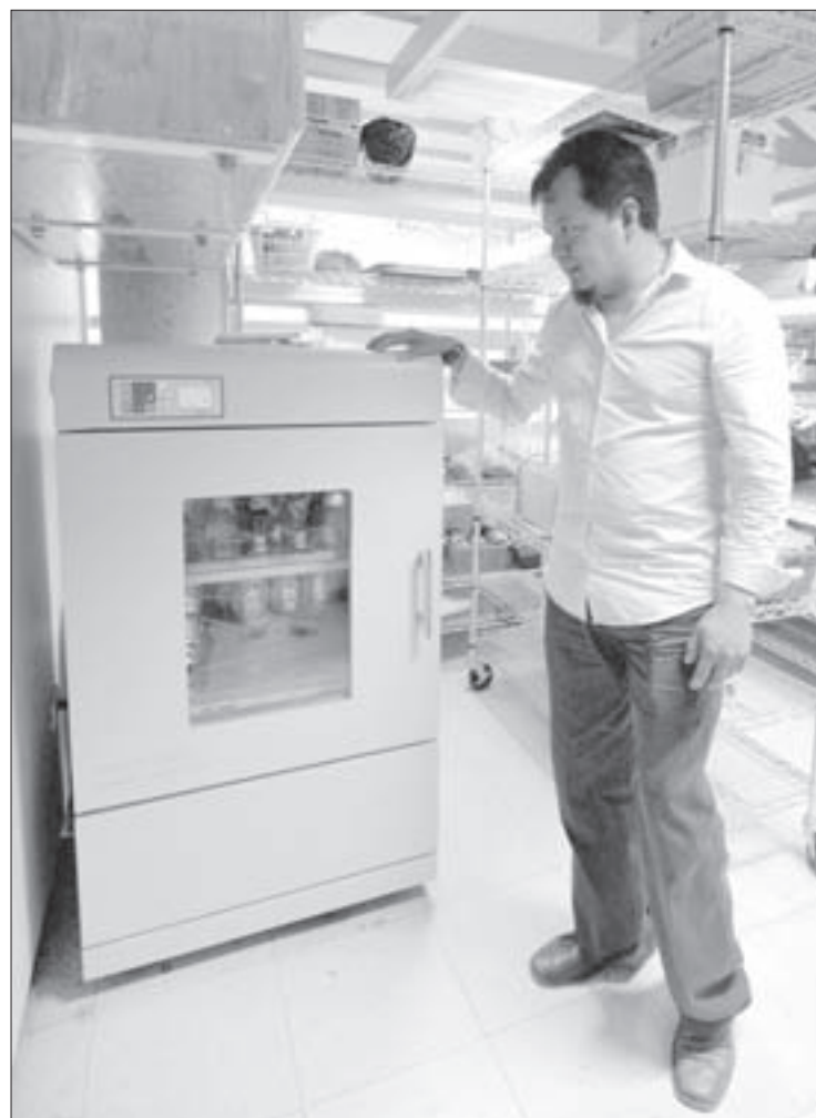
Incubadora con agitación