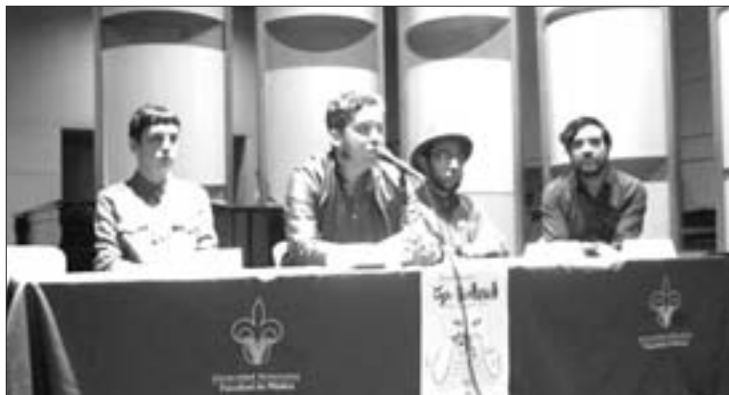
Mesa redonda “Provincia y exilio, el centro del mundo está en la periferia”

“En el campo de las artes visuales la censura se da dentro del mercado, ya que si la