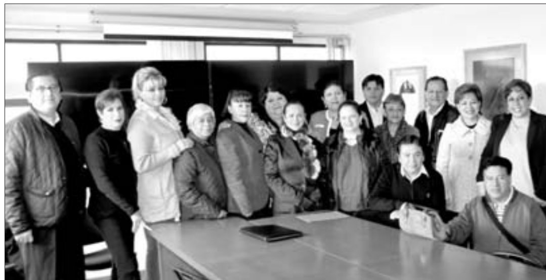
El personal de confianza refrendó su apoyo total a la institución

Compartió que en las asambleas se promueve entre los trabajadores, sobre todo entre los más jóvenes, el amor a la institución y a la asociación.