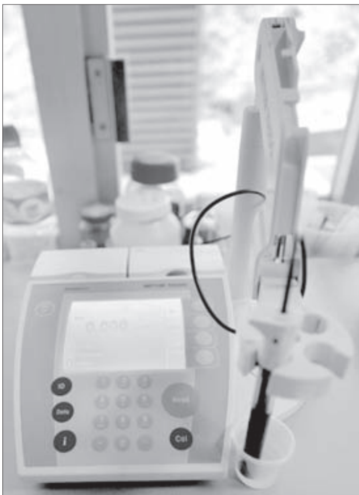
Medidor de iones