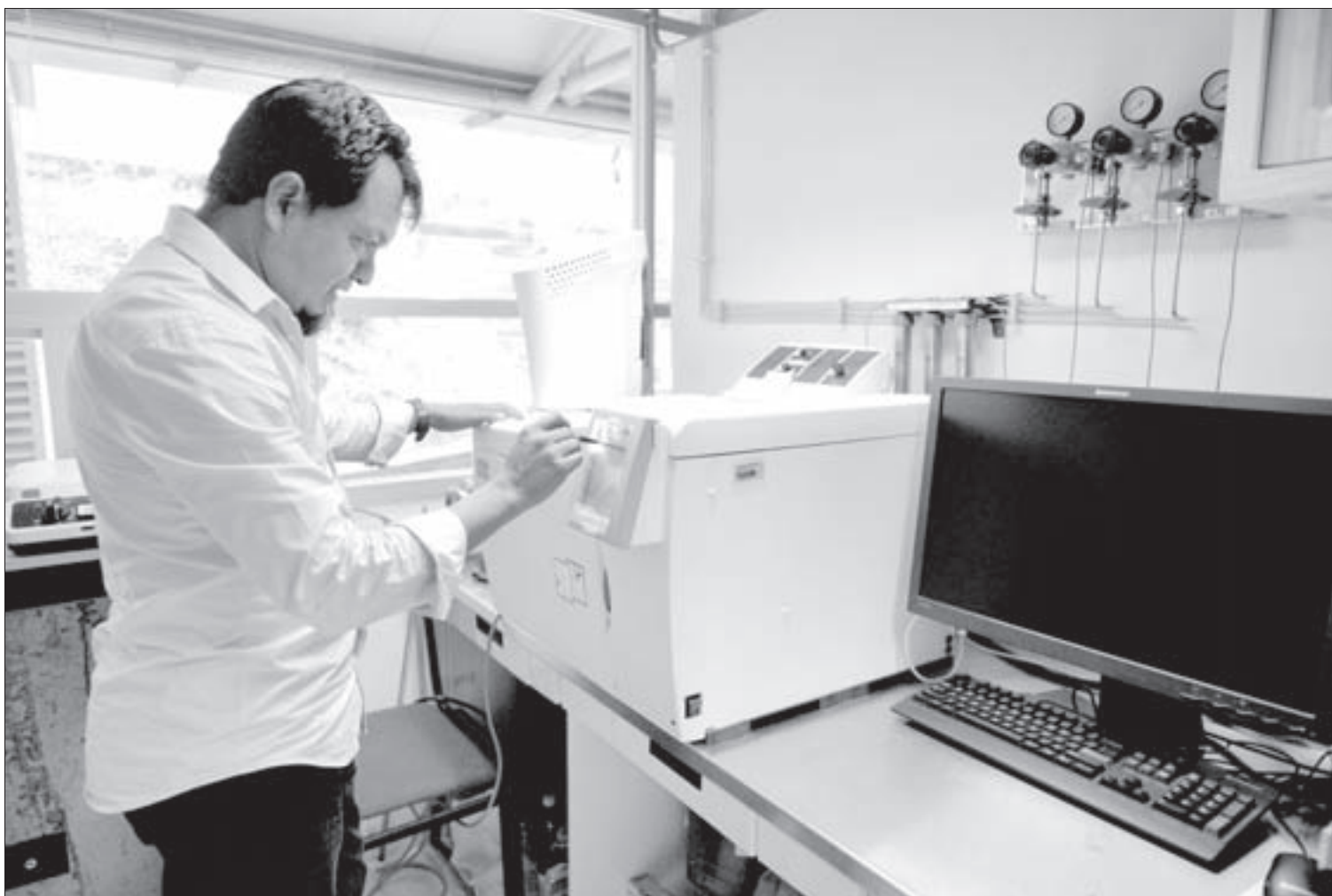
Cromatógrafo de gases

“No sólo buscamos generar conocimiento, también queremos contribuir a la formación de recursos humanos de calidad y altamente competitivos.”