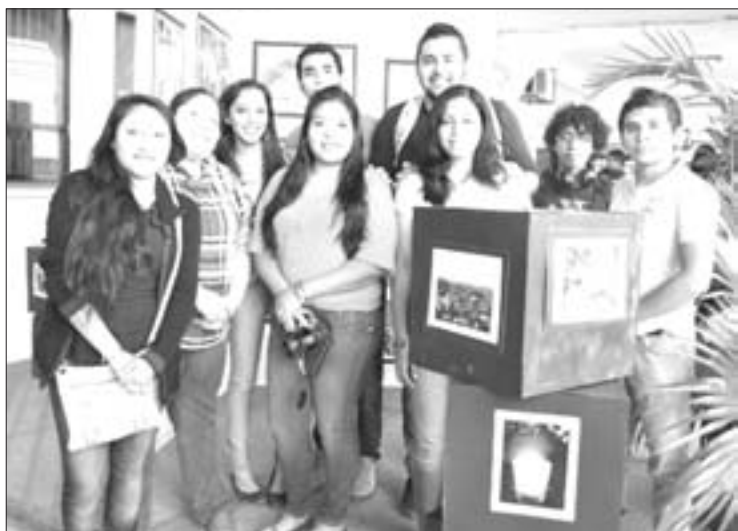
Participantes del taller de Fotografía