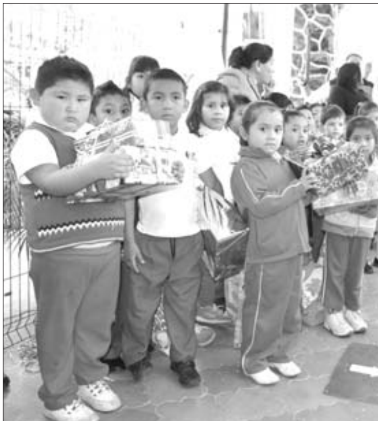
Alumnos del CAIC "Niños Héroes"