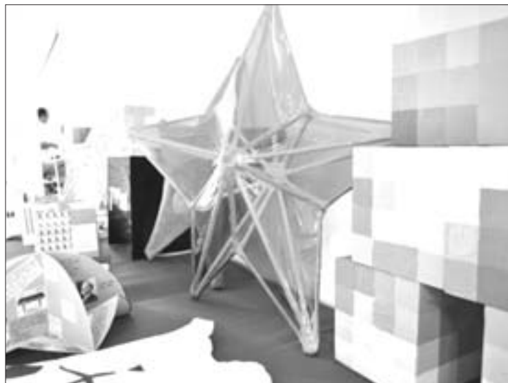
Piezas elaboradas en el taller Introducción al Diseño Gráfico