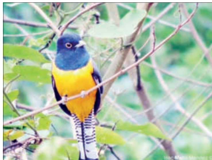
Trogon caligatus , entre las especies que aún se observan

“Por los servicios ambientales, por el valor que tienen en sí mismas