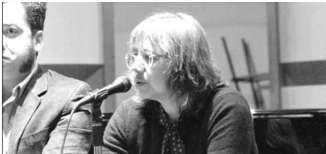
La poeta y ensayista participó en el Bye Festival

“Entonces, hay que buscar la manera de contribuir, de no ser tan periférico, no caer en el asunto contracultural, reaccionario de la marginalidad per se , sino jugar la posibilidad de cohabitar en los dos espacios.”