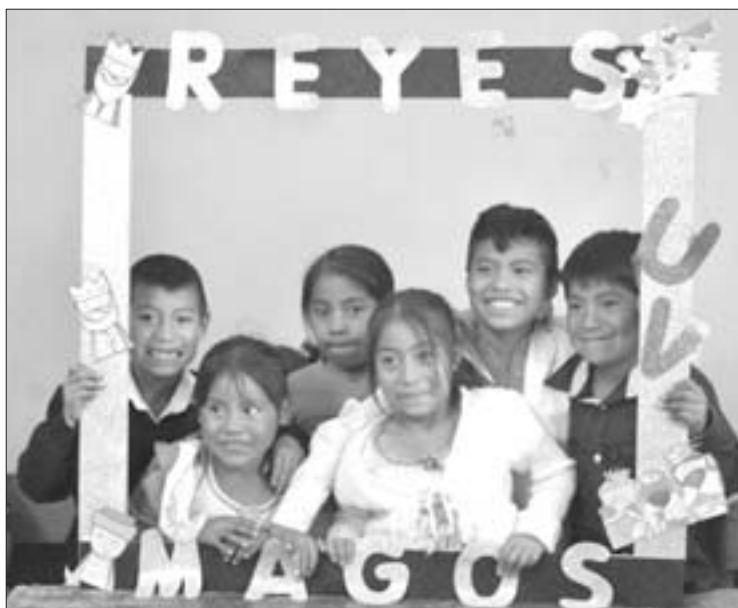
Los Reyes Magos también llegaron a comunidades serranas

► Como parte de la campaña "Apadrina una carta o dona un juguete"