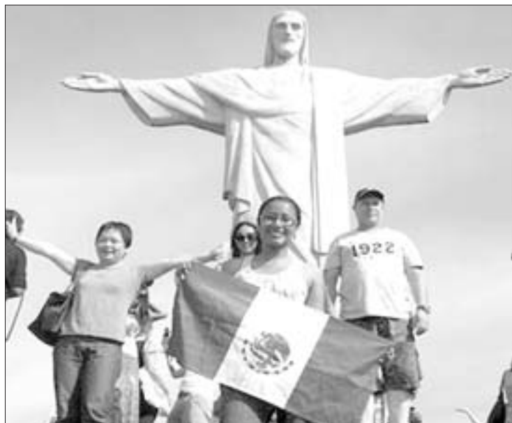
El objetivo es habilitar a los participantes para realizar movilidad internacional