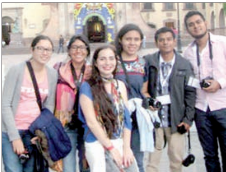
El equipo de trabajo

A costa de las áreas verdes, la mancha urbana de Xalapa creció en seis décadas 700 por ciento; hoy, la superficie verde de la ciudad representa menos del seis por ciento del total de su extensión, y el bosque de niebla que queda en Xalapa no rebasa las 50 hectáreas, muy por debajo de los nueve metros cuadrados de áreas verdes por