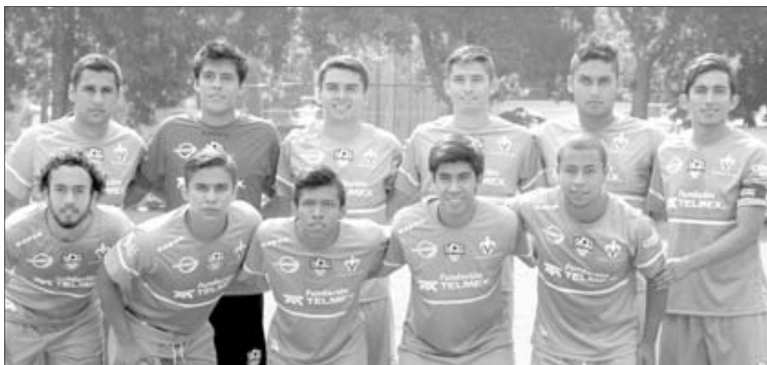
El conjunto emplumado busca mantener el invicto en casa

Al mando del entrenador Emilio Gallegos Sánchez, los Halcones continúan su preparación para este juego que es de vital importancia