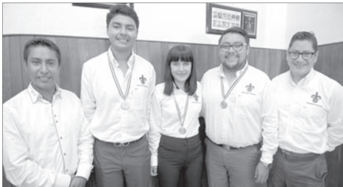
Estudian en las facultades de Química Farmacéutica Biológica y de Contaduría y Administración

Cursos autorizados por el Departamento de Educación Continua de la Universidad Veracruzana con valor curricular. La Universidad Veracruzana se reserva el derecho de cancelar o posponer el presente programa, de no reunir el cupo mínimo requerido.