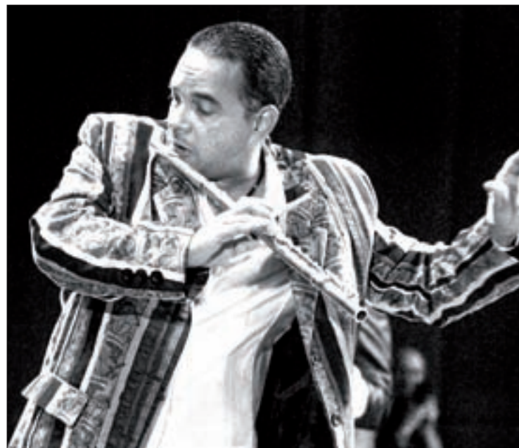
Orlando “Maraca” Valle

Para mayores informes sobre el 7° Festival Internacional Jazzuv , consultar el sitio: www.uv.mx/jazzuv/festival-jazzuv/ y en Facebook: /FestivalJAZZUV y Twitter: #FestivalJazzUV.