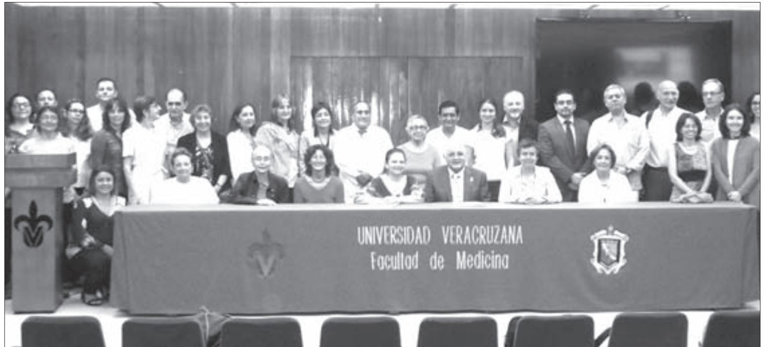
Académicos de ocho países participan en el proyecto

Los pacientes, abundó, reciben atención en diversos