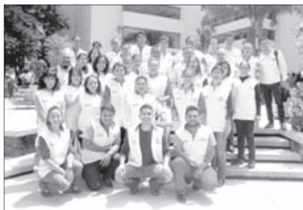
Los “Guardianes de la Salud” brindan orientación y apoyo

Para concluir compartió que se ha inscrito a clases de salsa, ya que por herencia tiene familiares diabéticos y debe tomar medidas de prevención.