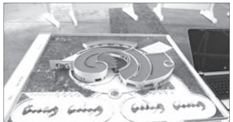
Los proyectos reflejan lo aprendido en las aulas