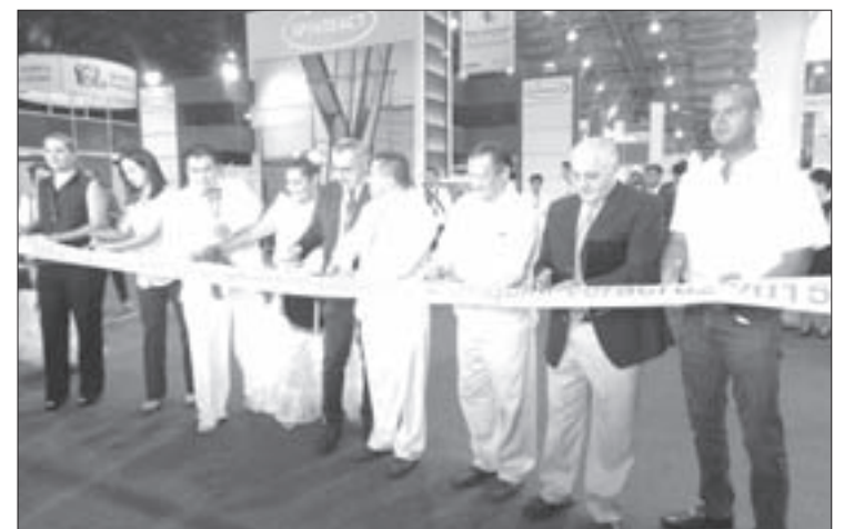
El Vicerector inauguró la Expoquim 2015