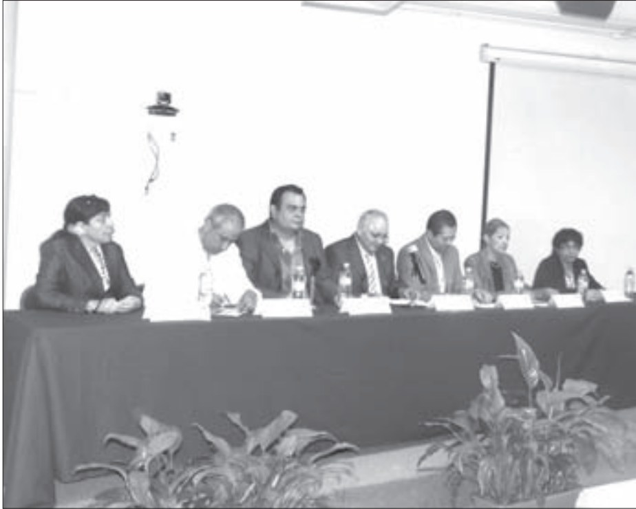
El Vicerrector presidió la inauguración