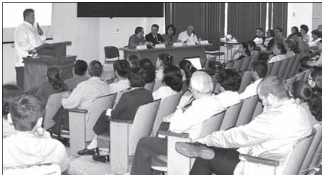
Universitarios escucharon a directivos y coordinadores

De igual manera, los Centros de Idiomas de Orizaba y Córdoba son parte fundamental en el andamiaje académico regional, ambos enfatizaron en sus informes el impacto que han tenido al coadyuvar mediante la sensibilización y enseñanza de una segunda lengua a los estudiantes de movilidad internacional.