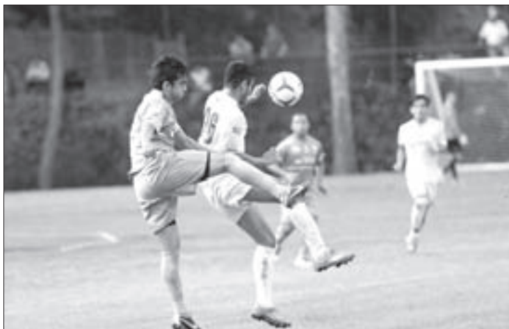
Se impuso con marcador de 4-3 a Linces de la UVM

La escuadra de la UV tuvo que venir de atrás para sacar la victoria, pues al término del primer tiempo perdía con marcador de 1-2, con goles de Irving Cuauhteca por los visitantes, y Misael Soto por los Halcones .