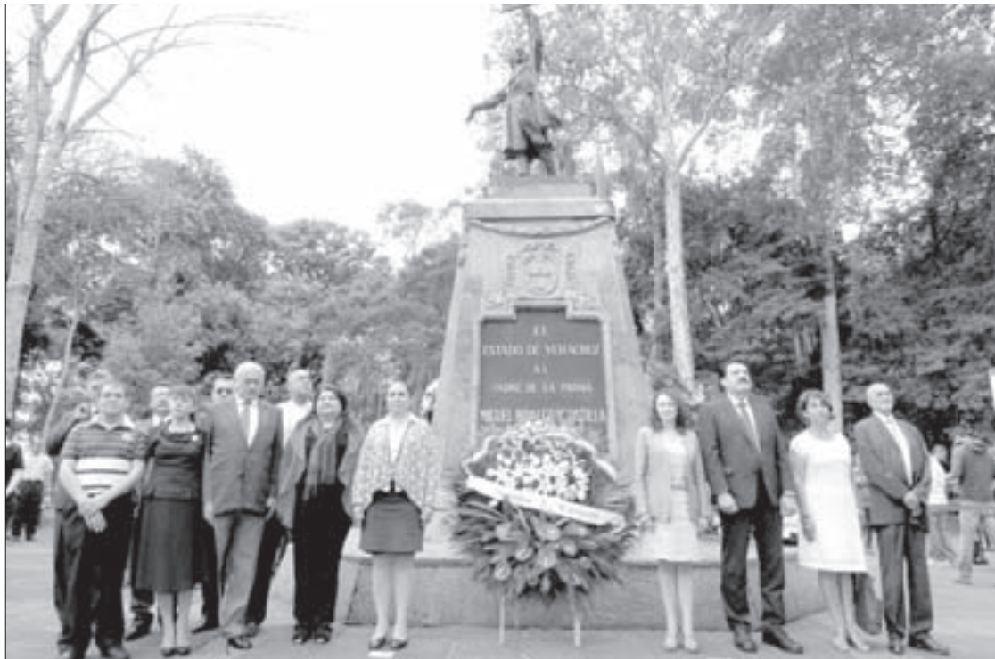
Funcionarios, líderes gremiales, académicos y estudiantes participaron en el acto