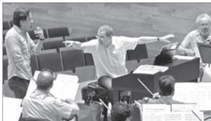
Es titular de la OSX

Todo participante deberá preparar previamente el programa a presentar y enviar un video vía link YouTube al correo: audiciones.osx@gmail.com , dirigiendo un concierto o ensayo. Esta grabación no debe ser mayor a 15 minutos.