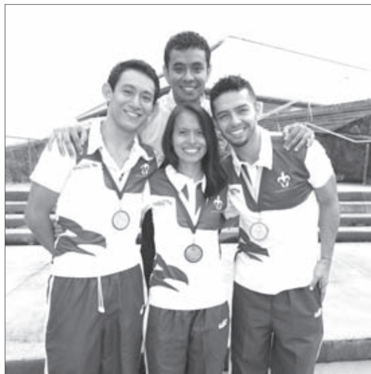
Han destacado en eventos nacionales e internacionales