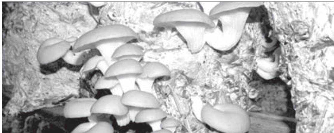
Los hongos son primos en primer grado de los animales

¿Quién lo hubiera pensado? Ahora resulta que hasta la roya del café es nuestra prima. En fin, como dice otro refrán, “sucede hasta en las mejores familias”.