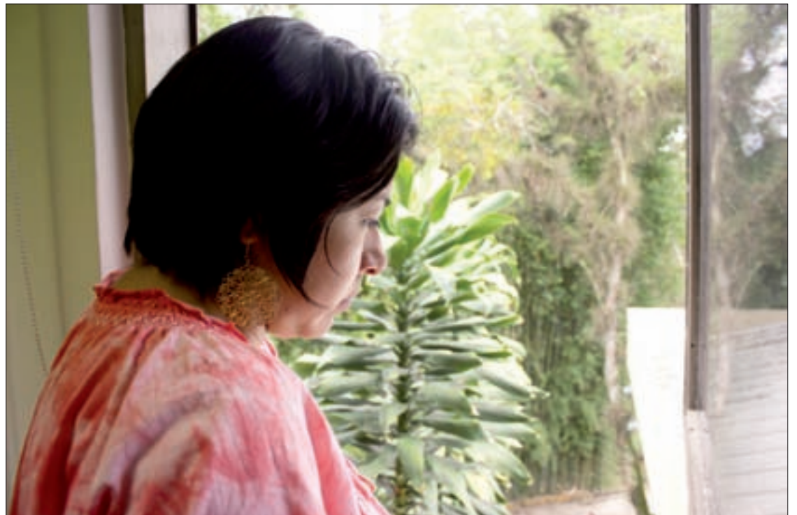
La supresión emocional se asocia con la angustia y el estrés

"Para curarnos, lo que hay que hacer es investigar en nuestro interior y buscar la causa de la enfermedad. Hay que apartar la mirada del síntoma y de la enfermedad y buscar más allá, ir al origen, ir a la raíz del problema."