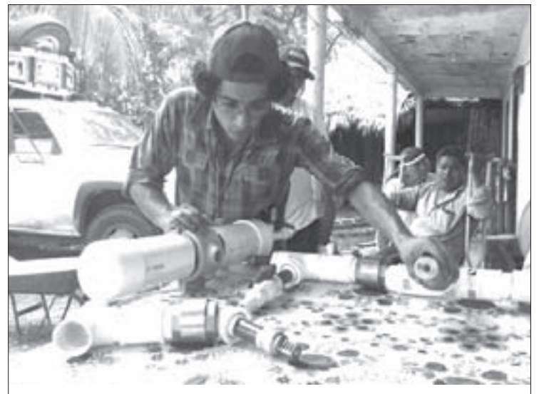
En el evento se mostró la estructura de la bomba hidroariete

Al encuentro asistió personal docente de la UACH, representantes de organizaciones campesinas de Guerrero, Puebla, Veracruz, Yucatán y Tlaxcala. El propósito de la asistencia de la UVI Huasteca fue diverso, se concretó en la generación de espacios de vinculación, aprendizajes y participación entre docentes, estudiantes y campesinos de ésta y otras