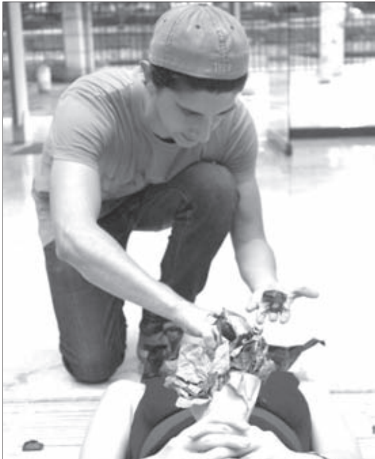
La obra de Fernán González hace referencia a la violencia contra las mujeres