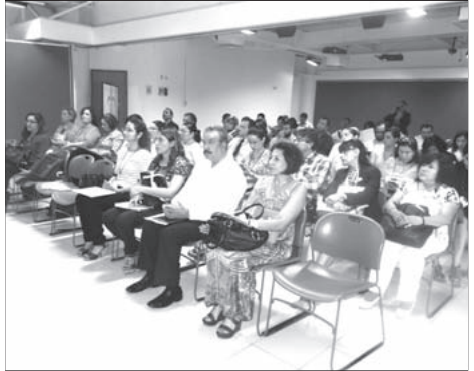
Asistentes al congreso