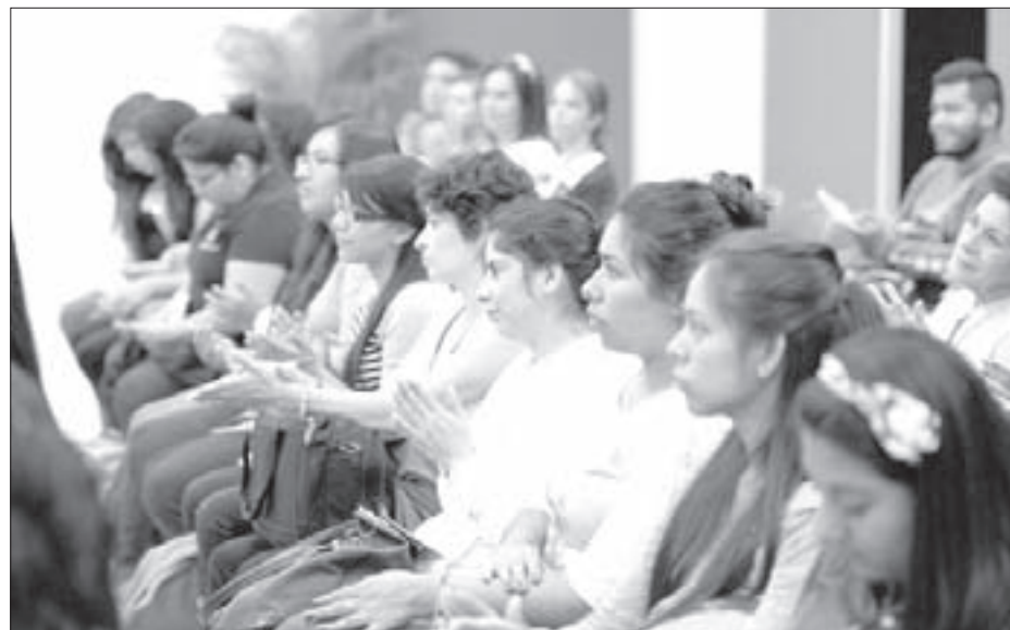
La sensibilización es el aspecto medular