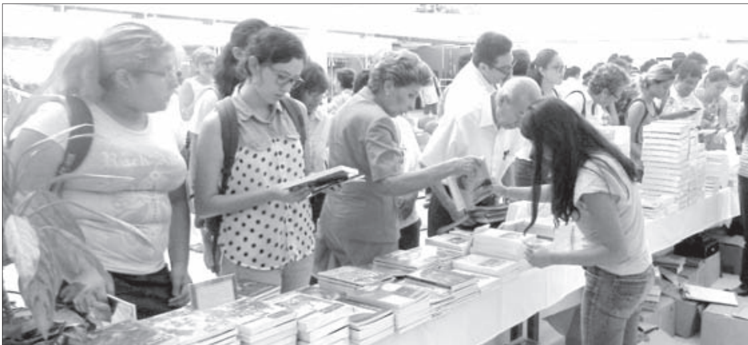
En la feria del libro se ofrecieron grandes descuentos