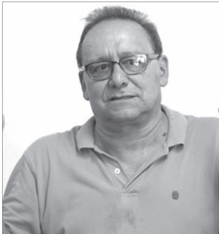
El dramaturgo ofreció un conversatorio en el CECC