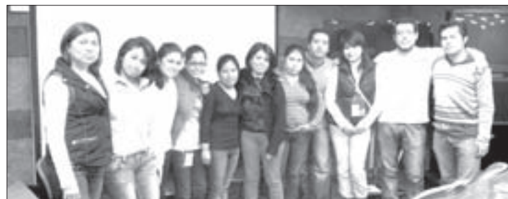
Integrantes de las BUSS con las facilitadoras