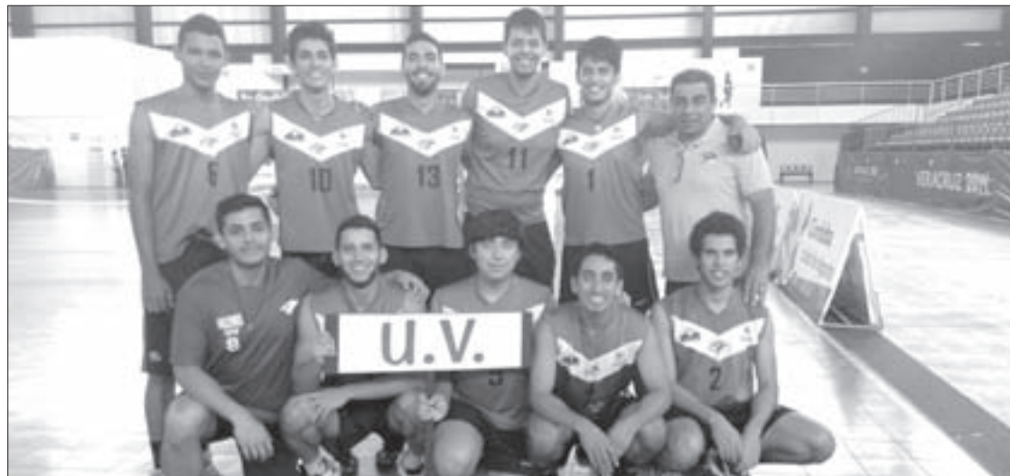
El torneo sirvió de preparación para el conjunto universitario

El evento sirvió de preparación para el conjunto emplumado, que se alista para competir en el Festival Deportivo Estatal de la UV, que se llevará a cabo en septiembre.