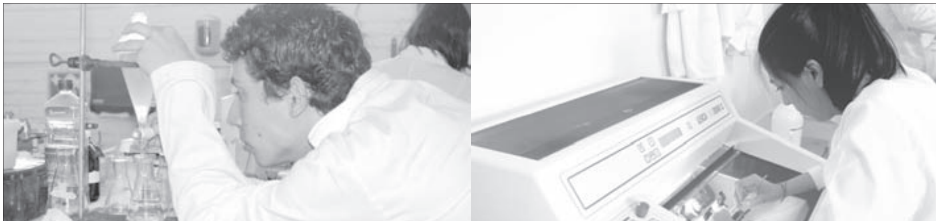
La Facultad forma profesionistas de alto nivel