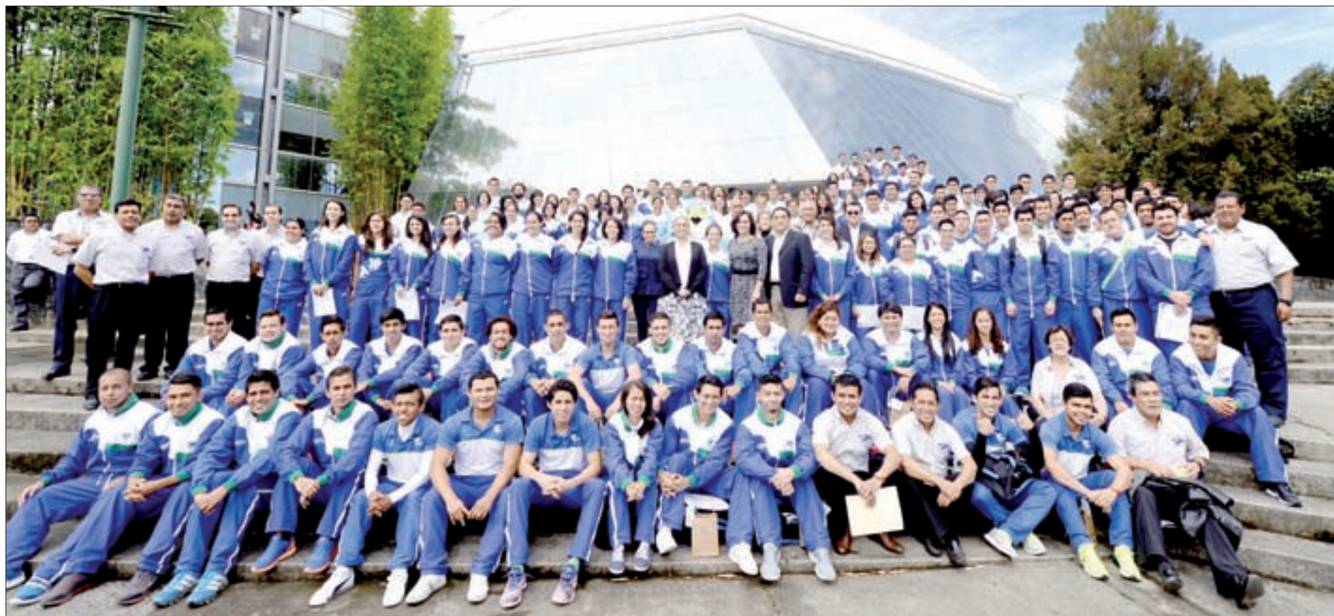
Un total de 174 estudiantes destacaron en la Universiada Nacional Nuevo León 2015

“Toda mi vida he sido deportista, incluso fui competidor y siempre me ha gustado el deporte; conocí esta disciplina en 2004 y me gustó mucho, me apasionó y empecé a tomar cursos de juez y de entrenamiento y me atrajo el reto. Una motivación importante es trabajar con los jóvenes porque te contagian su energía, esto fue lo que hizo que me aventara al ruedo, que enfrentara este reto de guiar al equipo”, detalló.