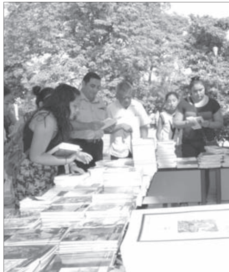
Estudiantes y público en general abarrotaron los módulos de venta

En la Facultad de Ciencias Biológicas y Agropecuarias desde temprana hora se instaló el módulo de venta, obteniendo una muy buena respuesta tanto de los universitarios como del público en general.