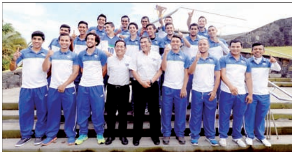
Selección de Fútbol Soccer