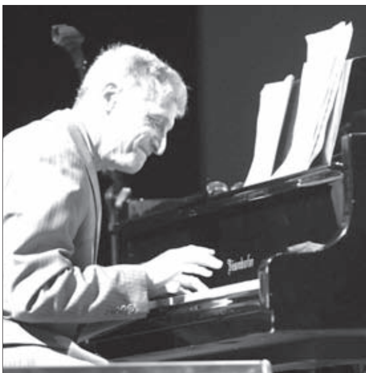
Las ediciones anteriores han presentado a grandes exponentes del género

Enfatizó la presencia del trío de Albert “Tootie” Heath y el grupo de Orlando “Maraca” Valle y sus Latin Allstars, con Giovanni Hidalgo, Steve Turre y Horacio “El Negro” Hernández entre sus integrantes.