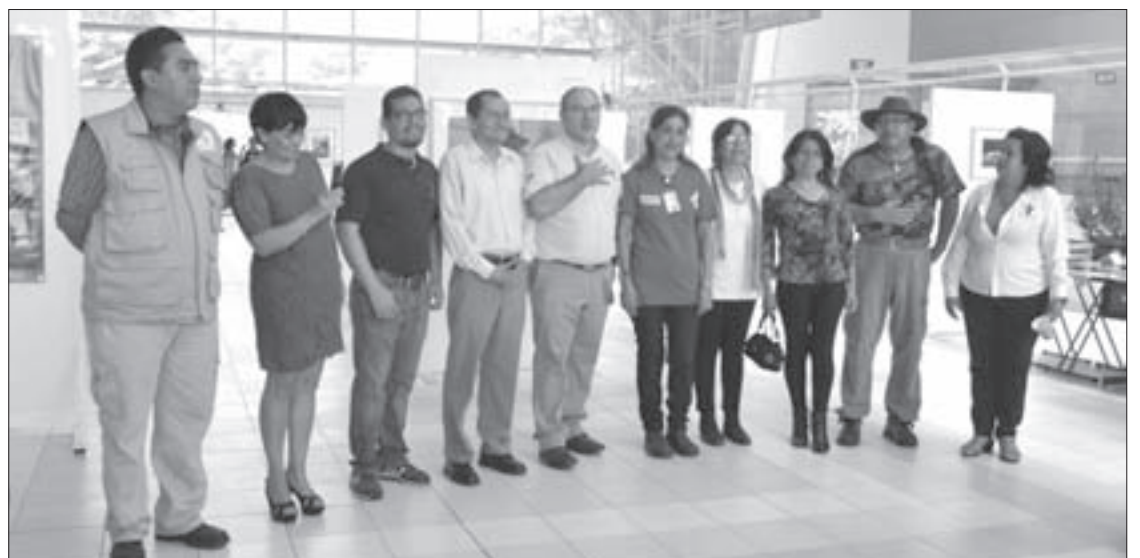
Coordinadores para la sustentabilidad de diferentes facultades durante la inauguración

Al respecto, es importante destacar que la sustentabilidad es un proceso complejo de varias dimensiones: ambiental, económica, social e incluso espiritual. La democracia, la justicia, la ética, el manejo integrado de recursos, la salud, el