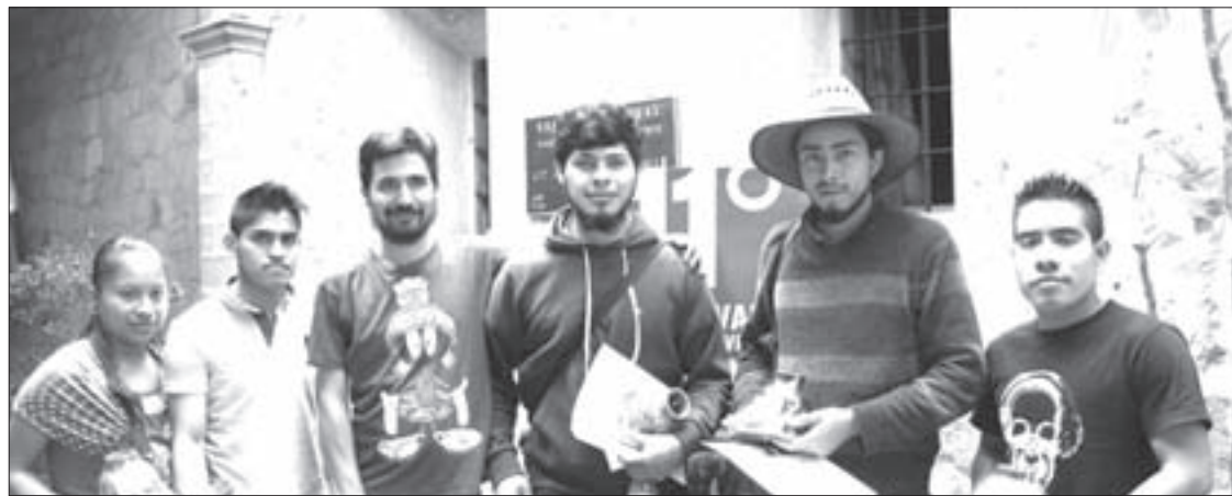
Equipo que intervino en el documental Xatapaxaw Tiyat

Por su parte, el equipo de producción de Xatapaxaw Tiyat trabaja en nuevos proyectos documentales. Uno de ellos, sobre la danza del Matalachín, se realiza en Espinal y otras comunidades de la región. Otro más aborda el tema de la migración en la sierra alta del Totonacapan.