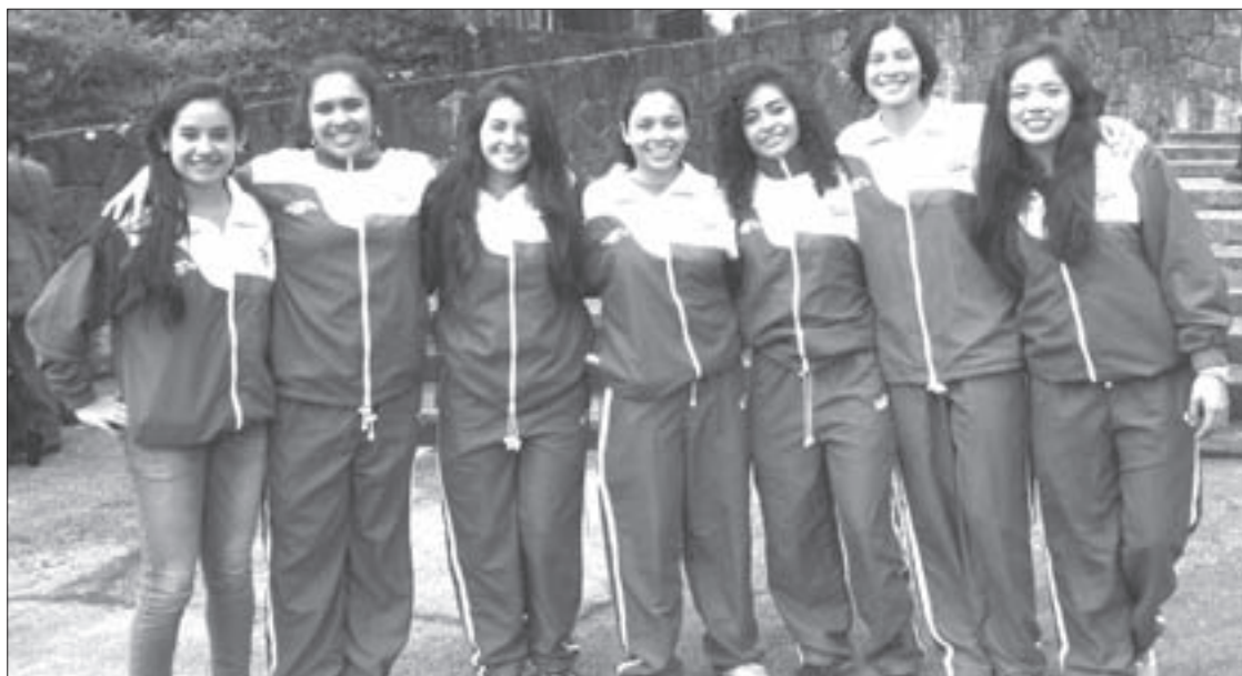
La Selección Femenil, lista para encarar la Temporada 2015-2016