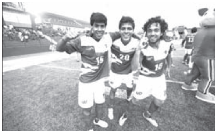
Los medallistas en la Universiada Nacional 2015 quieren ser protagonistas