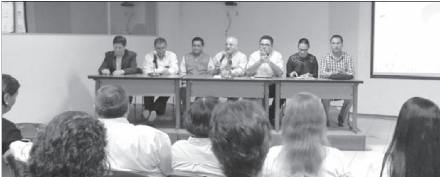
Funcionarios de la UV y Sesver subrayaron la importancia de la prevención