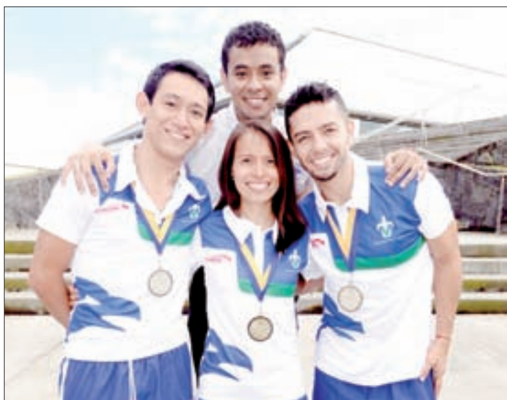
Integrantes del equipo de Gimnasia Aeróbica

Veracruzano de Voleibol y recién participamos en un evento celebrado en Córdoba, donde obtuvimos los mejores lugares, ello nos permite un fogeo que logra una mejor formación de los jóvenes en este camino del voleibol”.