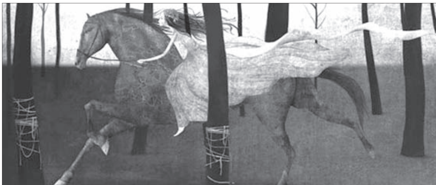
El dossier gráfico corrió a cargo de Gabriel Pacheco