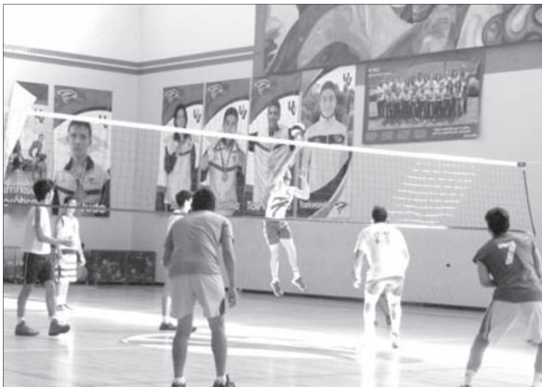
En la rama varonil participan ocho representativos

Para el viernes 4 de septiembre sólo hay un duelo, a las 17:00 horas, Psicología contra FIEMCAB (varonil).