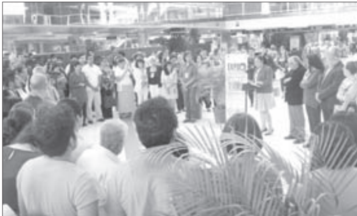
La Rectora inauguró la Expo Sustenta 2015

Dicho programa –que norma el quehacer cotidiano