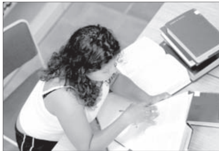
Ofrecen alrededor de 20 mil servicios por semestre

“Si algún libro es muy solicitado y no se encuentra en la biblioteca, puede pedirse a alguna de las 56 bibliotecas que integran el sistema y se hace el préstamo por 25 días.”