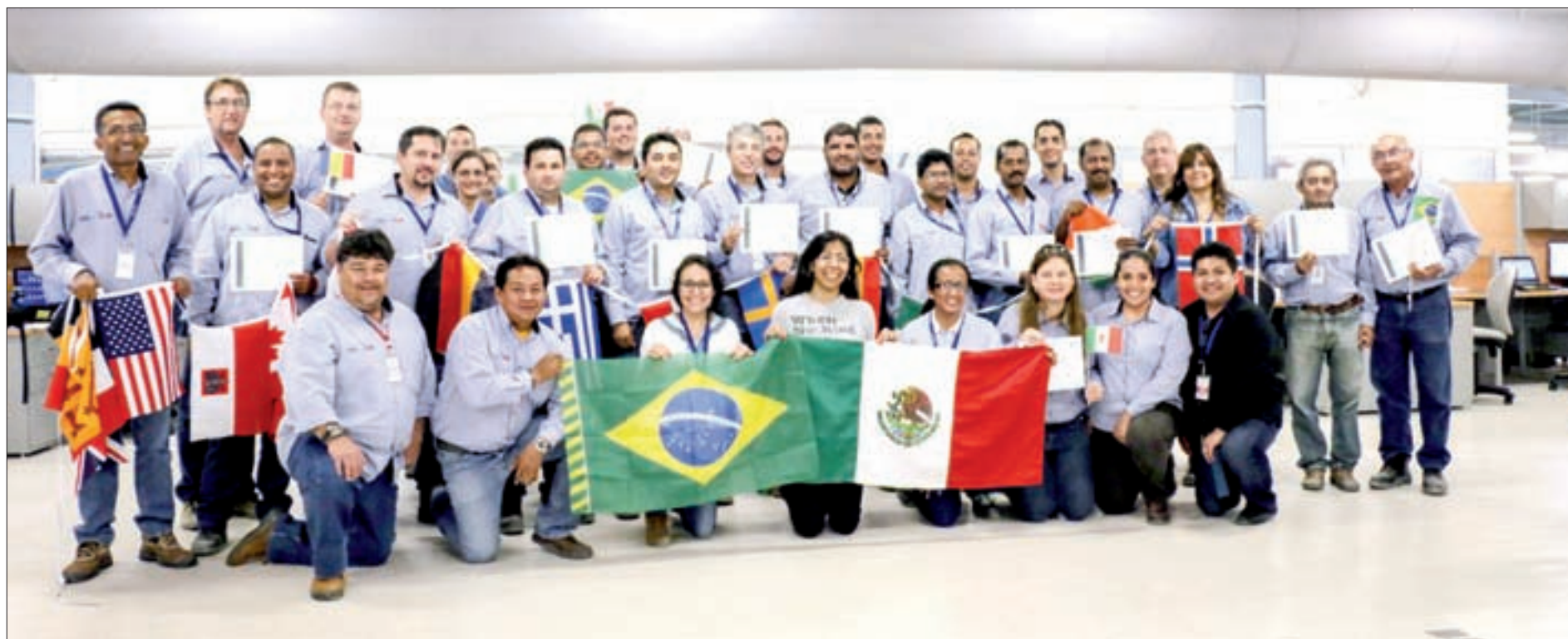
Estudiantes de español en Coatzacoalcos