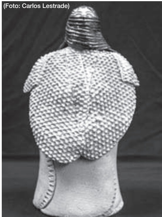
Pieza de la serie cerámica Las malqueridas