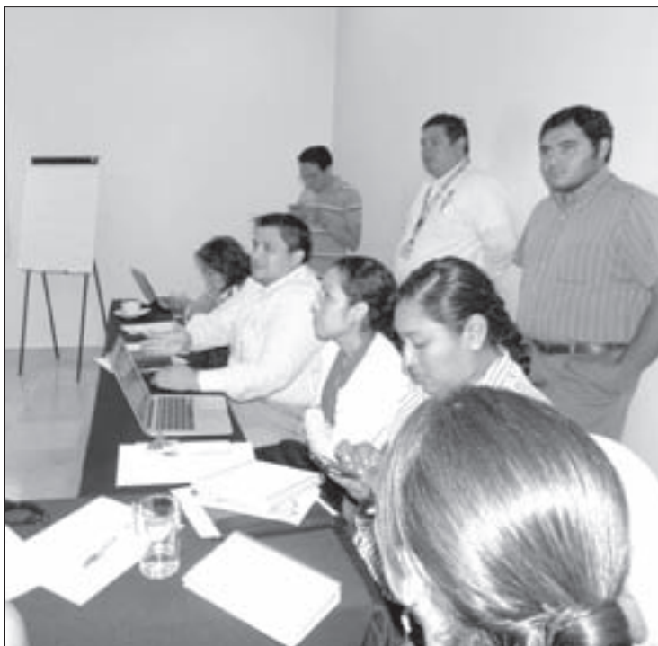
Académicos de la Facultad participan activamente en el proceso

"A los estudiantes les informamos qué es un proceso de reacreditación y el beneficio que obtienen de que el programa educativo que cursan esté acreditado, uno de los beneficios es que facilita su contratación e