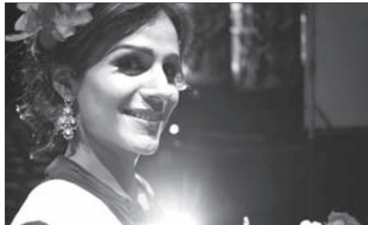
Imagen de Made in Bangkok , de Flavio Florencio

Curiosamente, la conexión de ambas tragedias se hace a través de dos botones: uno que sirvió para que un indígena viajara durante