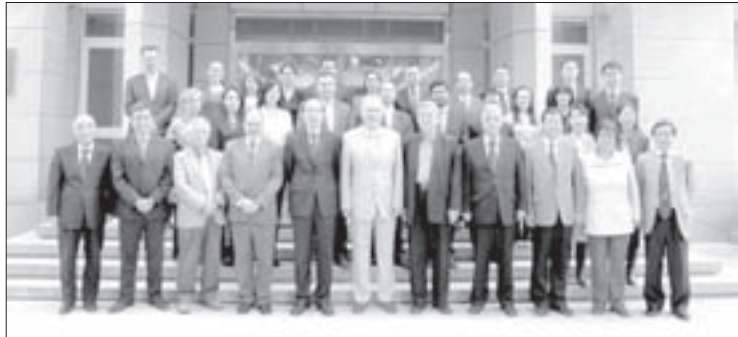
El IV seminario se realizó en Beijing, en 2014