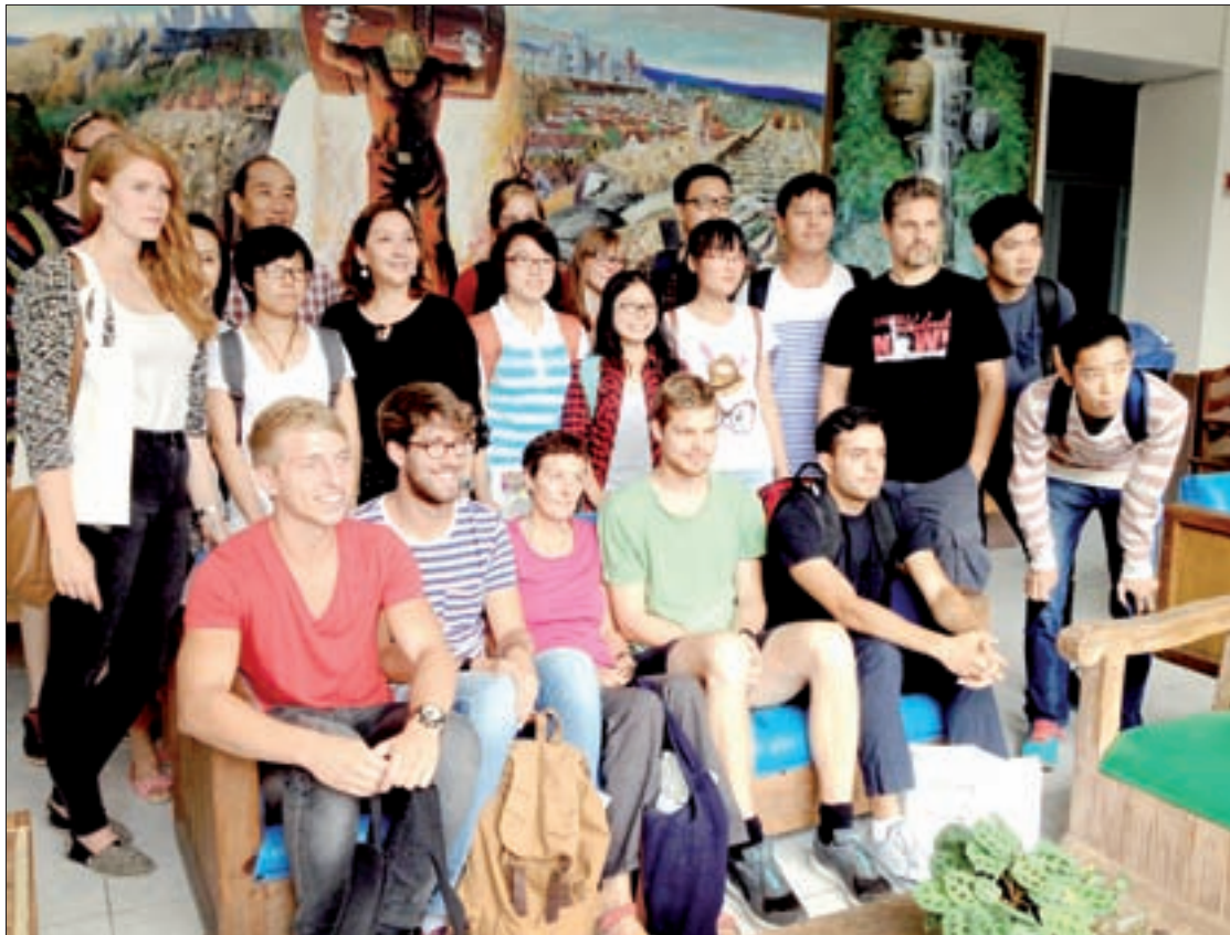
Grupo que cursará la temporada de otoño

Ambos cursos fueron organizados por la EEE en colaboración con el cuerpo académico Las Lenguas Extranjeras