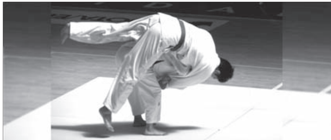
La competencia fue organizada por el Club de Boca del Río