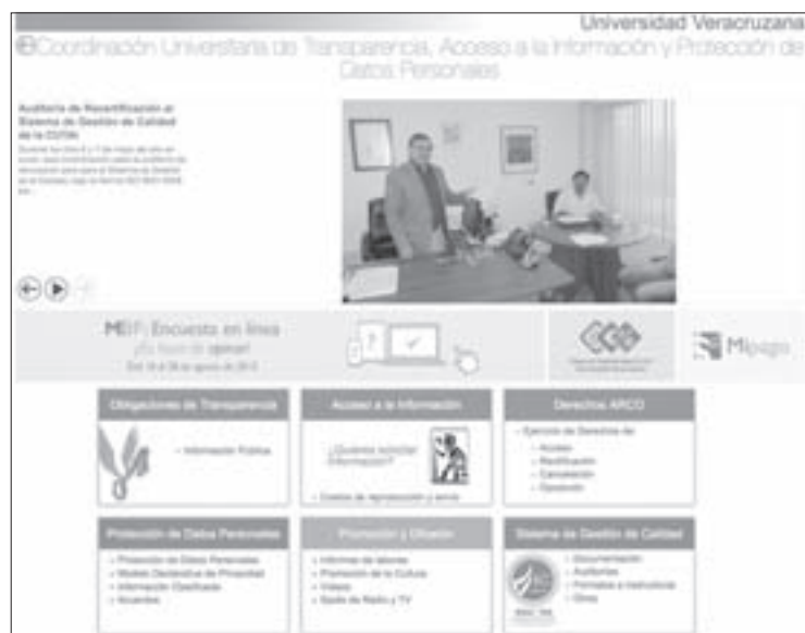
El portal de la CUTAI ha obtenido la máxima calificación otorgada por el IVAI