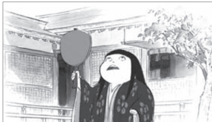
Fotograma de La princesa Kaguya , de Isao Takahata

La actividad concluye el domingo 30 con Los bañistas (2014) de Max Zunino y cuyo país de origen es México. El filme narra la relación entre Flavia, una adolescente mimada