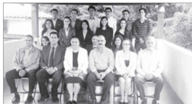
Autoridades de la UV, del Congreso del Estado y empresarios con los beneficiados

Cabe recordar que el programa “Jóvenes de Excelencia Banamex ” tiene por objetivo apoyar a estudiantes sobresalientes de las instituciones de educación superior del país, a través de un proceso de acompañamiento