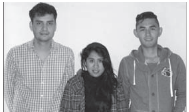
Los jóvenes acudirán a universidades de España, Italia y República Checa

En los últimos dos años la UV ha sido invitada a participar en al menos 12 consorcios del programa. Para el periodo 2014 al 2017 se han