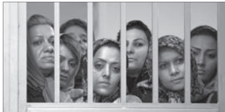
El viernes 28 se proyectará Relatos iraníes , de Rakhshan Bani-E'temad

y con aspiraciones artísticas, frustrada porque no fue aceptada en la universidad, y su vecino Martín, un hombre maduro e inflexible.