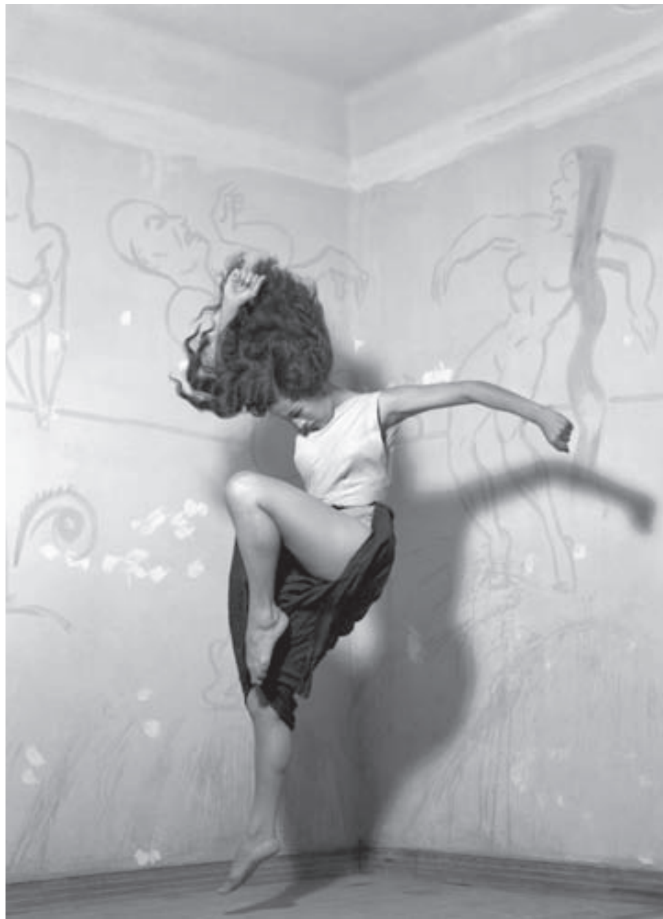
La bailarina retratada por Nacho López

En ese año fue nombrada maestra y bailarina de la Academia de la Danza Mexicana, donde bailó El pájaro y las doncellas , La luna y el venado , Norte , La manda , Tzócatl , El sueño y la presencia , La poseída , Fecundidad , El renacuajo