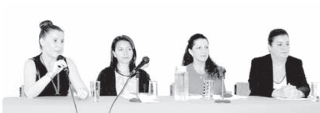
Académicas presentaron Derecho y gestión del agua

Recordó que en 2012 se introdujo en la Constitución Mexicana el derecho humano al agua: "Somos un país pionero en este sentido, ahora el gran reto es adaptar la legislación al derecho humano". Comentó que durante el presente año fue discutida una iniciativa de Ley General de Agua,