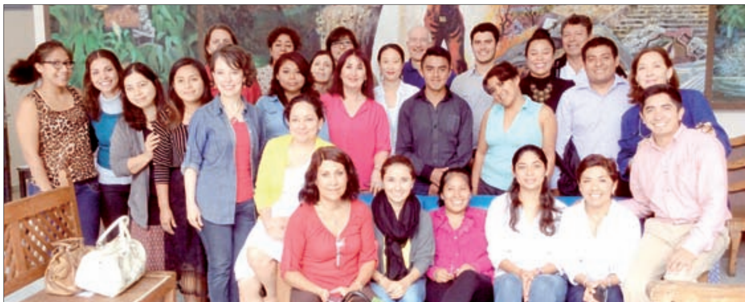
Jóvenes de siete estados, con Keith Richards

Cabe citar que el PEAN imparte seis experiencias