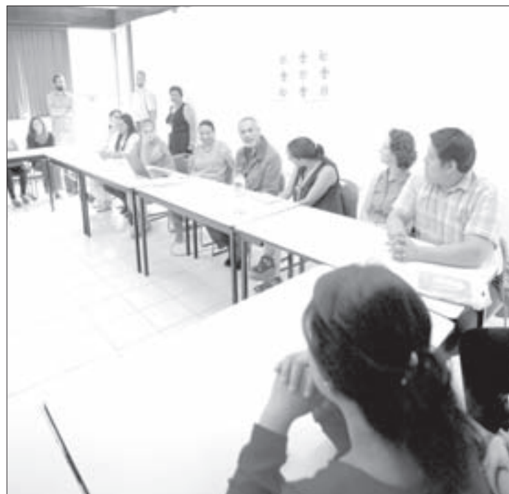
La bienvenida a la nueva generación se efectuó el 17 de agosto

El objetivo de ambos posgrados es formar profesionistas con capacidad para desarrollar investigación original e innovadora, con altos niveles de calidad académica en los campos de la psicología clínica psicoanalítica, psicología de la salud y psicología social comunitaria, con ética y compromiso social.