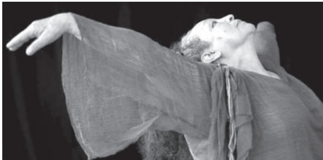
Para la bailarina, la vida era un placer y la danza era un medio de expresarlo