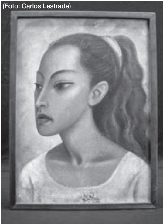
Ilustración de Miguel Covarrubias