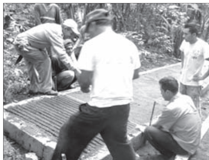
Universitarios y cafeticultores durante el estudio de campo

“Para que se entienda mejor esta contribución, se ha dotado