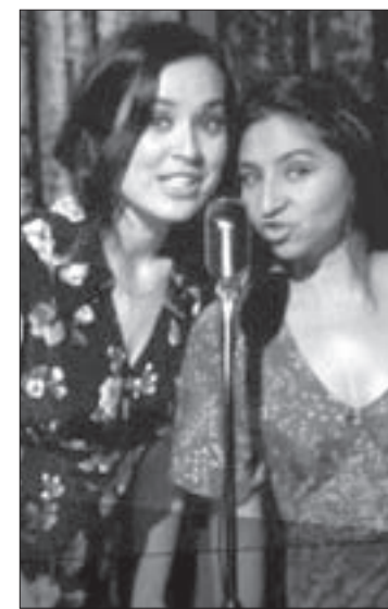
Escena de La Audición

Al día siguiente, a las 20:00 horas, la Compañía Contrael viento, originaria de Ecuador, ofrecerá en el Teatro del Estado la puesta en escena Al final de la noche .