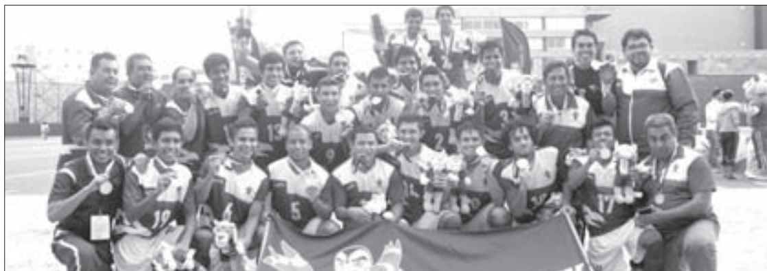
La Selección de Fútbol Soccer, entre los medallistas

El siguiente reto para los Halcones es la Universiada Nacional Guadalajara 2016, para lo cual inicia la etapa de preparación con la celebración del Festival Estatal Universitario, programado para septiembre próximo.