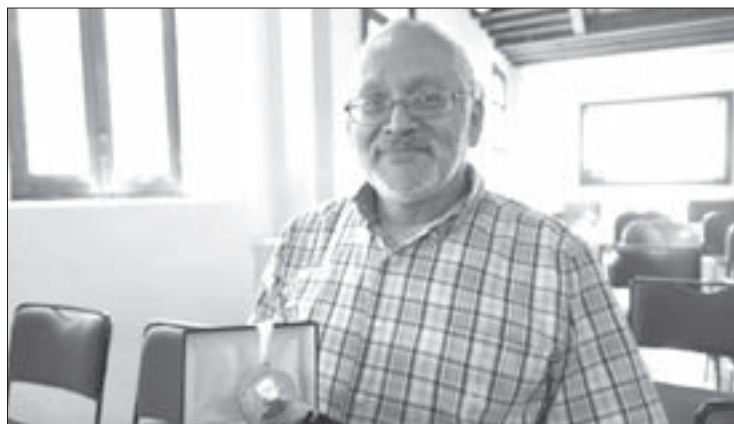
Fue condecorado con la Medalla “Gonzalo Aguirre Beltrán”