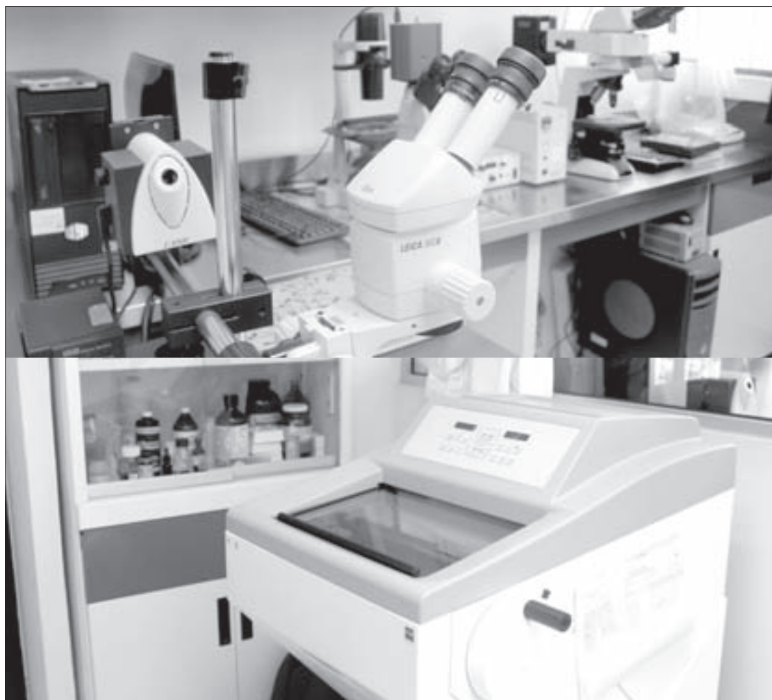
Cuenta con tecnología de punta para el análisis de células

experiencia práctica en el cultivo de células, dio a conocer que esta última estrategia tiene menos efectos secundarios para la persona, toda vez que el compuesto citotóxico daña a la población cancerosa, así como al resto de las células.