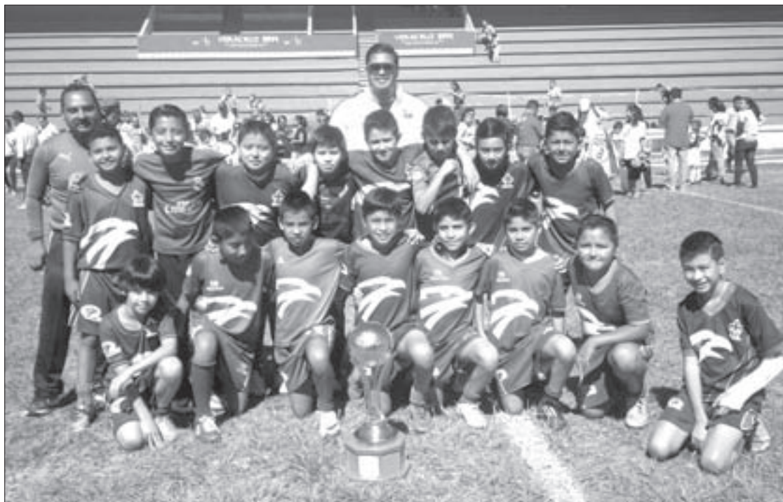
Satisfechos, tras recibir el trofeo

Éste es un logro más para la Escuela de Halcones UV, que cuenta con más de 200 alumnos en diferentes categorías y que entrena de lunes a viernes de 16:00 a 18:00 horas, en la Unidad Deportiva Universitaria.