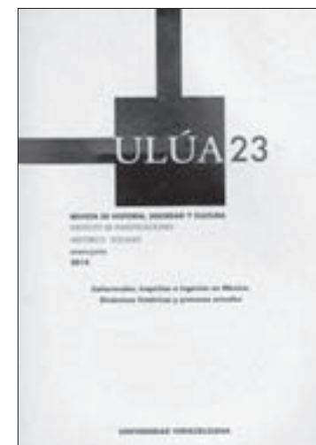
Es una publicación del IIH-S