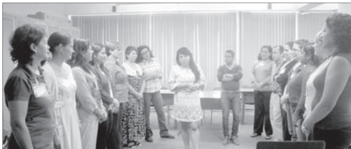
El objetivo del curso es fortalecer la perspectiva de género en la institución

La asociación Desarrollo Autogestionario imparte curso a funcionarios universitarios