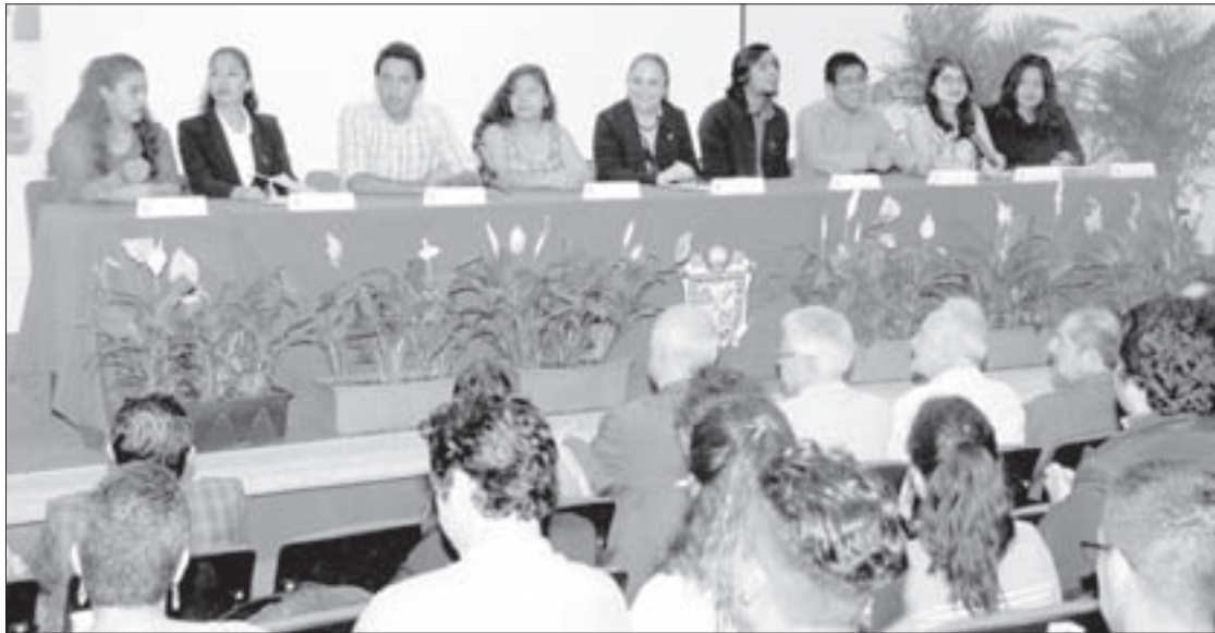
La Rectora celebró la realización del evento

Enfatizó que gracias a sus labores de gestión en conjunto con la Secretaría Académica y la Coordinación de Asuntos