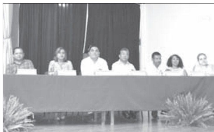
Autoridades universitarias y gubernamentales en la inauguración

En dicha actividad se discutió el origen de las Misiones Culturales,