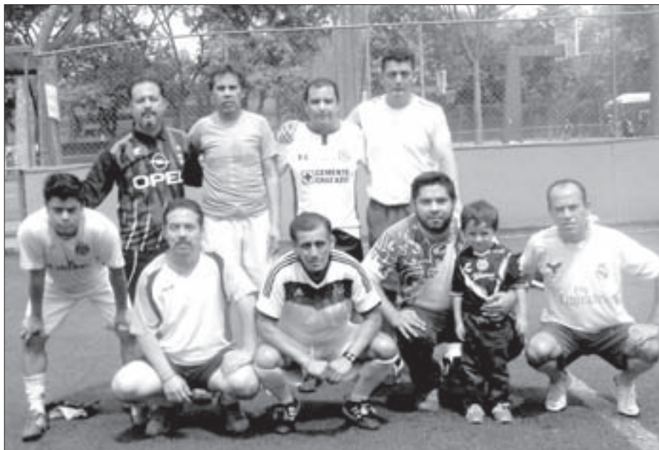
El equipo campeón