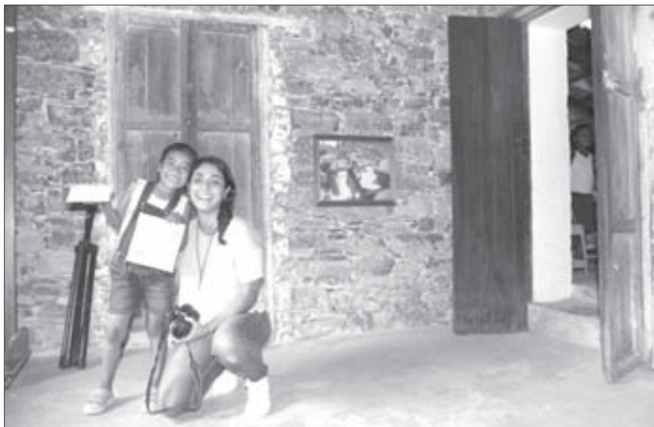
Los universitarios compartieron sus saberes con niños