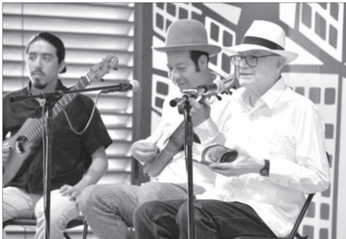
El homenajeado leyó algunas coplas de su autoría