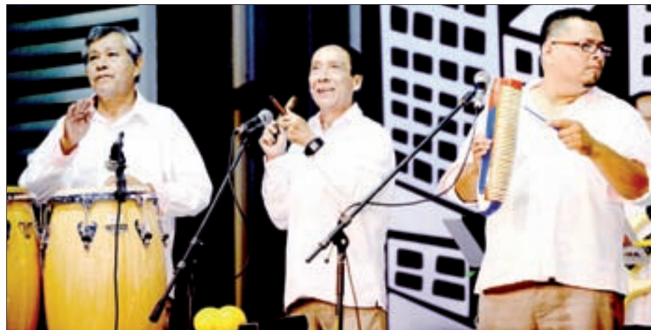
Grupos artísticos amenizaron la feria

Mientras el público realizaba las últimas compras y en algunos stands ya eran selladas las cajas de libros, la Orquesta de Salsa de la UV amenizó el cierre de esta fiesta editorial, que celebrará sus primeros 25 años en 2018. Además, en el Teatro del Estado se desarrolló el magno concierto de clausura, a cargo de la cantante Ximena Sariñana e integrantes del Centro de Estudios de Jazz (Jazzuv).