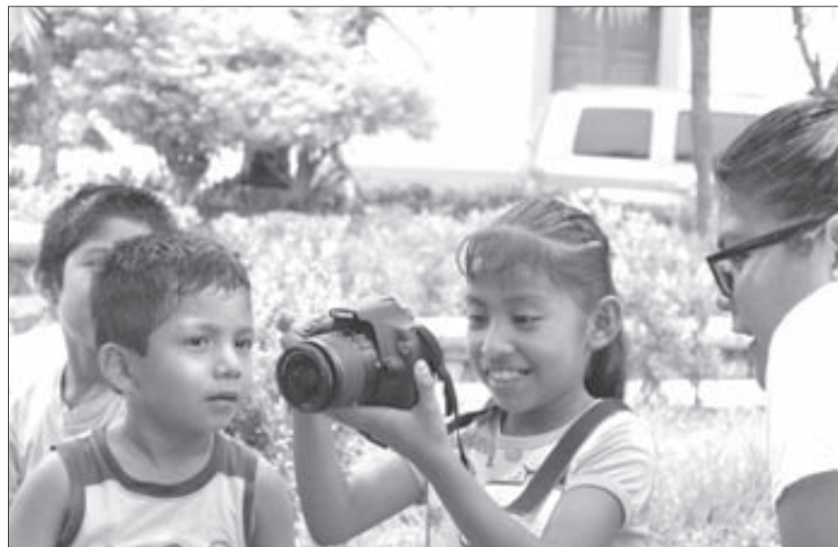
Taller infantil de fotografía “Jugando con luz”

Ofrecieron talleres de fotografía para niños, de libretas artesanales, de iniciación al grabado y una dinámica artística de periódico mural de emociones