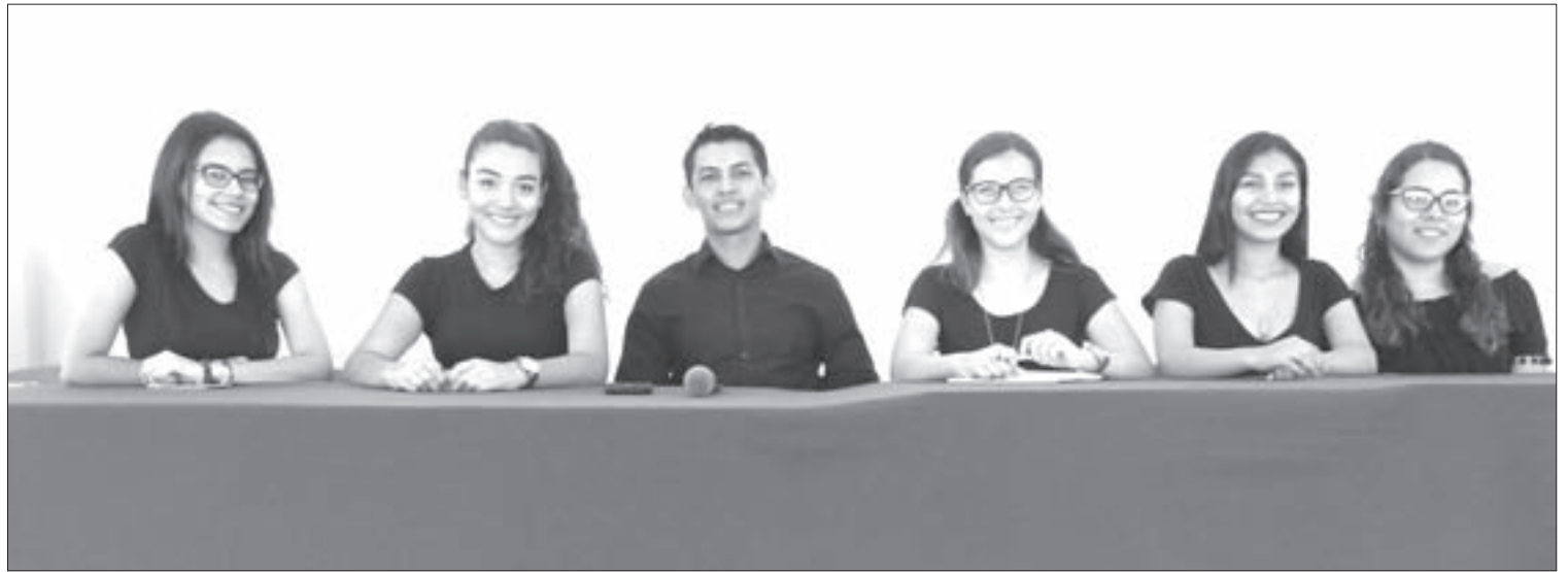
Es organizado por alumnos de Gestión y Dirección de Negocios

En este contexto los universitarios hacen un llamado a la