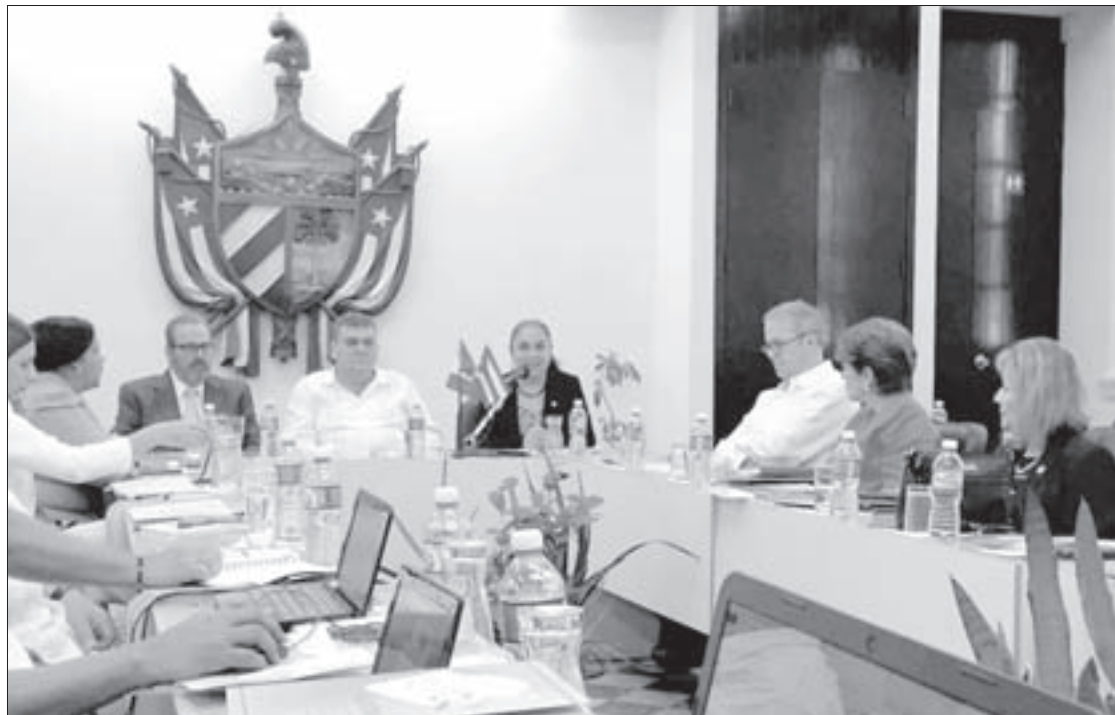
La Rectora participó en el Seminario Académico de la Universidad de La Habana