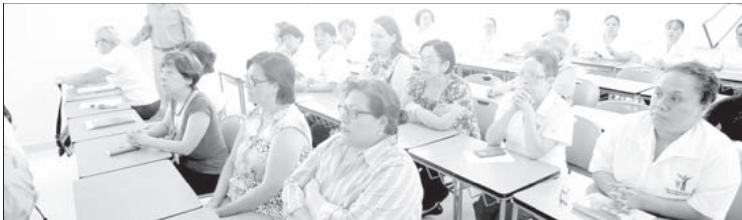
Personal de la clínica en el curso-taller Introducción a la Interculturalidad