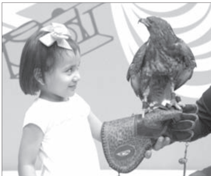
Exhibición de aves a cargo del grupo Vida Verde