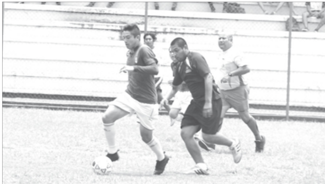
Pedagogía y Antropología protagonizaron el partido inaugural