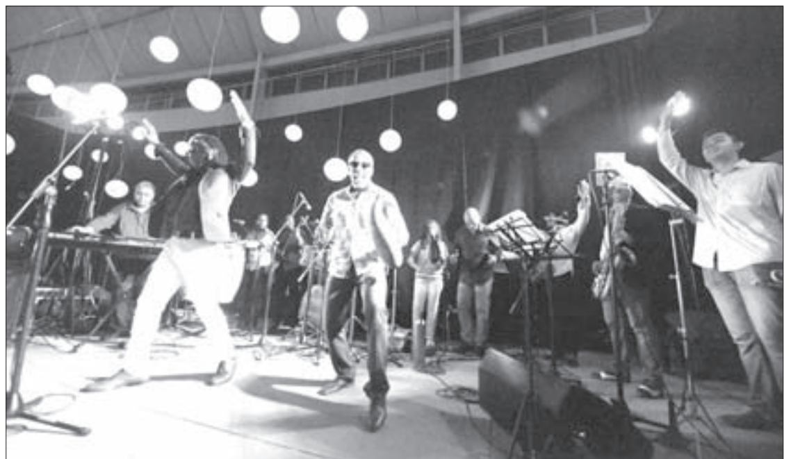
El festival es ya una tradición en Xalapa