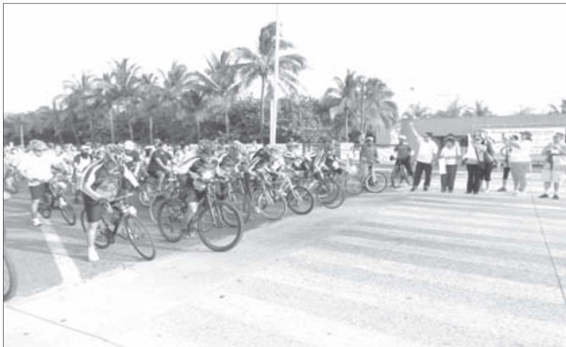
La salida fue en el campus Mocambo