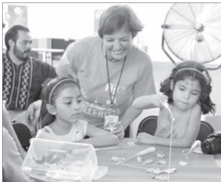
Taller Let's make an aquarium

Aportaron datos interesantes sobre estas especies y explicaron el proceso de rescate del grupo, que cuida de ejemplares en peligro de extinción hasta que estén en posibilidades de reproducirse y ser liberados. Al final de la charla, los pequeños pudieron ver, tocar y tomarse una fotografía con las aves.