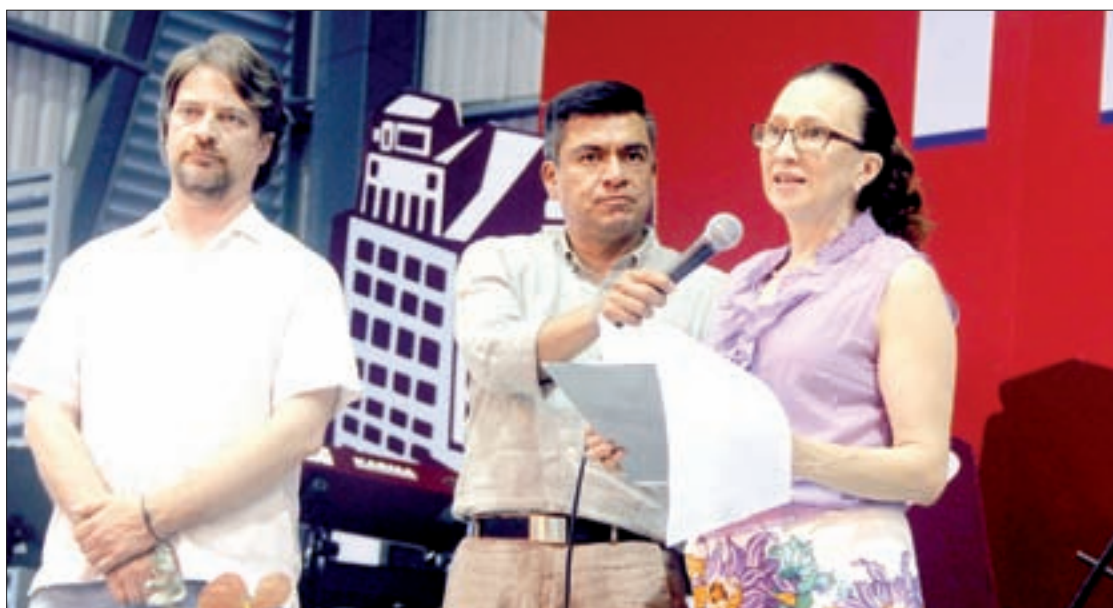
La Secretaria Académica clausuró el evento

aqueja a la sociedad en general. Aún así, tuvieron ventas aceptables en libros de variadas disciplinas como filosofía, literatura y economía.