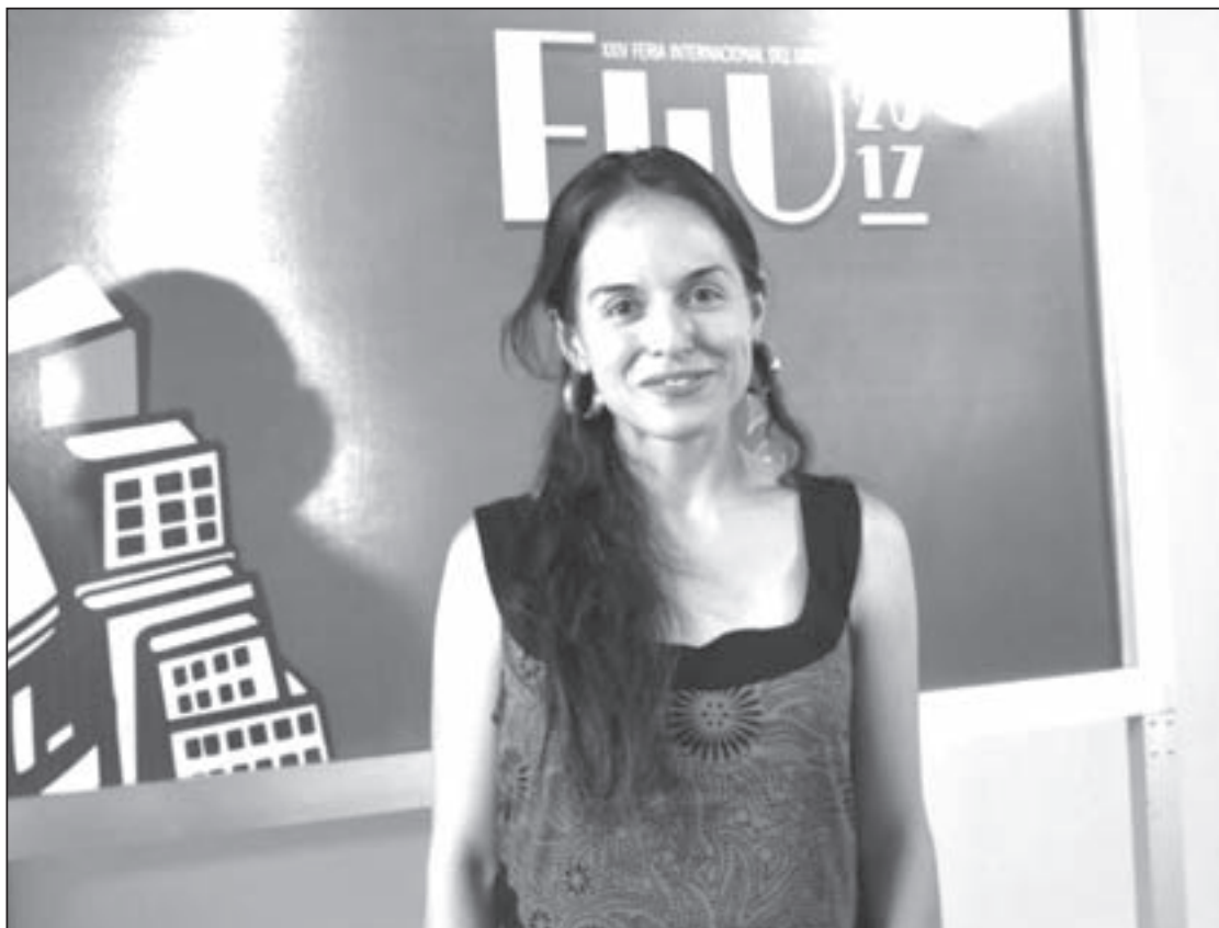
La poeta y traductora presentó su libro Amalgama Conflations

Ante el público que asistió a presenciar la muestra de su obra, conformada por poemas de corto