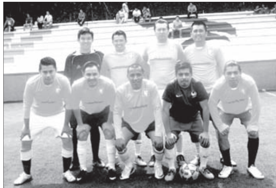
Telefonía, digno subcampeón