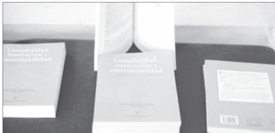
Presentaron el libro Complejidad, innovación y sustentabilidad. Experiencias educativas