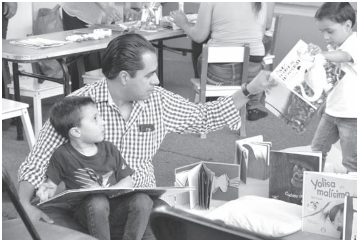
Padres entusiasmados acompañaron a sus hijos

Del 21 al 30 de abril se ofrecieron interesantes talleres