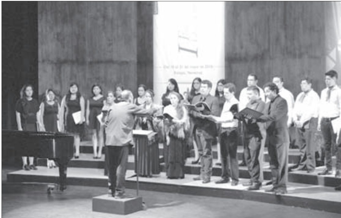
Participarán agrupaciones de las cinco regiones universitarias

Se trata de una excelente oportunidad para universitarios y personal de las distintas