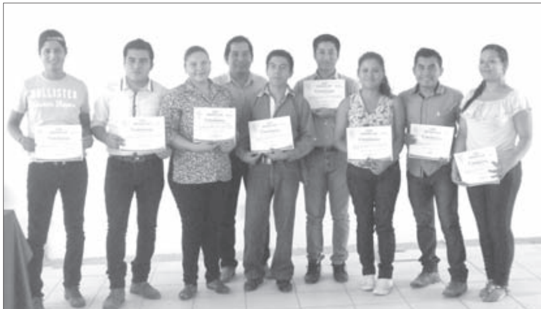
Participaron alumnos de la sede Totonacapan

El curso, impartido el 21 de abril, fue parte del acuerdo de colaboración entre la UVI y el Centro de Extensionismo e Innovación Rural Sureste adscrito a la Universidad Juárez Autónoma de Tabasco, el cual inició en octubre de 2016 y concluyó con la presentación de la agenda de innovaciones para la mejora competitiva de la cadena productiva de la naranja en el municipio de Espinal, además de las ideas de negocios que presentaron tres equipos de trabajo que se conformaron para el análisis de la cadena y los procesos de