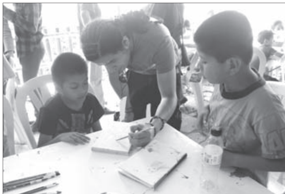
Elaboración de libretas artesanales