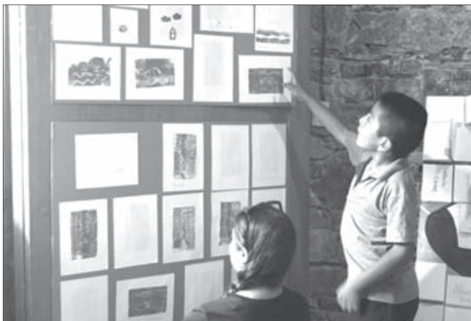
Taller de iniciación al grabado

Para su realización se contó con el apoyo de la Dirección General de Desarrollo Académico e Innovación Educativa y se trabajó en vinculación con la Universidad Veracruzana Intercultural (UVI).