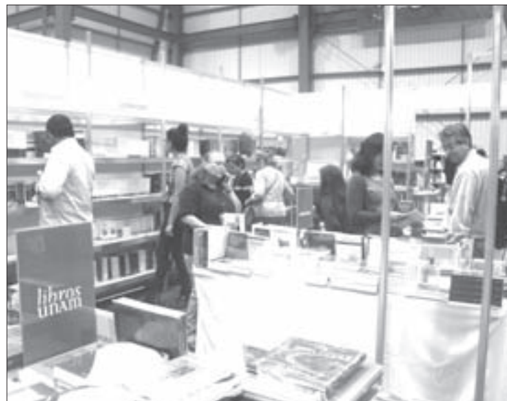
La feria registró buena asistencia