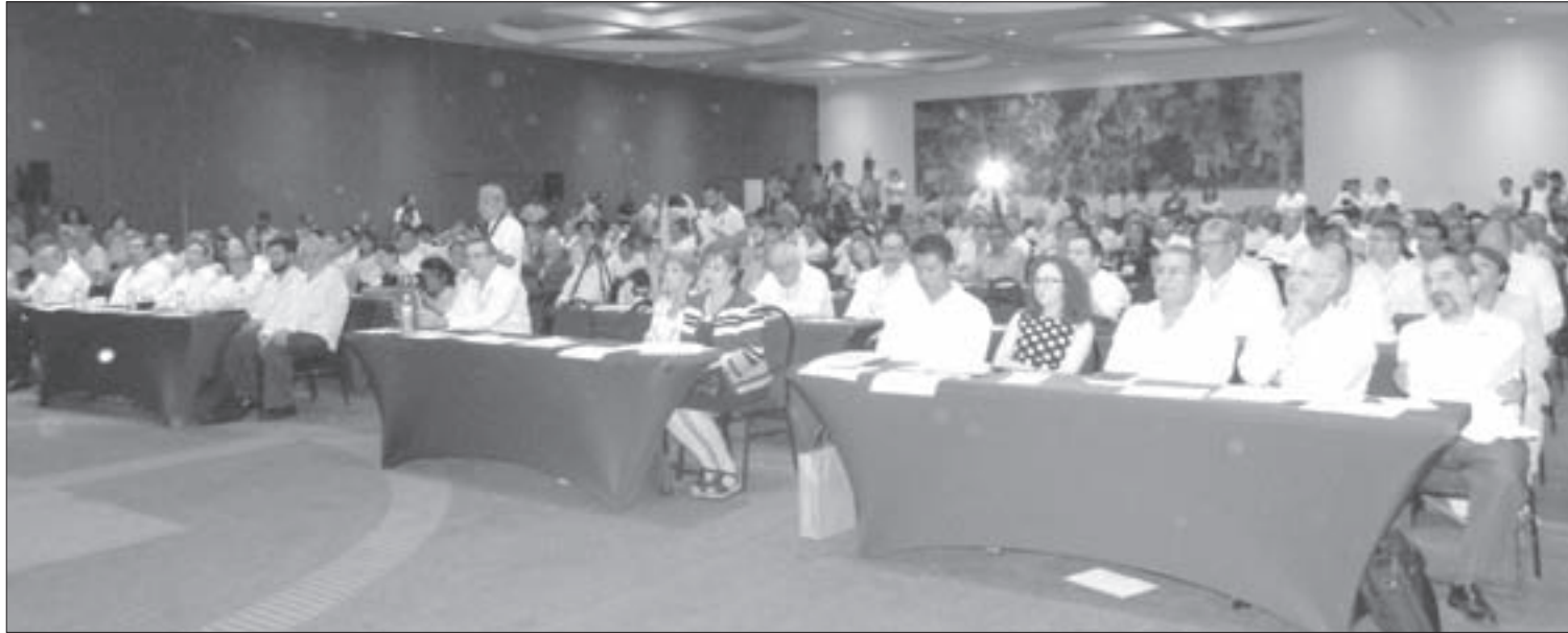
La asociación celebró su LX Reunión Nacional Ordinaria