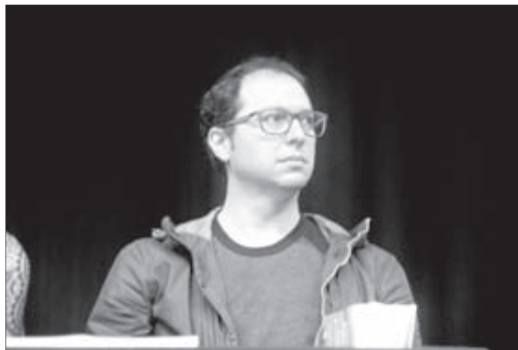
El diseñador participó en el Macrotaller Objeto Comex

El universitario mencionó que en este proceso adquirió mucho conocimiento pues pudo jugar con errores, hecho que le sirve para crecer como persona y futuro arquitecto.