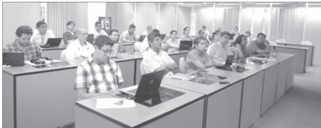
El taller fue organizado por la Dirección General de Vinculación