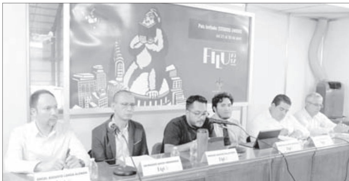
Mesa 5 del Foro Académico “Las humanidades en el siglo XXI”