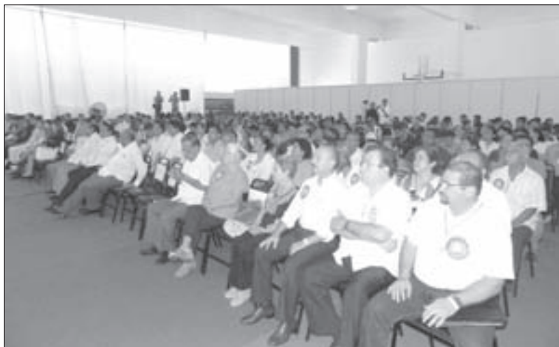
La Facultad realizó el Tercer Congreso Internacional de Educación Física y Salud

Como parte del festejo del aniversario se presentó una reseña de la Facultad, se entregaron reconocimientos a ex directores y se brindó un minuto de aplausos para quienes ya fallecieron.