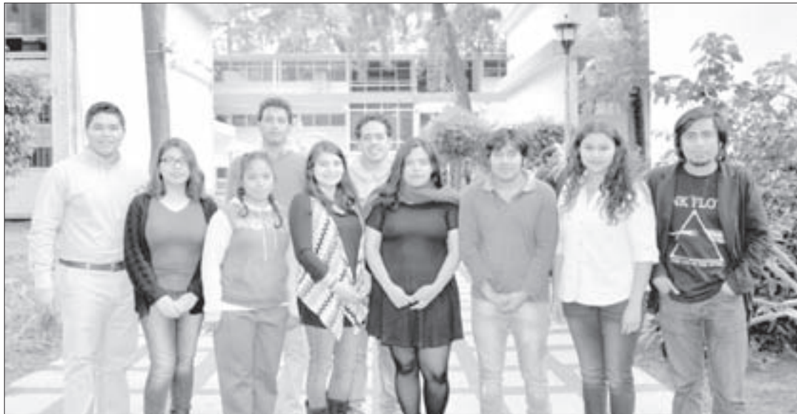
La actividad es organizada por consejeros alumnos

Habrán mesas de diálogo y un espacio de reflexión sobre el centenario de la Constitución Política de 1917