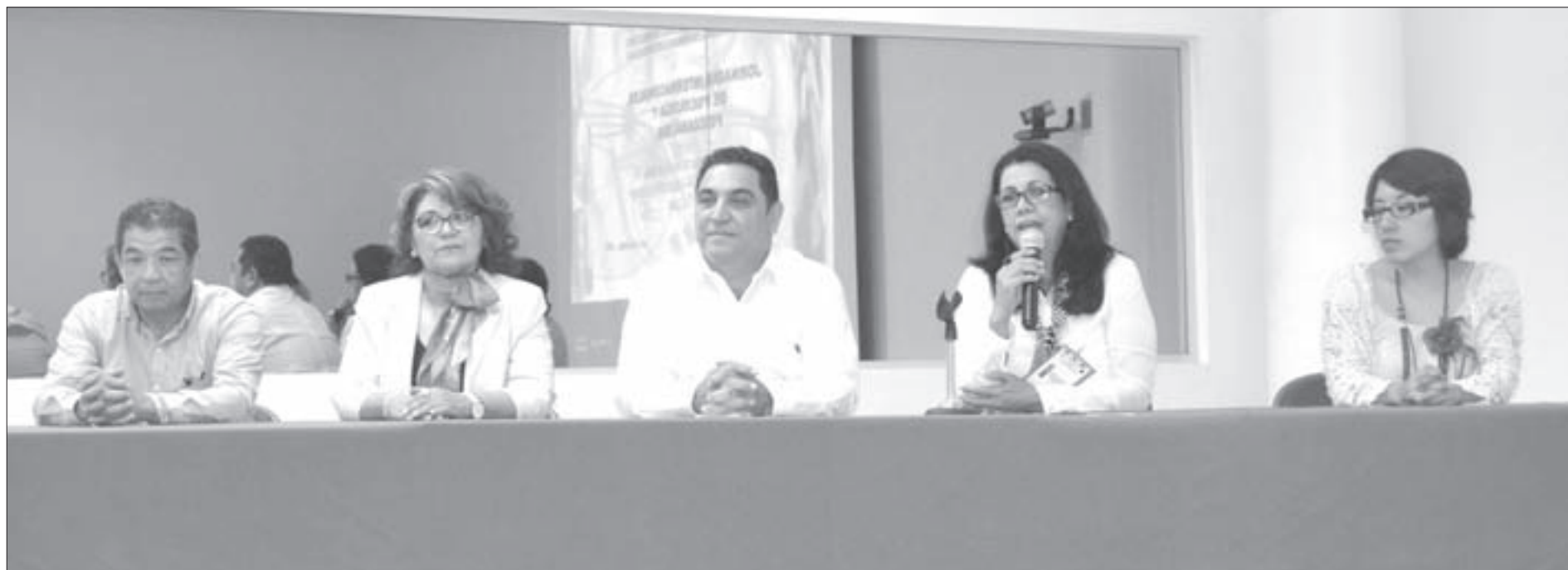
Autoridades regionales inauguraron las jornadas