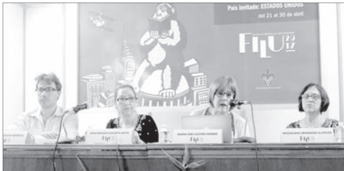
Participantes de la mesa “El español del siglo XXI”

Otro elemento a considerar debe ser el desarrollo académico porque en Estados Unidos se tiene