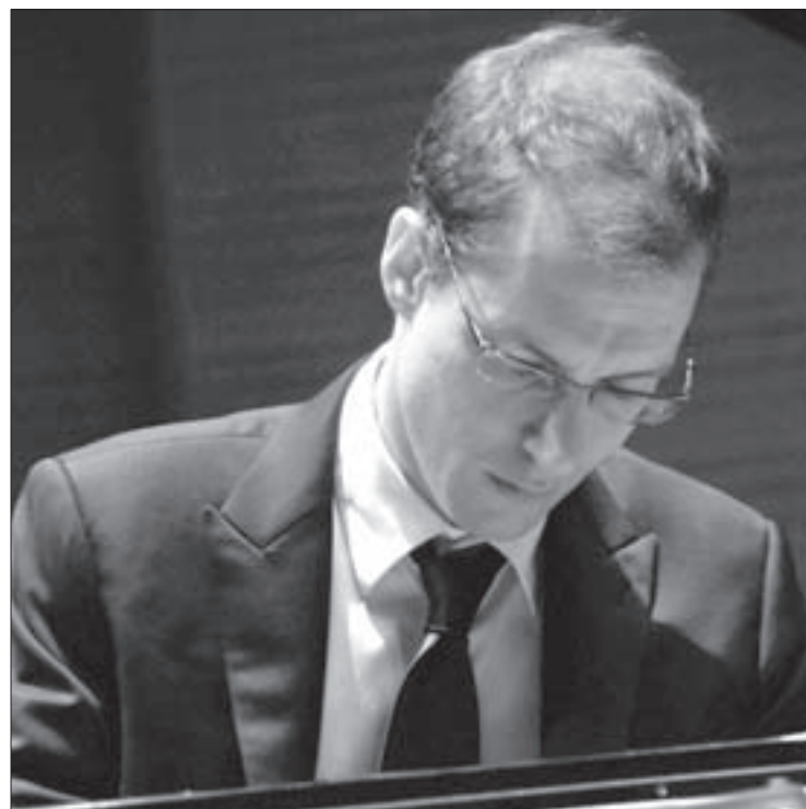
El pianista Gilles Vonsattel

Para este acontecimiento el costo de los boletos será de 120 y 80 pesos, con precio especial (30 pesos) para estudiantes con credencial vigente. Para más información, sugerimos consultar la página www.orchestrasinfonicadexalapa.com