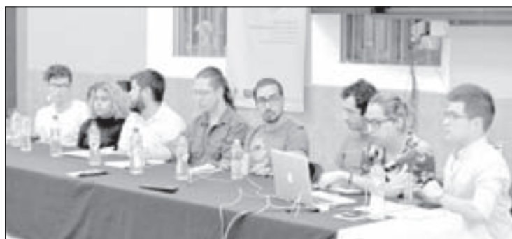
Participaron alumnos de la UV y la UAEMEX

Por medio de este proyecto el joven archivará experiencias