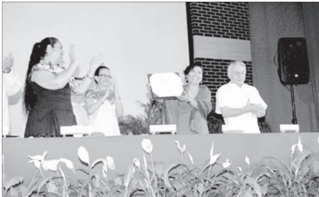
La acreditación tiene vigencia hasta el 30 de marzo de 2022

En el rubro de personal docente, la instancia cuenta con académicos calificados; en el apartado