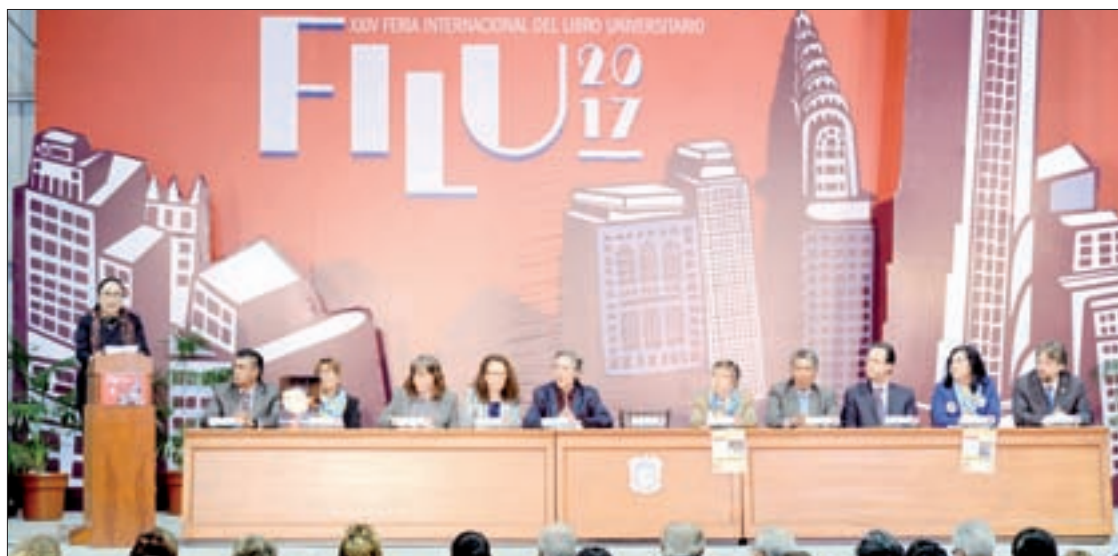
La Rectora y autoridades de la institución presidieron las ceremonias