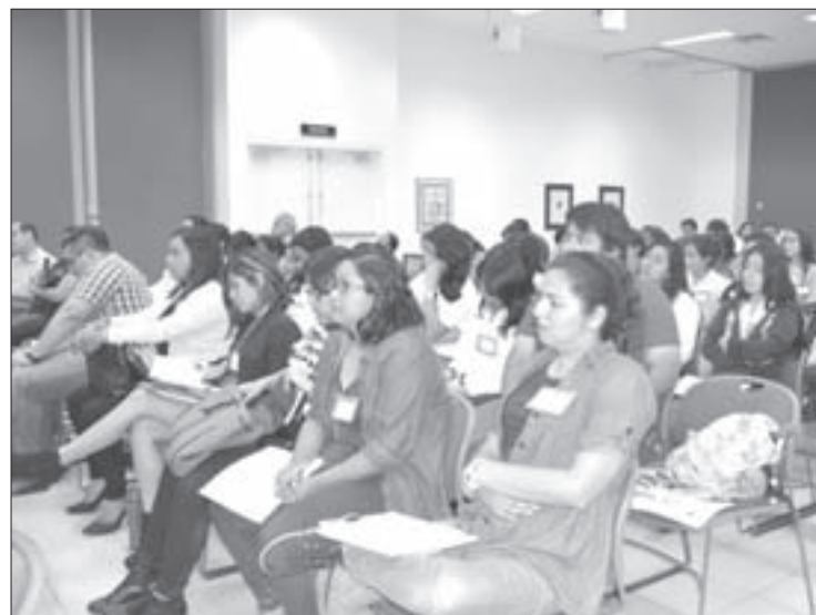
Acudieron estudiantes, egresados y académicos de Psicología