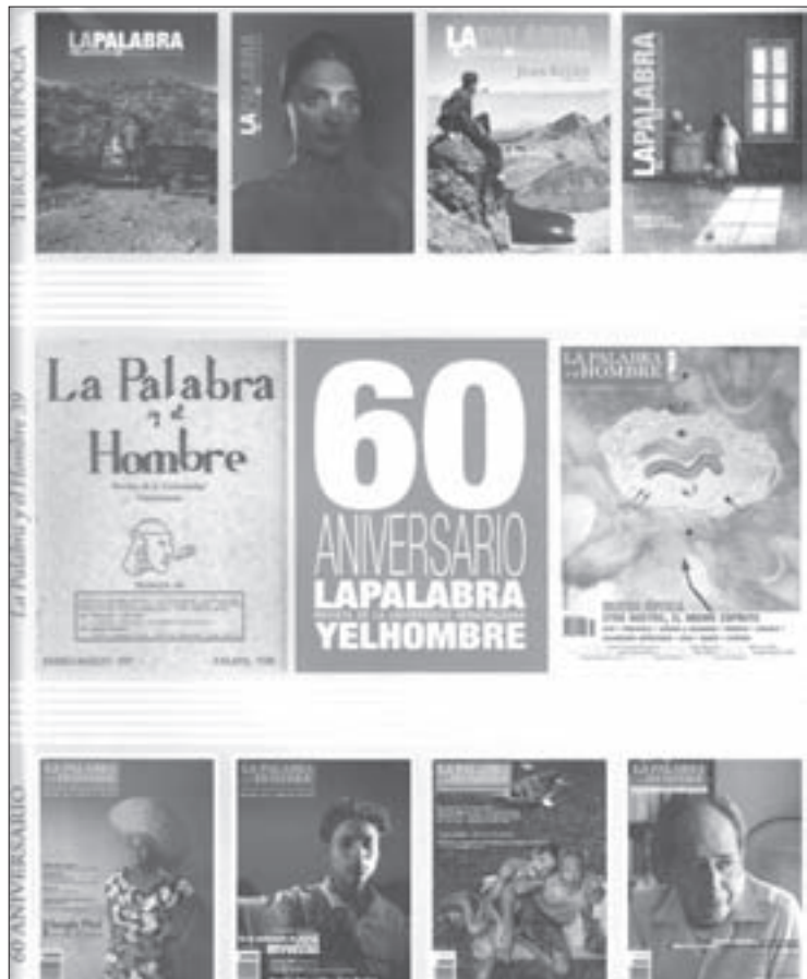
Portada del número 39