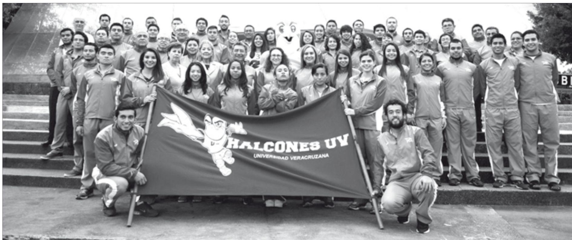
Los integrantes de Halcones con autoridades de la institución

El evento cerró con la fotografía del recuerdo, en la explanada de la USBI.