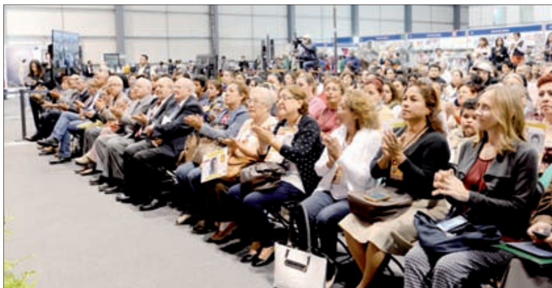
La comunidad universitaria abarrotó el Foro "Sergio Galindo"