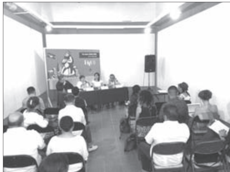
En la FILU se realizó el Primer Foro de Periodismo Cultural