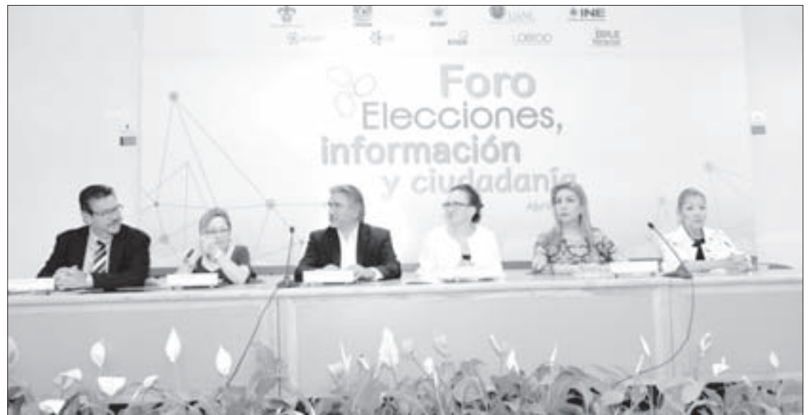
Autoridades universitarias inauguraron el foro

Finalmente, en los países de democracia más desarrollada se da el caso de que los votantes recuerdan al candidato local por el que votaron recientemente. “Esos ciudadanos tienen buena calidad de información”, remató. “Creen, piensan, opinan y conocen; en lo mismo está nuestra responsabilidad de aportar para que se dé una generación de votantes que eleven la calidad de la participación ciudadana y, en consecuencia, la calidad de nuestra democracia”.