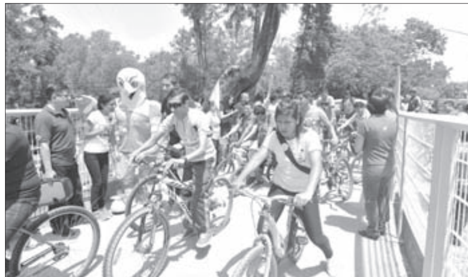
Participaron alumnos de diversas facultades

La Facultad de Contaduría y Administración organizó el evento como parte de la Semana de Vinculación