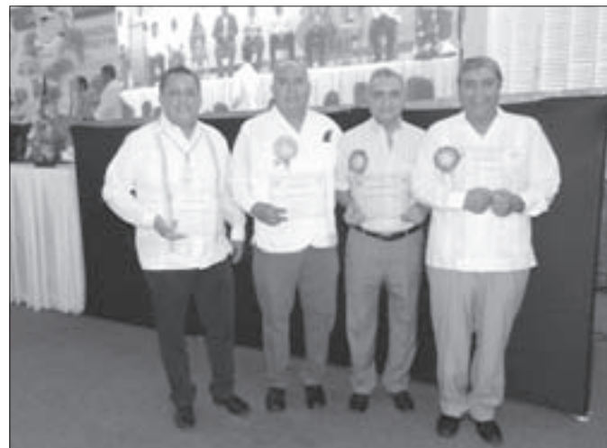
La comunidad reconoció a ex directores