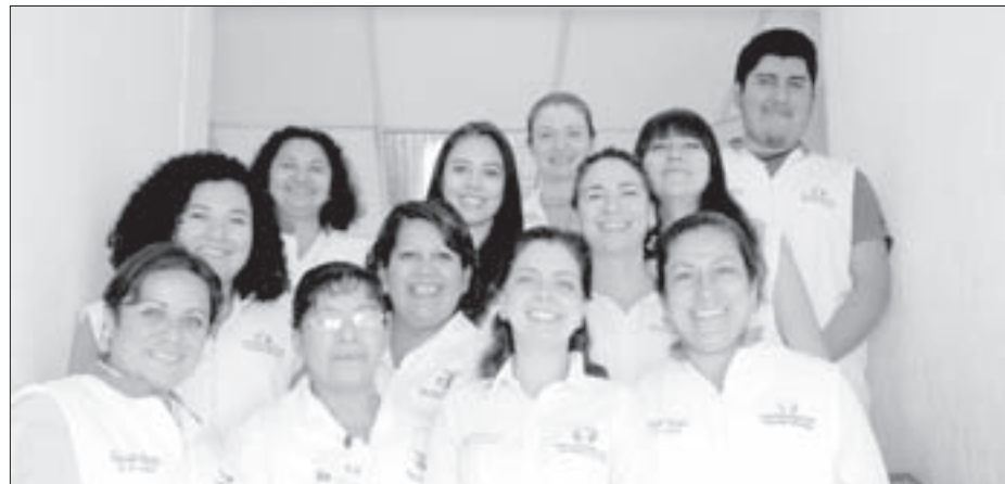
Participan gestores de salud, nutriólogos, enfermeras y prestadores de servicio social