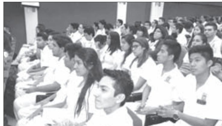
La matrícula actual es de 734 alumnos

Desde sus inicios, en 1952, han egresado más de 10 mil médicos