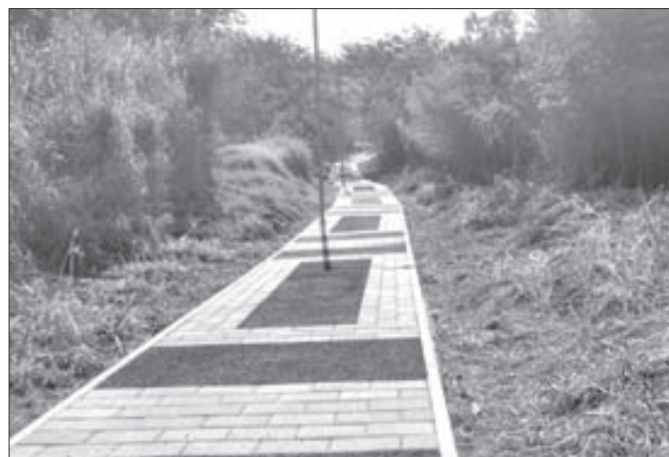
La obra es de concreto ecológico y tiene 19 luminarias