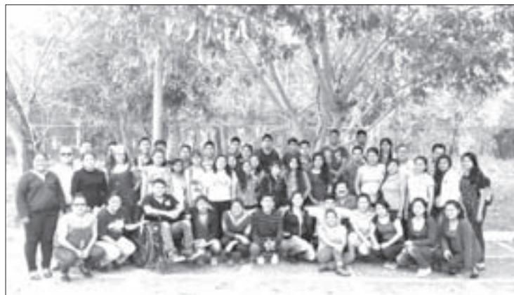
El historiador con la comunidad de la UVI Las Selvas

“La historia es un elemento que nos ayuda para saber hacia dónde nos dirigimos como sociedad”, expresó al tiempo de reconocer que ésta ha ido perdiendo terreno ante la “ficción” de los medios de comunicación: “Tenemos un bombardeo constante de información, desafortunadamente no somos capaces, en la mayoría de los casos, de procesarla de la manera correcta y es precisamente lo que buscamos en la Universidad, desarrollar un pensamiento crítico que puedan entender la sociedad y sus diferentes fenómenos”.