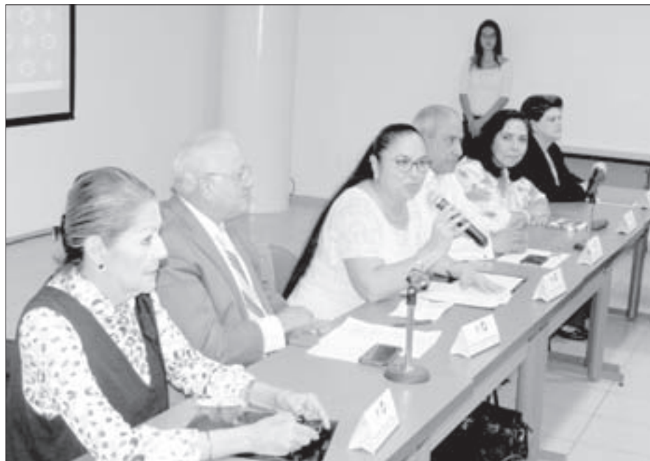
La Rectora destacó el esfuerzo y el compromiso institucionales

Asimismo, las directoras de las facultades de Contaduría y Administración de Veracruz, Xalapa e Ixtaczoquitlán, y de la Facultad de Ciencias Administrativas y Sociales de Xalapa, así como académicos y alumnos de estas dependencias.