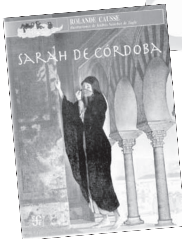
Ha traducido más de 200 libros para diversas editoriales