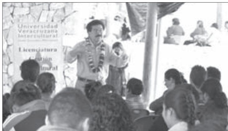
El decano también estuvo en la UVI Grandes Montañas