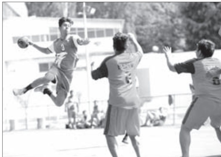
Los Halcones pasaron a la etapa regional tras vencer a la BENV