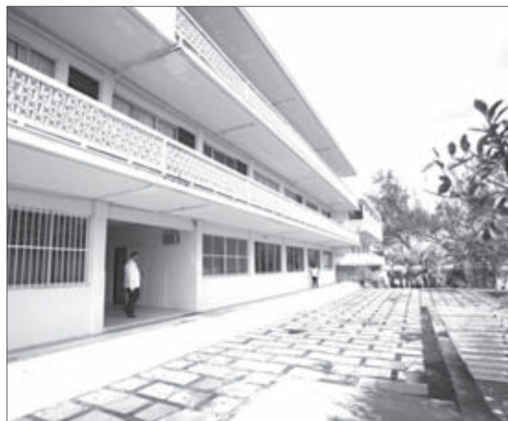
La Facultad fue la primera en buscar su acreditación al interior de la UV