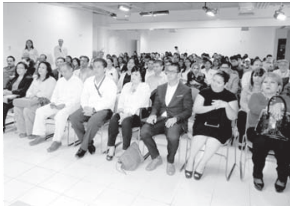
En el proceso de acreditación participaron académicos y alumnos