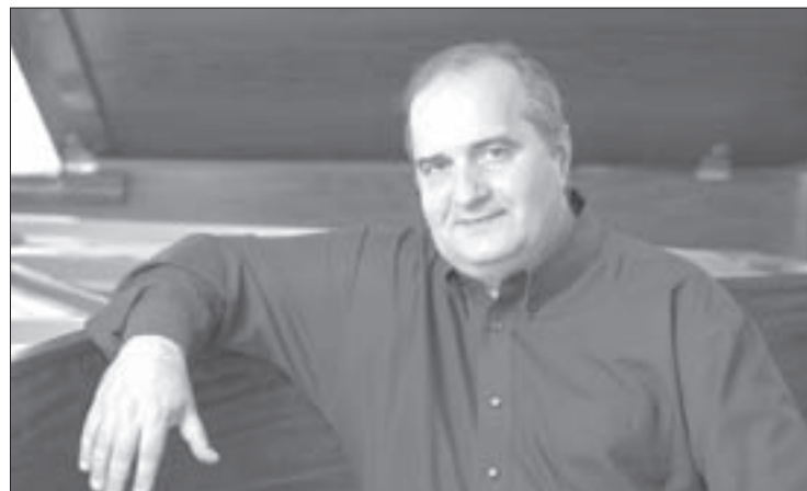
El pianista participará en el programa De la vieja y la nueva Rusia