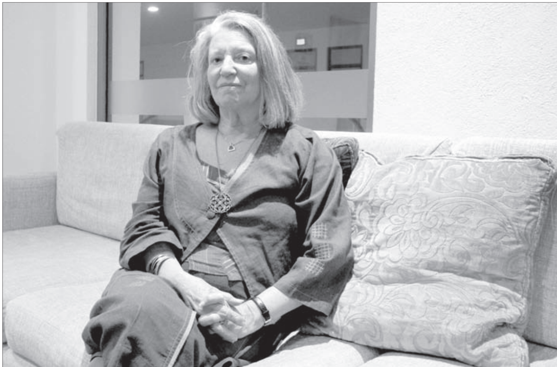
La filósofa y feminista visitó la UV

Cuando estábamos en la fundación de estos programas de estudio, yo estuve en contra de un cierto tipo de feminismo separatista, que dividía las cuestiones de género de los tópicos de raza, clase y capitalismo; por ello siempre