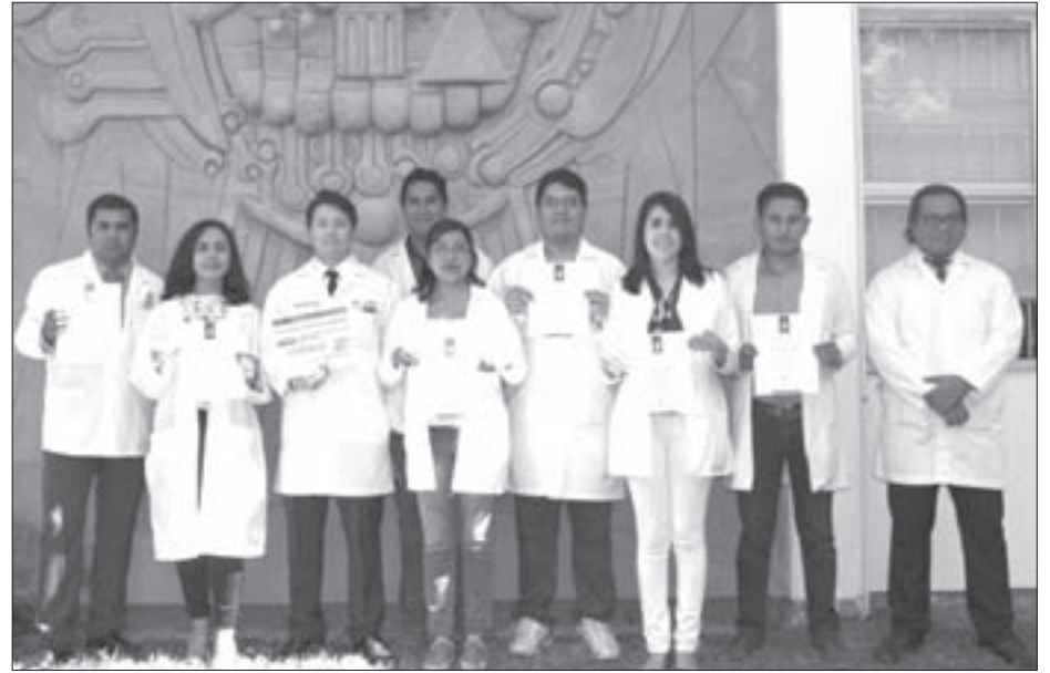
Un total de 18 alumnos recibieron su constancia de acreditación