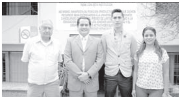
Integrantes del IIESCA

Es la primera vez que en México se realiza una investigación sobre “Finanzas conductuales”