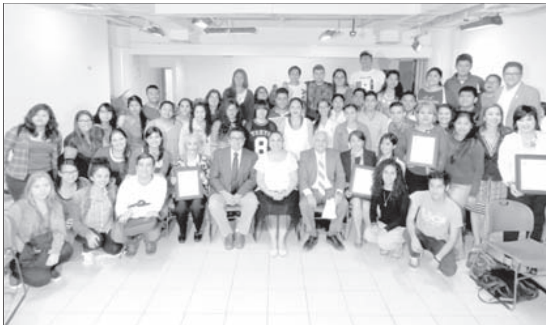
La certificación da confianza y certeza a los universitarios

Indicó que estas acreditaciones demuestran que la formación de la UV es de calidad y subrayó el compromiso que se tiene con la educación pública.