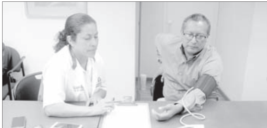
El propósito es mejorar la calidad de vida de las personas que laboran en la institución

Para él es importante que este programa se mantenga y se amplíe, pues sí hay resultados favorables entre la comunidad universitaria. “Un ejemplo es mi persona, a mí me beneficia, pues siempre estamos encerrados trabajando y un poco de ejercicio es bueno. Hay que mejorar la vida hoy y para un futuro”.