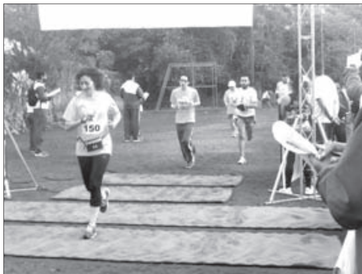
Los participantes en plena competencia