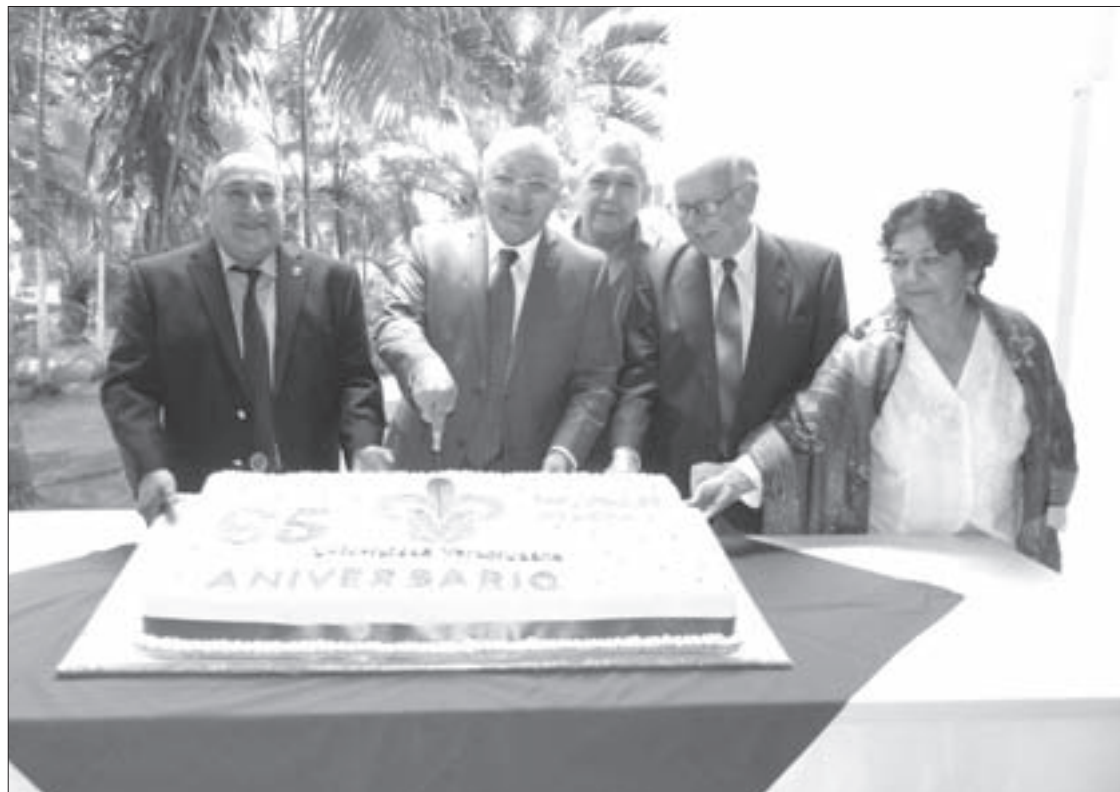
El Vicerrector encabezó el festejo