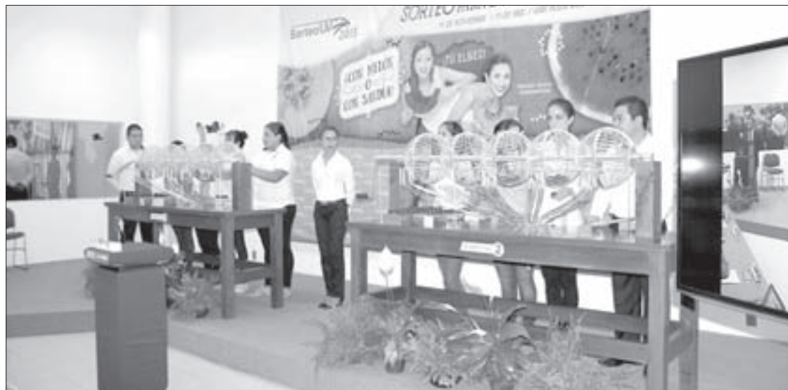
Este año habrá dos sorteos para estudiantes

Para conocer a detalle los montos de los premios en cada uno de los sorteos y cómo adquirirlos en línea, se puede consultar el sitio de Internet: http://sorteosuv.org.mx/