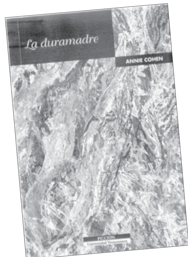
Tradujo La duramadre (2001) publicado por Editorial UV

Para Ortiz Lovillo, la época actual plantea diversos desafíos, uno de ellos es preparar traductores en México que puedan competir con los mejores del mundo.