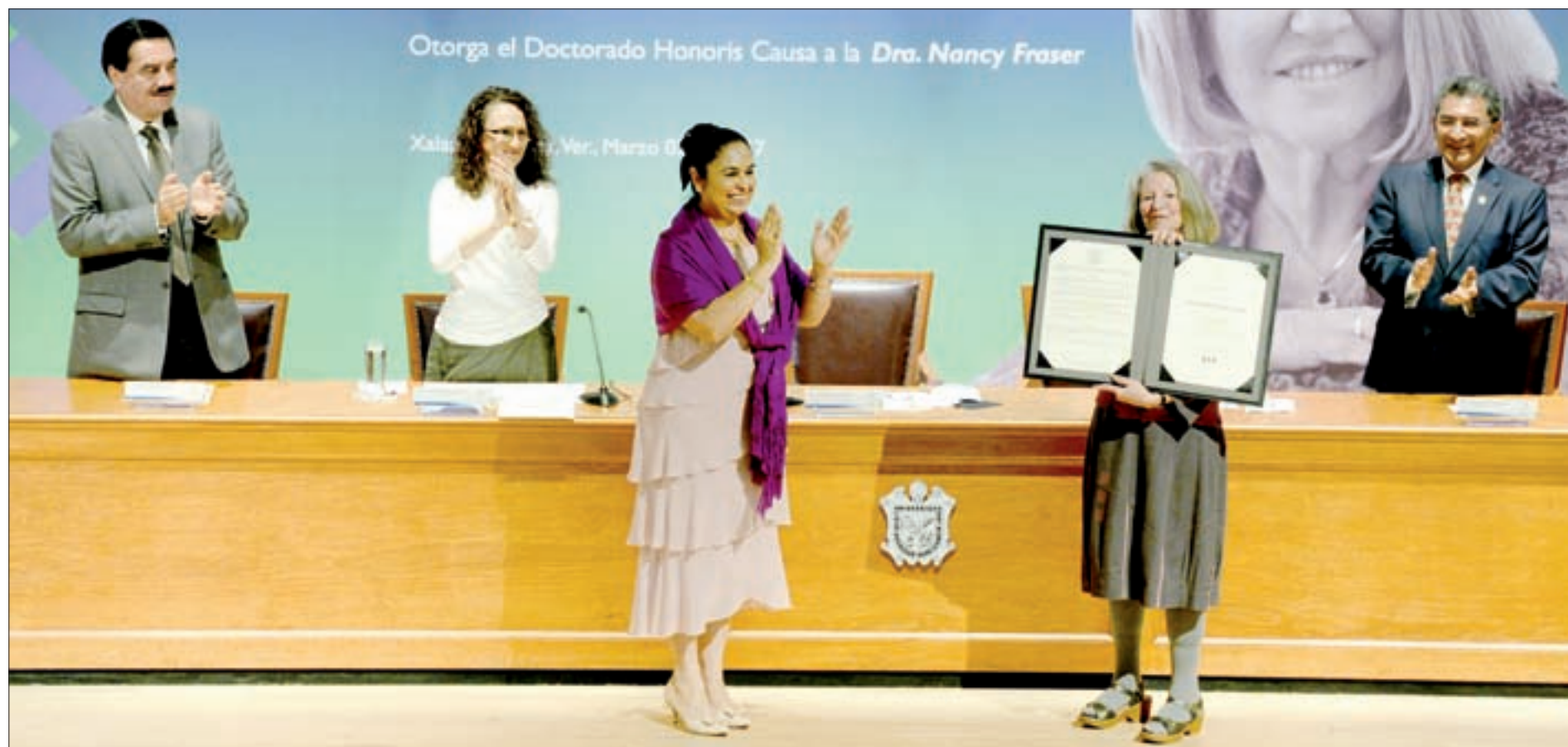
La Rectora entregó la máxima distinción académica a la filósofa norteamericana

En ese contexto, destacó la Rectora, la UV lucha por una justicia social, y como muestra están la creación de la Defensoría de los Derechos de los Universitarios, la Coordinación de la Unidad de Género, el concederle la Medalla al Mérito UV a Las Patronas, el reconocer el legítimo derecho a que el certificado de estudios de una joven transgénero lleve el nombre con el que finalmente ella decidió vivir, y