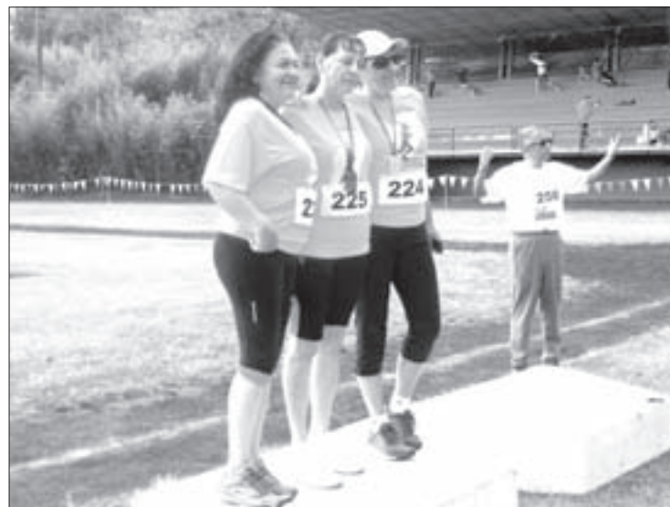
El pódium de los triunfadores

➤ La justa se realizará del 16 al 26 de marzo