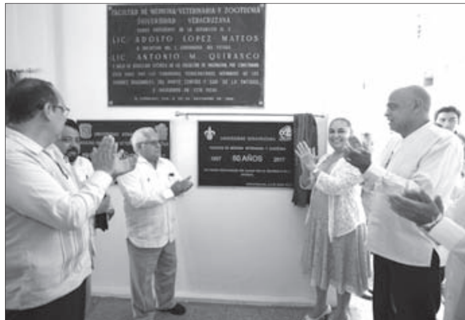
Se devolvió una placa conmemorativa por los 60 años de fundación de la Facultad