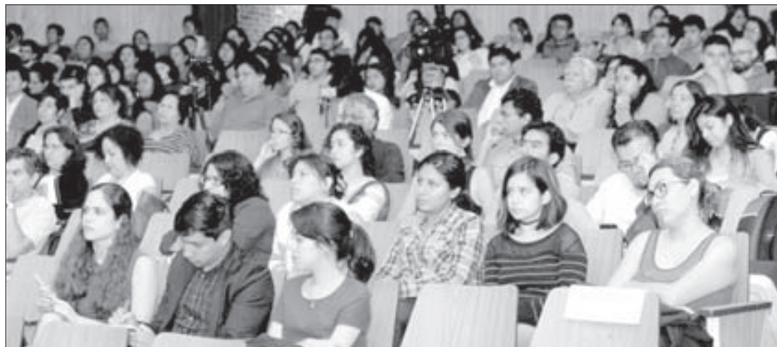
Estudiantes y académicos asistieron a la charla

Ahora, dijo, hay una nueva lógica en el sistema capitalista: los sujetos expropiados (que cada vez son más y sin defensa), los ciudadanos explotados y una nueva figura que es el ciudadano trabajador expropiable y explotable.