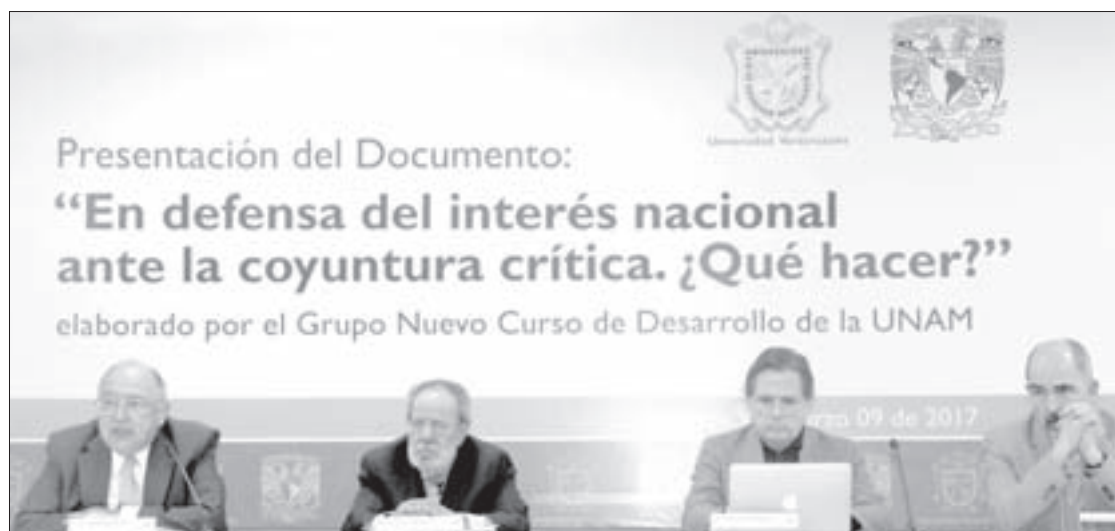
Integrantes del Grupo Nuevo Curso de Desarrollo de la UNAM

A la presentación de esta propuesta, transmitida a las cuatro regiones de la Universidad a través del sistema de videoconferencias, asistieron directores generales de áreas académicas y administrativas, profesores, investigadores y estudiantes.