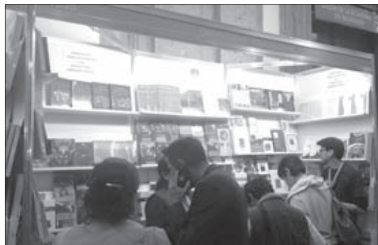
El público abarrotó el stand de la UV en el Palacio de Minería

El joven relató que ya conocía los libros de la Editorial UV, los cuales le agradan debido a su gran calidad y a la excelente selección de autores que publican;