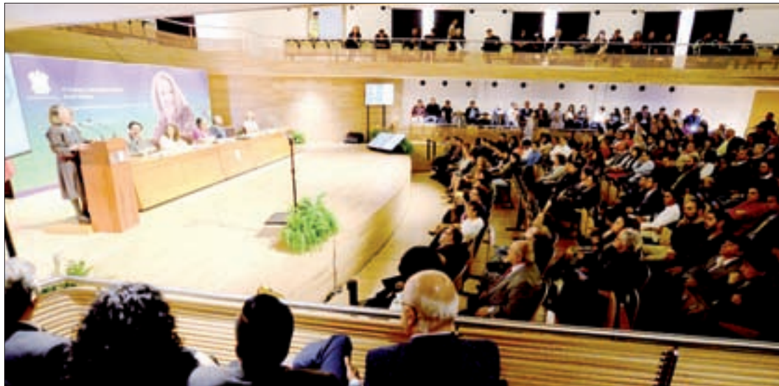
La ceremonia se efectuó en sesión solemne del CUG, celebrada en la Sala Anexa de Tlaqná