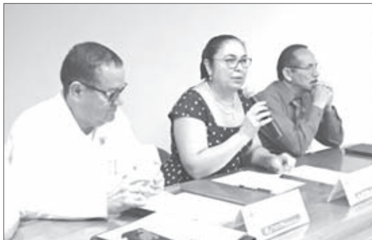
La Rectora celebró el Nivel 2 que otorgó Ceneval a los aplicantes del EGEL

El Ceneval otorgó el Nivel 2 al PE de Medicina en Minatitlán, gracias a