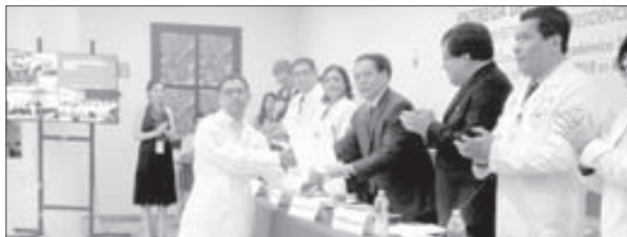
Alumnos culminaron sus estudios de especialidad

La premiación sirvió de marco para la clausura del ciclo académico 2016-2017, y para la inauguración del ciclo 2017-2018 en Residencias Médicas.