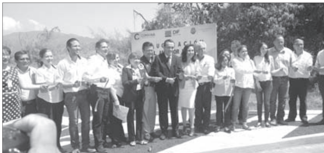
Corte del listón inaugural