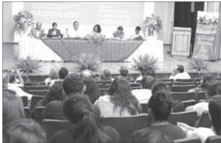
Se presentó el PE Derecho con Enfoque de Pluralismo Jurídico

Cuevas Gayosso señaló la incidencia de la aplicación de los tratados y convenios internacionales en materia de derechos humanos en los que México participa, lo cual refuerza el reconocimiento al derecho de los pueblos originarios integrado