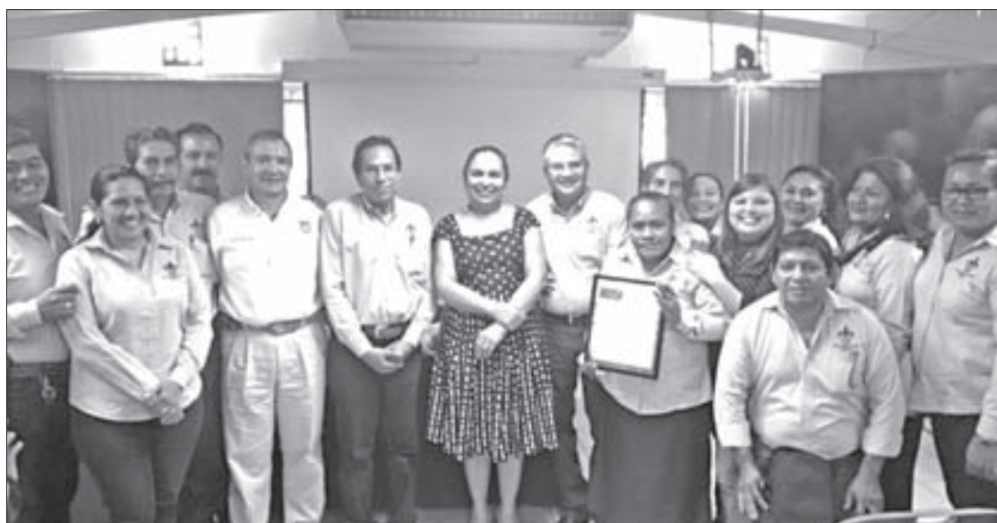
La comunidad de la FISPA celebró el reconocimiento como programa de calidad nacional

Las autoridades universitarias hicieron un recorrido por las nuevas instalaciones de la FISPA: espacios para el área administrativa, la biblioteca y aparatos para ejercitarse.