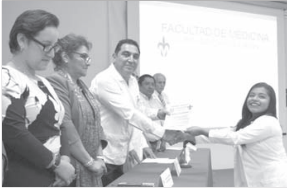
El Vicerrector reconoció el esfuerzo y dedicación de los egresados