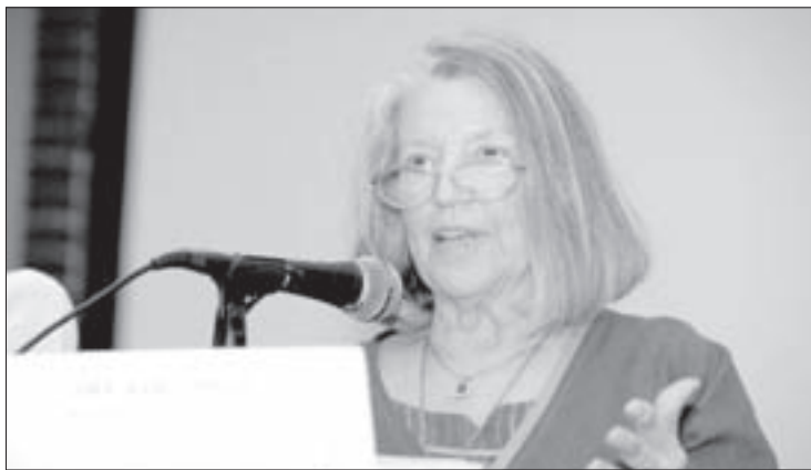
La activista ofreció conferencia magistral en la Unidad de Humanidades

Dijo que se trata de una relación confusa, ya que en un sistema donde lo principal es la extracción y acaparamiento de recursos, las cuestiones raciales deberían