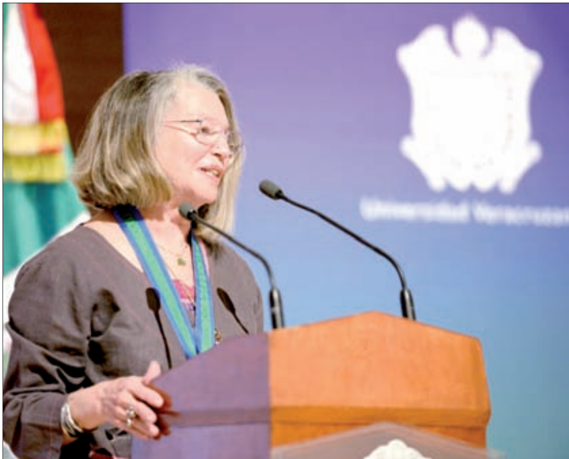
La galardonada se dijo “muy honrada y agradecida” por el reconocimiento

“De acuerdo con cifras de la Secretaría de Educación Pública, en el ciclo escolar 2015-2016, 49.2 por ciento de los inscritos en el nivel de enseñanza básico en el Sistema Educativo Nacional es una mujer; en el nivel medio superior existe una ligera pero mayor proporción de mujeres inscritas (50.2 por ciento) que hombres (49.8 por ciento), en tanto que en el nivel superior 49.3 por ciento de las personas que cursan estudios profesionales son mujeres.”