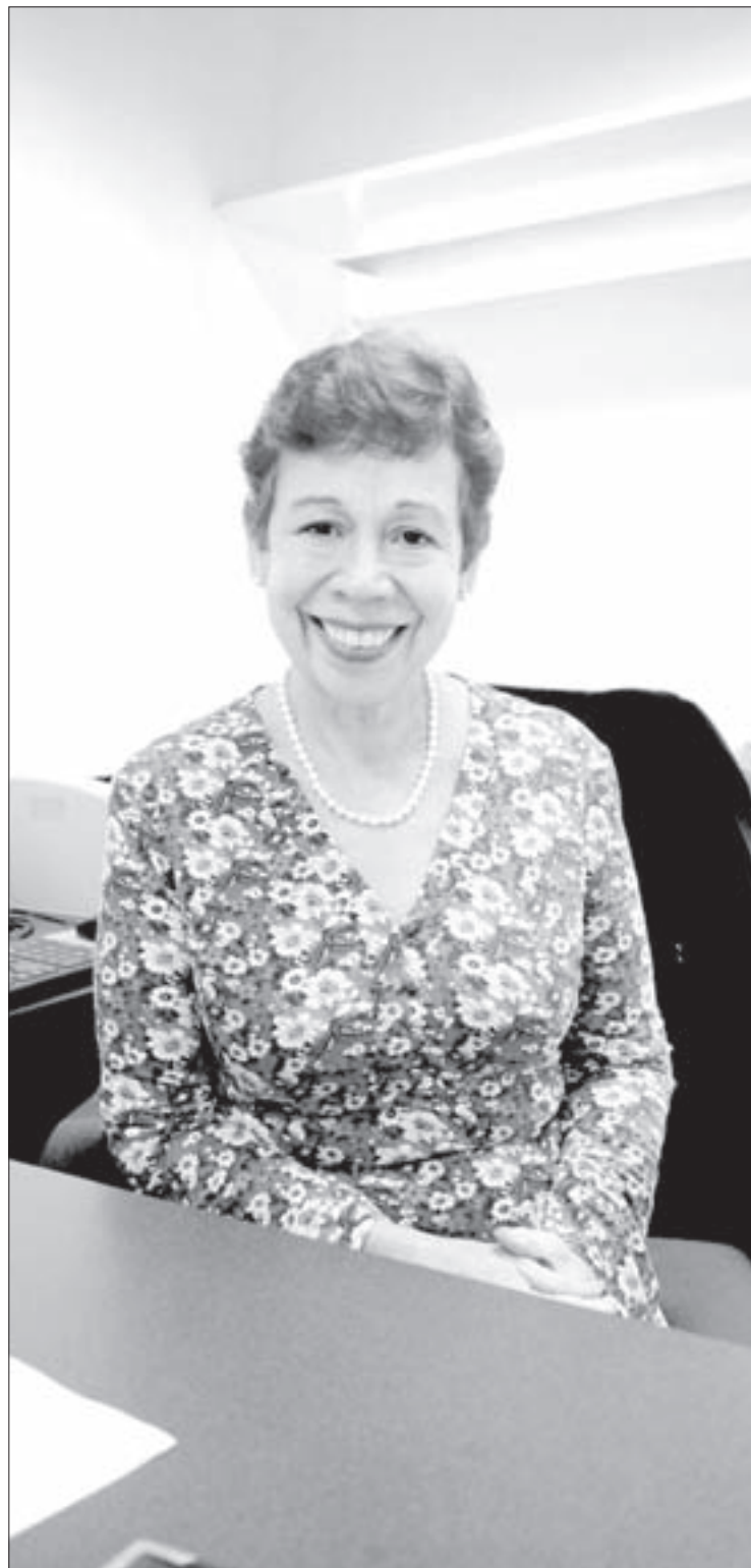
La académica es integrante del IIE

La universitaria destacó la necesidad de que esta casa de estudio imparta un posgrado en traducción