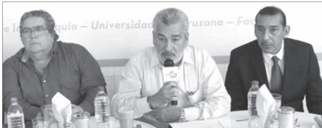
Directivos de la empresa y la Universidad ratificaron el convenio