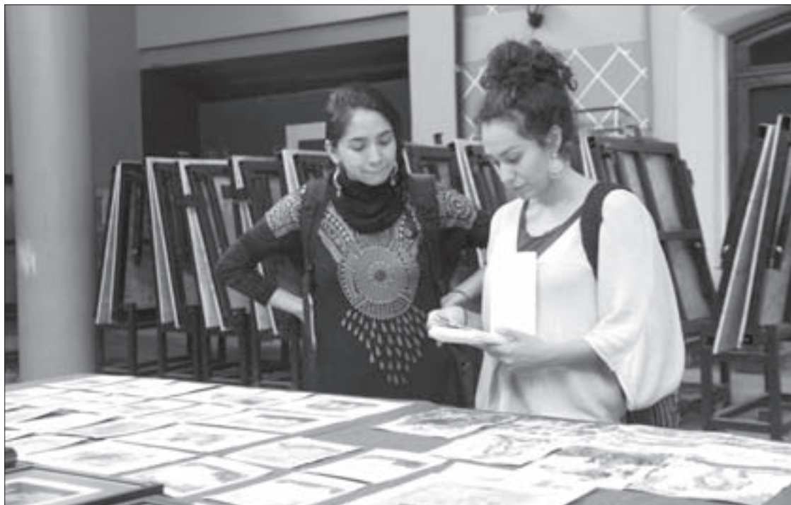
Estudiantes, principal público del evento