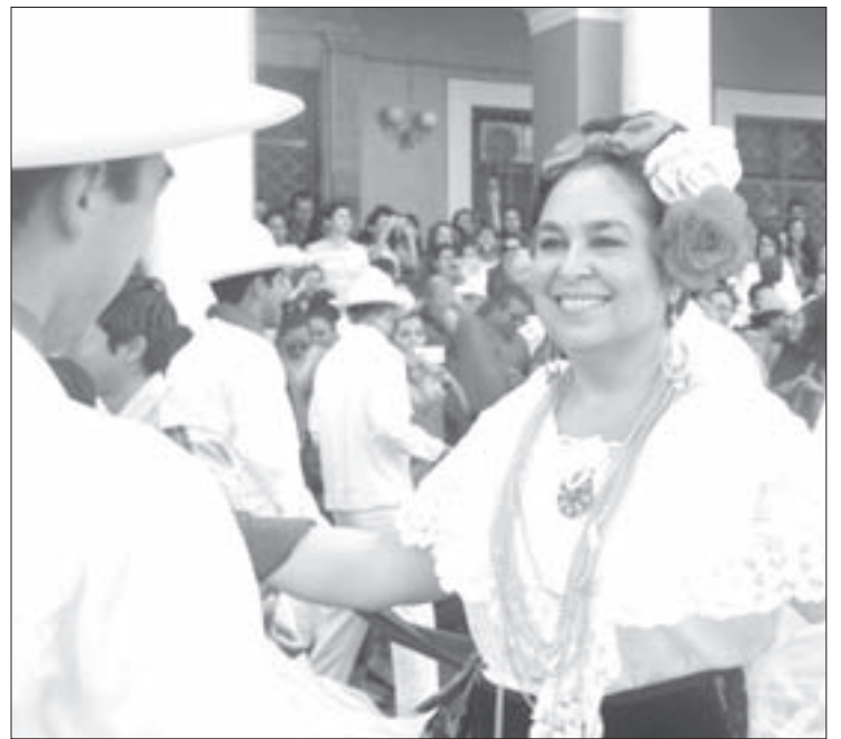
La Rectora se sumó al festejo