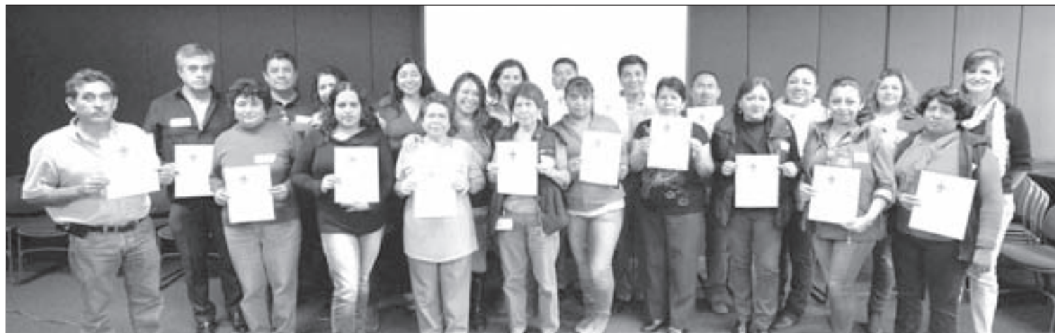
Se clausuró el taller "Perspectiva de género en la gestión universitaria"