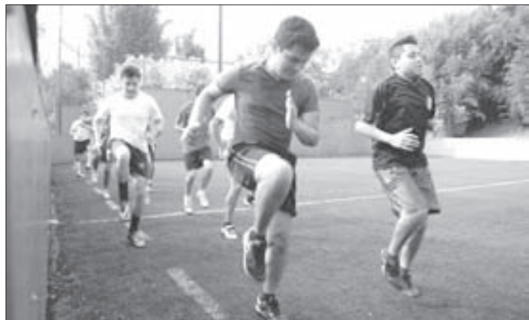
Los jóvenes eligen los horarios y las disciplinas