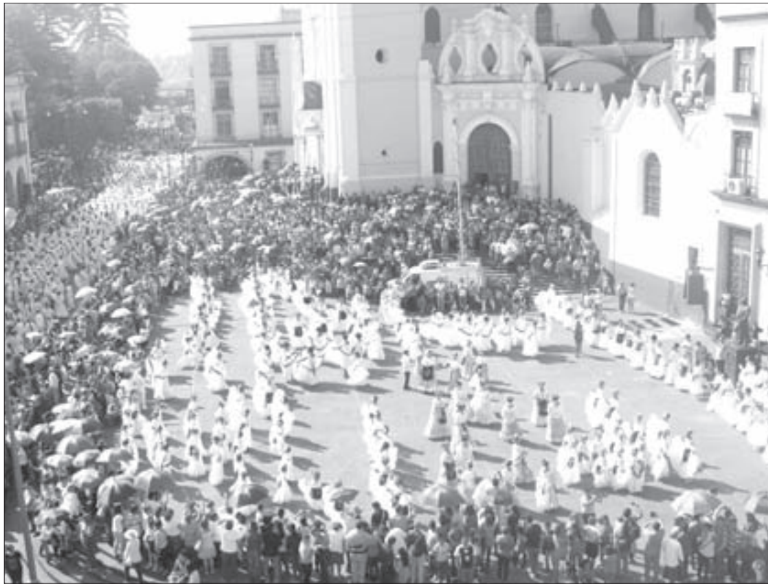
Bailarines y espectadores abarrotaron la Plaza Lerdo

Con la guía del Ballet Folklórico de la UV, rompieron el récord Guinness