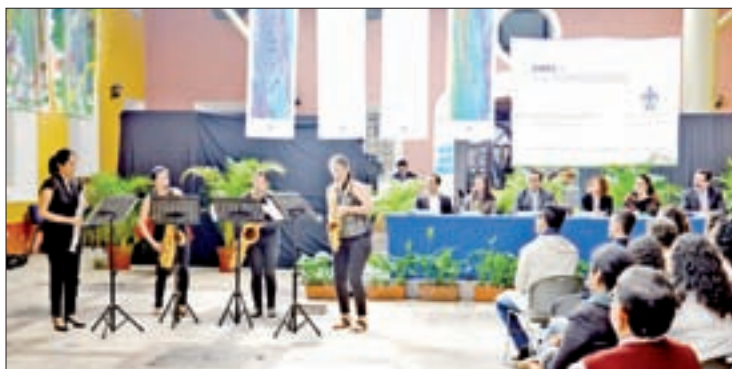
Cuarteto Cadenza, integrado por alumnas de Música