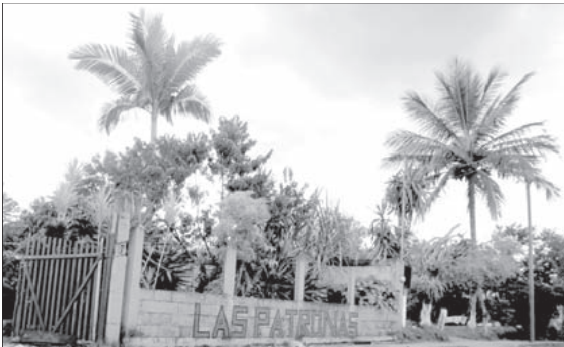
Entrada principal al albergue