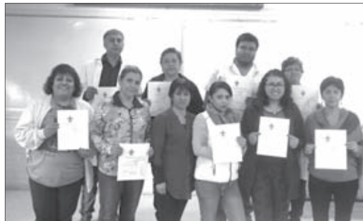
En esta ocasión se impartió un curso a laboratoristas y auxiliares

Los trabajadores –hombres y mujeres de diversas edades y antigüedad laboral– cursaron