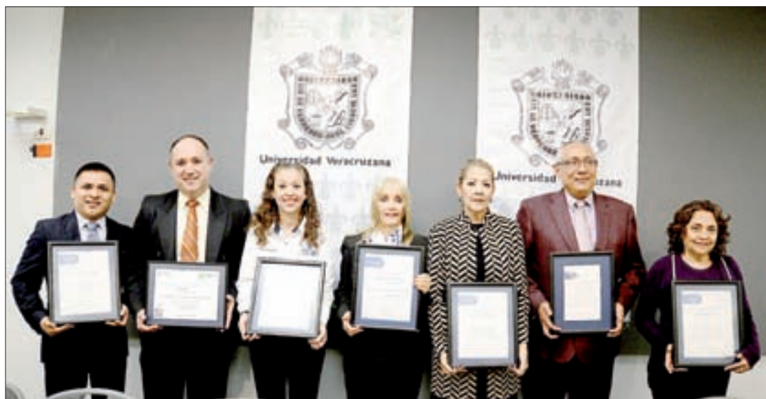
Siete licenciaturas del Área Académica Económico-Administrativa también fueron acreditadas

Después siguió el cuarteto Cadenza, integrado por estudiantes de la Facultad de Música, quienes