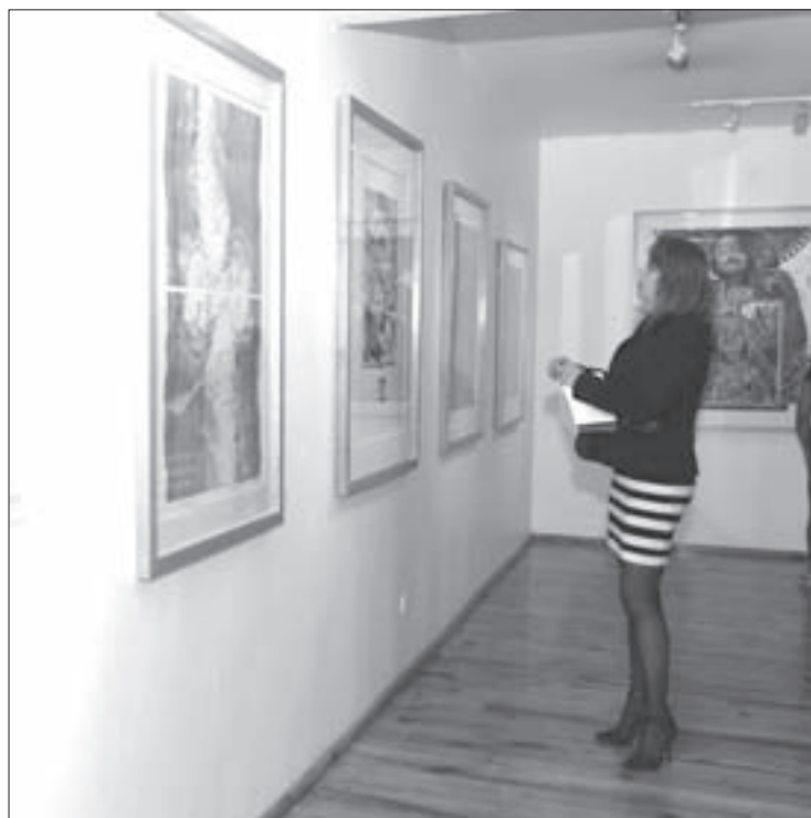
La muestra permanecerá abierta hasta el 15 de enero

La exposición puede visitarse de lunes a viernes, de 9:00 a 20:00 horas, y sábados y domingos de 9:00 a 14:00 y de 15:00 a 20:00. El acceso es gratuito.