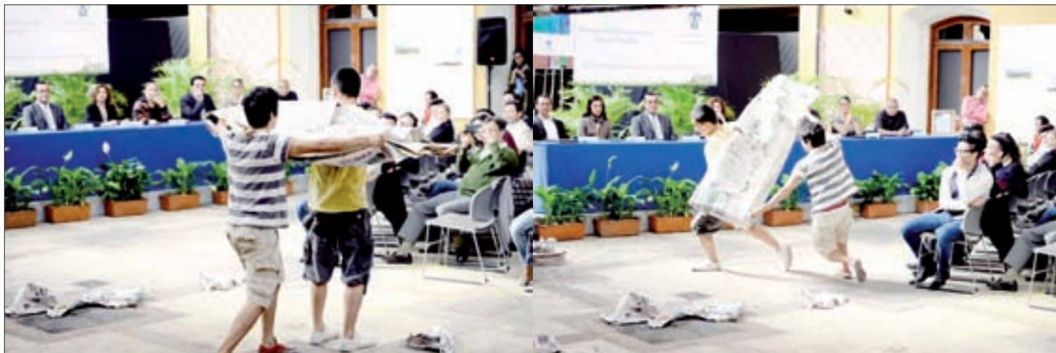
Estudiantes de Danza y Teatro presentaron la coreografía Un tostón