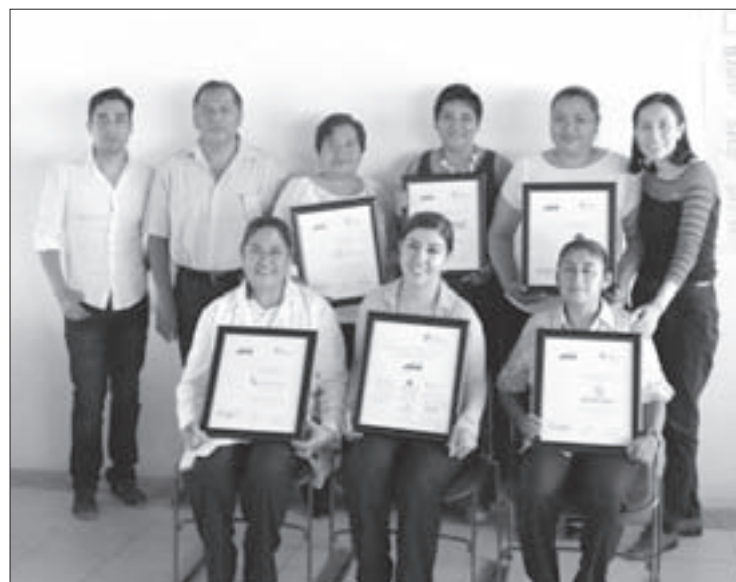
Los participantes aprendieron a diseñar y formular proyectos productivos

Los proyectos presentados son: VERCE Eventos. Organización de Eventos, que brindará el servicio de renta de mantelería, loza, mesas y sillas, y a futuro el suministro de alimentos para todo tipo de eventos familiares y sociales; Operación Turística “Tres Corazones”, que instalará