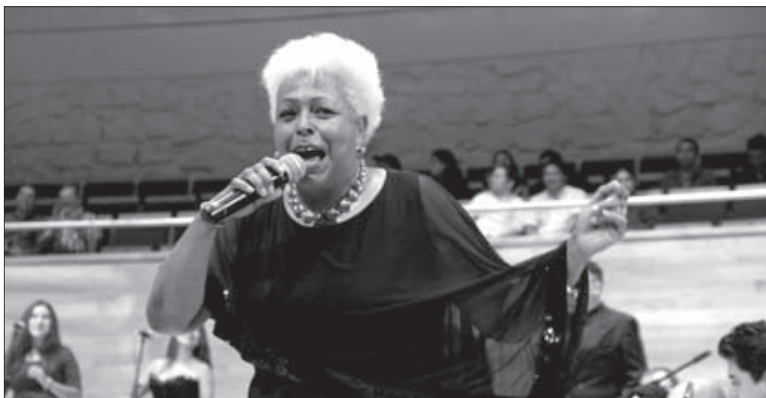
La cantante Maritza Montero