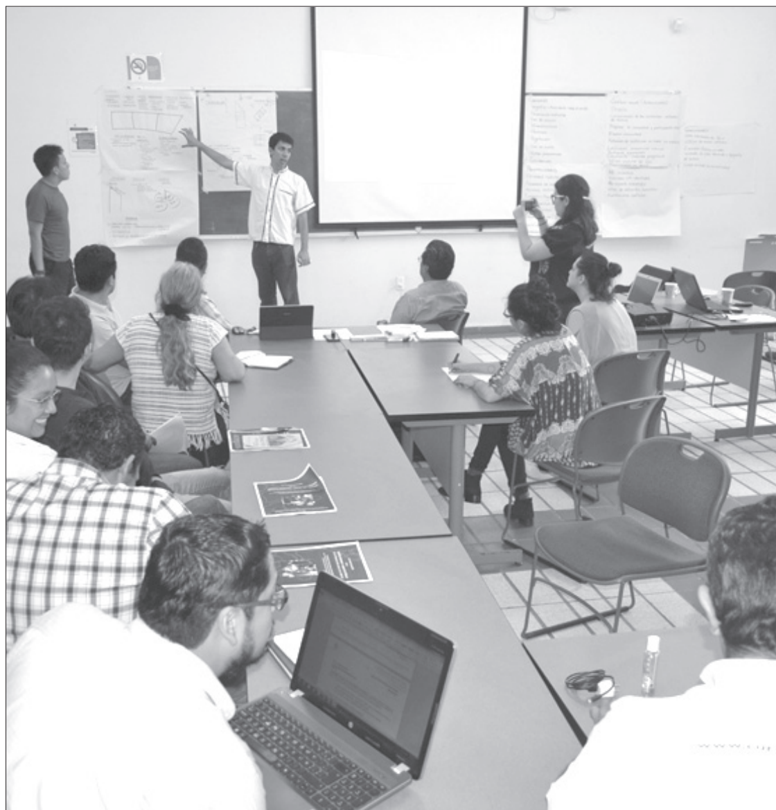
Estudiantes y académicos asistieron al taller sobre planeación participativa