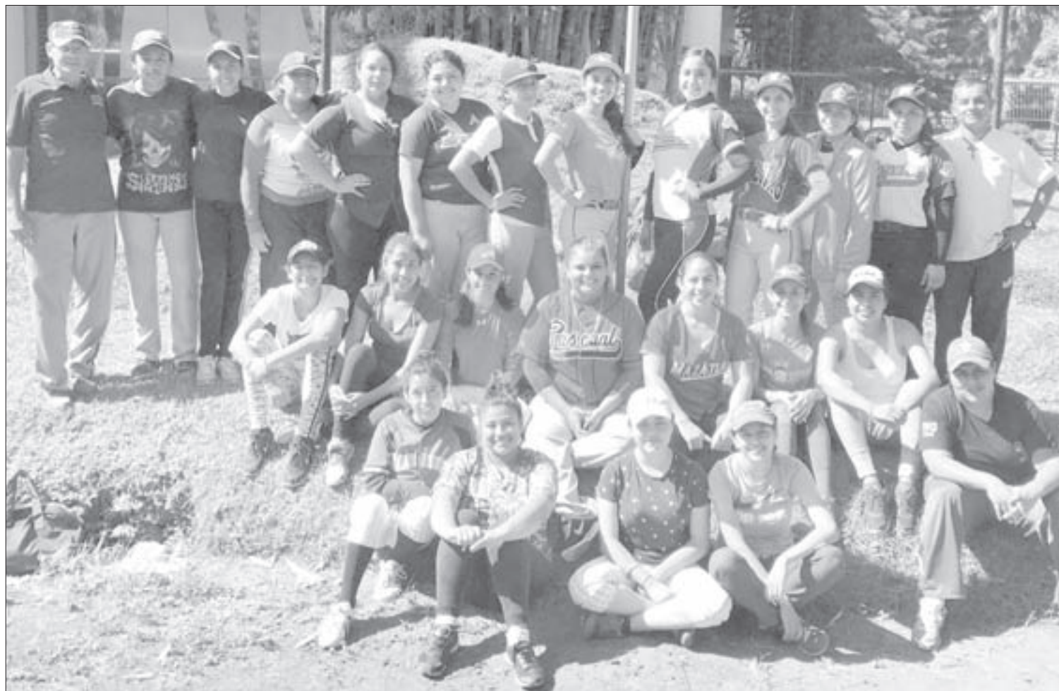
Las jugadoras provienen de las regiones Poza Rica-Tuxpan, Veracruz, Coatzacoalcos-Minatitlán y Xalapa

La última concentración se llevará a cabo a inicios de 2017