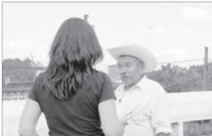
La filmación se realizó en Cuetzalan, Puebla