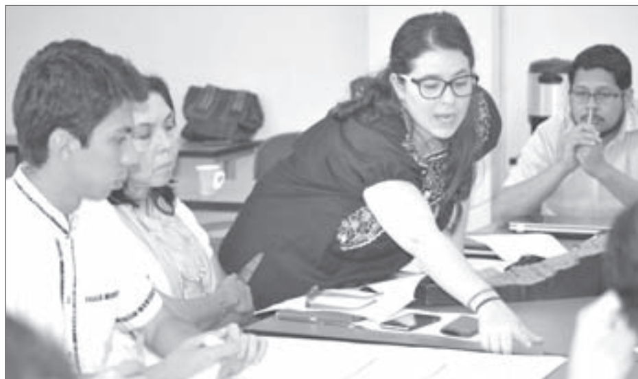
El consultorio de arquitectura práctica realizó un ejercicio de diseño metodológico