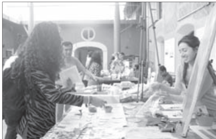
Alumnos y egresados participaron en Arte Bazar

al personaje de mi marca, es una sirena que tiene elementos tomados de lo nahual y de lo salvaje de los seres. Trabajo mucho con reutilizar materiales, como las bolsas e imanes que fabrico, retomo cartón, tela... los temas generales se relacionan con sueños y monstruos, abordados con una técnica mixta”.