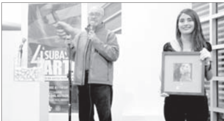
También se rifaron tres piezas