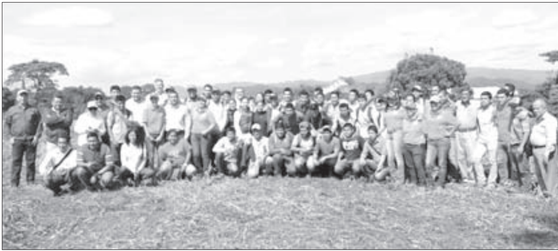
El evento integró capacitación, transferencia de tecnología, investigación y vinculación