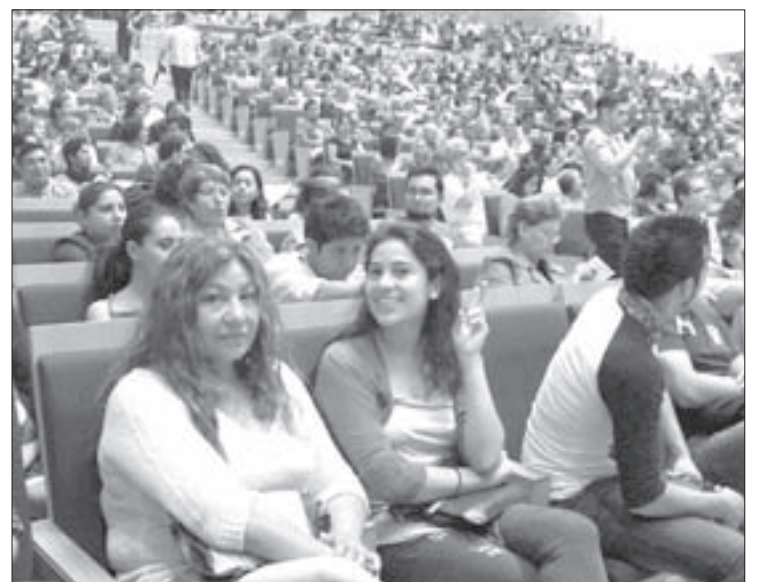
El concierto tuvo lleno total

Aunque el ánimo no cesaba en el auditorio, el programa culminó con un par de melodías extras. Con Lágrimas negras los músicos se despidieron entre aplausos, risas y baile, una respuesta inesperada que la cantante agradeció con nobleza: "Compartir el escenario con esta magnífica orquesta ha sido un placer, porque nos permitió tener una noche cubana en Xalapa. Hoy nos reunimos para pasarla bien, pero me gustaría que se fueran a su casa con la idea de que siempre hay que hacer crecer el amor".