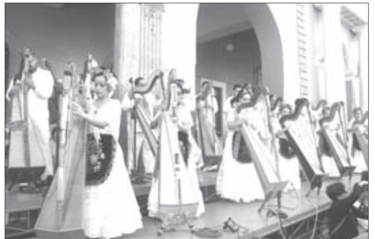
El evento fue organizado junto con el Ayuntamiento de Xalapa y el Ivec