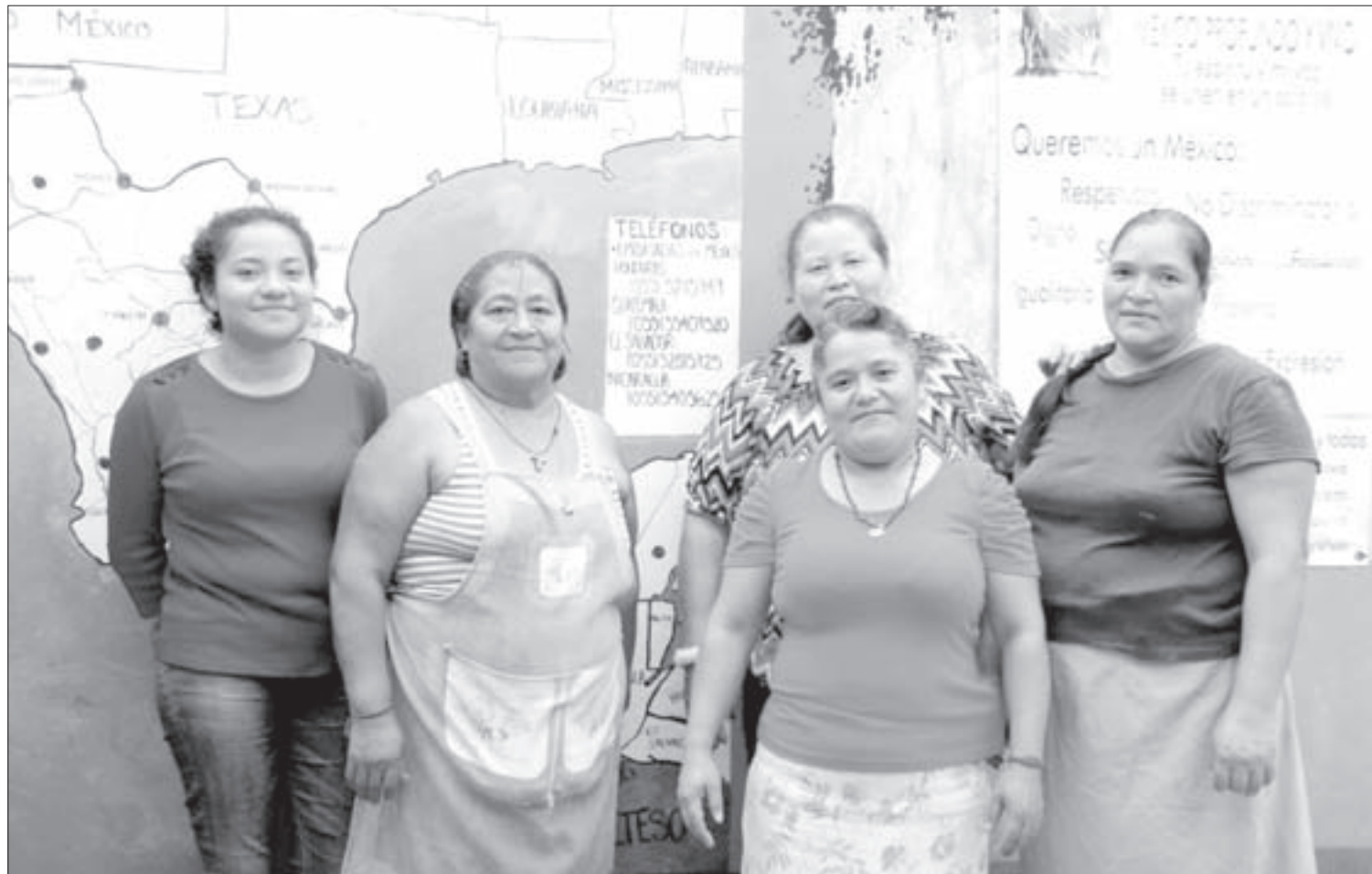
El grupo de mujeres lleva más de 20 años auxiliando a los migrantes