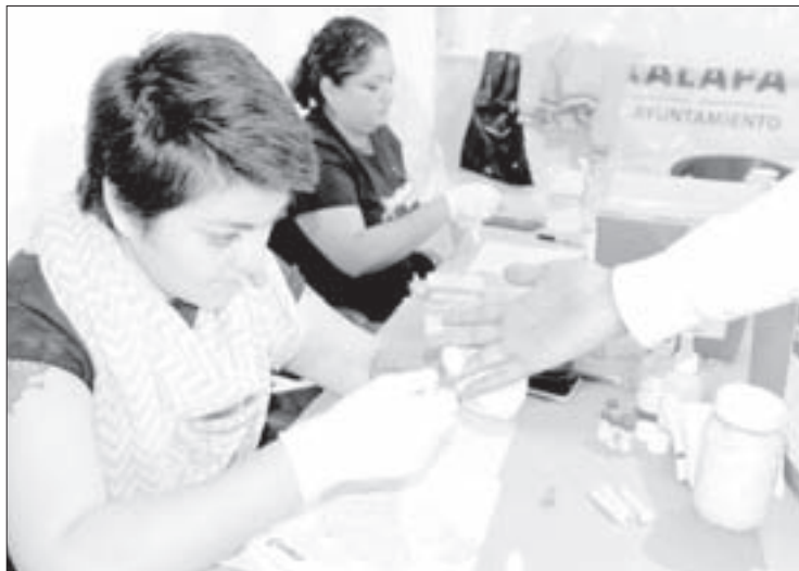
La actividad se realizó en el Parque Juárez

Por último, aclaró que con esta actividad concluyó la campaña durante este año, pero se retomará al inicio del próximo semestre.