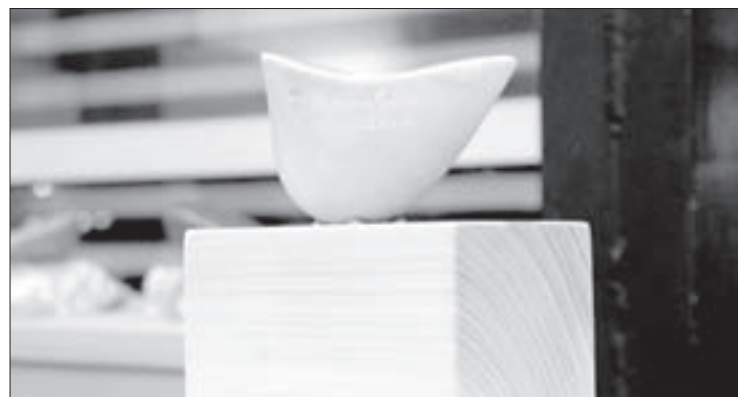
Piezas de cerámica también fueron exhibidas

y cerámica fueron pugnados a partir de precios de salida menores a los que se ofertan en otras modalidades de venta en el mercado nacional. En orden de facilitar su adquisición, el IAP ofreció tres modalidades de pago (en efectivo, con tarjeta de débito o crédito y a través de cinco depósitos quincenales)