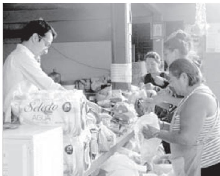
Estudiantes reunieron víveres y ropa

Asumen riesgos de vida en su intento por llegar a Estados Unidos