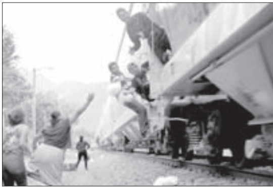
Paso de “La Bestia” a gran velocidad