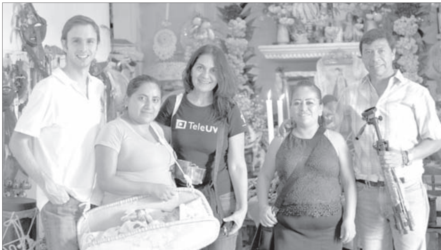
Aborda la importancia de los pueblos campesinos a lo largo de los siglos

Tlayolohtli se proyectó en el marco del Foro Identidad y Patrimonio Biocultural en la Agricultura Tradicional de México