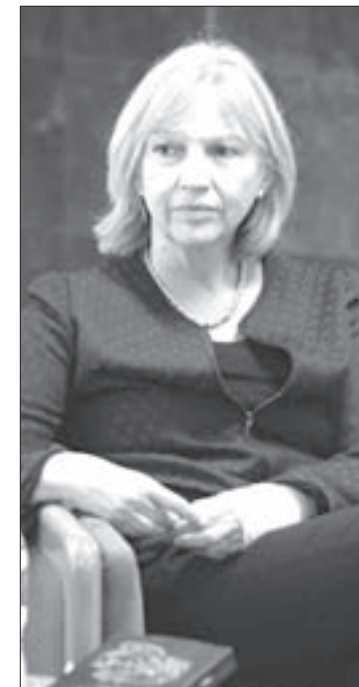
La traductora visitó la UV

Esa motivación ha sido mi motor durante 35 años de carrera, cuando leo un texto y siento que lo debo traducir pronto. Quien sienta eso, quien tenga esa vocación, esa pasión, seguro que va a llegar a ser un gran traductor.