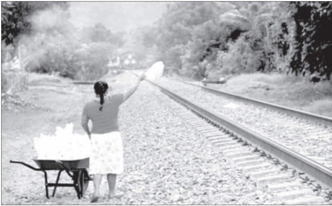
Labor comprometida y sin descanso

Es por ello que, después de asumir una conciencia humanitaria en 1995 —cuando un par de migrantes les pidieron el pan que acababan de comprar para desayunar—, Las Patronas corren a diario hacia las vías del tren, esperando tocar una vida en cada viaje a lo incierto. En carretillas y contenedores llevan agua y bolsas con alimento para los migrantes, quienes haciendo un esfuerzo sobrehumano por alcanzar los productos sin caerse de “La Bestia”