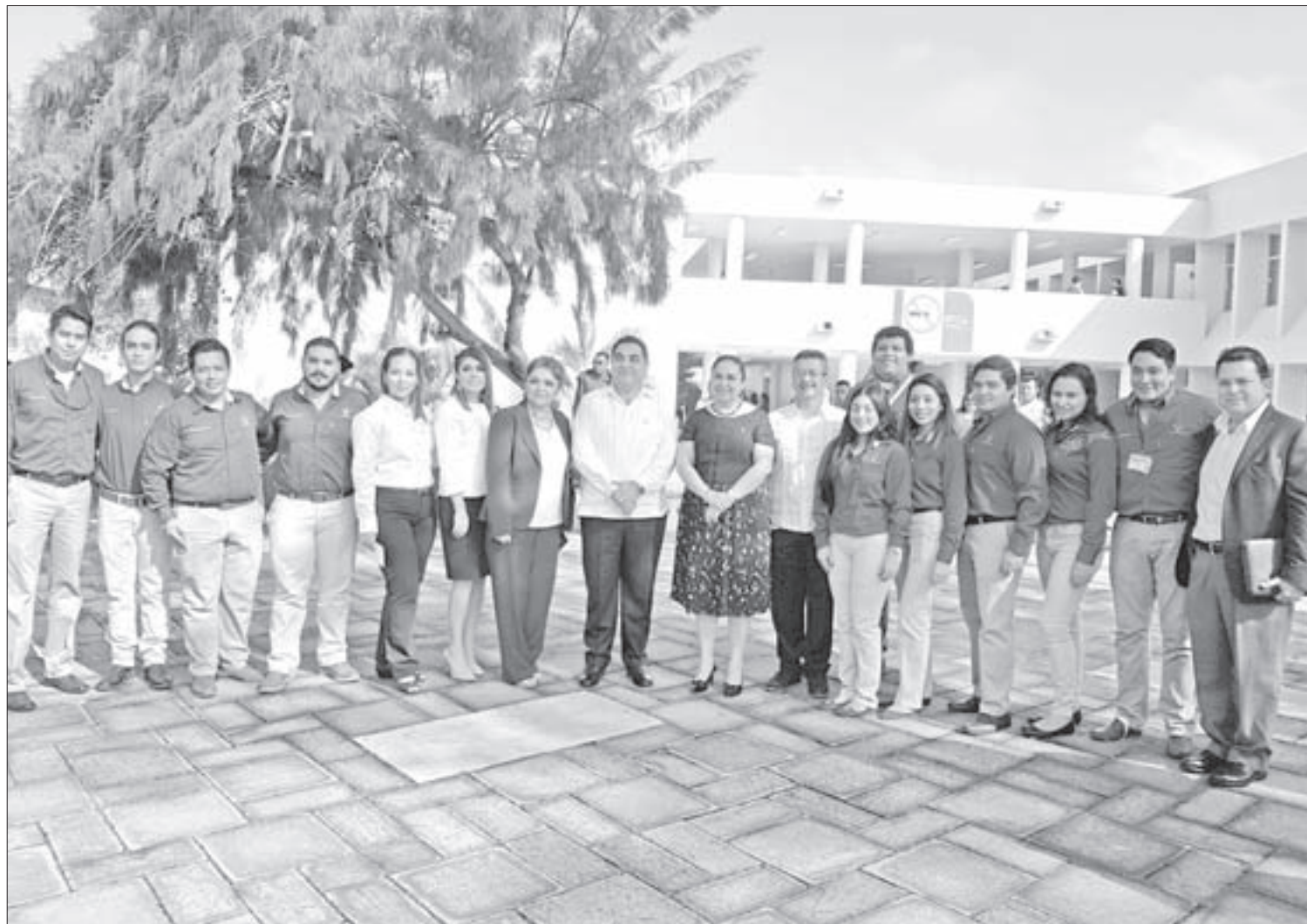
Los jóvenes con la Rectora, el Vicerrector y autoridades regionales

Obtuvieron segundo y tercer lugar en la Copa Petrolera del 2º Congreso Internacional Universitario de Petróleo y Energía