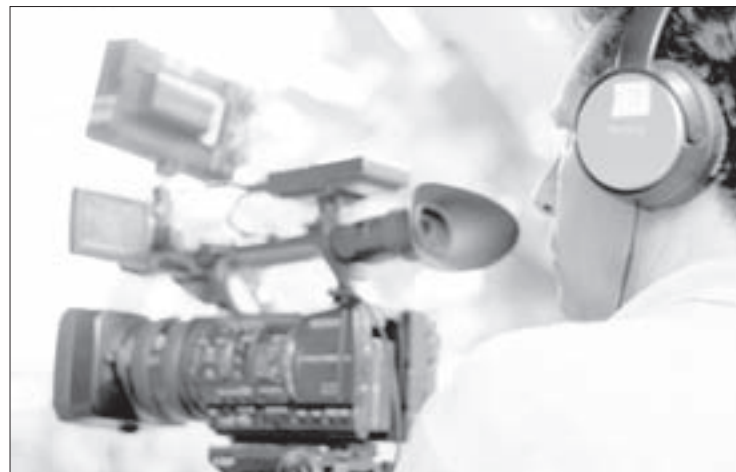
La segunda temporada se estrenará el próximo año