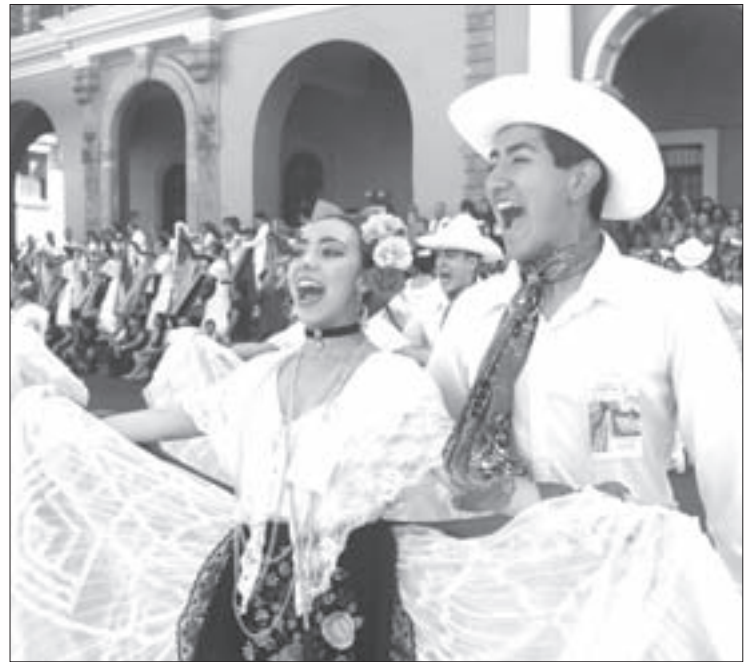
Los jarochos contagiaron bullicio y alegría

A decir de los asistentes, con la obtención del récord Guinness al mayor número de personas bailando La Bamba , no sólo se logró un reconocimiento mundial para la cultura veracruzana, también se demostró que cuando un sector de la sociedad se une por un fin común se pueden lograr grandes cosas.