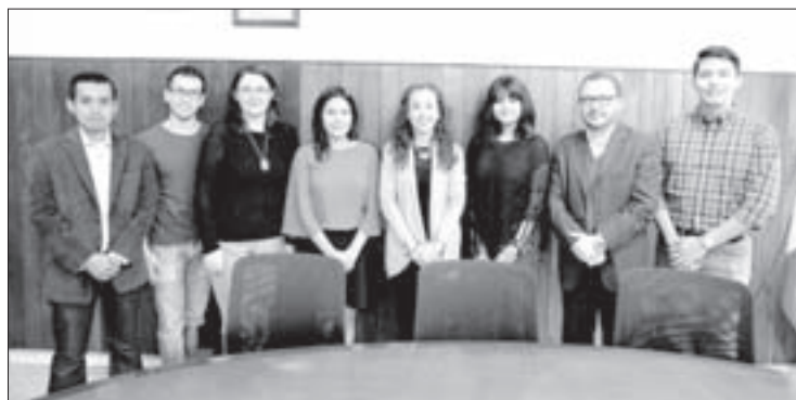
Directivos, catedráticos y alumnos de la Facultad