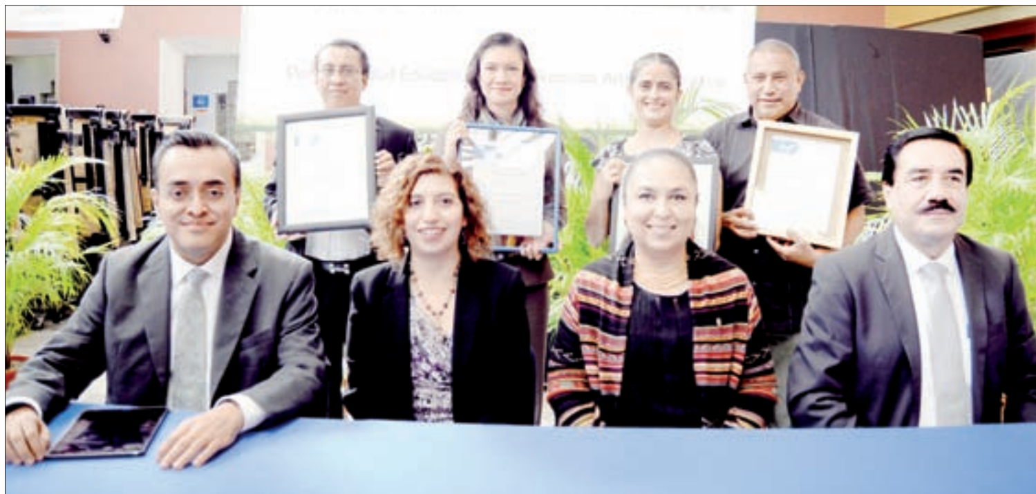
Los CIEES avalaron cuatro PE del Área Académica de Artes