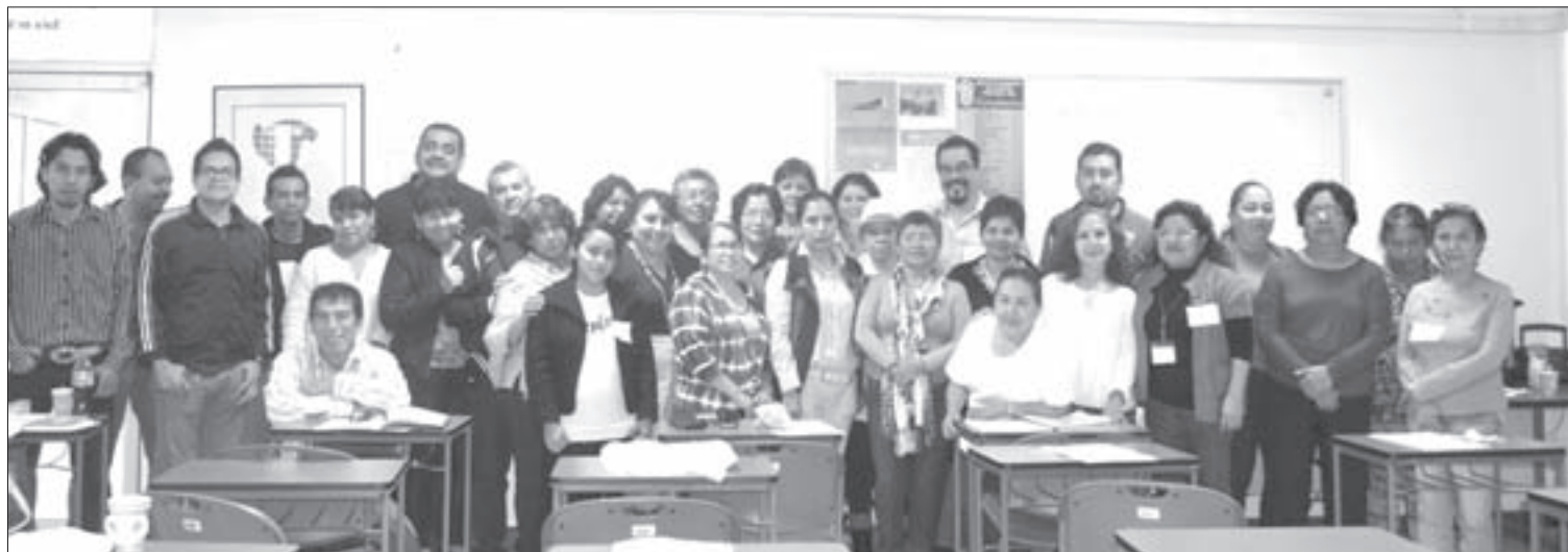
Asistentes y facilitadores del curso “La perspectiva de género en la gestión universitaria”