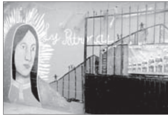
El comedor, ubicado en Amatlán de los Reyes