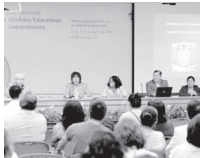
Mesa “Sujetos de la educación; profesorado frente al cambio”