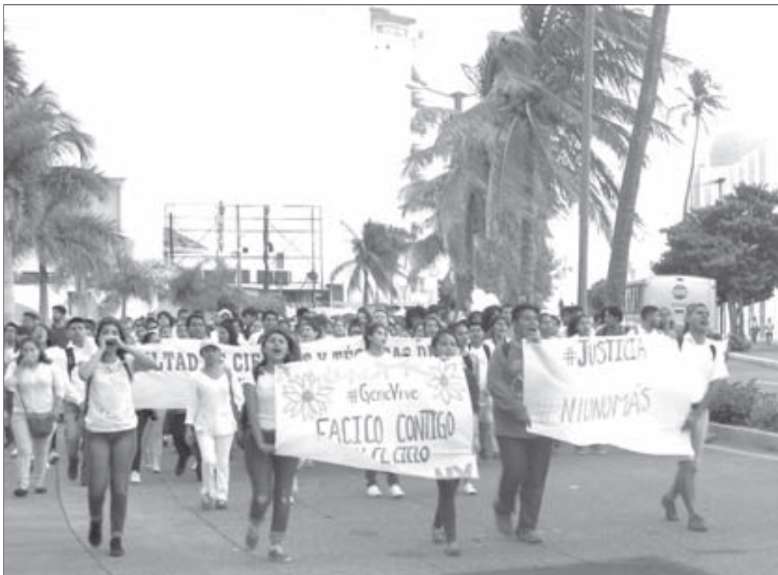
La comunidad universitaria marchó en Veracruz y Boca del Río

El contingente marchó por el boulevard Manuel Ávila Camacho hasta llegar a las oficinas de la Procuraduría en Boca del Río, donde demandaron la entrega expedita de los videos de cámaras de vigilancia del jueves 29 de septiembre, fecha en la cual fueron privados de su libertad los jóvenes asesinados.