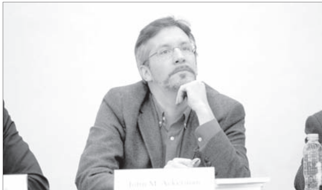
El académico y periodista presentó su libro El mito de la transición democrática