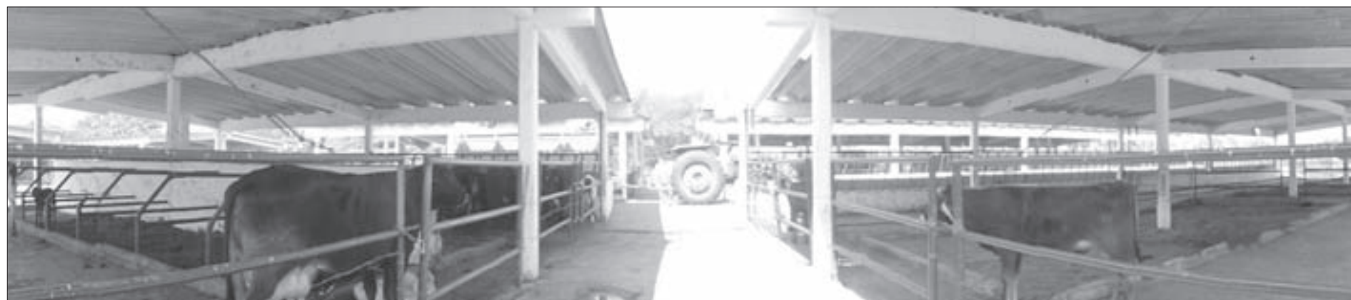
El rancho es fundamental para las prácticas de los estudiantes