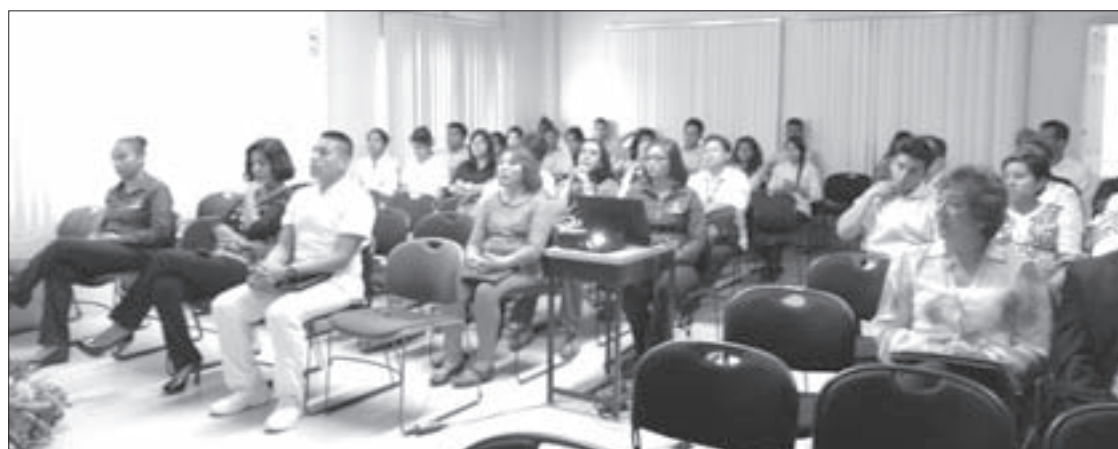
La comunidad de la Facultad estuvo atenta al informe