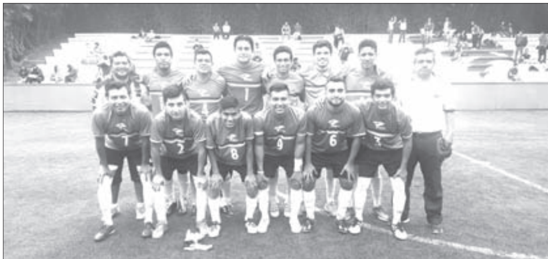
Poza Rica-Tuxpan, campeón del fútbol rápido

Por último, dijo que el objetivo principal es que la UV se mantenga entre las 10 mejores instituciones del país.