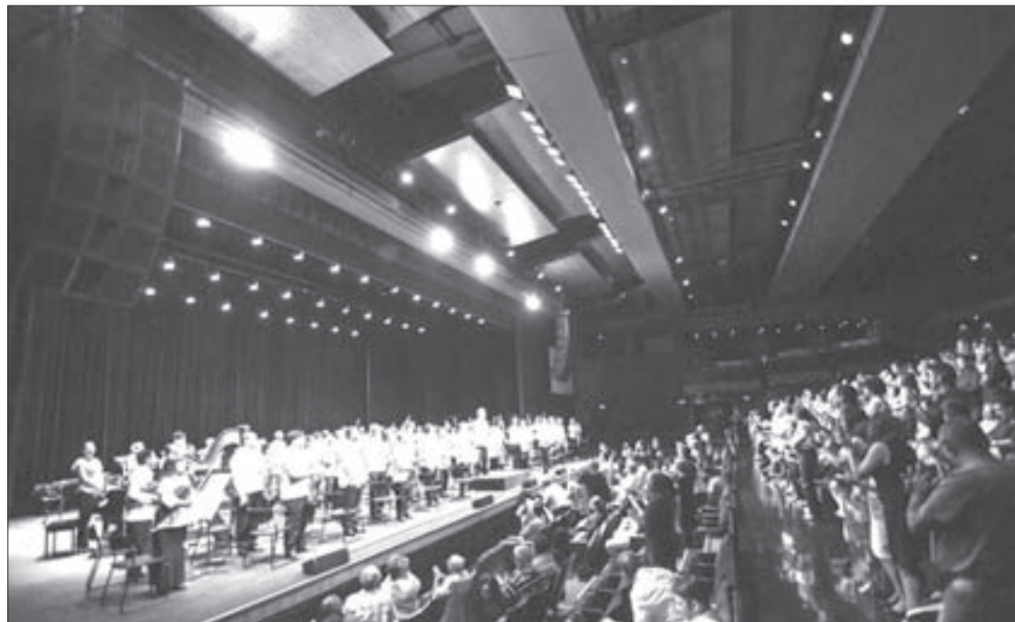
En todas sus presentaciones el público la ovacionó de pie

La OSX se presentó el 12 de octubre en Río de Janeiro, en el prestigioso Teatro Municipal de Río, una sala con capacidad para más de dos mil 300 personas. Finalizó la Gira Internacional Brasil 2016 en la Sala São Paulo, ubicada en la ciudad del mismo nombre, una de las metrópolis más pobladas del mundo entero, el sábado 15.