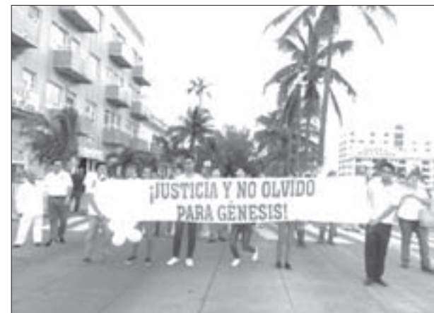
Los jóvenes manifestaron su indignación