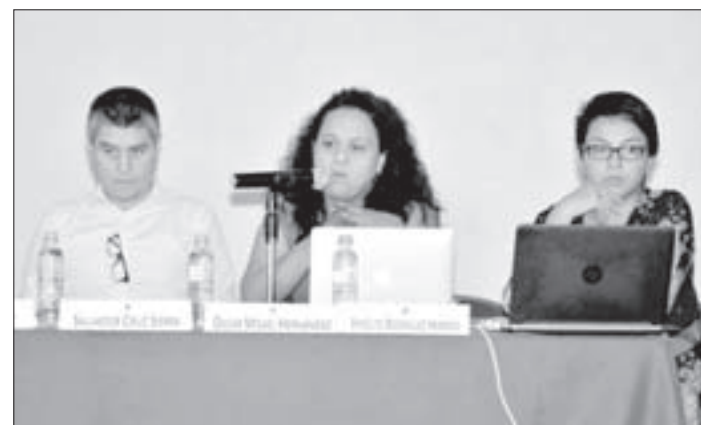
Participantes de la Mesa 4 “Masculinidad, migración y violencia”

Al comentar la publicación, el diputado de Morena , Cuitláhuac García, suscribió la opinión del autor y del académico respecto a la creación del mito institucional; señaló que en el libro es posible encontrar “todos los argumentos detallados” que explican por qué es un mito la transición en nuestro país.