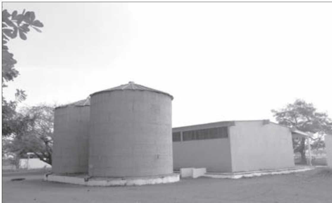
El proyecto también tiene un alto valor arquitectónico