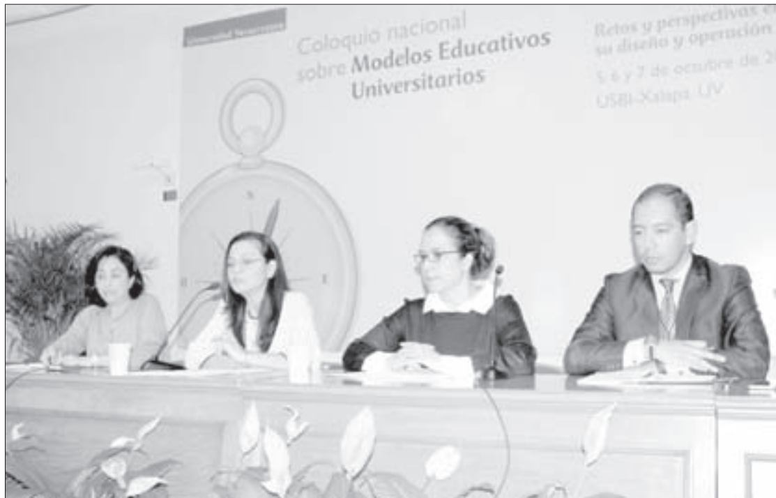
Participantes de la Mesa 4.2 Evaluación

La académica de la UGTO, en su ponencia “La transición hacia un nuevo modelo educativo: rupturas, continuidades y desafíos”, dijo que previo a la aplicación de reformas es necesario demarcar los conceptos, porque la gente debe tener claridad