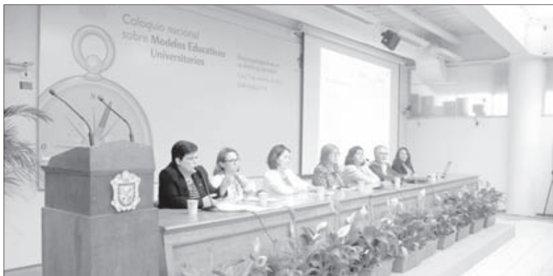
Panelistas del tema "Perspectivas globales"