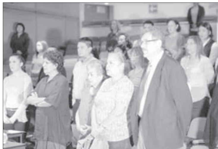
Asistentes al foro sobre prevención del consumo de drogas