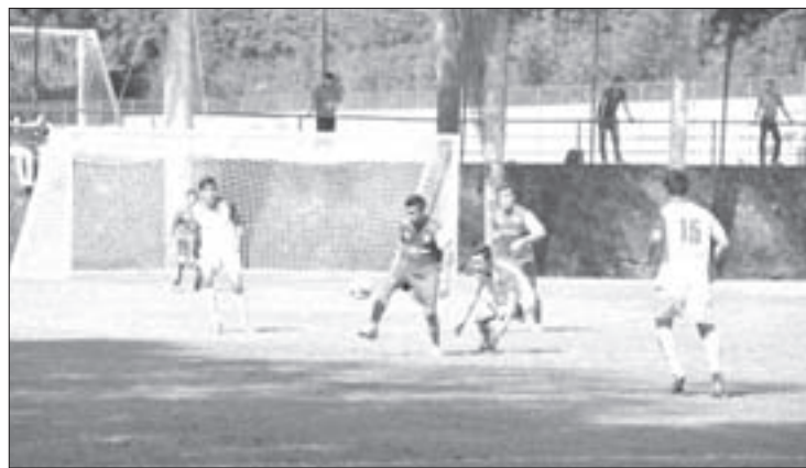
La UV no sumó y se quedó con seis puntos