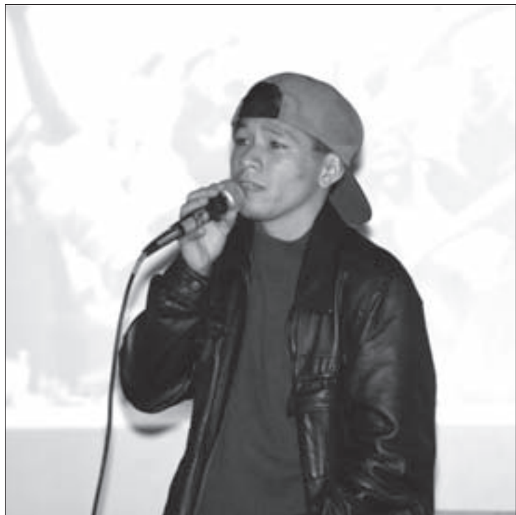
El bailarín participó en el 10° Enedac