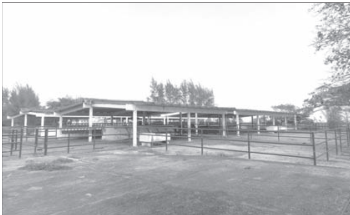
Se ubica en la carretera Veracruz-Xalapa