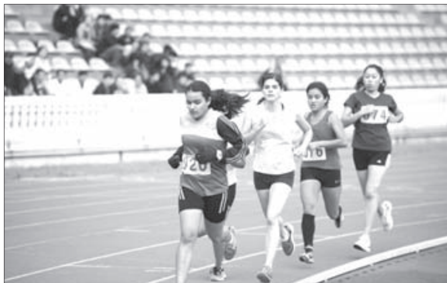
La atleta es especialista en pruebas de 800 y 1500 metros planos

El año pasado me quedé a un paso, pero ahora estoy mejor preparada”