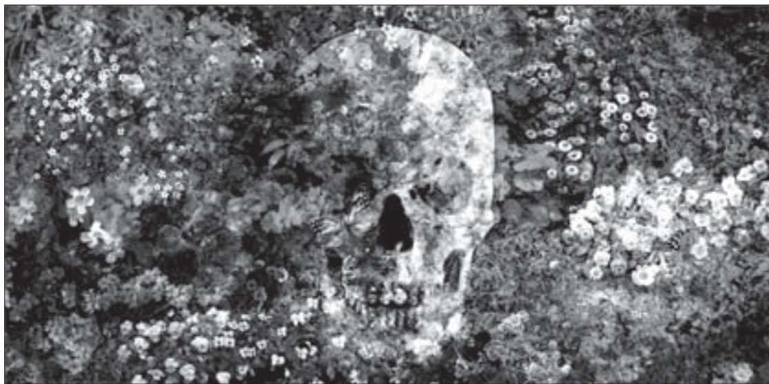
La muestra estará abierta hasta el 28 de octubre

La muestra The Dream of Vanishing estará abierta al público hasta el viernes 28 de octubre, de lunes a viernes de 9:00 a 14:30 horas. La entrada es libre.