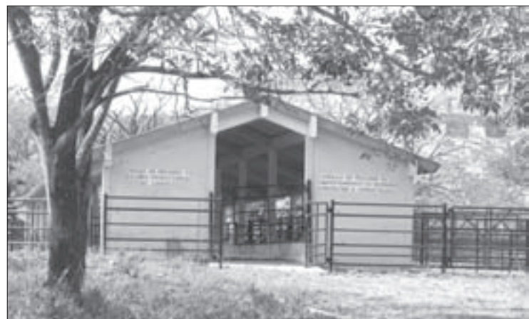
La posta inició en 1971