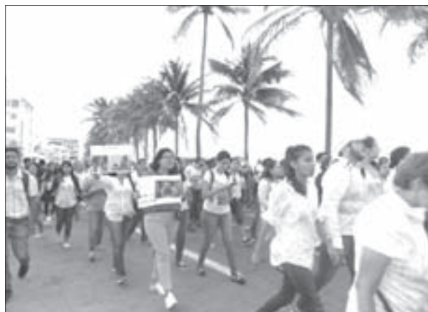
El contingente a su paso por el boulevard Manuel Ávila Camacho