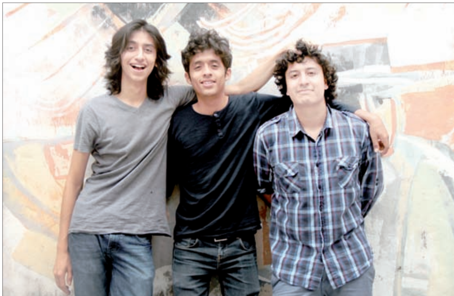
La agrupación musical Zenda

Nuestra música es muy incluyente, hay gente de todo tipo que se interesa y nos escucha; no importa la edad para que se sientan parte de nosotros. El público percibe la sinceridad en nuestras composiciones y ésa es la idea general.