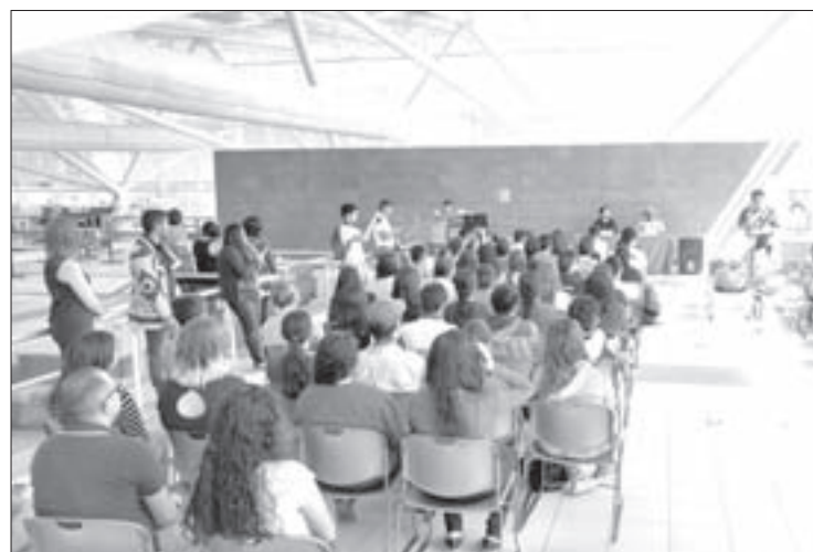
La presentación se realizó en la USBI