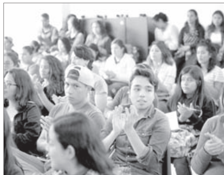
Asistentes a la 2ª Jornada del Área de Conocimiento Pedagógico