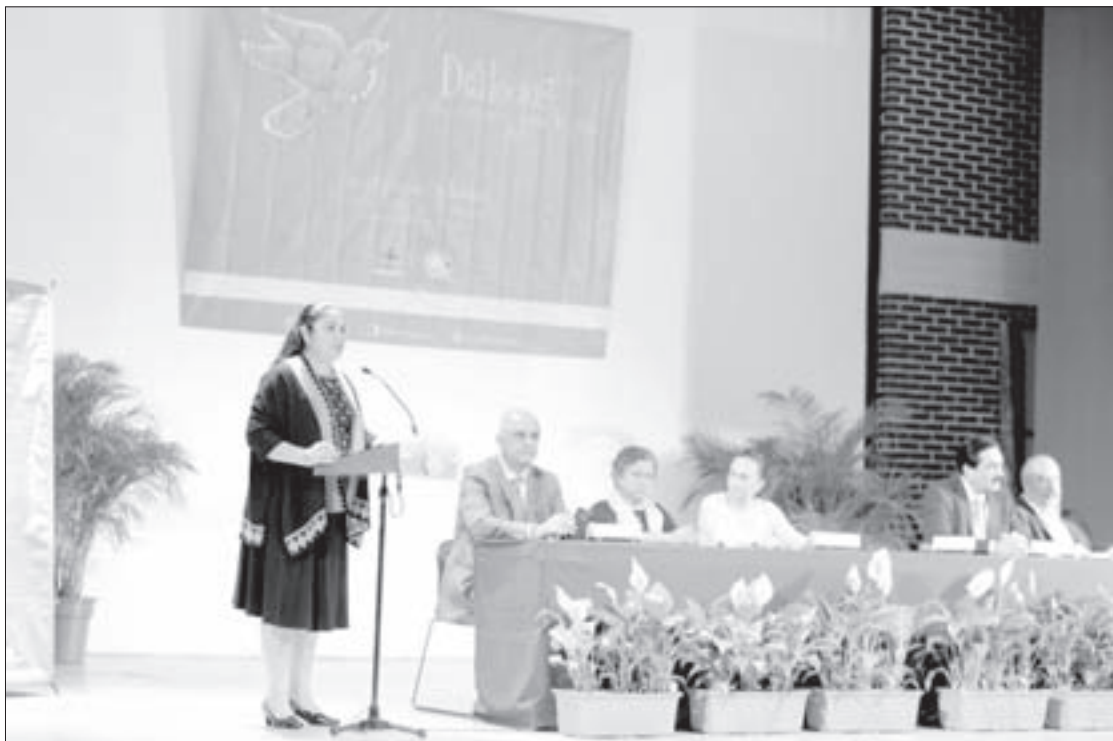
La Rectora expresó que la apuesta de la institución es combatir el miedo y el silencio

Después de leer un extracto del ensayo de Albert Camus, titulado "Ni víctimas ni verdugos", publicado en Combat (periódico clandestino), la Rectora dijo que esta casa de estudio es digna heredera de la línea de pensamiento y de conducta de dicho escritor francés, al ser un espacio natural para el ejercicio de