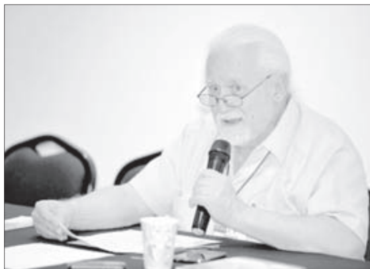
La investigación es indispensable para el desarrollo humano, señaló el experto

También tiende a adecuar el funcionamiento político para que contribuyan a la resolución de los conflictos intergrupales