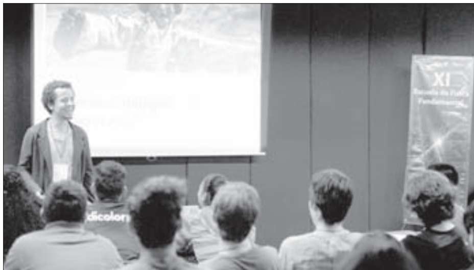
El especialista participó en la XI Escuela de Física Fundamental