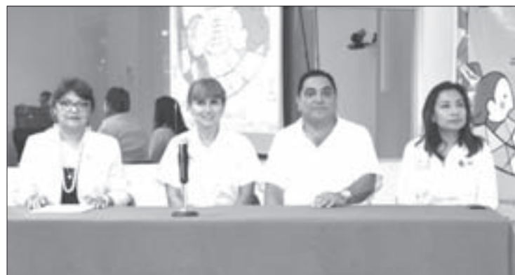
Autoridades universitarias y del Instituto Municipal de la Mujer

“Es muy importante generar espacios para la recreación y el diálogo, y compartir las