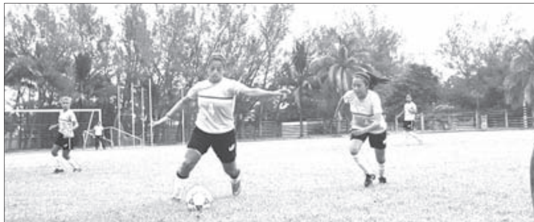
En Fútbol Soccer Femenil se impuso a Xalapa y Orizaba-Córdoba