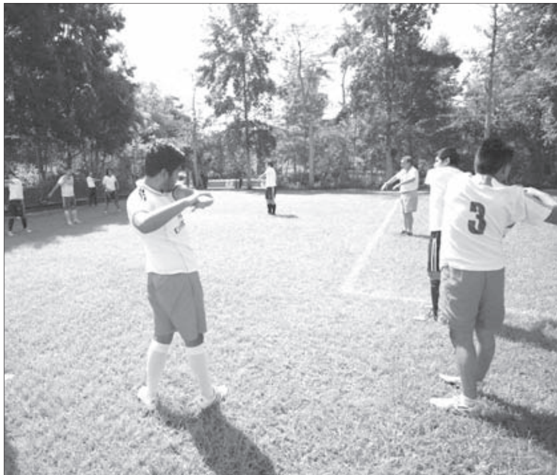
En el curso del AFEL participan tres grupos