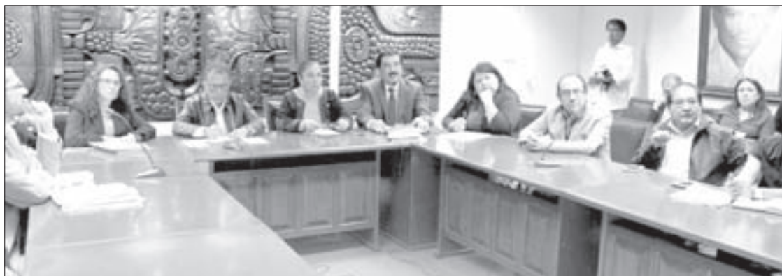
Autoridades universitarias presentaron resultados preliminares