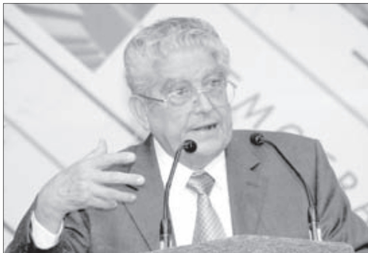
El ex Rector falleció el 7 de agosto

Asimismo, destacó su paso como presidente de la Asociación Nacional de Universidades e Instituciones de Educación Superior (ANUIES), donde “hiciera escuchar su voz firme ante la injerencia de gobiernos estatales, para legislar