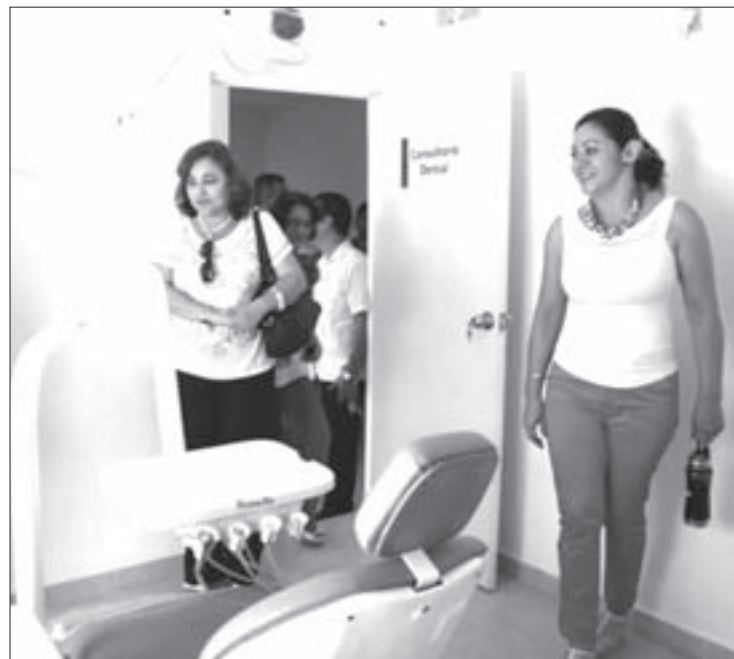
La atención se otorga en dos módulos periféricos

El paciente llega al servicio general para realizarse extracciones de emergencia, además de amalgamas, resinas, y si hay casos de cirugía –que es algo más complejo–