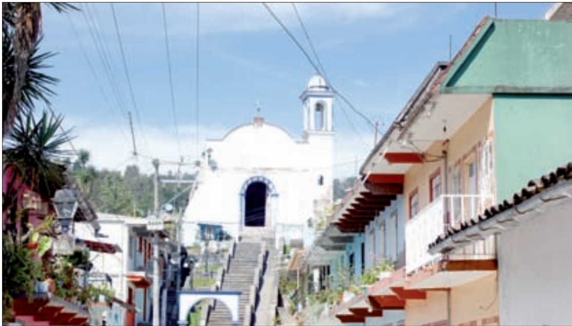
Profesores y estudiantes elaboraron proyecto para que el municipio obtenga la denominación de Pueblo Mágico