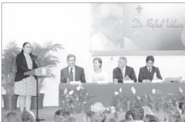
La Rectora lo definió como un funcionario íntegro y vertical

a nivel constitucional el principio y el ejercicio real de la autonomía universitaria, el compromiso público de un financiamiento universitario seguro”.