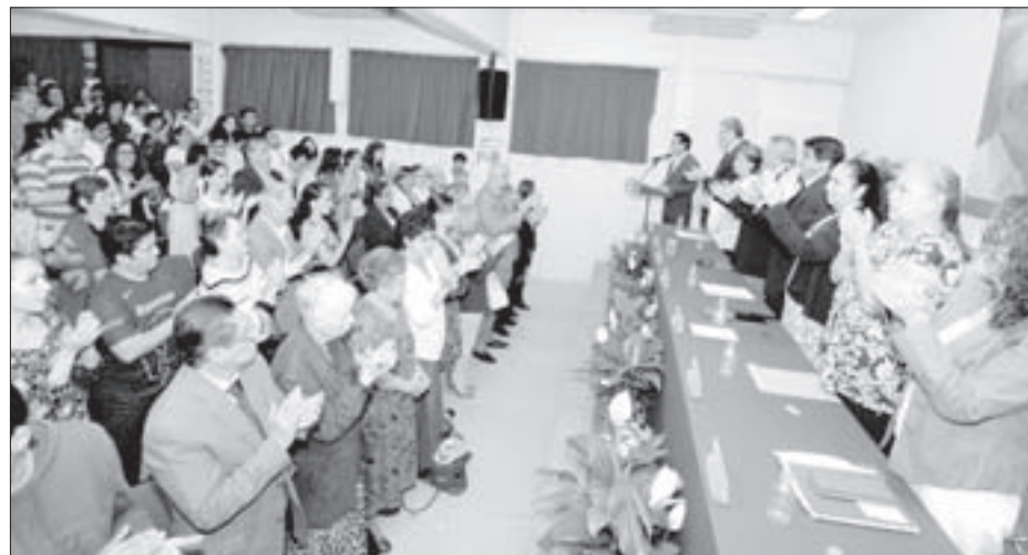
La concurrencia le brindó un minuto de aplausos