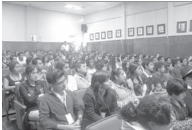
La inauguración del curso rebasó las expectativas