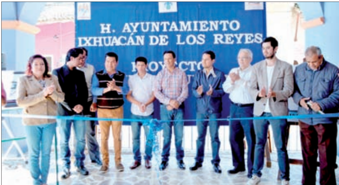
Entrega de la propuesta a las autoridades