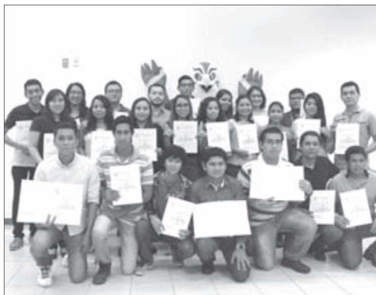
En total se otorgaron 32 reconocimientos