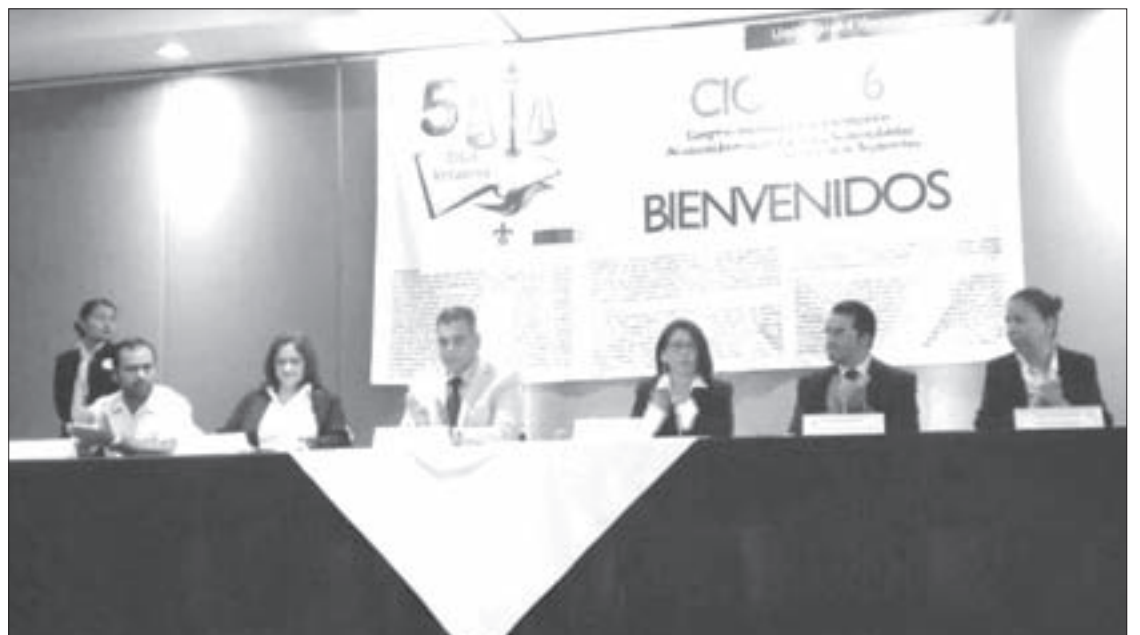
Autoridades universitarias en la inauguración

La funcionaria planteó que la investigación enriquece la formación universitaria, pues a través de ella se generan nuevos conocimientos. Asimismo, habló de que en la actualidad no sólo se lee para redundar, analizar y pensar, también se hace para crear, para el fortalecimiento de la habilidad como producto de las bases del aprendizaje, conocimientos de otras teorías y llevarlas a la práctica, destacó.