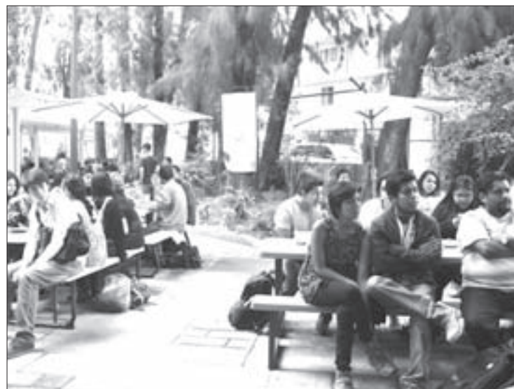
El público disfrutó del concierto