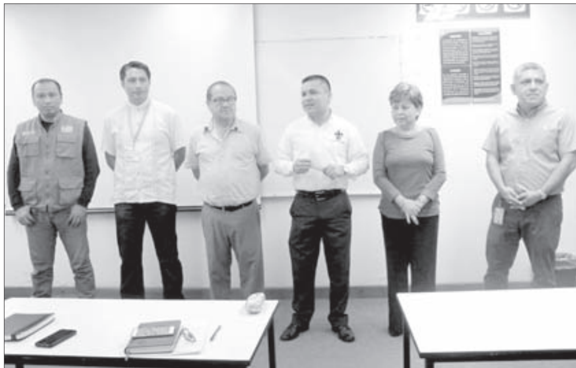
Inauguración de los talleres