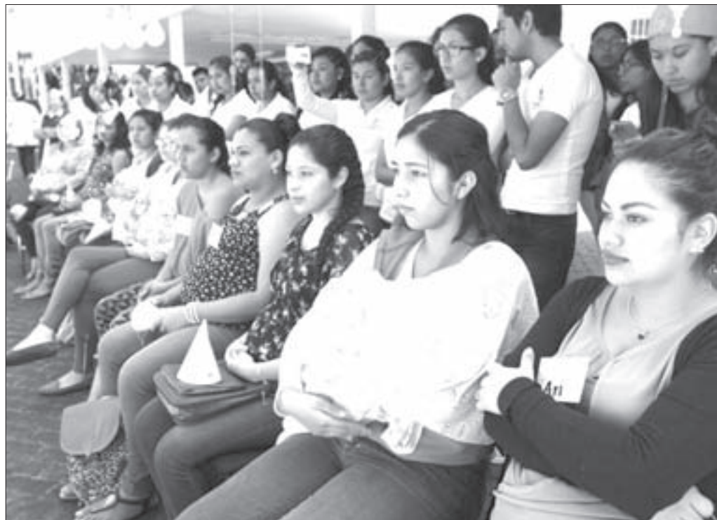
Desde 2012 el programa ha atendido a 160 estudiantes de diversas facultades