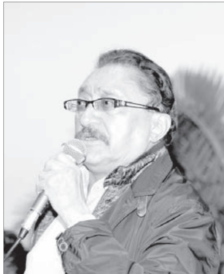
El escritor participó en Diálogos Interdisciplinarios por la Paz

Este panorama, indicó, ha propiciado que en México el periodismo se haya burocratizado: la investigación periodística se basa y sustenta en documentos oficiales; los reporteros carecen de una visión amplia sobre lo que investigan, sólo repiten, transmiten o