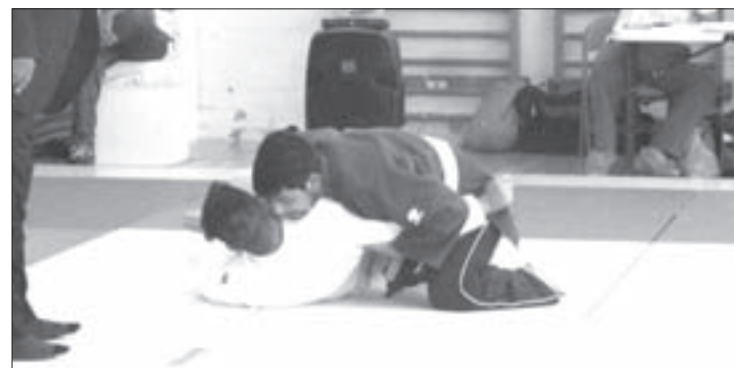
Participaron estudiantes que acuden a los cursos del AFEL