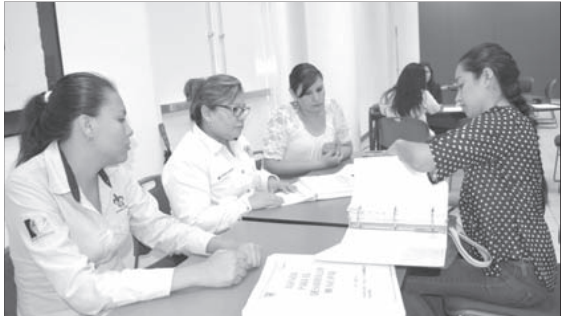
Representantes del municipio de Tihuatlán se presentaron a la evaluación

Sobre cómo realizan la evaluación, comentó que los representantes de dichos municipios presentan una serie de documentos de los siguientes indicadores: planeación del territorio, servicio público, seguridad pública, desarrollo