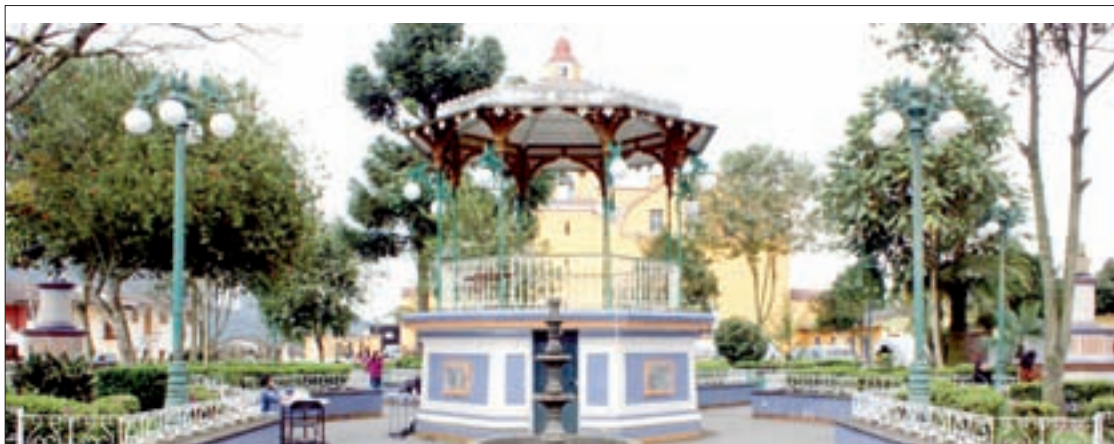
El proyecto tiene como finalidad mejorar la imagen del municipio