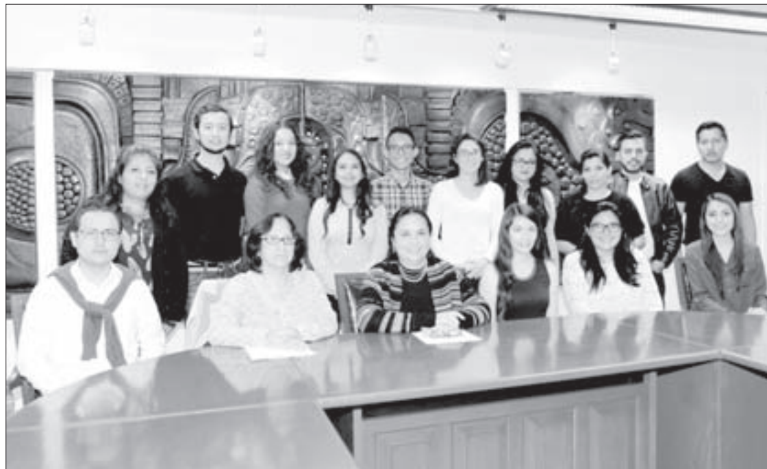
Los jóvenes seleccionados por “Proyecta 100 Mil” visitaron a la Rectora