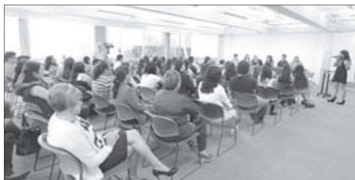
La presentación tuvo lugar en la USBI Xalapa