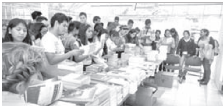
Universitarios adquirieron obras de calidad a bajo costo

Esta actividad se repitió al siguiente día en la Casa de la Cultura de Huatusco, con gran