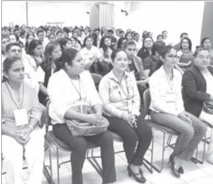
El objetivo fue compartir experiencias a nivel comunitario y hospitalario

Por su parte el Vicerrector señaló que “la Universidad