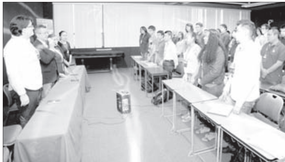
El ejercicio académico se realizó en la Facultad de Arquitectura