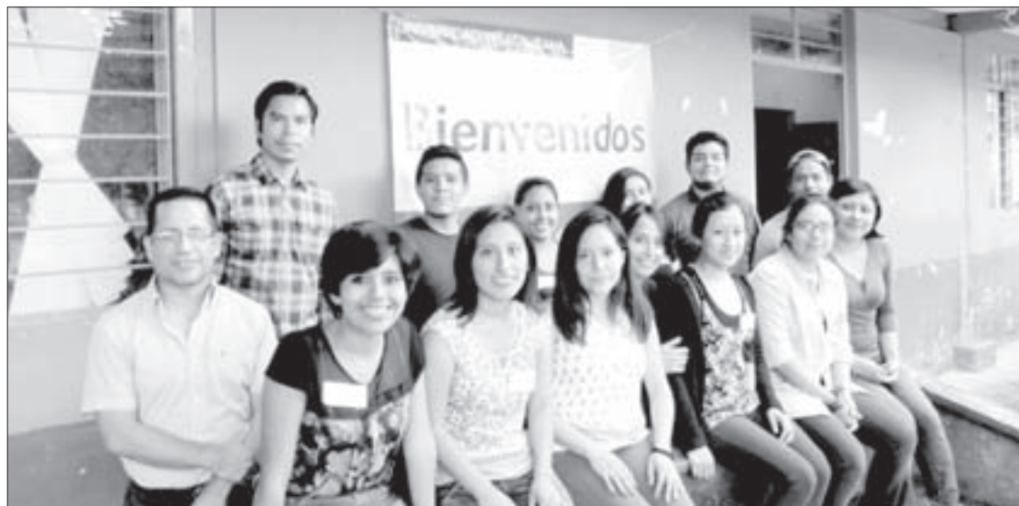
Participan estudiantes de Pedagogía, Psicología, Lengua Inglesa e Ingeniería Civil