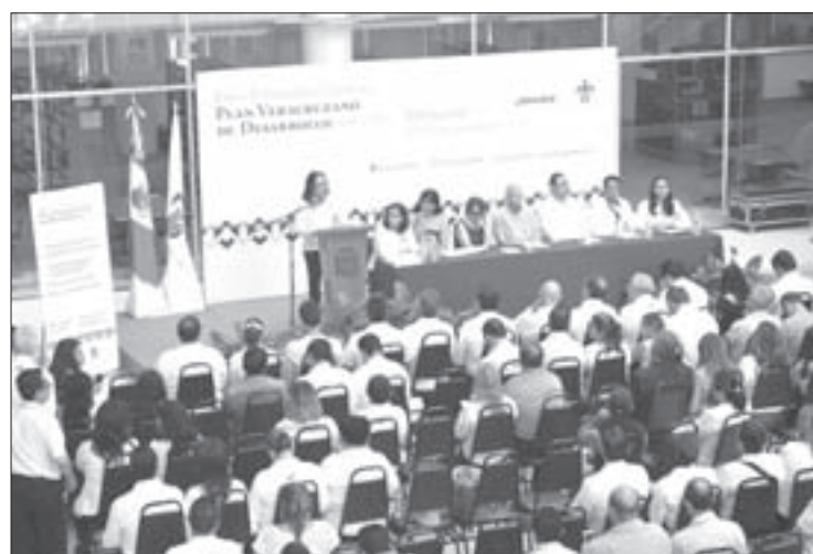
Los ponentes hablaron sobre participación ciudadana y estado de derecho

En el eje Reorganizar las instituciones para fortalecer