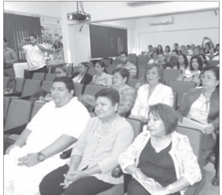
Las facultades de Xalapa y Veracruz convocaron a sus ex alumnos

Por su parte, Flor del Carmen Daberkow agradeció el apoyo y las facilidades otorgadas para la realización del foro, y en