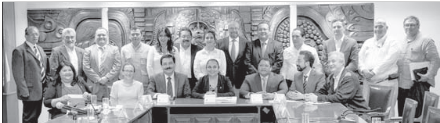
Los funcionarios reiteraron su respaldo a la institución