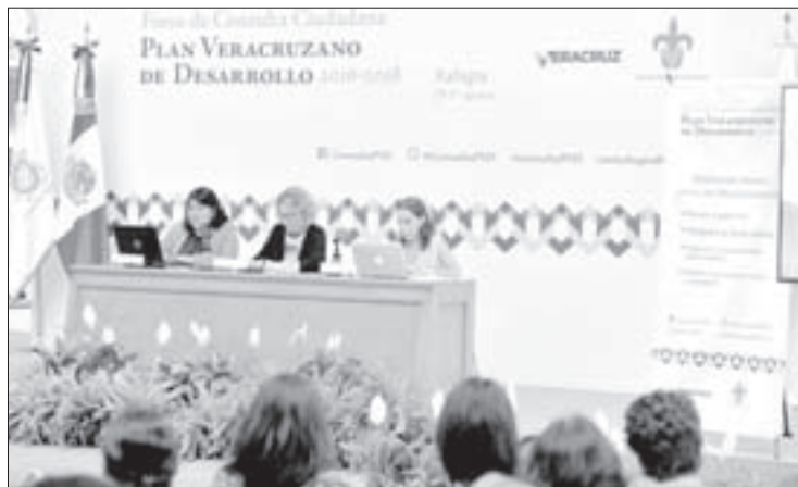
La Mesa "Renovar la gobernanza" registró 25 propuestas