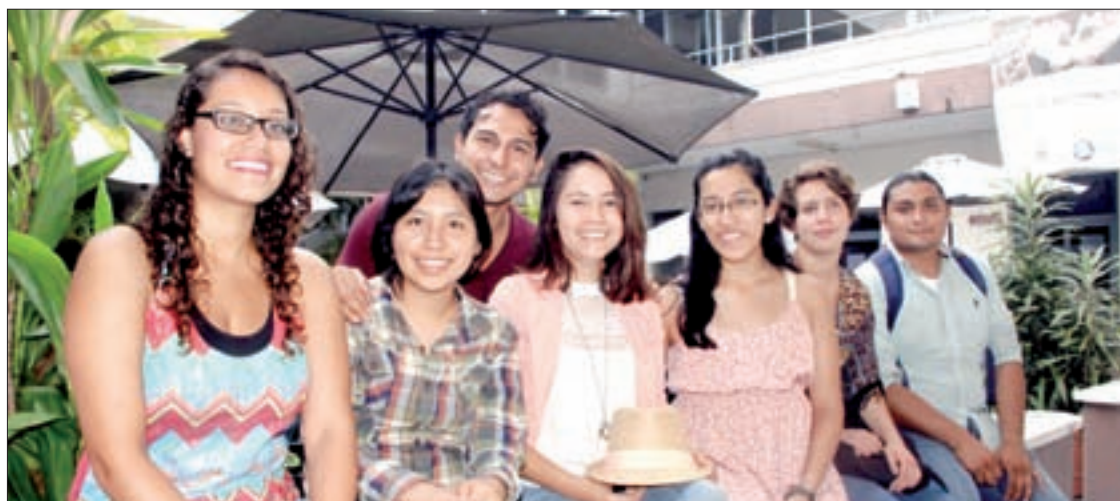
La UV también recibió a 39 estudiantes nacionales