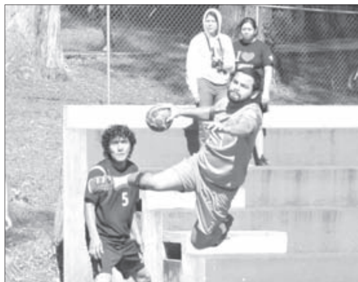
El objetivo es dar mayor impulso a este deporte

Los entrenamientos se llevan a cabo de lunes a viernes en la cancha anexa a la Alberca Universitaria o en el Gimnasio "Miguel Ángel Ríos Torres", a partir de las 16:00 horas.