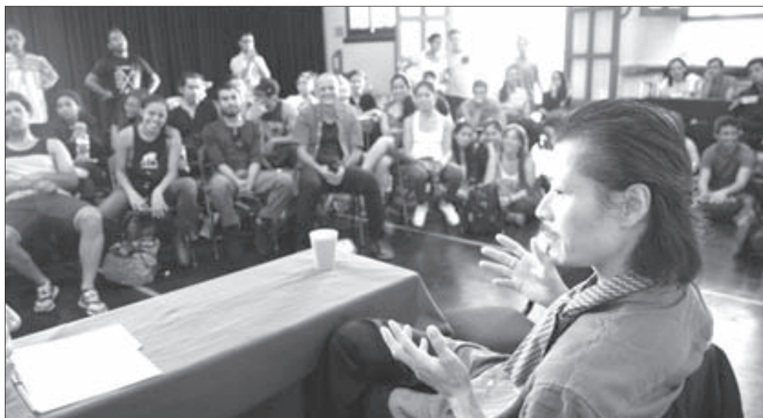
El bailarín y coreógrafo charló con estudiantes

“Todo es caro en Japón, incluso el arte, pero las personas ahora son atrapadas por otro tipo de cultura que es la tecnológica, lo que ha ocasionado que poco a poco dejen de asistir a eventos culturales. Yo no uso teléfono celular, nunca lo he usado porque no me gusta, me da miedo llegar a perder sensibilidad sobre lo que me rodea.”