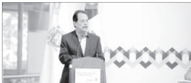
El investigador llamó a repensar la participación ciudadana

Además, consideró indispensable garantizar la participación ciudadana en todas las esferas y espacios, así como darles autenticidad y representatividad a las instancias conformadas por la sociedad: “Particularmente, los consejos