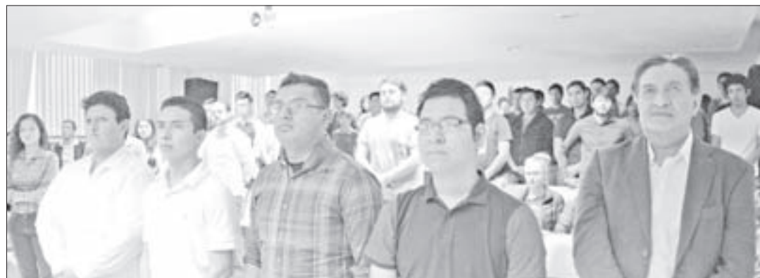
Los universitarios formarán parte de la Sección 9 de América Latina

Después de enunciar la sinopsis histórica del instituto, cuyos inicios datan de 1884, García Guzmán resaltó la trascendencia de la conformación de una directiva como la que rindió protesta. Se trata de la inclusión de estudiantes en un complejo mecanismo de alcances importantes, con los beneficios que ello conlleva como acceso a su amplia biblioteca digital y apoyo en la elaboración de sus planes de trabajo.