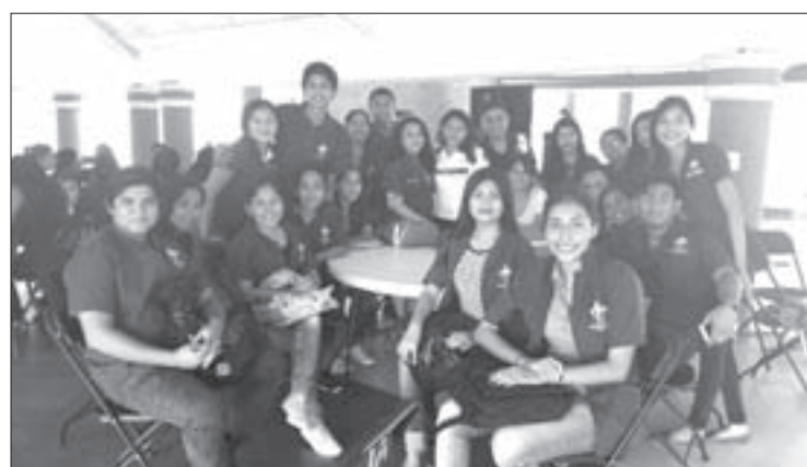
Los jóvenes realizaron actividades académicas, culturales y deportivas