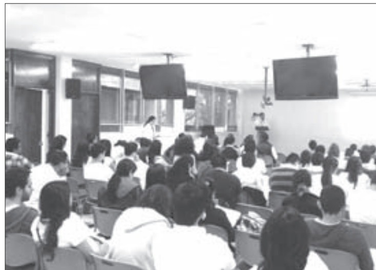
Alumnos en el curso-taller sobre farmacovigilancia