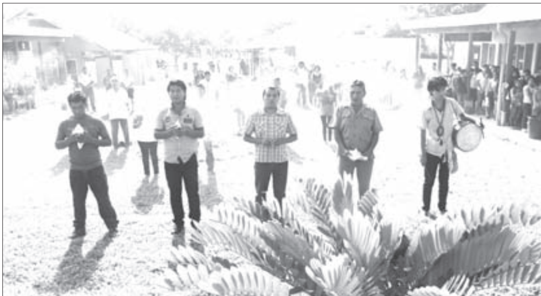
El evento inició con el ritual de los cuatro puntos