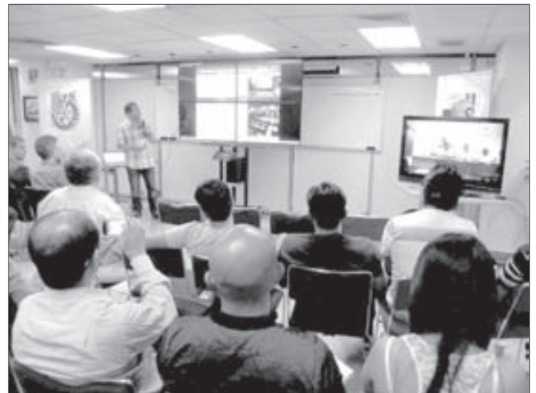
El Laboratorio de Cómputo de Alto Rendimiento organizó la actividad

Entre los temas que se abordaron destacan: “Laboratorios virtuales de la UV” y “Mejora en