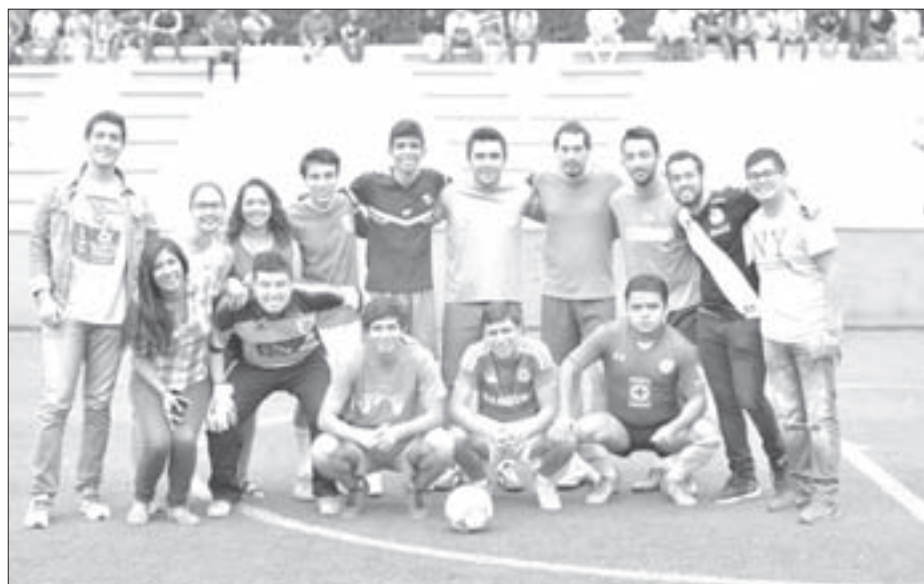
Gestión 600, segundo lugar