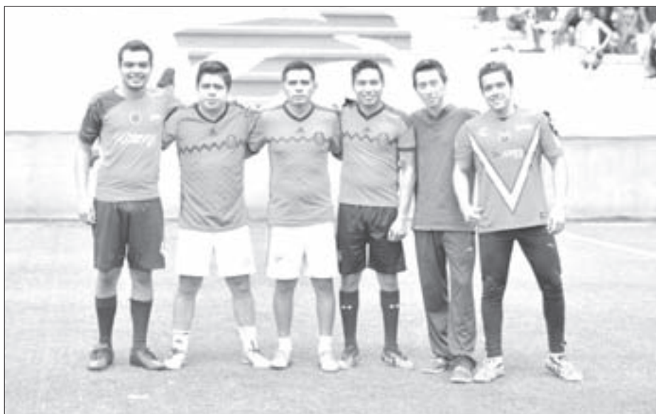
Boca Friends, el campeón