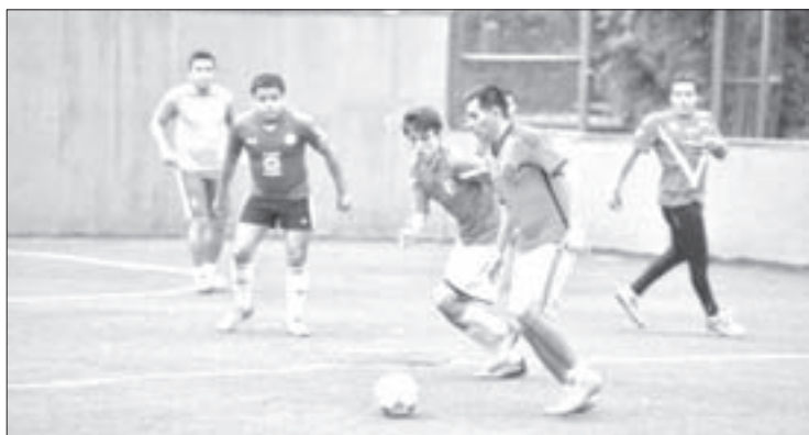
Los finalistas mostraron buen nivel

En la final de fútbol rápido se impuso 4-2 a Gestión 600