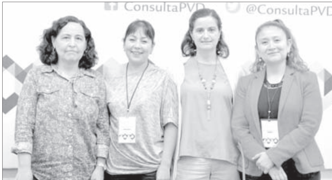
Integrantes de la Comisión de Equidad de Género