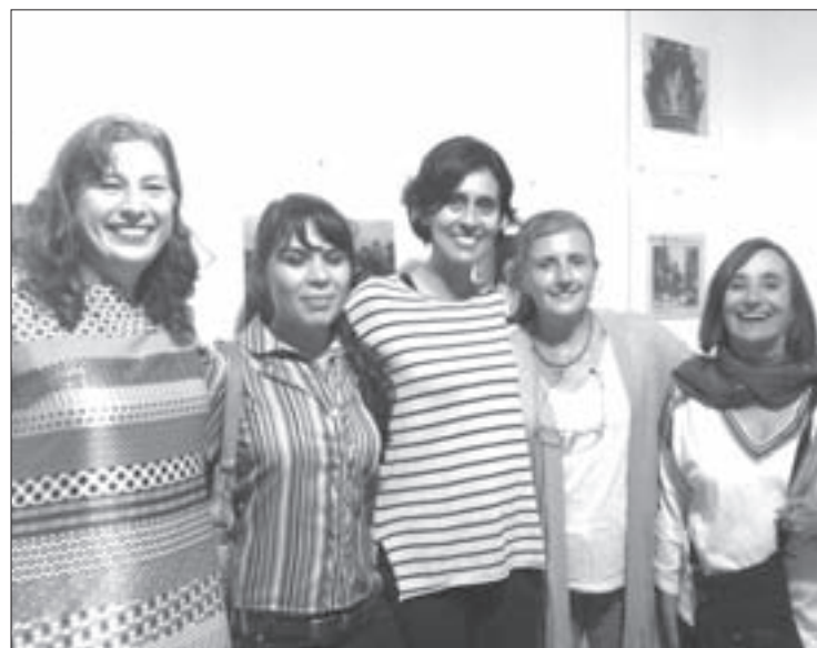
Participantes en la mesa “Mujeres cineastas en México”