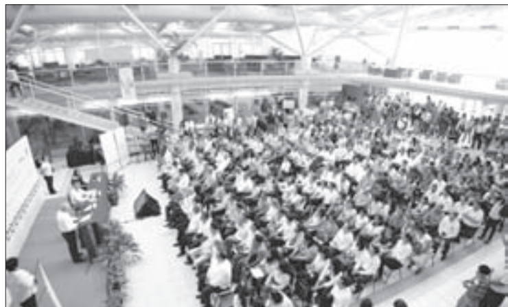
Se escucharon todas las voces y opiniones