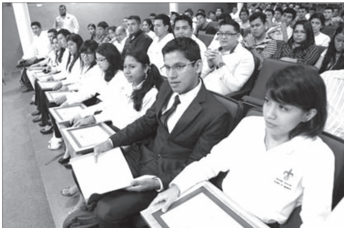
Los jóvenes seleccionados por American Bureau of Shipping