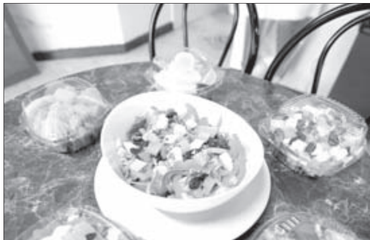
Ofrece menús y platillos saludables