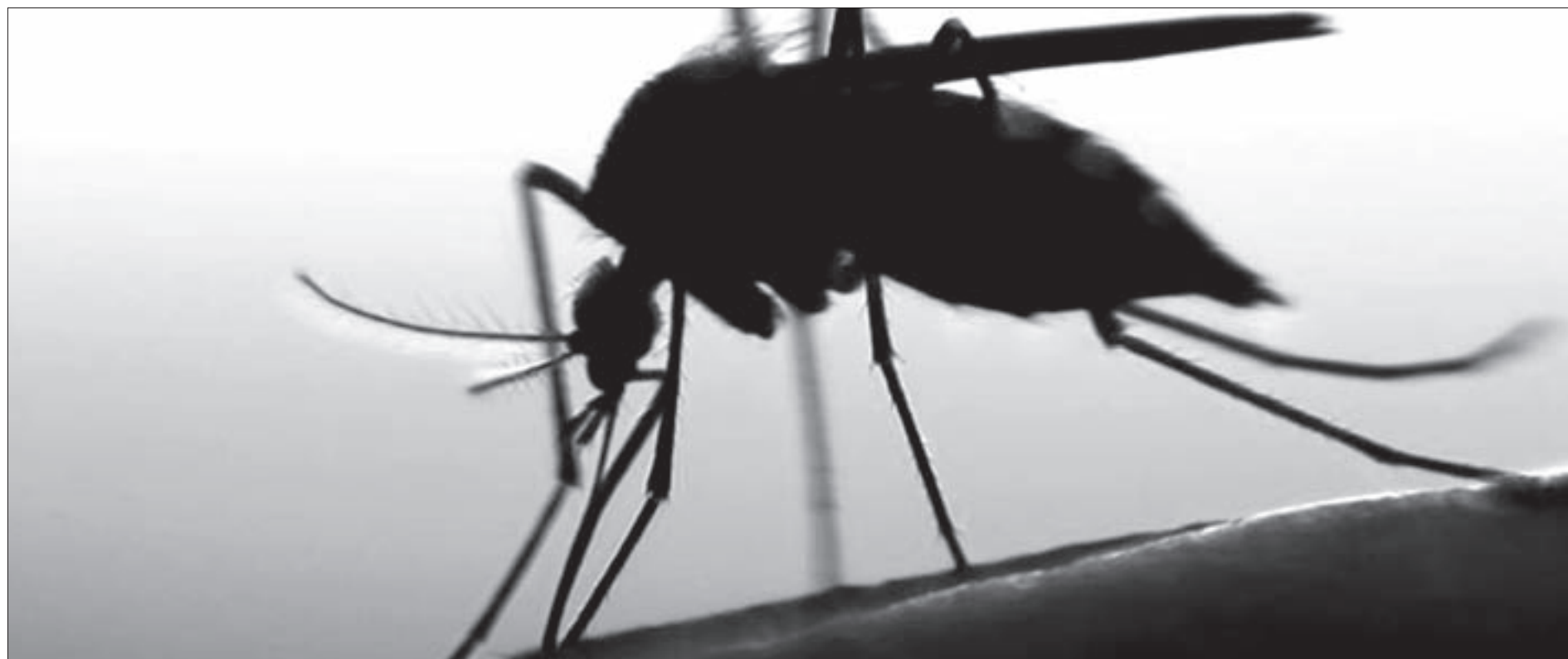
Se contempla investigar la variabilidad entre los virus del dengue y del zika