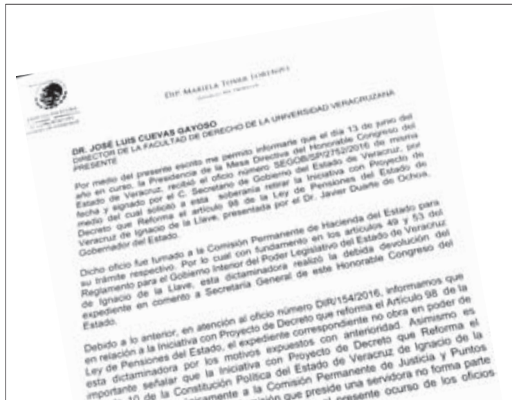
El 13 de junio, el Congreso del Estado recibió el oficio

Gestiones de la UV, postura del CUG y expresiones de la comunidad incidieron en ello