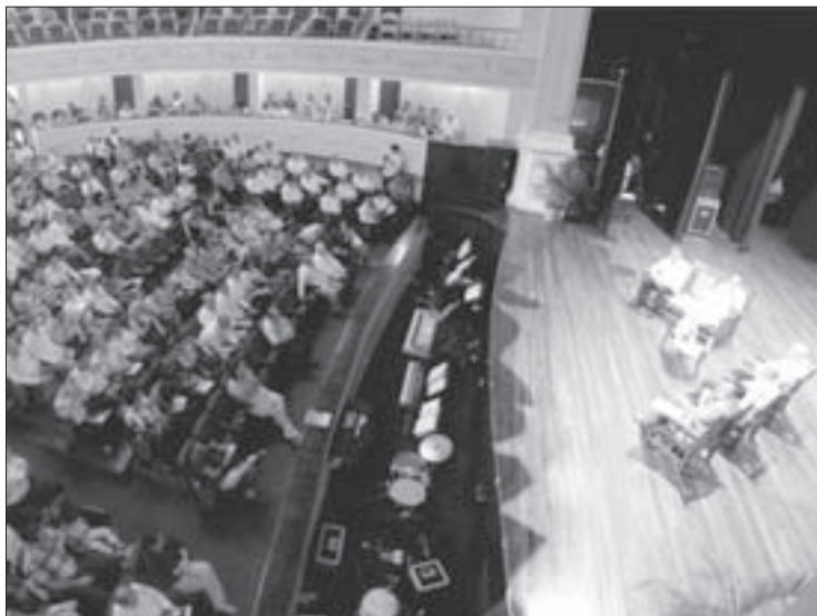
El evento se efectuó en el Teatro Clavijero

Ahí, la Rectora celebró el esfuerzo de un amplísimo equipo de trabajo que hizo posible la