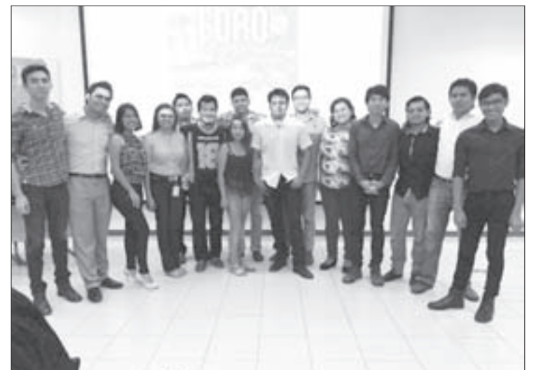
Grupo de estudiantes de la EE Diversidad Cultural

“La EE Diversidad Cultural cumple con el objetivo de