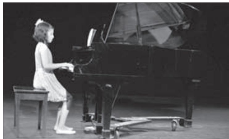
Un músico se forma estudiando y en el escenario

Al preguntarle sobre la primera vez que vio a su hija en el escenario, dijo: “Fue muy emocionante y ambas nos ponemos muy nerviosas, pero es hermoso ver que supera el miedo y enfrenta el escenario para demostrar sus habilidades.”