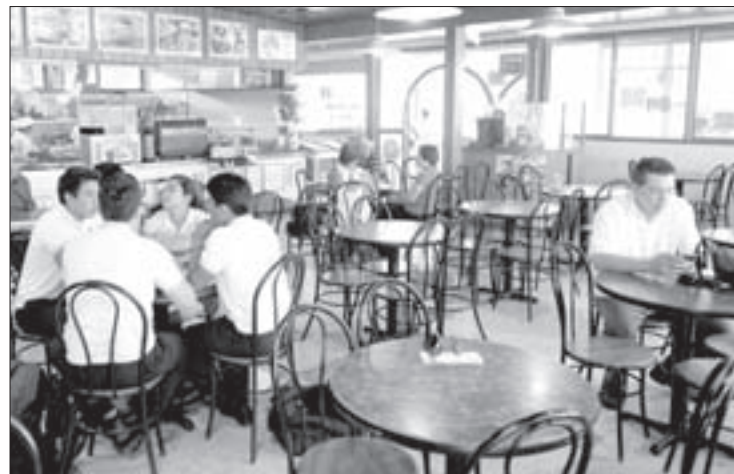
Atiende a cerca de 300 comensales diariamente