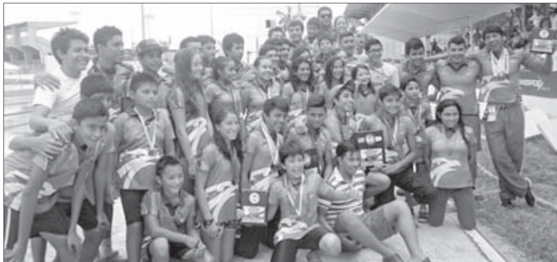
Dominaron en la puntuación general y en el medallero

Con esto, la representación de los Halcones que acudió a dicha justa con el respaldo de la Dirección de Actividades Deportivas de la UV, clasificó con carro completo al Campeonato Nacional Curso Largo de Natación en Morelia, Michoacán.