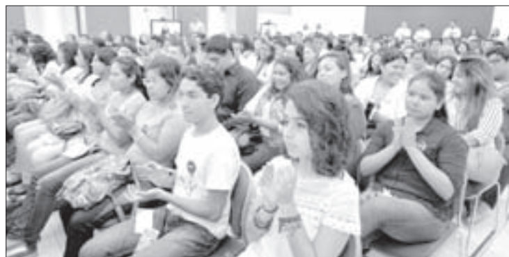
Estudiantes de las cinco regiones participaron en la actividad

Con esta premiación concluyeron las actividades correspondientes al evento Imagina, Innova y Emprende.