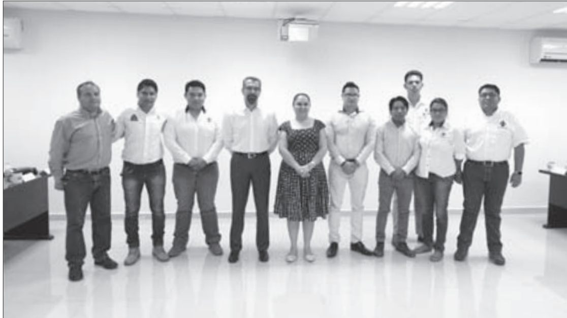
La Rectora acudió a la presentación del proyecto

UV y TNG colaboran en proyecto que facilitará la exploración submarina en barcos