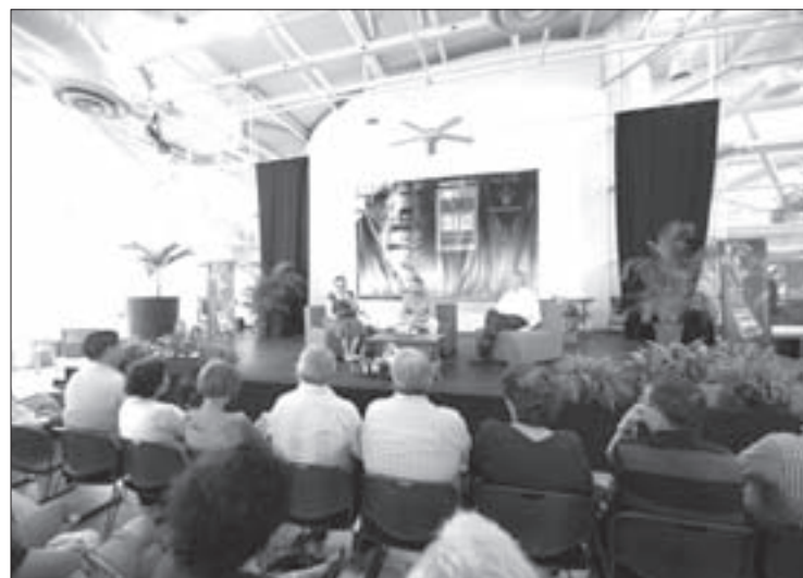
Numeroso público acudió al Reflexionario Mocambo

Al igual que en Veracruz, el escritor estableció un diálogo con la audiencia presente en el auditorio del MAX en el que se refirió, por ejemplo, a la necesidad de