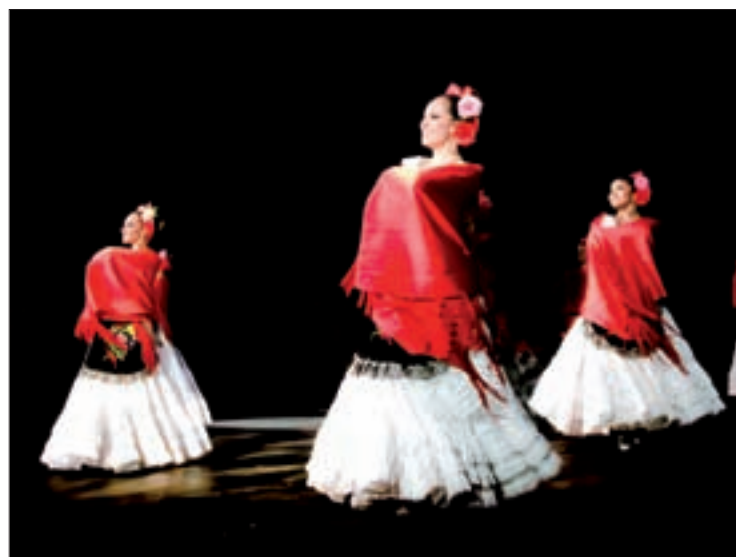
Muchos de los bailarines provienen de otros estados

La convocatoria cierra a finales de este mes y la audición para ocupar becas para el periodo Agosto 2016-Enero 2017 se llevará a cabo el viernes 1 de julio de 2016 a partir de las 10:00 horas, en el salón de ensayo del grupo, ubicado en el Teatro del Estado “Ignacio de la Llave”.