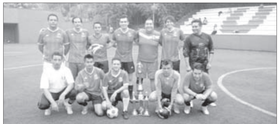
Deportivo Chema, digno subcampeón