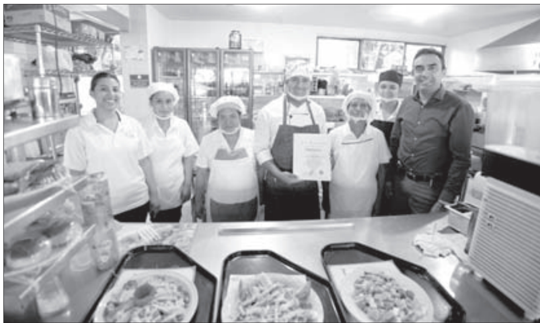
La cafetería de la UCS obtuvo un distintivo de la Secretaría de Salud

Diariamente, dentro del menú se ofrece una variedad de platillos, como crema de zanahoria, sopa de habas, calabacitas a la mexicana, guarnición de arroz, postre de gelatina y aguas frescas con frutas de la temporada: pepino con limón, guayaba, sandía y naranja 100 por ciento natural.