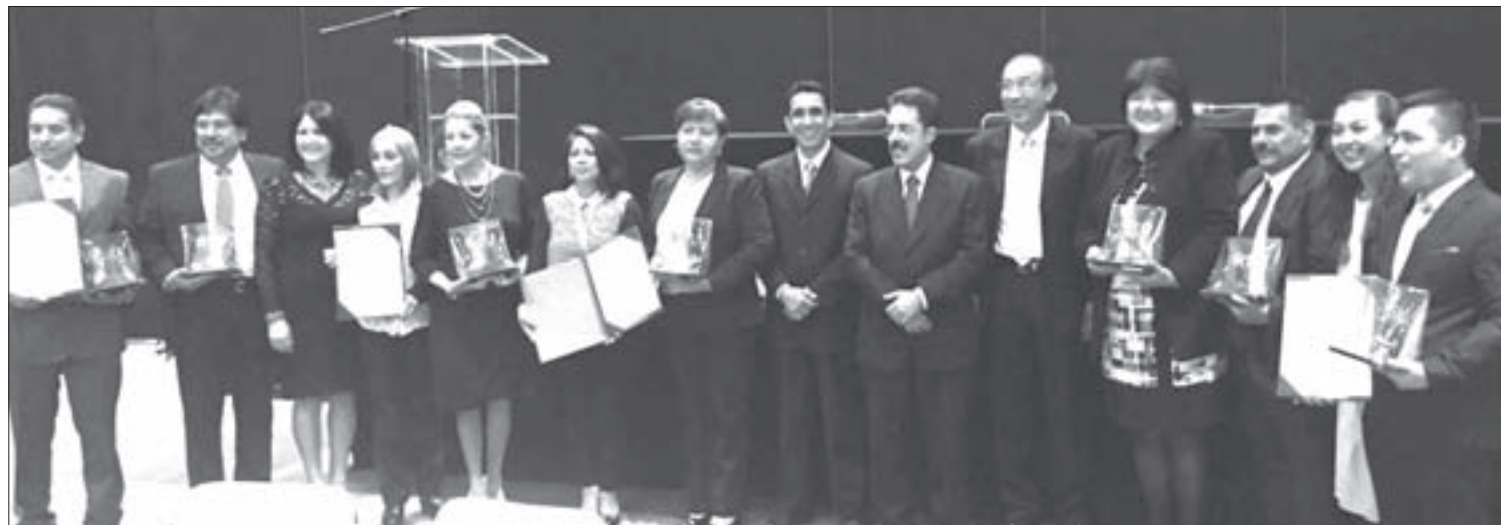
Los representantes de la UV en la entrega del distintivo RSU