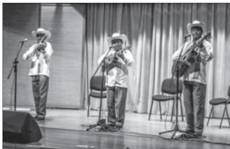
Para festejar su aniversario, realizan una serie de conciertos

Para él, al trío Tlayoltyiane le tocó dar el paso difícil, pues incluso ellos de niños fueron discriminados por su origen, pero a la fecha mucha gente no sólo de Veracruz sino del país reconoce y gusta de este género musical. “La Universidad también ha sido un impulso, porque atrae gente de la Huasteca para que se venga a capitalizar aquí”.