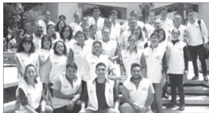
Los Guardianes de la Salud son parte fundamental de la campaña

Como parte de la campaña "A quitarnos un KILO de encima, la familia y la UV nos necesitan", el Sistema de Atención Integral a la Salud de la Universidad Veracruzana (SAISUV) lleva a cabo pláticas de educación para la salud y orientación nutricional, de manera itinerante, en las dependencias y entidades académicas, con la finalidad de contribuir a la toma de decisiones y fomentar estilos de vida saludable en los ámbitos de la alimentación y del ejercicio, dando seguimiento a las recomendaciones de los organismos internacionales para combatir el sobrepeso, la obesidad y las enfermedades crónicas no transmisibles.