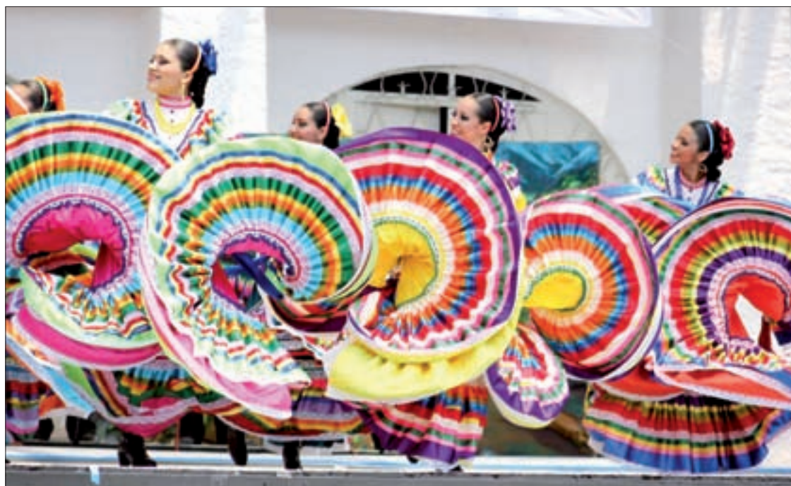
Sus integrantes muestran disciplina, constancia y actitud

“Los jóvenes deben darse la oportunidad de bailar, aunque es