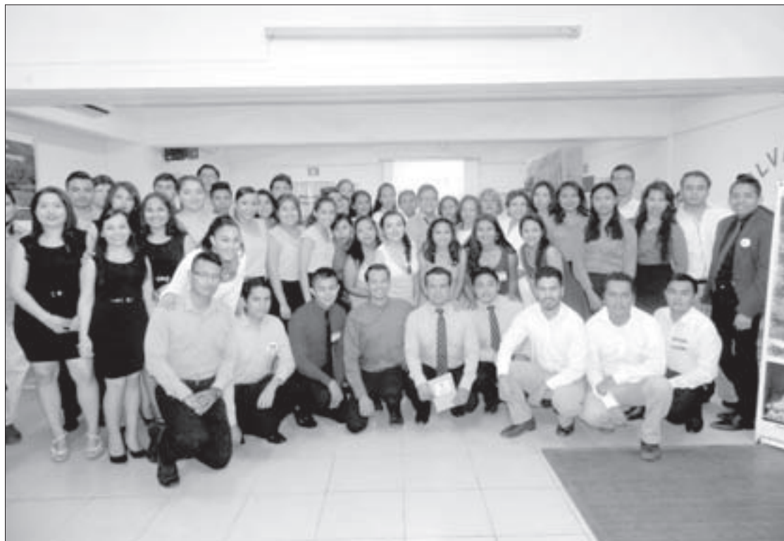
Participaron alumnos de Administración Turística y Sistemas Computacionales Administrativos