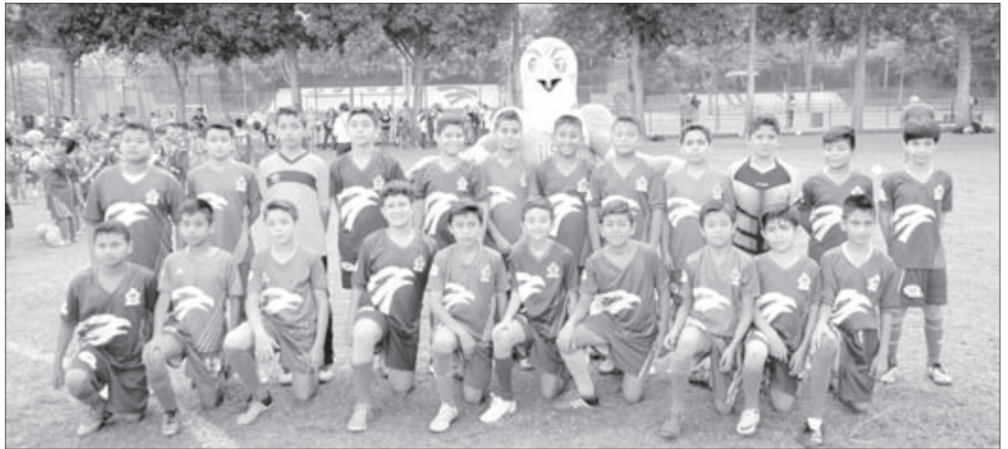
Atiende más de 240 alumnos