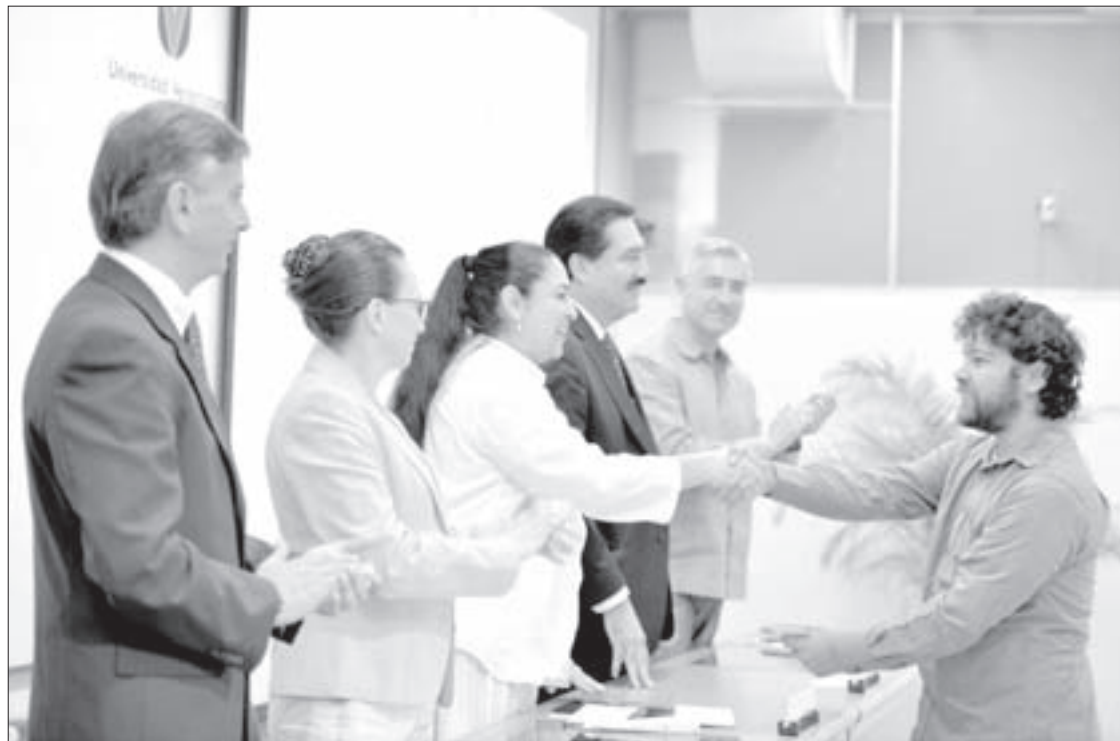
Se entregaron 470 becas escolares y 105 estímulos artísticos y académicos