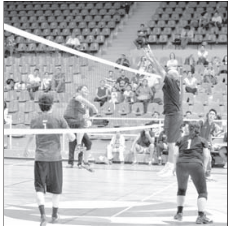
La final se jugó con gran intensidad