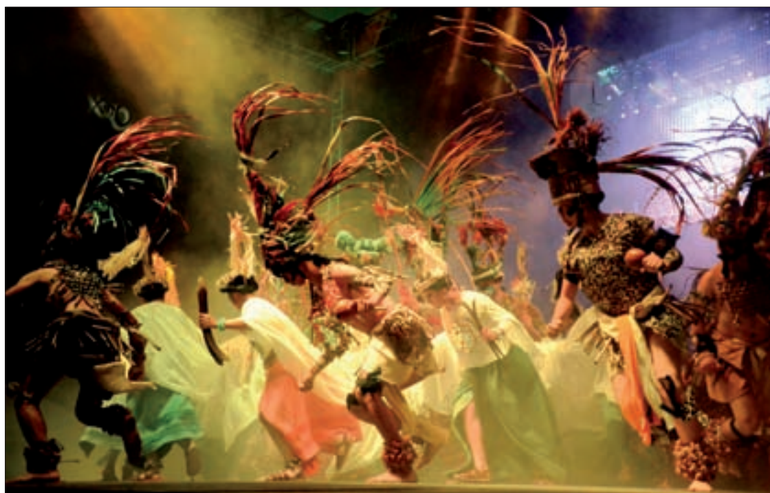
Cada presentación debe ser atractiva para el espectador

un poco semejante a la audición de la película Billy Elliot , en la entrevista real como en la película, muchas veces se acepta a los candidatos porque el jurado detecta el talento.”