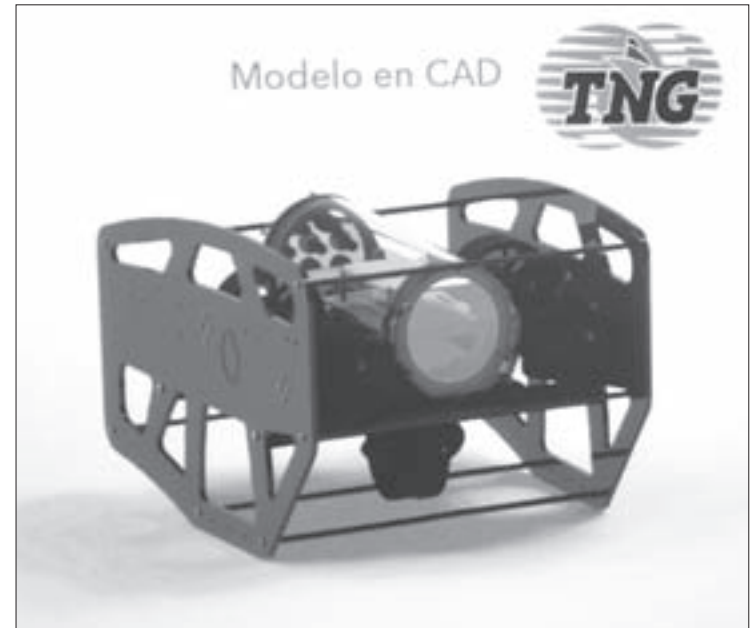
El prototipo posee tres cámaras HD

El Gerente de TNG, quien es egresado de la UV, dijo que hoy