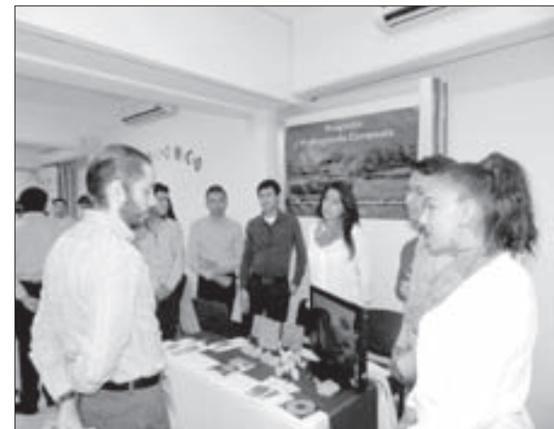
Con esta actividad concluyeron los cursos