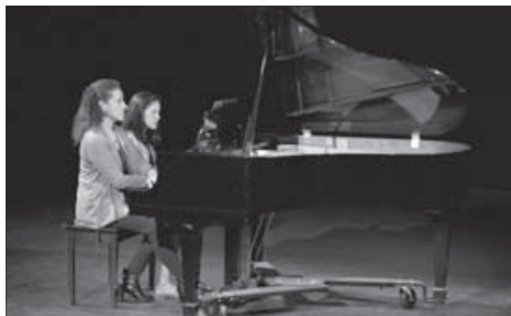
Participaron estudiantes entre los siete y 12 años

El Instituto de Investigaciones Lingüístico-Literarias pone a disposición de la comunidad universitaria sus publicaciones con 50% de descuento (excepto la Colección de Cuerpo Académico), al presentar credencial vigente.