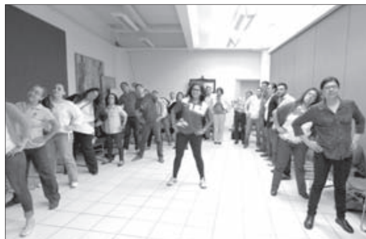
Los universitarios pueden participar en los talleres de activación física

Entre otros temas, se informa sobre los problemas que causan el exceso del consumo de sal y azúcares, y se brindan opciones para la elección de aceites y bebidas de aportes nutricionales, como las de soya, coco, almendras y arroz. En este aspecto, se cuenta con la participación del área de nutrición y atención médica del SAISUV.