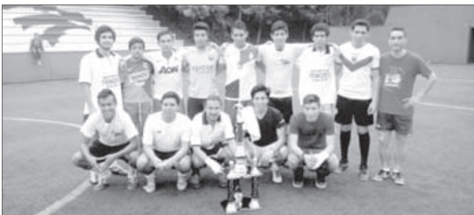
Los nuevos monarcas

Se informó que las inscripciones están abiertas para el próximo torneo, mismas que se pueden efectuar en las oficinas de la Unidad Deportiva del Campus para la Cultura, las Artes y del Deporte.