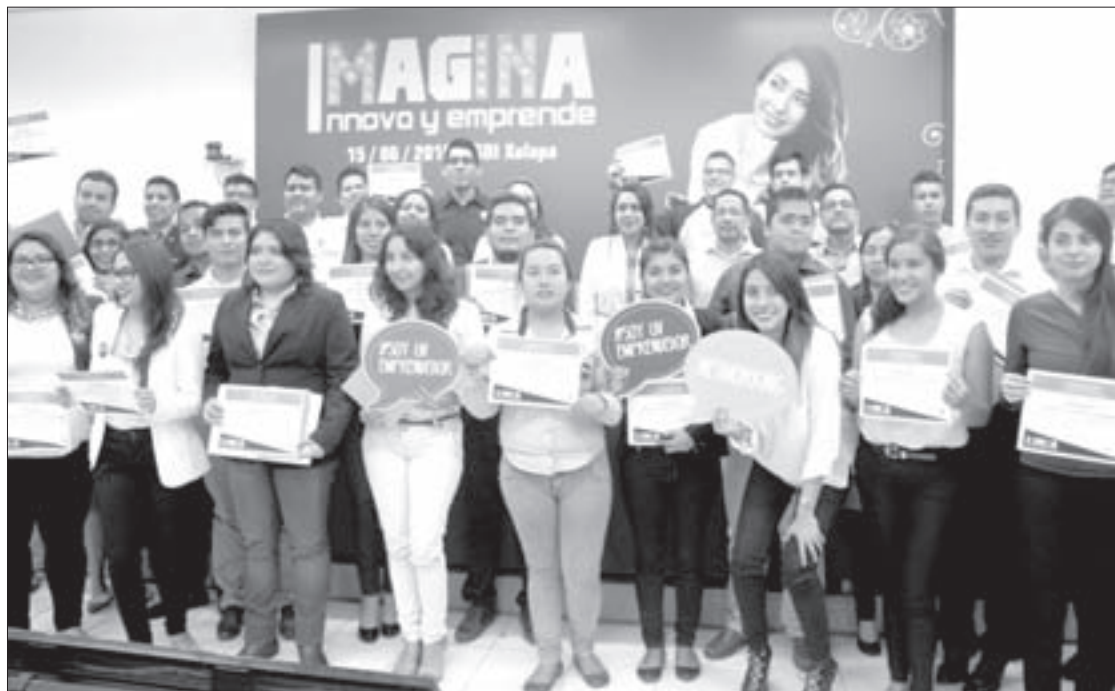
La DGV realizó el evento Imagina, Innova y Emprende

Como parte de ello se han realizado una serie de talleres y trabajo tutorial que promueve el emprendimiento empresarial. De esta actividad han surgido ferias de emprendedores, participación en concursos de emprendimiento estatales y nacionales, en los