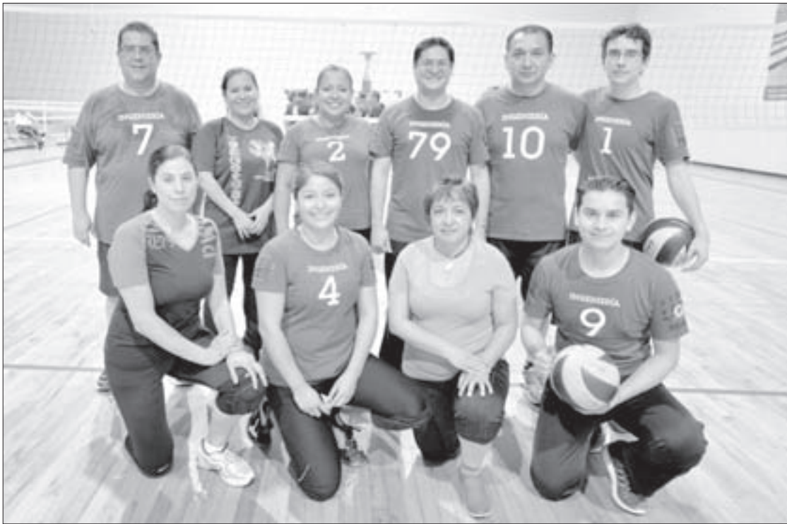
Los campeones ganaron en tres sets