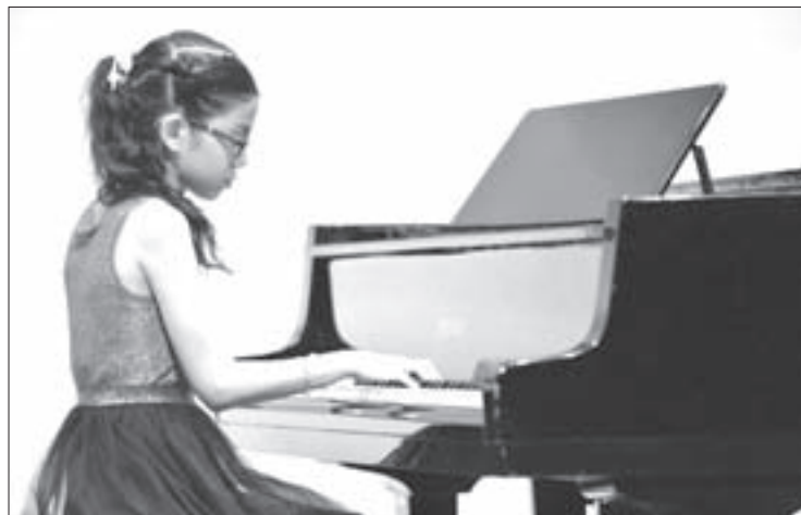
La constancia es fundamental en la formación musical de los estudiantes