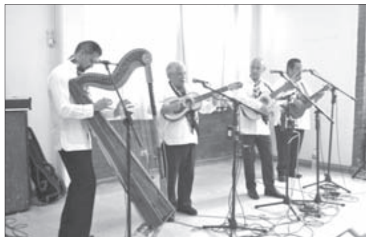
La agrupación interpretó piezas de música tradicional

Cabe destacar que Tlen Huicani es un vocablo náhuatl que significa “Los cantores” y desde su fundación en 1973 se han dedicado a estudiar y difundir el patrimonio