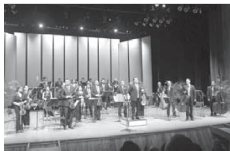
La OUMP participará en "Tlaqná foro abierto; música y paisaje"