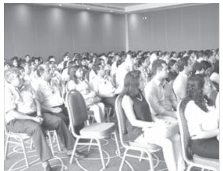
Las actividades concluyeron con la asamblea de la Zona 6 Sur