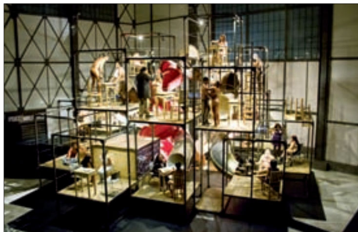
Psico/Embutidos , espectáculo escénico interactivo