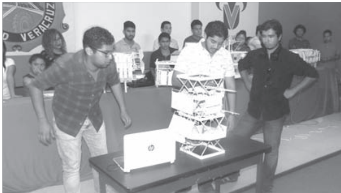
Participaron estudiantes de Arquitectura, Mecatrónica y Electrónica

Incorporaron mecanismos a maquetas realizadas por estudiantes de Arquitectura