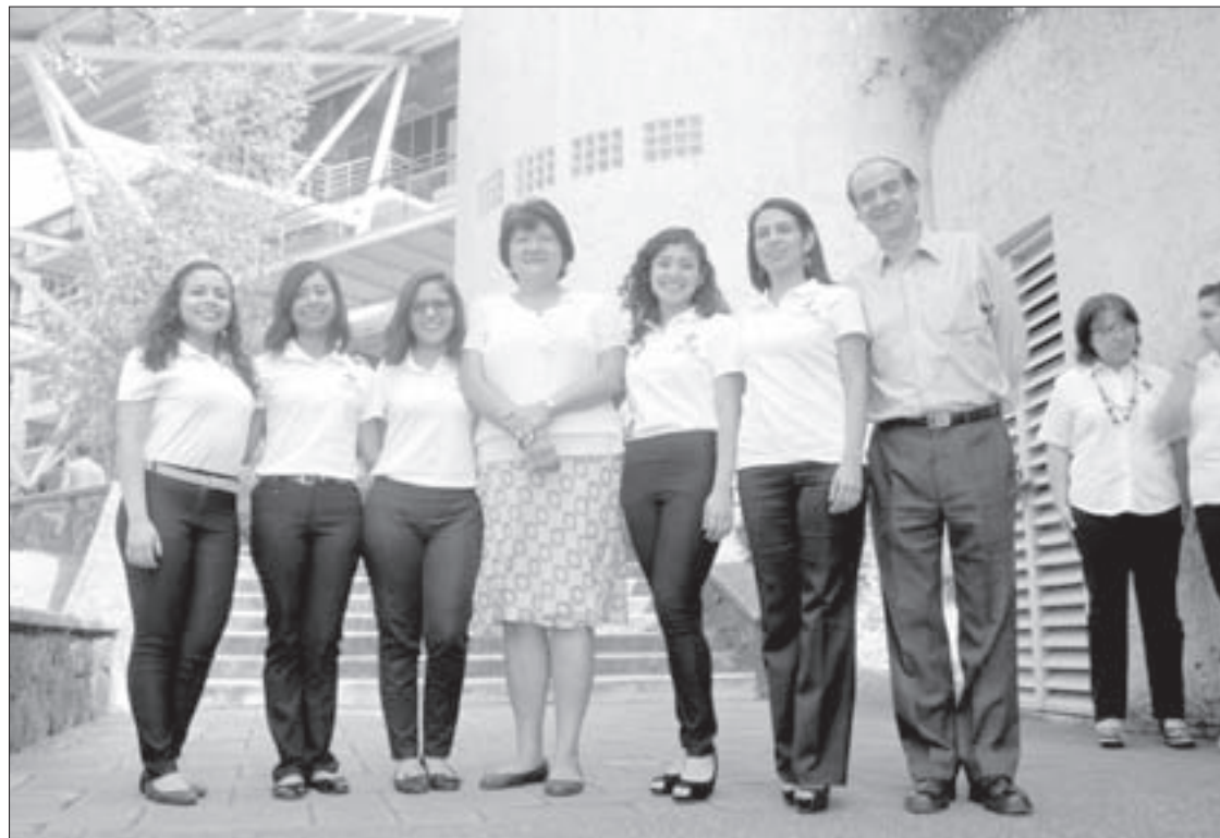
Equipo de la Licenciatura en Administración de Negocios Internacionales

Obtuvieron el tercero y sexto lugar en las áreas de mercadotecnia y administración