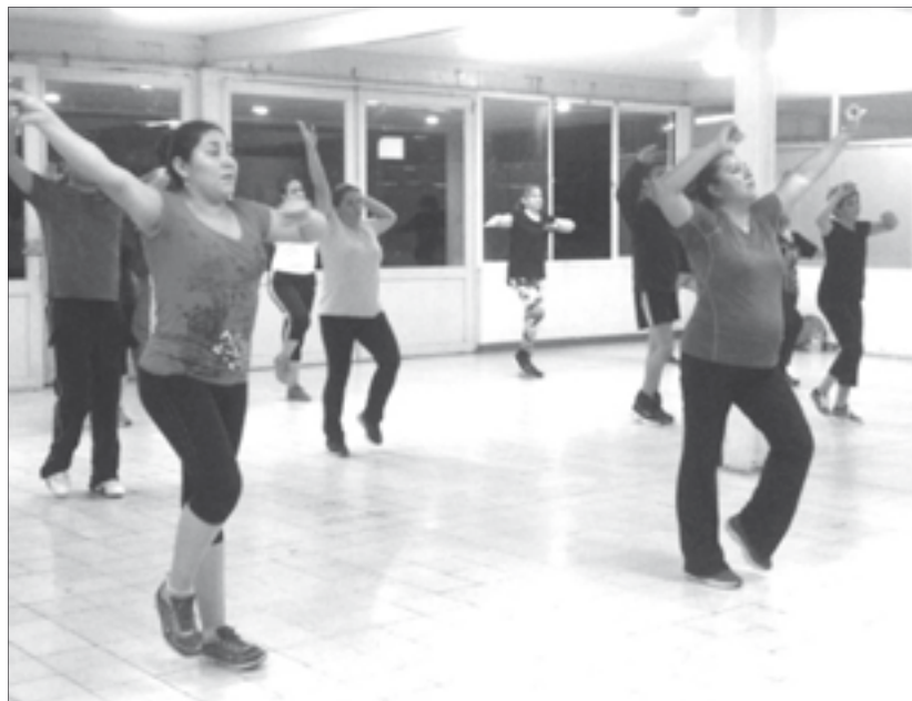
La actividad se desarrolla en el hall del Gimnasio Universitario "Miguel Ángel Ríos"

Destacó que la respuesta ha sido muy buena, ya que en el curso que imparte los martes, jueves y viernes, de 20:30 a 21:30 horas, en el hall del Gimnasio Universitario "Miguel Ángel Ríos", el grupo es de 20 a 30 alumnos.