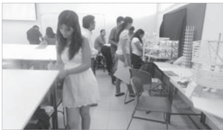
La colaboración interdisciplinaria, entre los objetivos