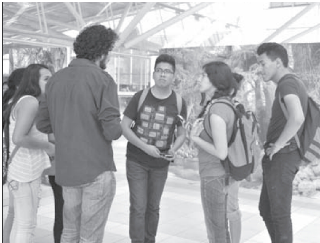
Los universitarios charlaron con el artista