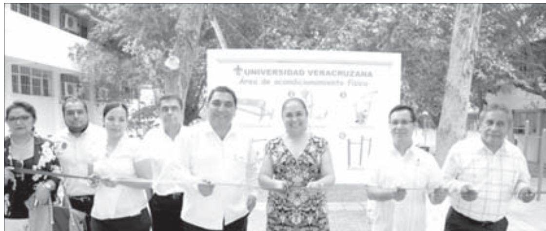
En la Facultad de Ingeniería se inauguraron nuevos espacios