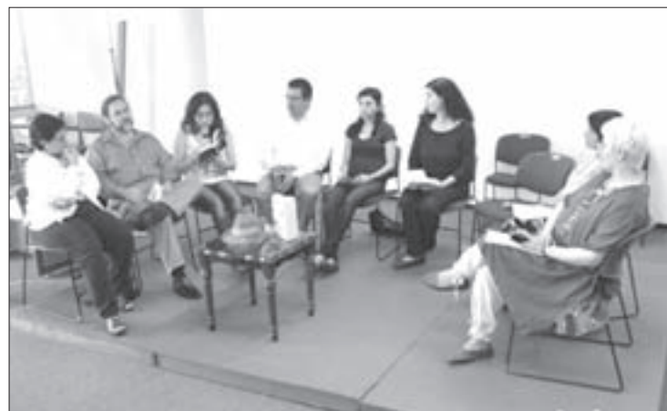
Participantes en la charla “Los ecos de Umberto Eco”