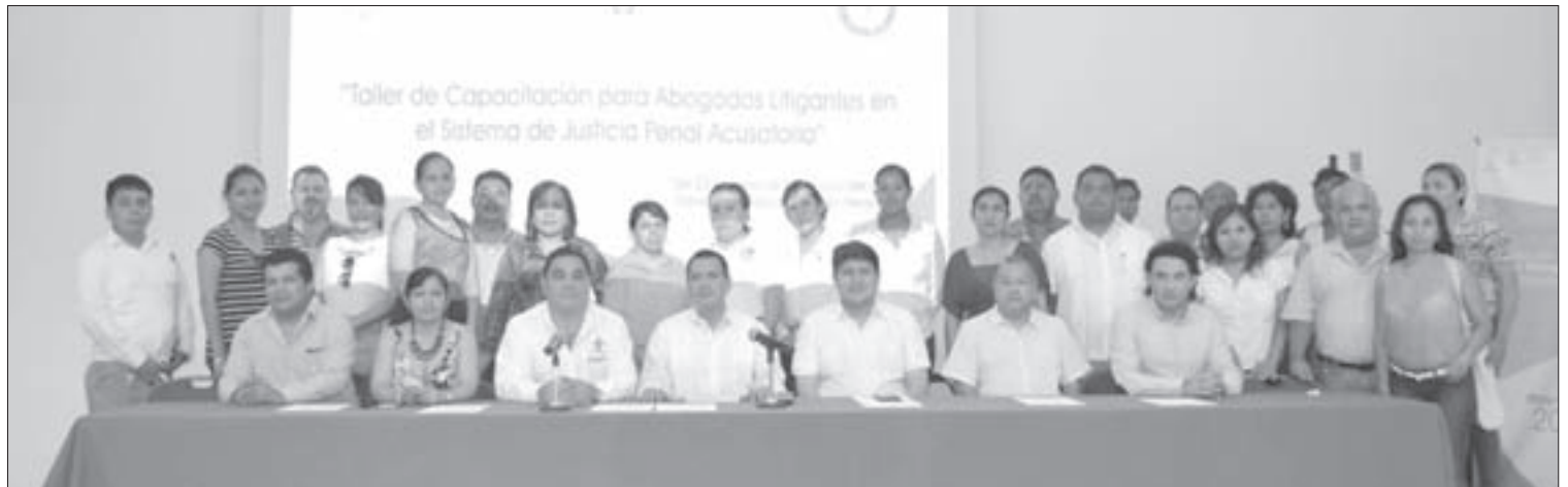
Participan más de 20 abogados de diversos municipios

"Este plan se está adecuando y seguramente va a llevar varios años; el órgano implementador del sistema de justicia penal en el estado planeó iniciar lo mejor posible, por lo que se debe trabajar en infraestructura, aun cuando se tienen salas de juicios orales, unidades de procuración de justicia, cuerpos policiacos capacitados, defensores no suficientes pero sí los que al momento se requieren y la operación se desarrolla de manera adecuada."