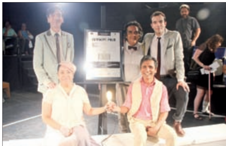
Estridentópolis alcanzó las 50 representaciones