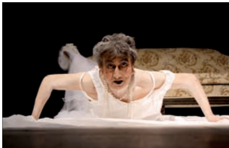
La virgen loca se ha presentado 42 años consecutivos