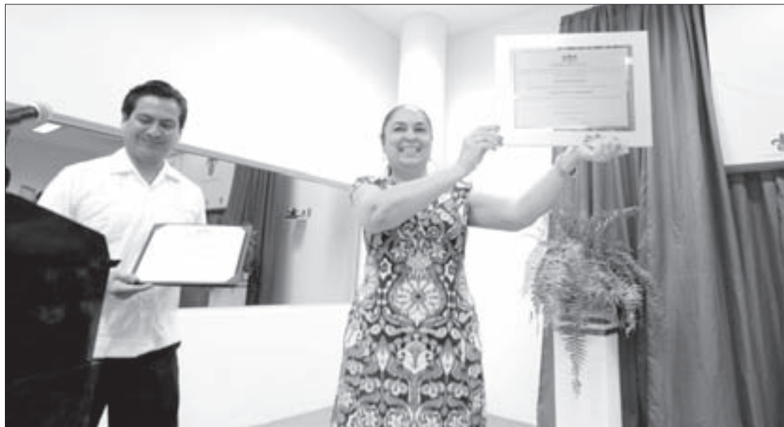
Suman 24 acreditaciones de calidad, sólo en lo que va de 2016

También destacó que estos grandes proyectos universitarios se van alcanzando a pesar de las adversidades y de condiciones a veces desfavorables, gracias a que