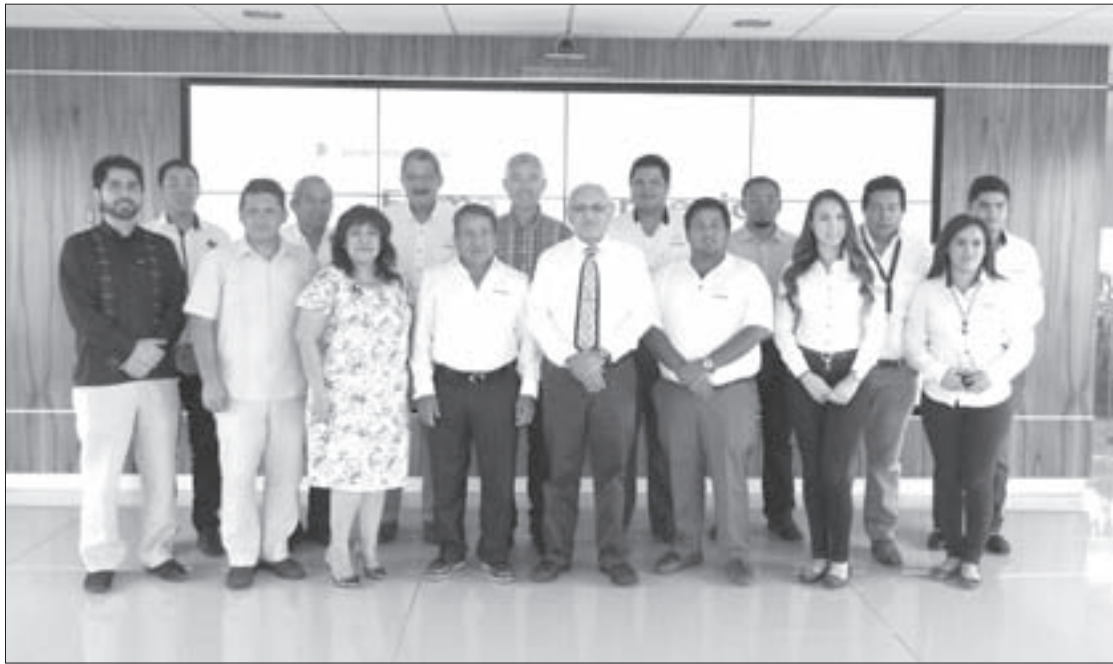
Miembros de la UV y Nuvoil celebraron el inicio del proyecto

El desarrollo de tecnología de una bomba tipo jet, el monitoreo de un