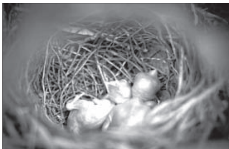
Las fotografías están impresas sobre papel algodón