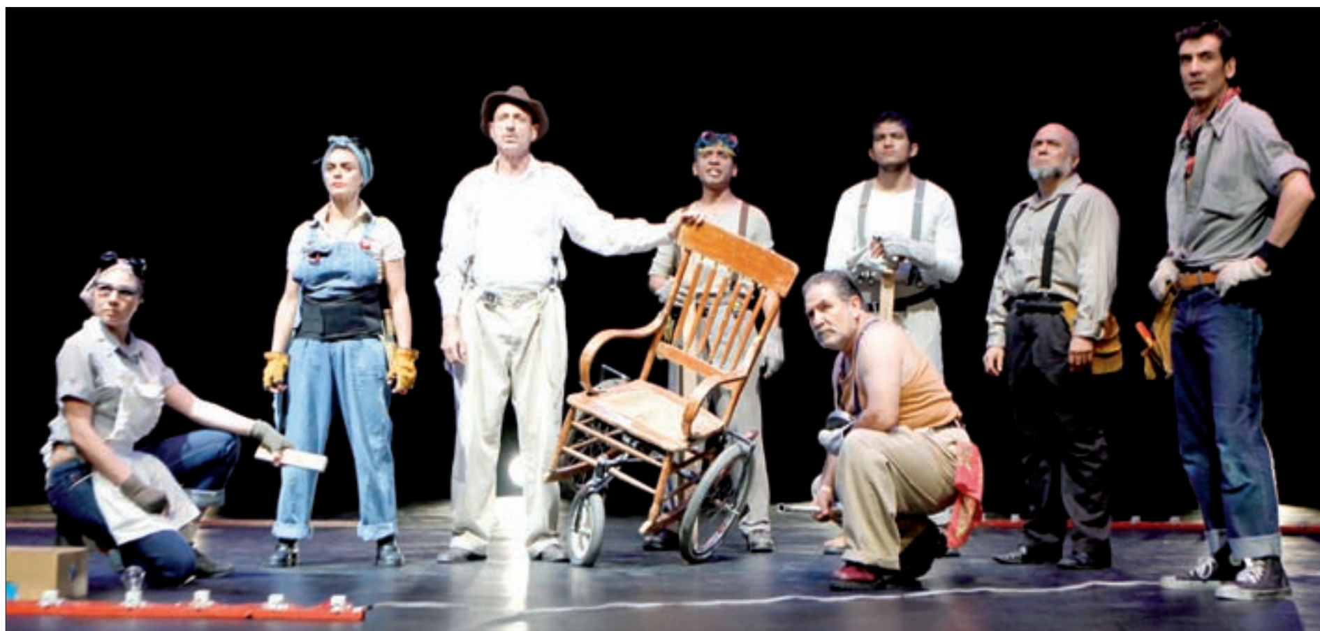
Tiene un elenco de 25 actores

El entrevistado aprovechó para invitar al reestreno de Las muertas , obra de Jorge Ibargüengoitia y