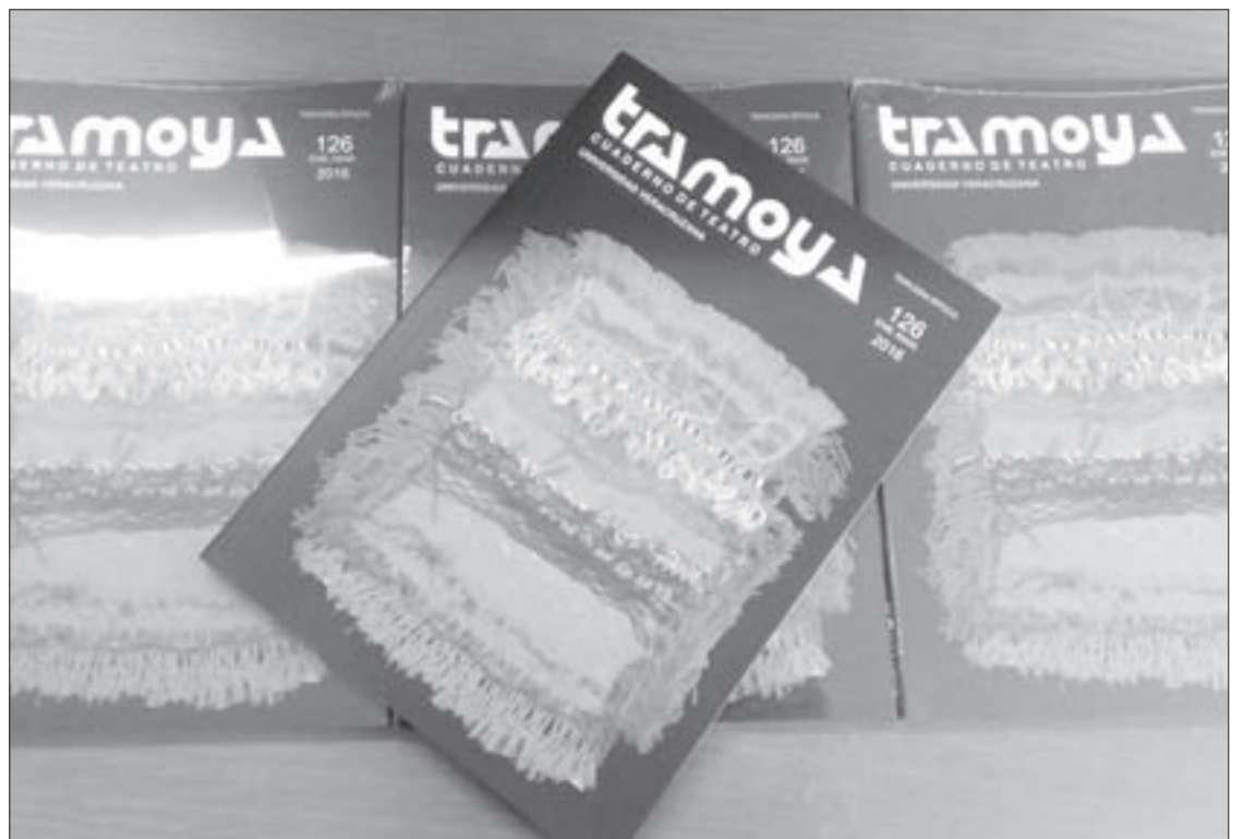
La edición 126 está disponible en el Servicio Bibliográfico Universitario

El número 126 de Tramoya se encuentra a la venta en el Servicio Bibliográfico Universitario, ubicado en Xalapeños Ilustres número 37.