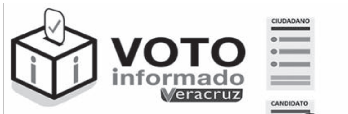
La información obtenida se puso a disposición de los ciudadanos

Actualmente el Centro de Estudios de Opinión y Análisis de la UV elabora insumos a partir de los análisis de las respuestas de los candidatos, los cuales estarán disponibles en línea. Para mayor información sobre el trabajo realizado por esta entidad universitaria, los interesados pueden consultar la página www.uv.mx/centrodeopinion