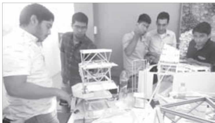
Los diseños conjuntan tecnología y desarrollo sustentable