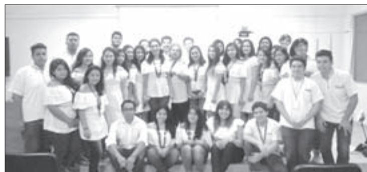
Los jóvenes reseñaron la historia del recinto