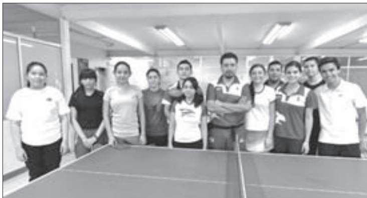
Niños y jóvenes se interesan por esta disciplina

"Ahora que ya retomamos el curso normal de las actividades,