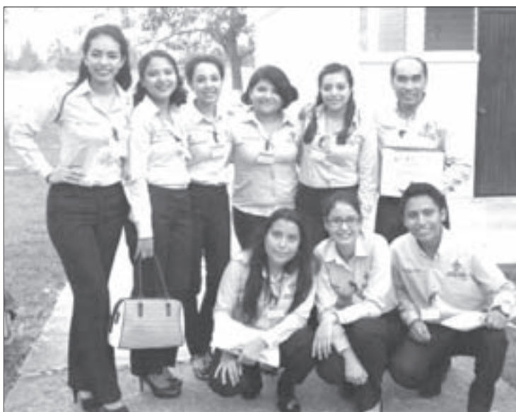
Alumnos de la FCA-Coatzacoalcos