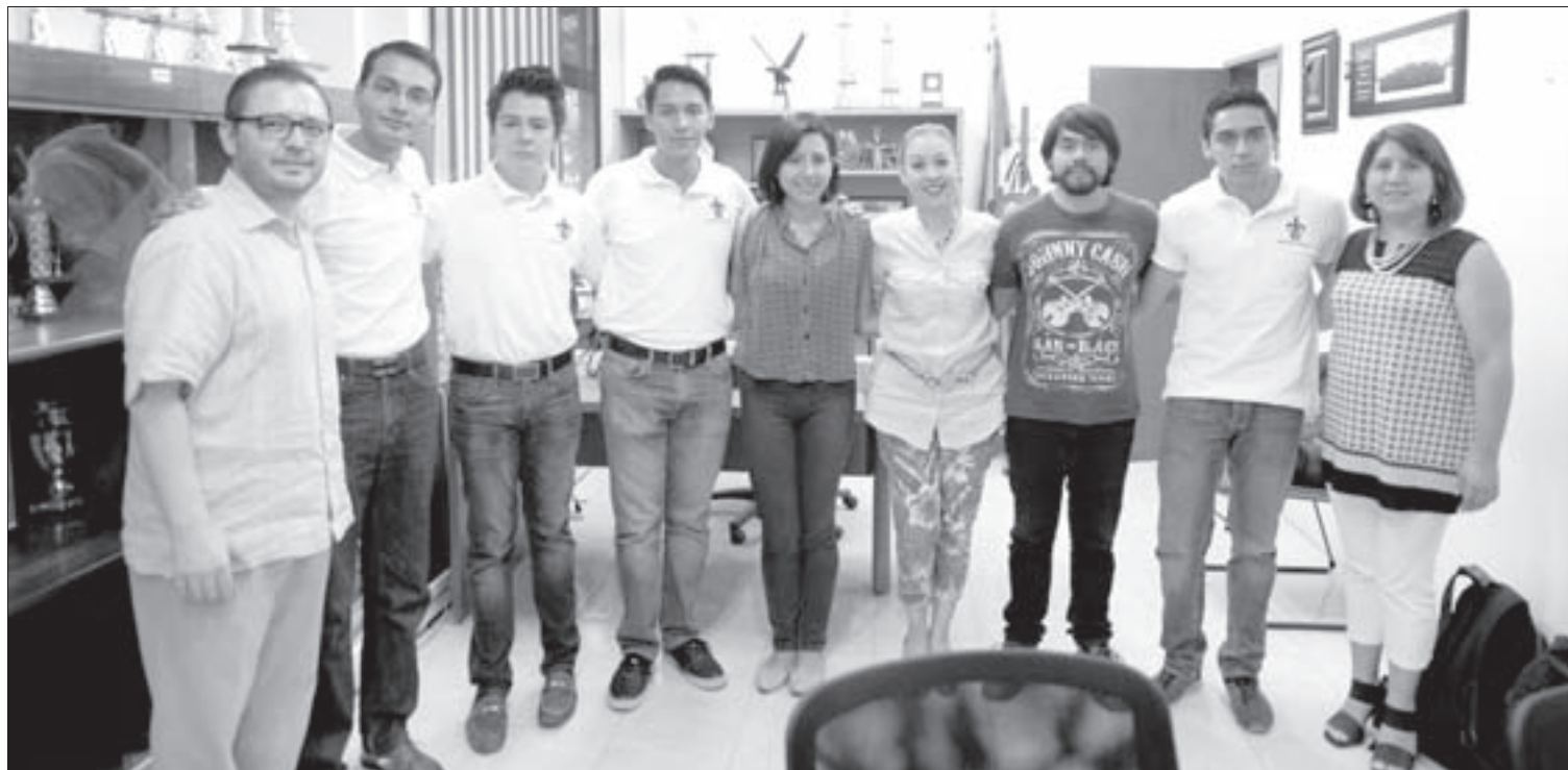
Ganadores de las categorías de costos y de informática administrativa

Los equipos continúan su preparación para el maratón nacional, programado para la primera quincena de octubre en sede aún por definir.