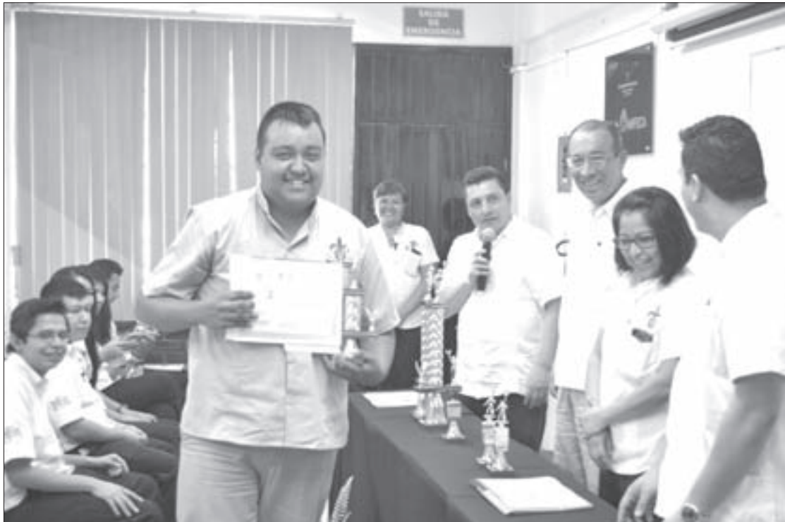
Los ganadores acudirán al certamen nacional

La Directora de la Facultad explicó que el nivel de competencia de todos los participantes fue excelente y que los ganadores habrán de