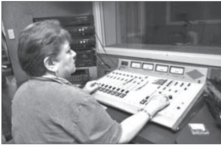
La radiodifusora universitaria prepara nuevos proyectos