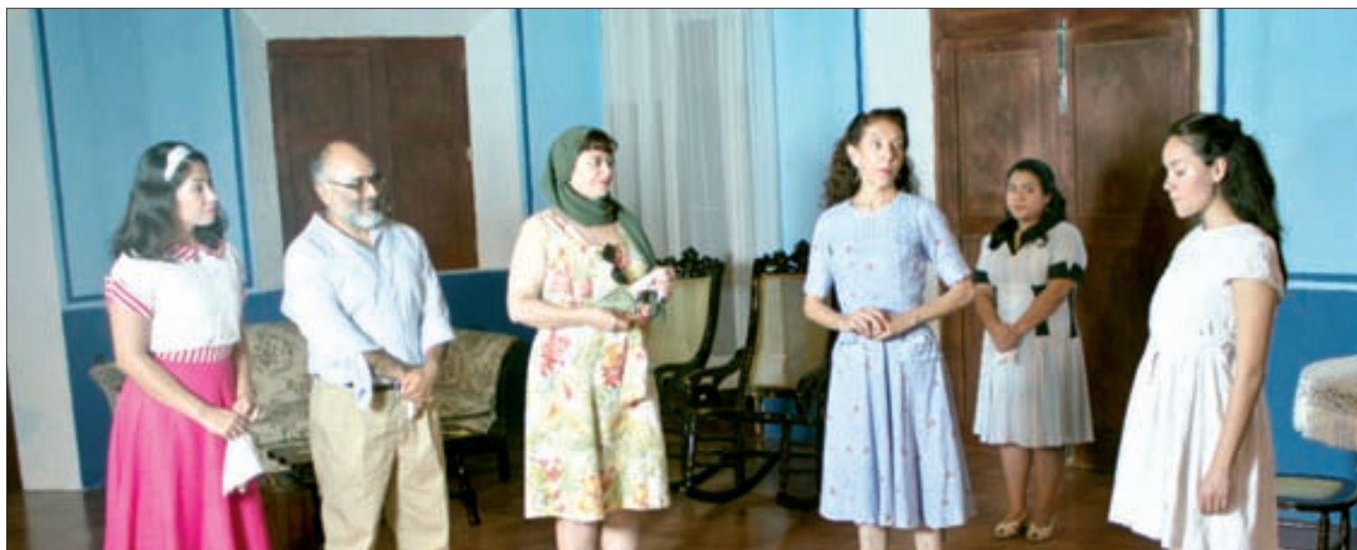
Aspecto de Rosalba y los Llaveros