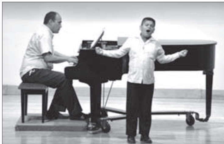
Estudiar música contribuye al desarrollo intelectual infantil

La docente afirmó que la respuesta de los alumnos durante su aprendizaje es maravillosa y que al momento de brindar un concierto, si bien se muestran inquietos y con mucha energía, les gusta dar su mejor esfuerzo.