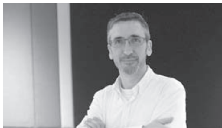
Dirigió a la OSX en el concierto del 27 de mayo

“No existía compatibilidad entre la orquesta y la sala del Teatro del Estado; aquélla era una relación totalmente desproporcionada, carente de reciprocidad. Me dio mucho gusto sentir que aquí el sonido corre, el instrumento se escucha y los instrumentistas se escuchan entre sí. Me sentí muy a gusto en Xalapa y con la orquesta en su nueva sede.”