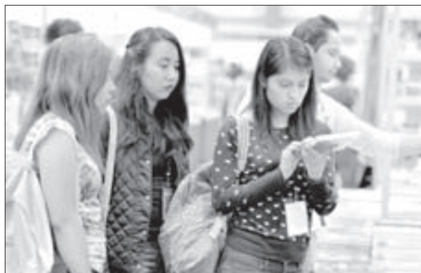
El evento atrae a más lectores cada año