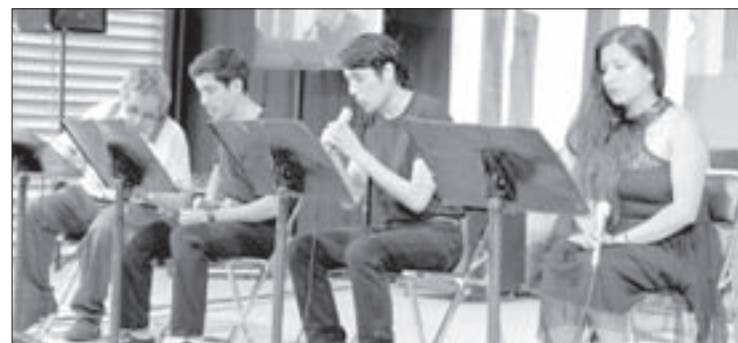
Estudiantes de la Facultad de Teatro leyeron el cuento Benzulul