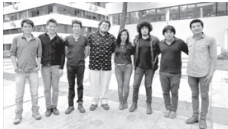
Consejeros y estudiantes participan en la organización