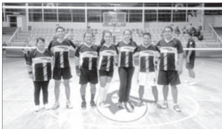
Presupuestos, entre los protagonistas