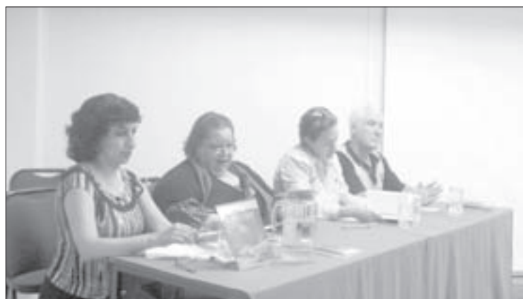
Los panelistas subrayaron la importancia de trabajar con los pobladores

“Alentamos a todos los autores y personas que trabajan en la montaña a que dediquen su esfuerzo a la conservación de la misma; que las dificultades, fracasos y críticas no impidan redoblar esfuerzos y buscar permanentemente nuevas formas de impactar de manera positiva en la región”, dijo la titular de Pronatura Veracruz.