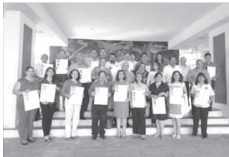
Más de la mitad de la planta docente de la Facultad está certificada