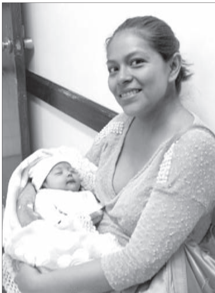
El objetivo es apoyar a madres trabajadoras y estudiantes

Respecto al porcentaje de bebés beneficiados con lactancia materna exclusiva los primeros seis meses de vida, México se ubica en el penúltimo lugar en América Latina, después de Belice, y entre los seis países con menor porcentaje a nivel mundial.