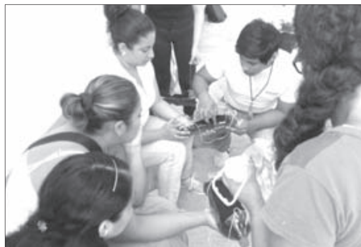
Creación de huertos familiares