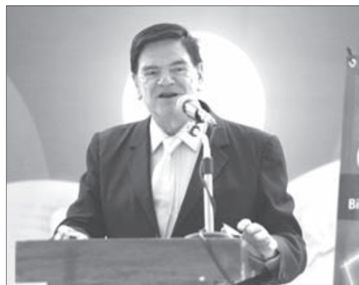
El investigador participó en el XLIII Congreso Nacional de Psicología

Otro es el recelo contra la ingeniería genética, ya que