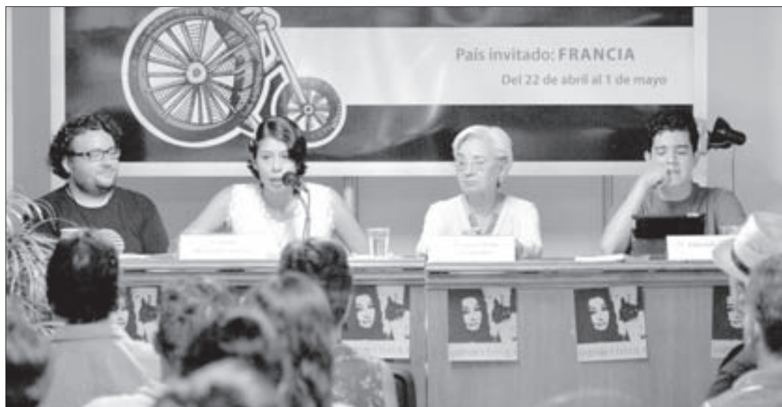
Los panelistas analizaron los aportes de la escritora zacatecana