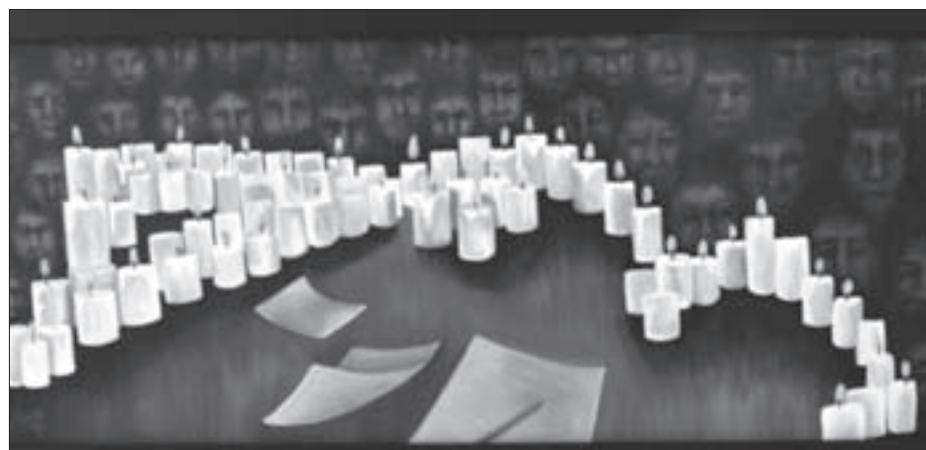
Ayotzinapa (Juana Iraís Osornio Galeana)