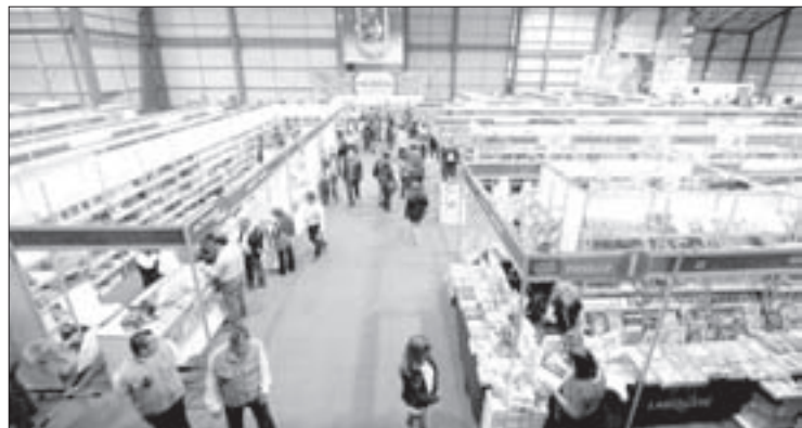
Participaron alrededor de 80 expositores

Es importante señalar que durante los 10 días de actividades, se instalaron cerca de 100 stands, en los que expusieron alrededor de 80 editoriales y librerías.