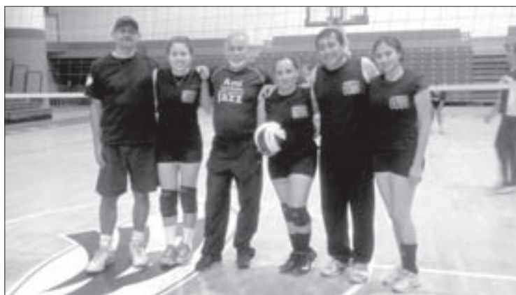
Difusión Cultural, con su cuadro de lujo