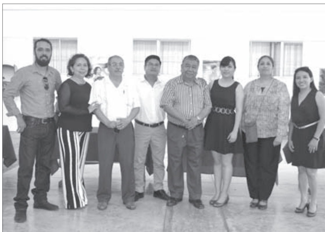
Los universitarios celebraron el Día Mundial de las Artes