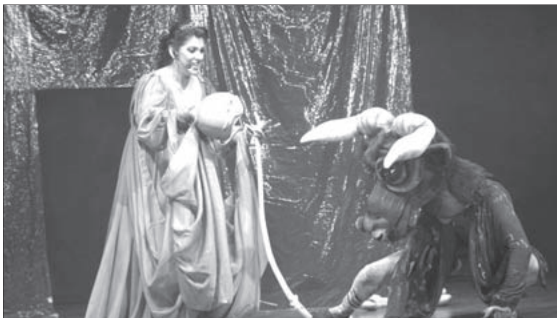
El IV Coloquio “El títere y las artes escénicas” fue organizado por la UV y el Grupo Merequetengue

Al referirse a los integrantes de Merequetengue, egresados de la institución, hizo hincapié en el posicionamiento que han tenido en el mundo de los títeres.