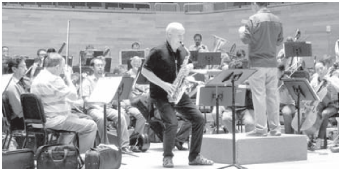
El músico actuó como solista con la Orquesta Sinfónica de Xalapa

El músico ha estado presente en Xalapa en diversas ocasiones desde hace seis años, vinculándose con las actividades de la Universidad Veracruzana, en foros de egresados de la Facultad de Música y en actuaciones con la Orquesta Universitaria de Música Popular.