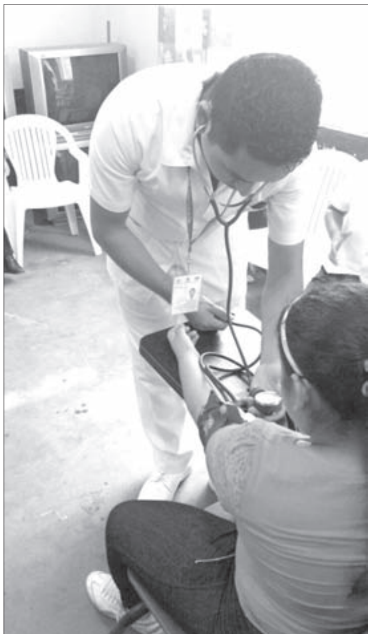
Estudiantes realizaron diagnósticos de salud

El papilomavirus es la principal enfermedad de transmisión sexual en México y el factor de riesgo más influyente en la asociación y aparición de cáncer cervicouterino en mujeres sexualmente activas; por consiguiente, es indispensable realizar promoción a la salud en la población para que reconozcan cuáles son los signos y síntomas más comunes del cáncer cervicouterino, afirmó.