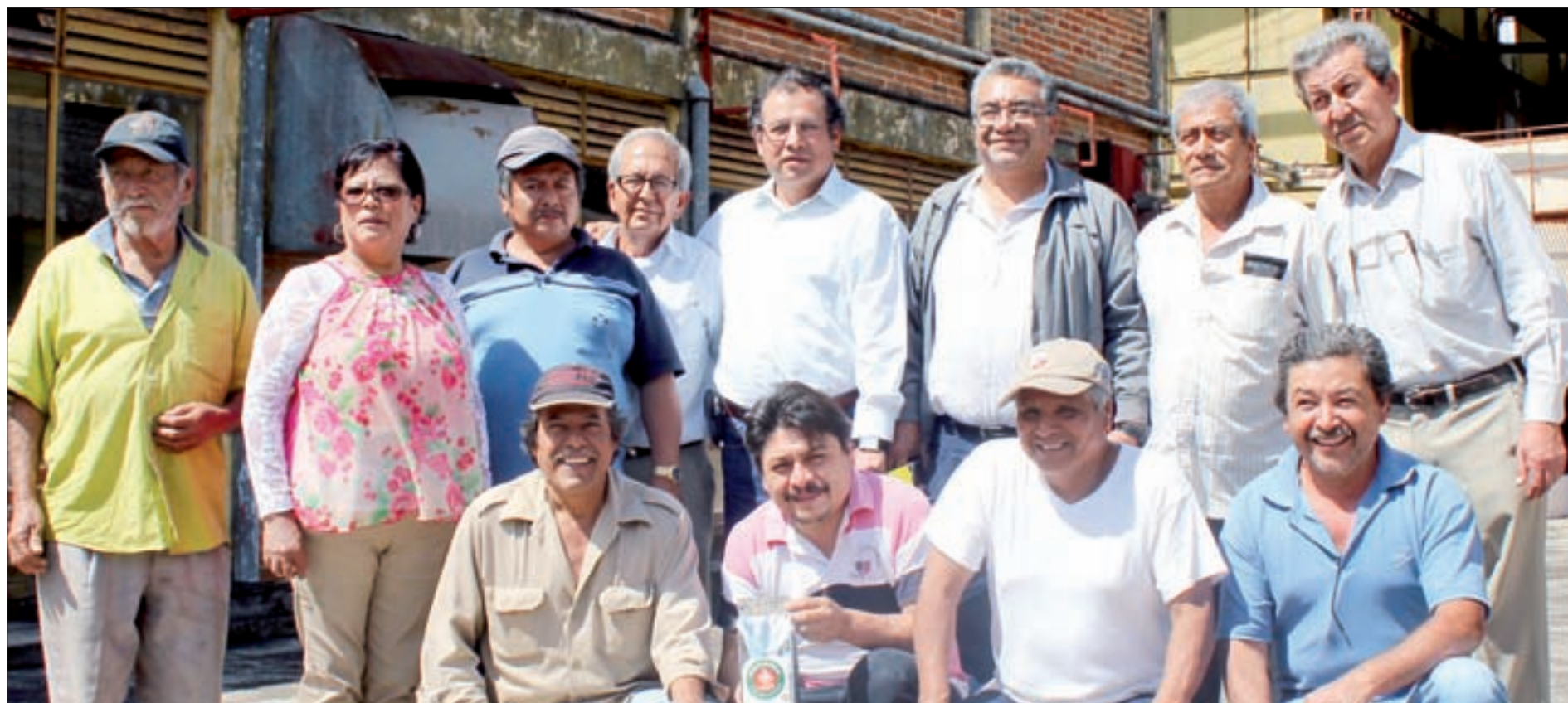
Con capacitación técnica, universitarios y cafetaleros buscan superar la crisis

La roya es una enfermedad originaria de África que fue reportada