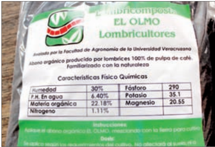
La vinculación con la UV ha dado los primeros resultados

en México por primera vez en 1981. En ese entonces los cafetales estaban preparados para enfrentar el problema, el clima era más estable y no tuvo los efectos negativos esperados. Pero en 2012 se presentó un nuevo brote epidemiológico mucho más agresivo que se fue extendiendo por el país, en 2016 generó las cosechas más bajas en los últimos 50 años.