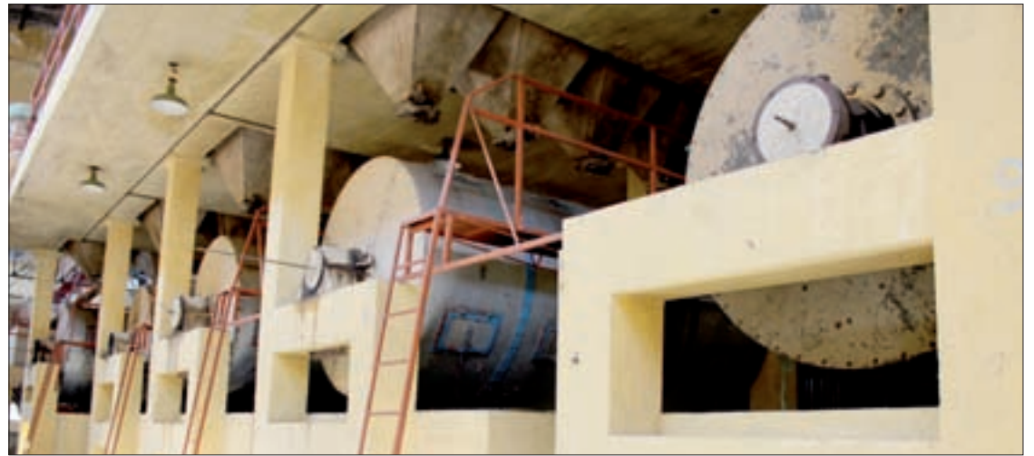
Puerto Rico fue considerado el beneficio más grande del país

El trabajo de la UV con los cafetaleros, operado por la Facultad de Ciencias Agrícolas, se intensificó en 2014 como parte de convenios específicos con la Secretaría de Desarrollo Agropecuario, Rural y Pesca ( Sedarpa ) y Sagarpa para apoyar la capacitación y transferencia de tecnología a