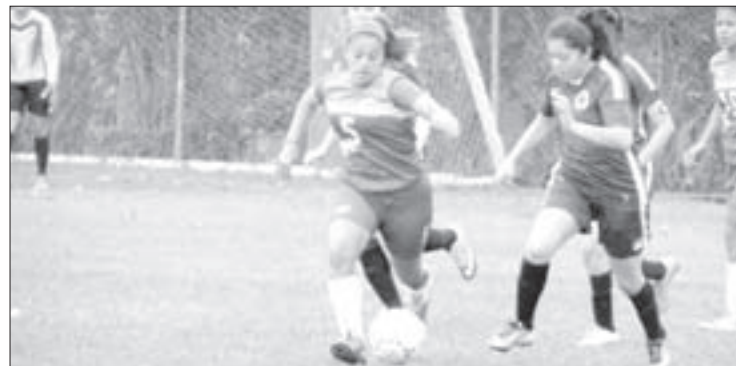
La Selección Femenil de Fútbol Soccer quiere subir al podio