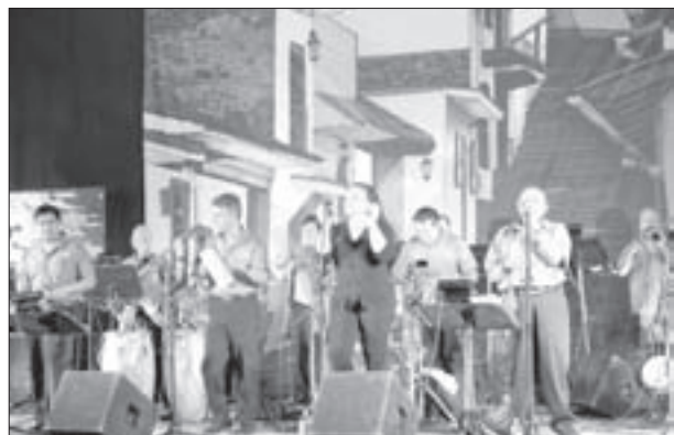
La Orquesta de Salsa amenizó la clausura