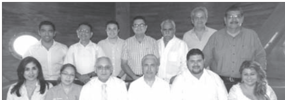
Empresarios de la región atestiguaron la firma

El Vicerrector mencionó que la creación de este parque traducirá a la realidad lo que los jóvenes