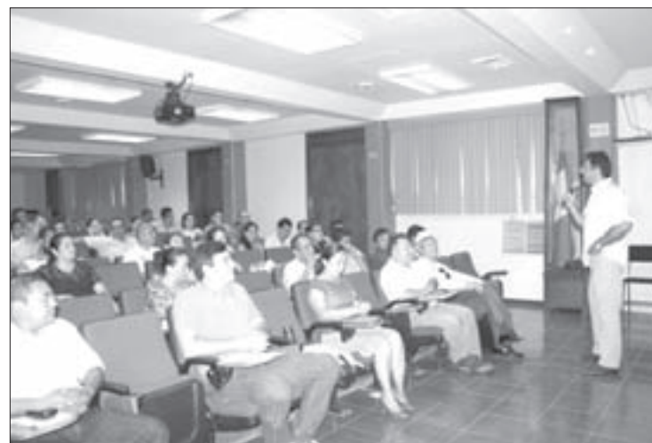
Asistentes de la región Coatzacoalcos