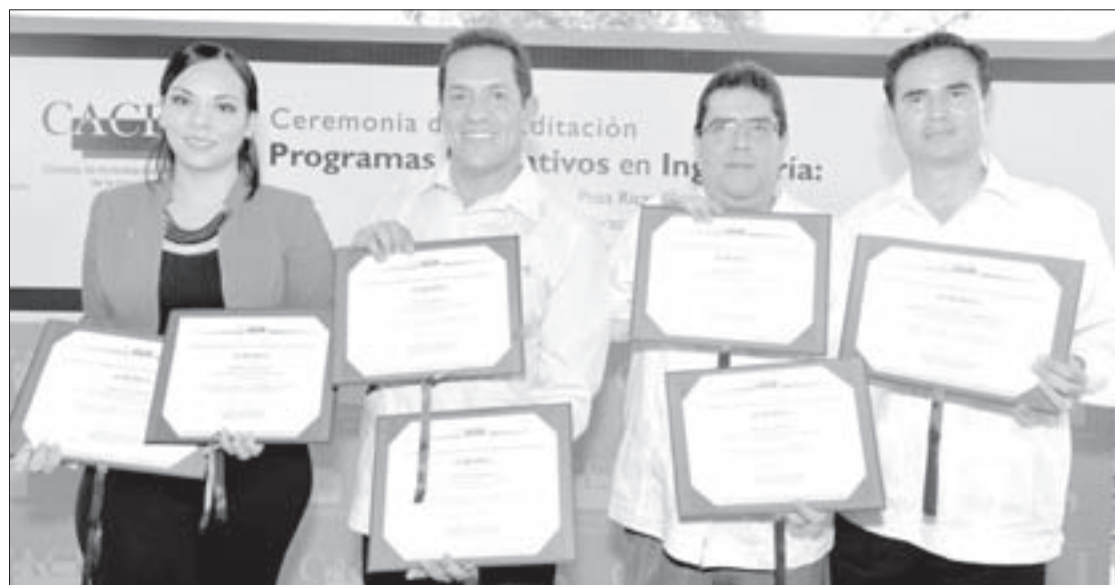
La UV es la institución con más programas acreditados de las regiones centro-oriente y sur-sureste

Los programas acreditados por el Cacei, con una vigencia de abril de 2016 a abril de 2012, son Ingeniería Ambiental, en la región Poza Rica-Tuxpan; Ingeniería en Electrónica y Comunicaciones, en la región Veracruz; Ingeniería Química, Ingeniería Ambiental, Ingeniería Mecánica, Ingeniería Eléctrica e Ingeniería en Alimentos, en la región Xalapa.