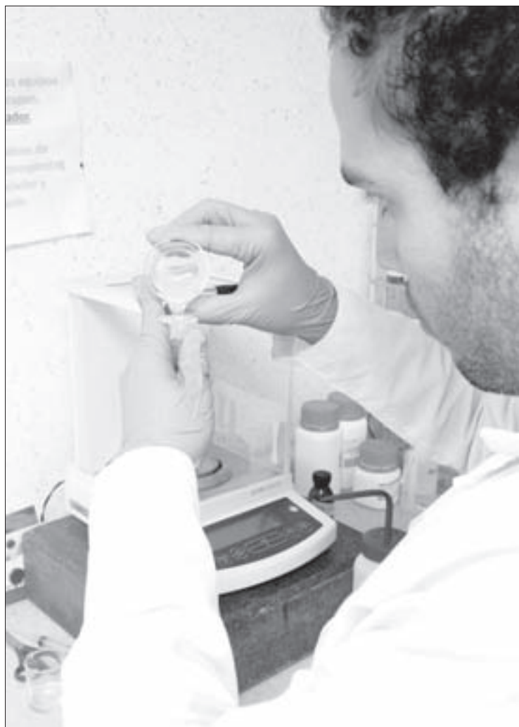
En su elaboración se usan derivados de quitina y otros polímeros

Brinda al paciente una terapia que reduce el costo del tratamiento