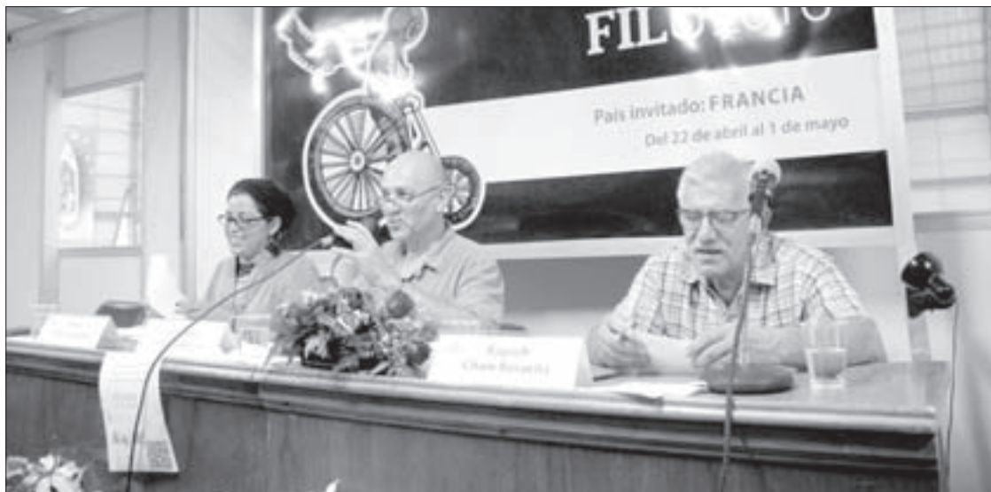
La presentación se realizó durante la FILU 2016

El Doctor en Educación afirmó que son muchos los factores que se asocian al rendimiento escolar y que el proyecto explicado en el libro busca hacer predicciones que contengan pocas variables, con un margen de error muy pequeño.