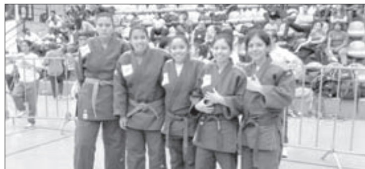
En la competición por equipos, las veracruzanas se adjudicaron el bronce