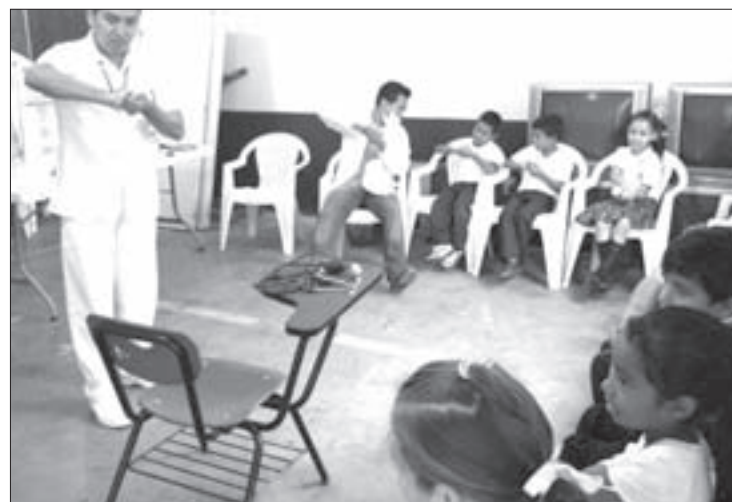
Taller de activación física