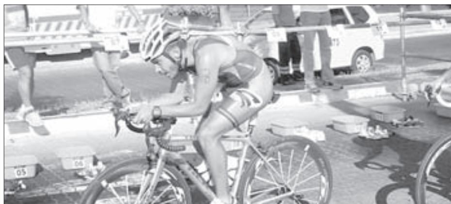
El equipo de Triatlón se ubicó en la cuarta posición