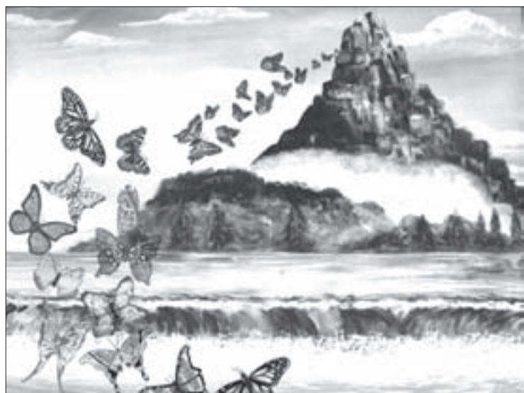
Hacia el santuario (Manuel Vera Roldán)