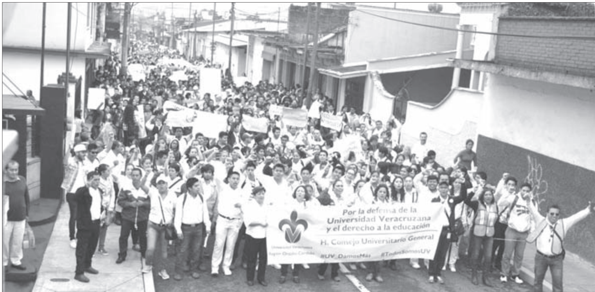
Acudieron estudiantes, académicos, trabajadores, egresados, jubilados y sociedad civil