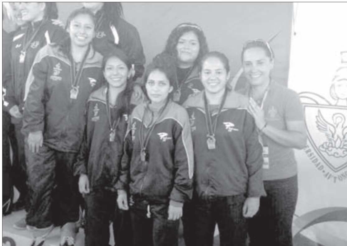
En Nuevo León 2015, la UV logró 10 preseas

La delegación compite en Oaxaca, Xalapa y Veracruz, en busca del pase a la Universiada Nacional