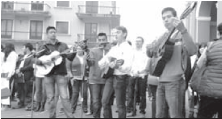
El Coro Regional Universitario amenizó la concentración en Córdoba