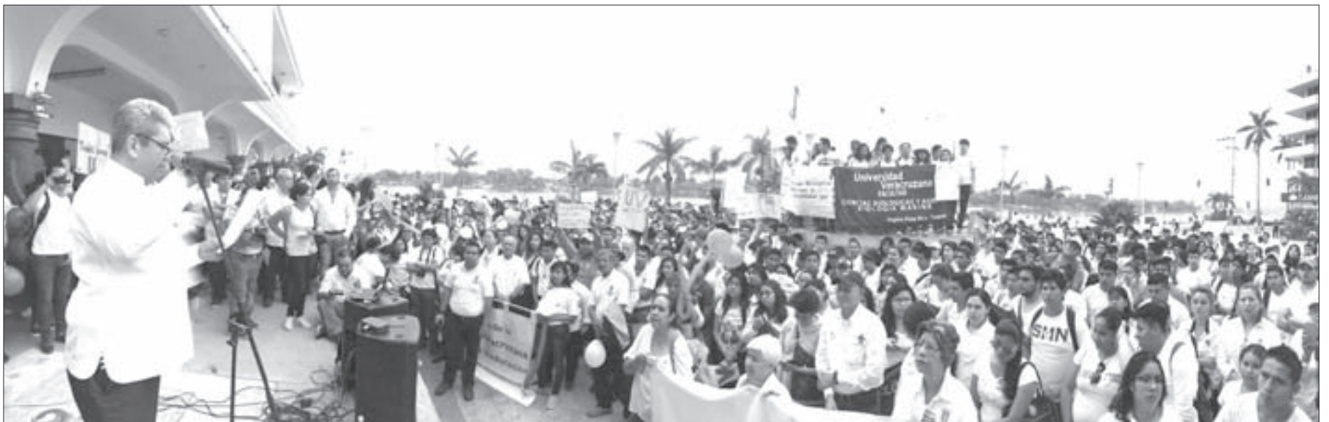
Estudiantes, maestros y ciudadanos tuxpeños se hicieron escuchar