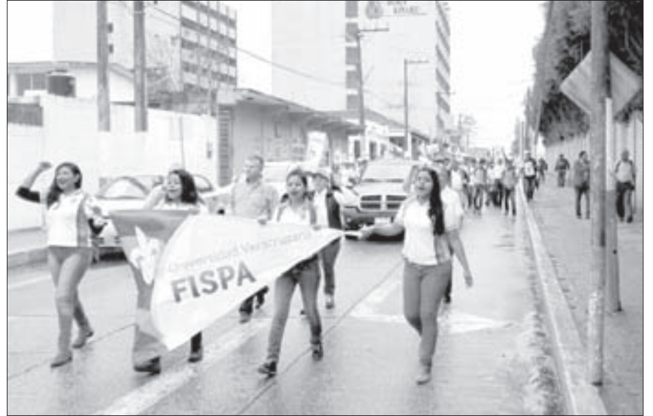
En Acayucan participaron más de 500 personas