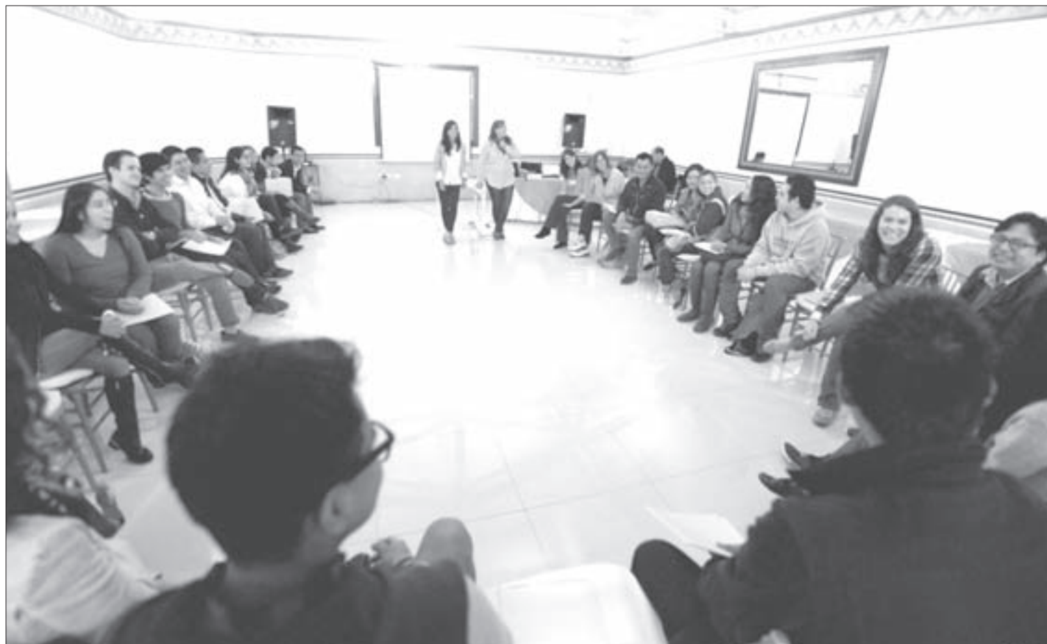
Monitores de las cinco áreas académicas tomaron el curso-taller

programas de tutorías, nos da la opción de registrar expectativas, requerimientos, necesidades que están muy presentes en la propuesta del taller en la que estamos trabajando en la Universidad Veracruzana, y simultáneamente contrastar con lo que nosotros estamos trabajando en la Facultad de Ingeniería de Río Cuarto y de Rosario para seguir pensando propuestas que nos permitan crecer en el acompañamiento de los estudiantes, esto demuestra que es posible seguir creciendo desde el aporte conjunto de distintas miradas”, señaló.