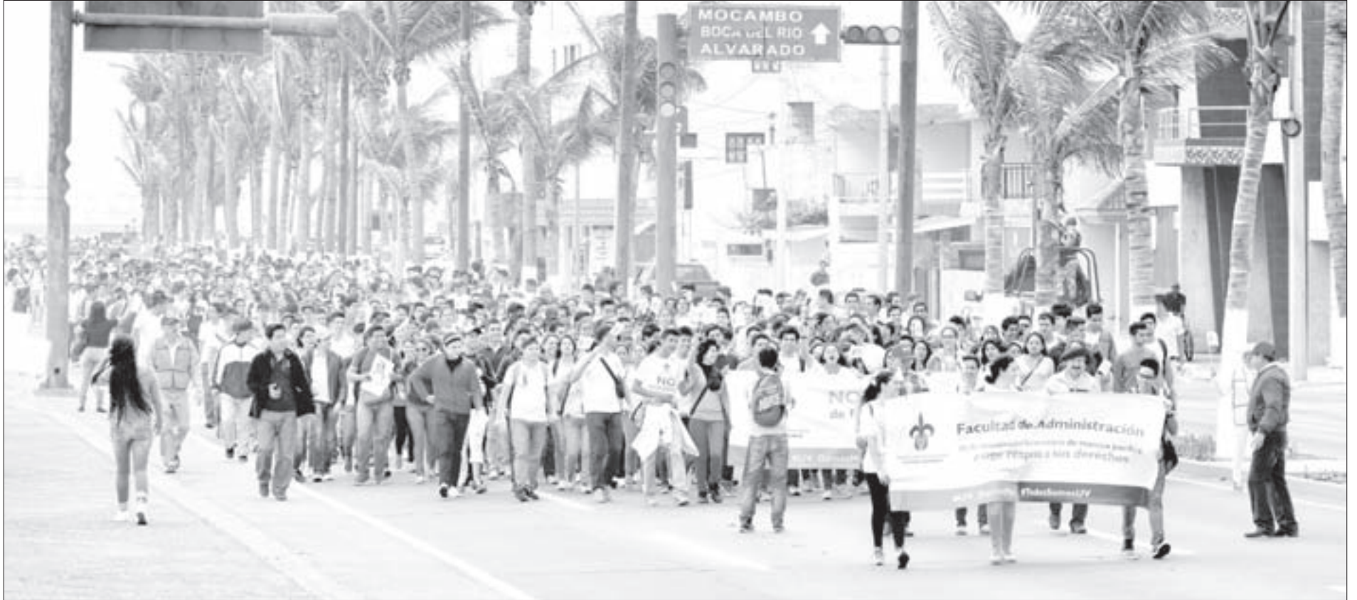
Acudieron más de 10 mil