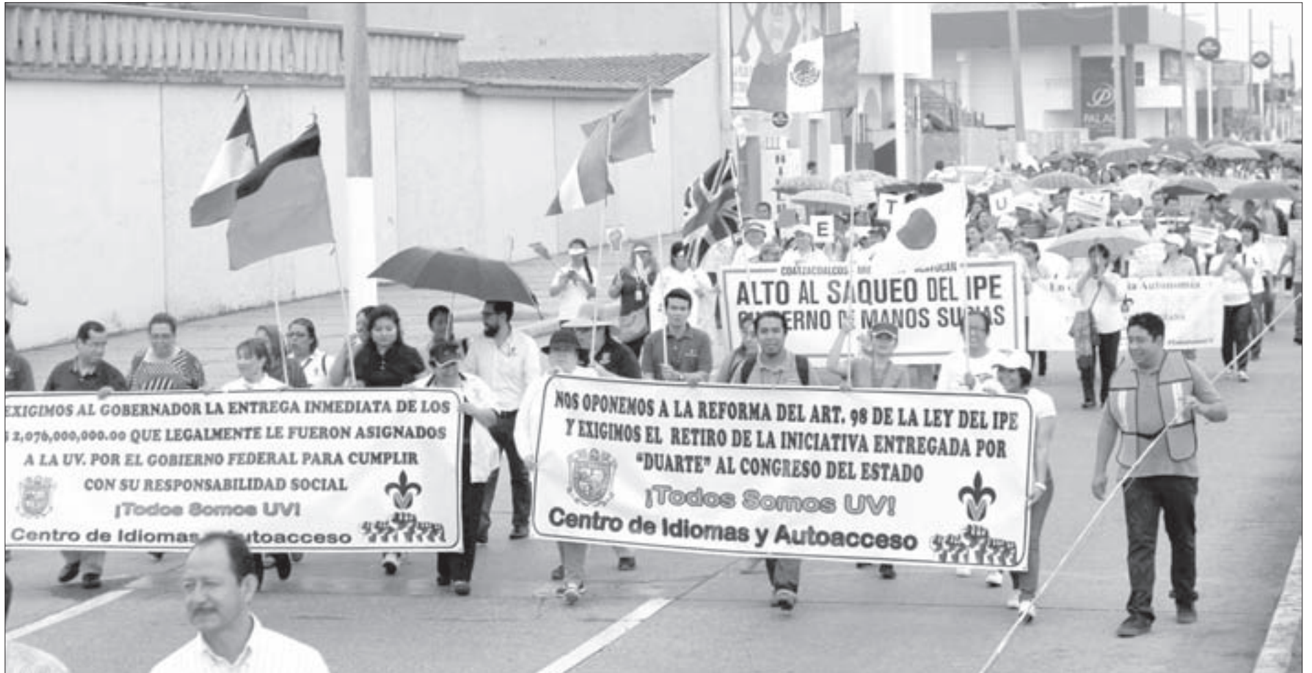
Los universitarios marcharon por el malecón de Coatzacoalcos