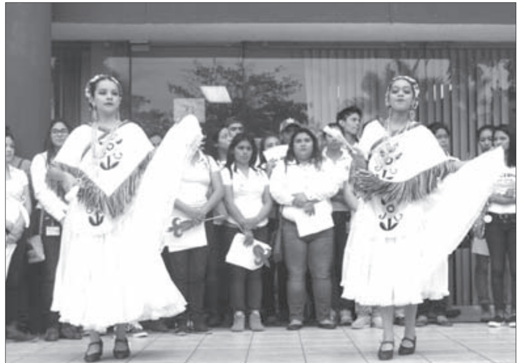
Los Talleres Libres de Arte presentaron coreografías