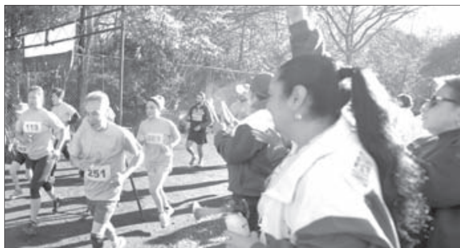
La Rectora dio la señal de salida