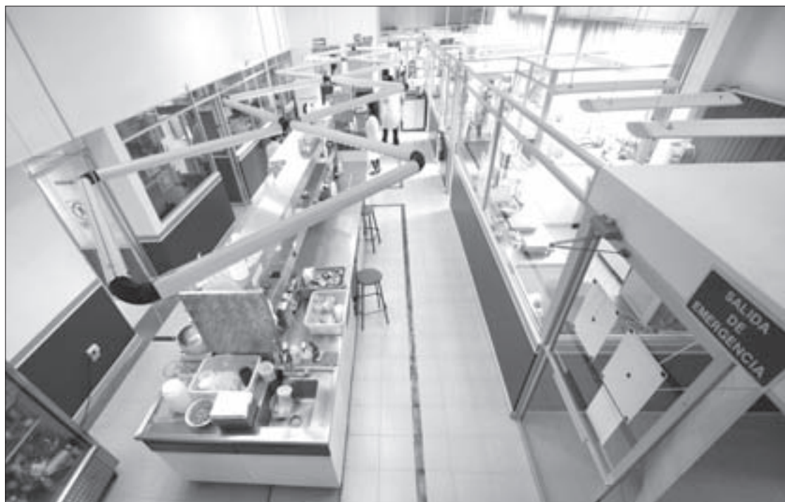
Este espacio es evaluado periódicamente

Lo anterior, con la intención de mantener su reconocimiento como personal técnico en diagnóstico fitosanitario.