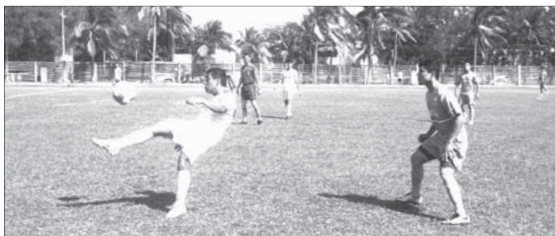
Con un hombre menos, cuidaron el marcador