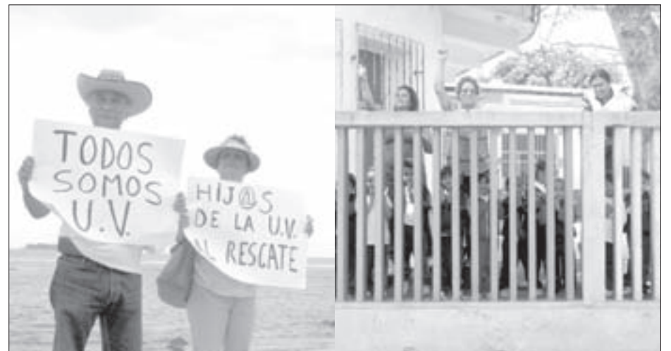
La sociedad veracruzana, siempre solidaria