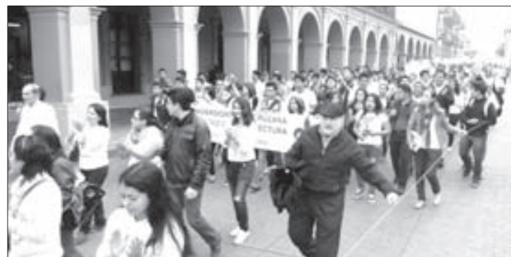
El contingente a su paso por el Centro Histórico cordobés