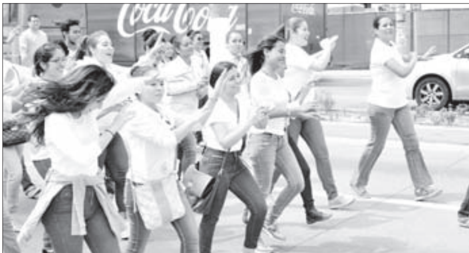
Con música y baile manifestaron su apoyo