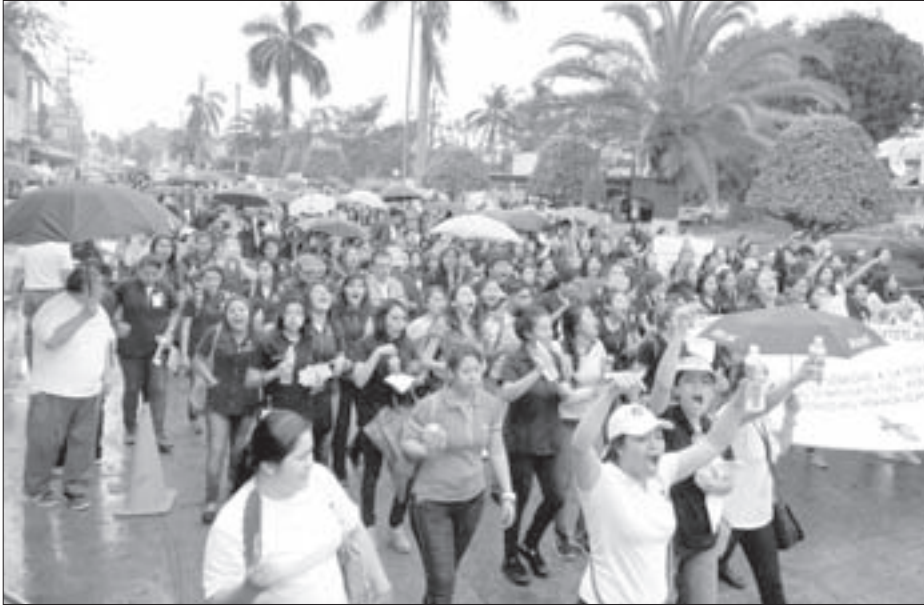
“Violencia no, educación sí”, el grito en Minatitlán