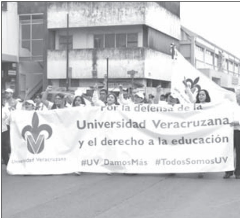
Defendemos el patrimonio y la autonomía universitaria