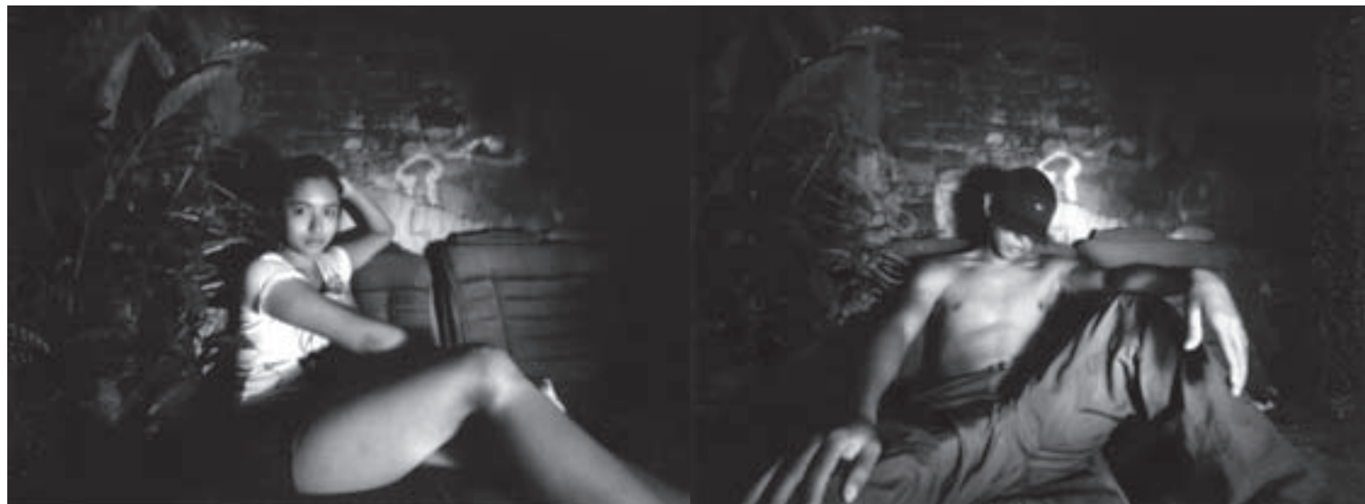
Piezas integrantes de Vice. Ensayo sobre el prejuicio