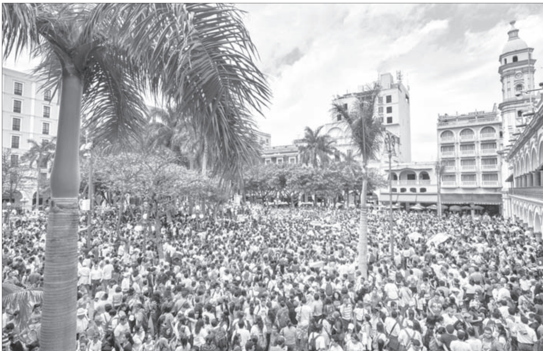
Los universitarios abarrotaron el Zócalo

Entre las manifestaciones culturales que caracterizaron la movilización, destacaron los bailes tradicionales como La Bamba , interpretado por un grupo de universitarias; así como la participación de la Orquesta Tradicional Moscovita, que amenizó la concentración con el tema La UV no se toca , compuesto especialmente para respaldar a la institución.