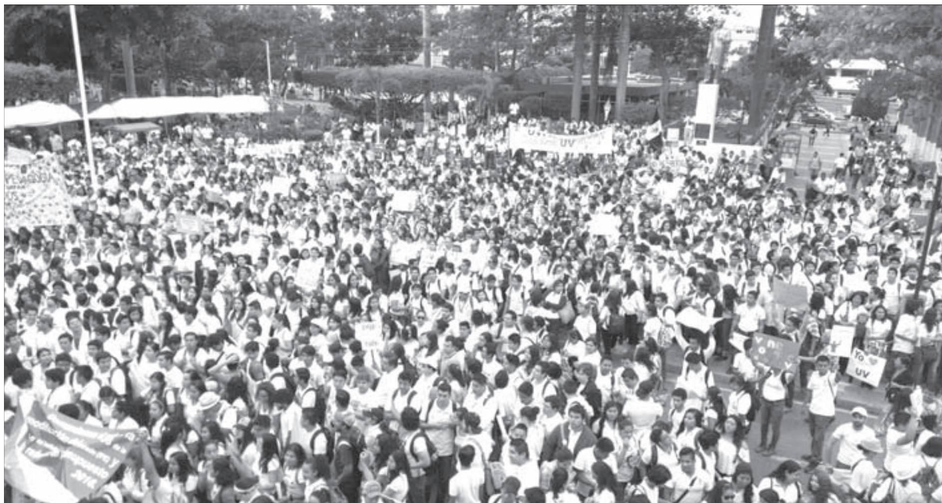
Demandaron el pago que adeuda el gobierno del estado

➤ Miles de personas gritaron al unísono: “Todos somos UV”