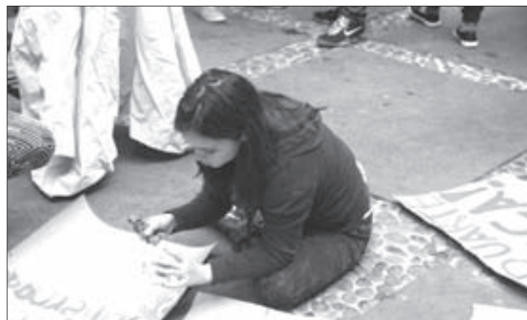
Estudiantes de Psicología plasmaron su ingenio y creatividad