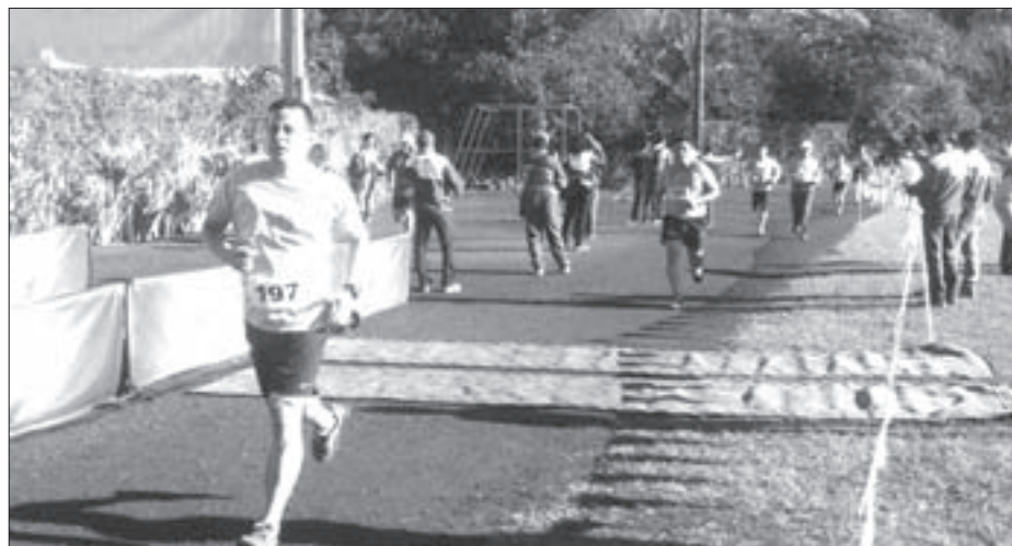
El circuito de la USBI fue el escenario