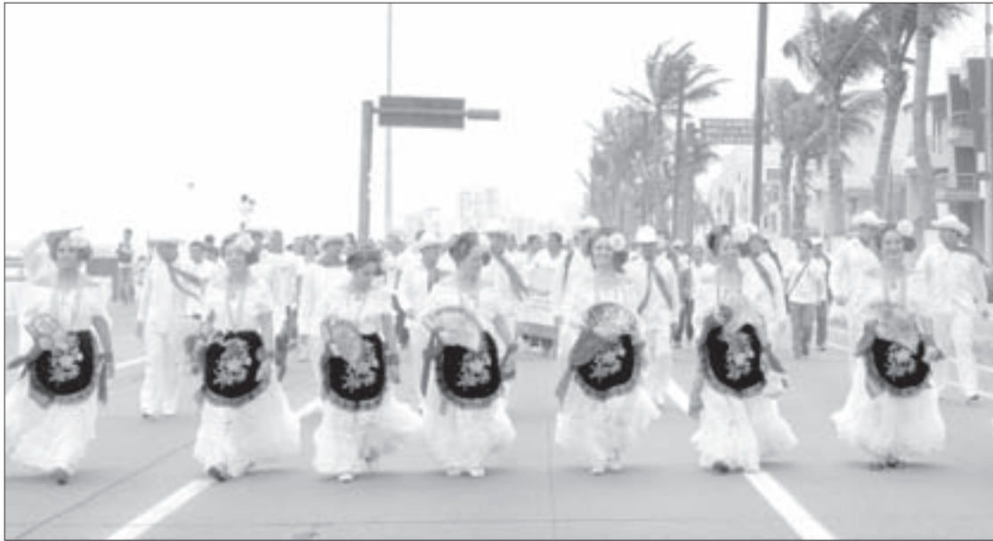
Las jarochas interpretaron La Bamba