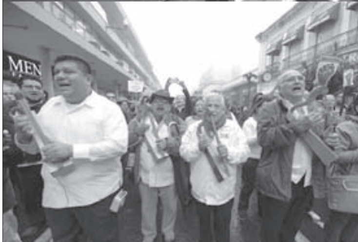
Los grupos artísticos, patrimonio de los universitarios