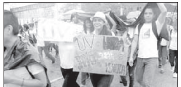
Exigieron respeto a sus derechos

En Acayucan, 500 integrantes de la Facultad de Ingeniería en Sistemas de Producción Agropecuaria y egresados, se sumaron al reclamo de los universitarios y a la defensa de la UV y la educación superior.