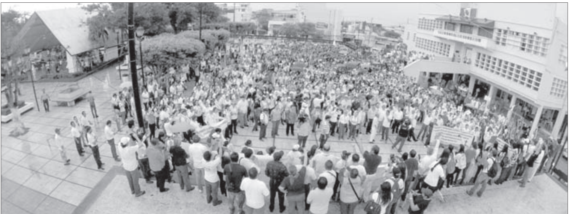
Hacia el mediodía, el contingente arribó al Palacio Municipal de Coatzacoalcos