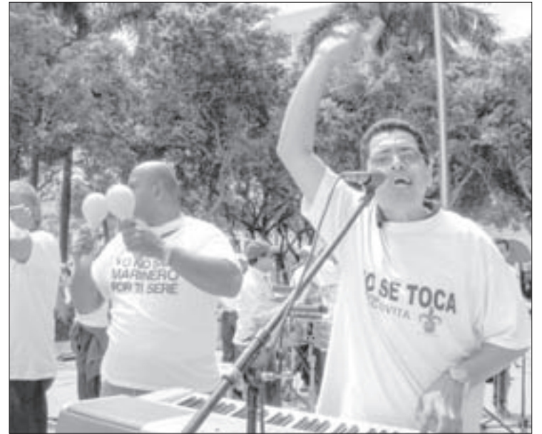
La Orquesta Tradicional Moscovita no podía faltar