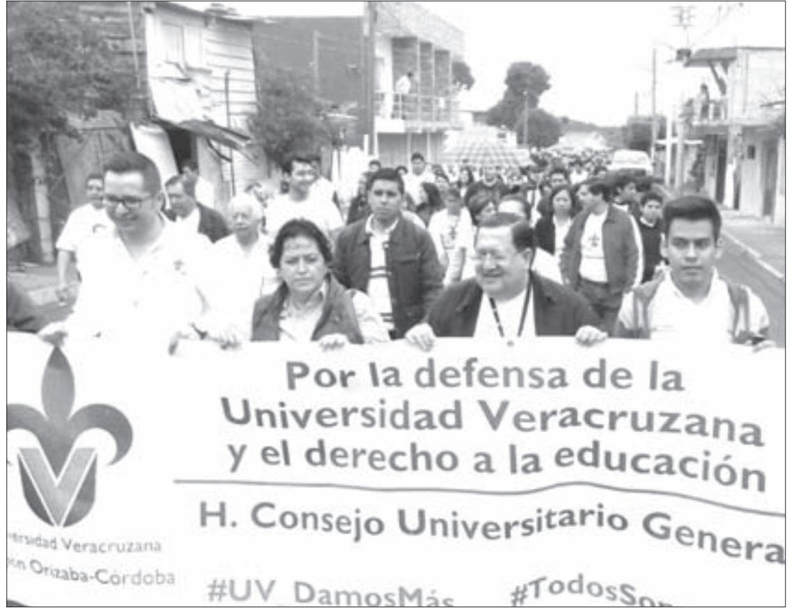
Más de mil 500 personas se reunieron en Córdoba