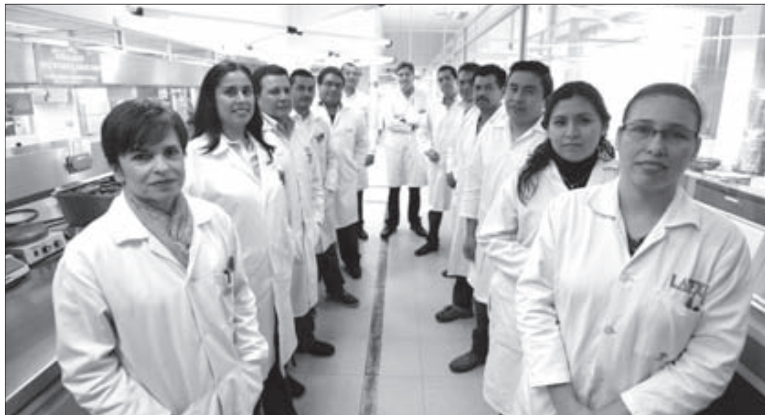
Sus colaboradores son expertos en áreas relacionadas con química y biología

En este sentido, Latex resguarda la fitosanidad que México requiere, como organismo de coadyuvancia con la Sagarpa para evitar la entrada de riesgos sanitarios al sector agrícola, subrayó.