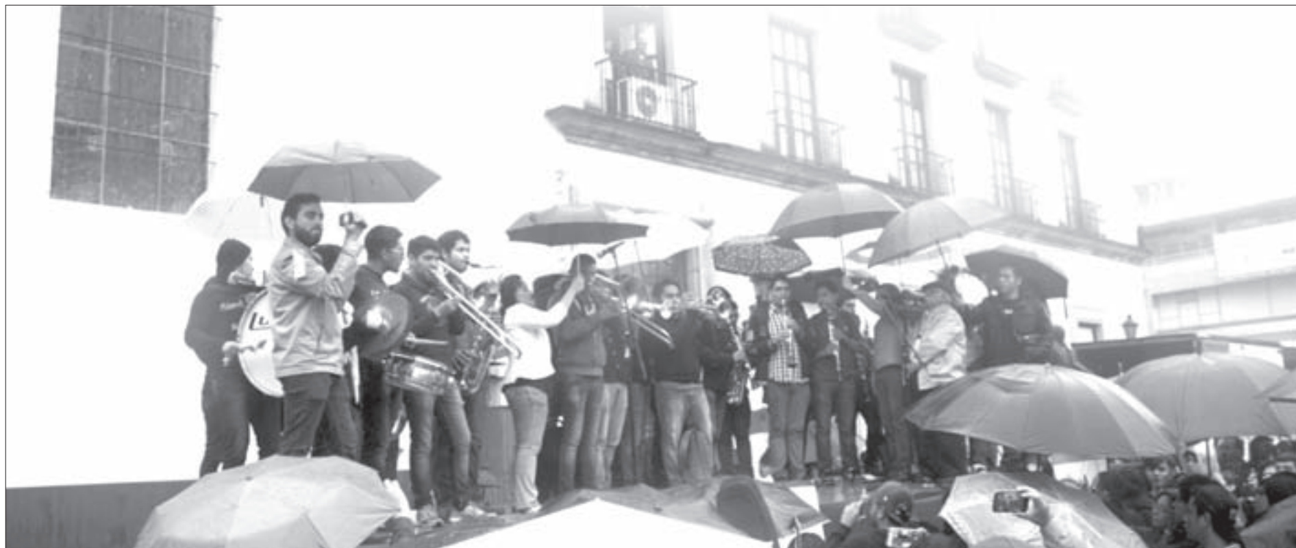
Banda de viento conformada por estudiantes de Música