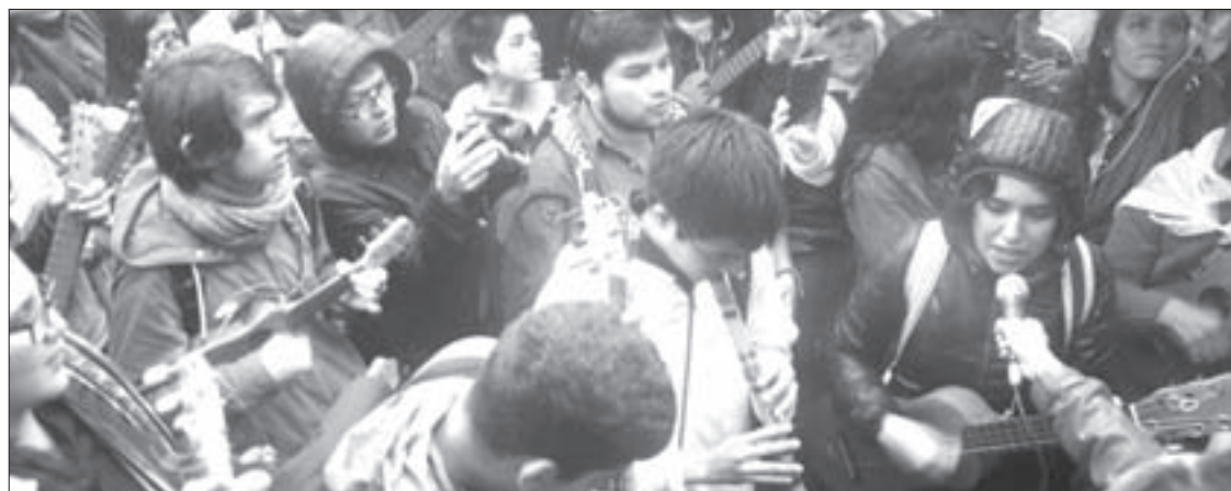
El solo de flauta acompañó al son jarocho