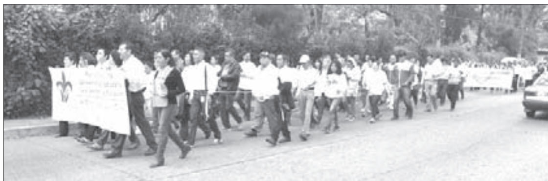
Exigieron el respeto a la educación como un derecho constitucional