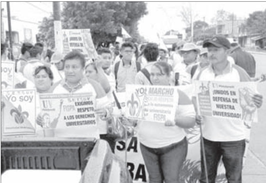
Integrantes de la FISPA se sumaron al reclamo