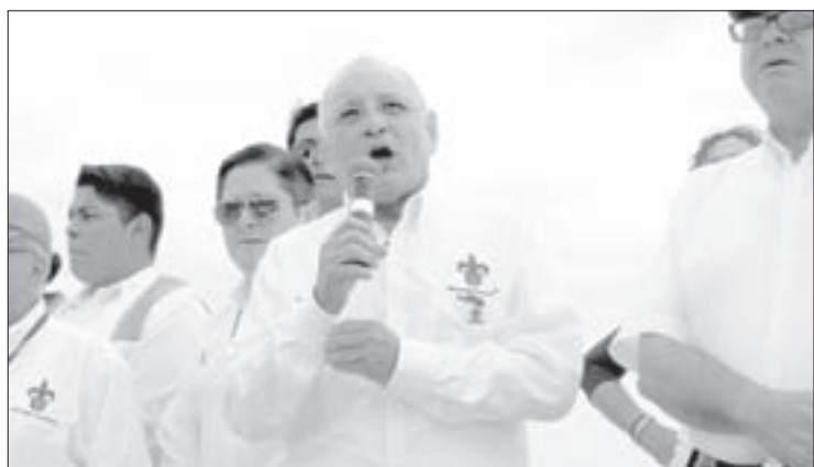
El Vicerector refrendó las demandas de la institución