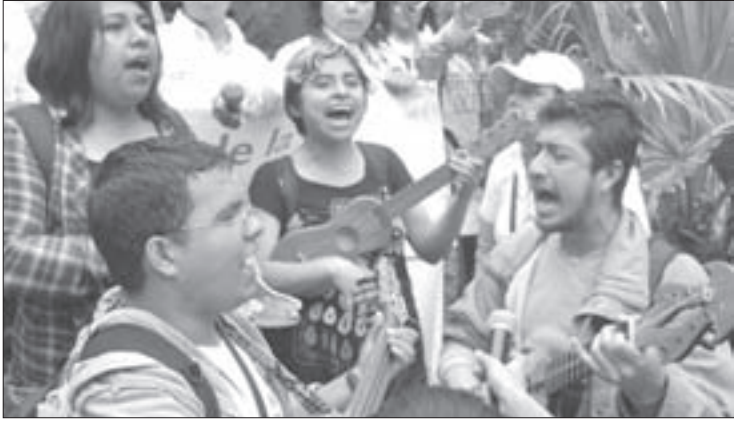
Al ritmo de La Bamba , los orizabeños respaldaron a la institución