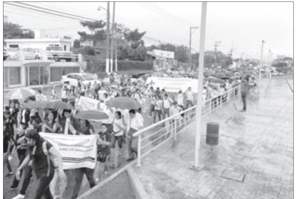
Por la calle Justo Sierra, en Minatitlán