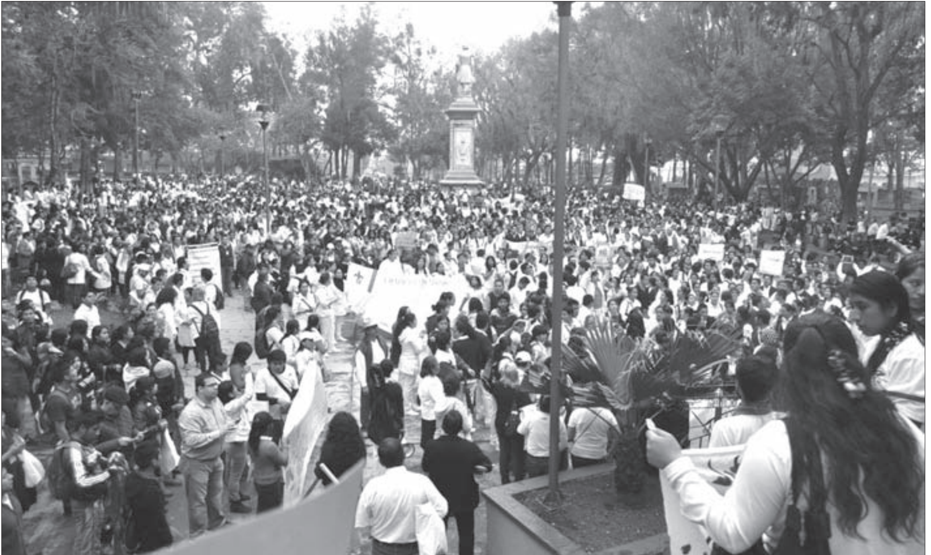
En Orizaba se congregaron alrededor de cinco mil manifestantes