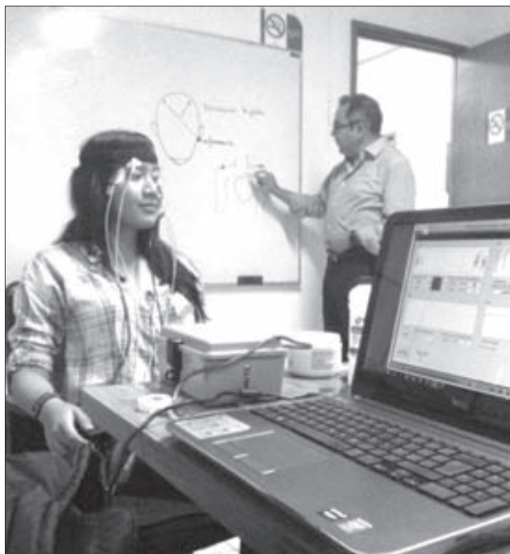
El instrumento se aplicó a alumnos de la EE

En términos generales, es similar a un polígrafo que se vende de manera comercial a un precio elevado que va de los 150 mil a los 200 mil pesos. "Contemplamos un dispositivo que fuera replicable, accesible en cuanto a costo, fácil de reparar y de utilizar".