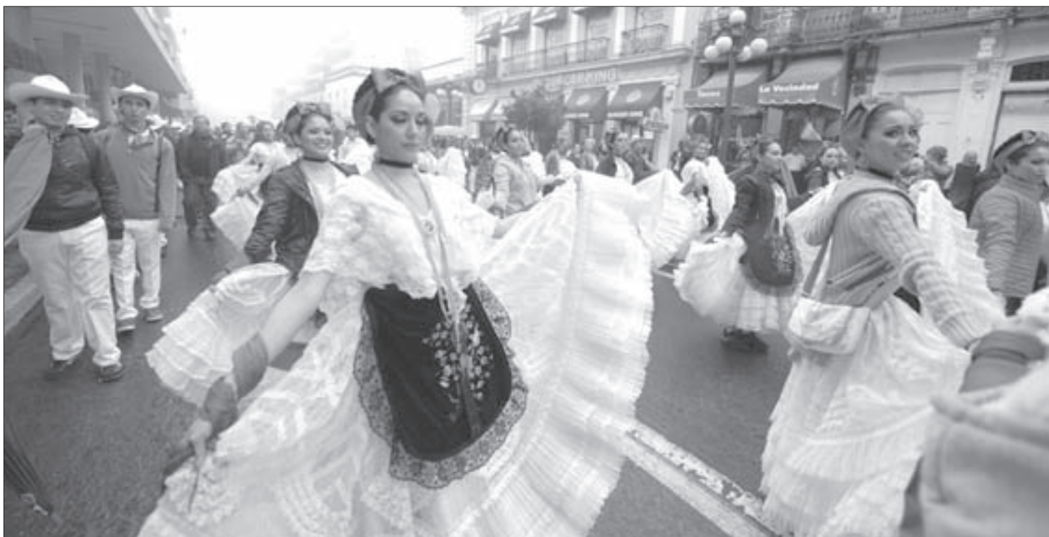
Las jarochas no dejaron de bailar durante el recorrido