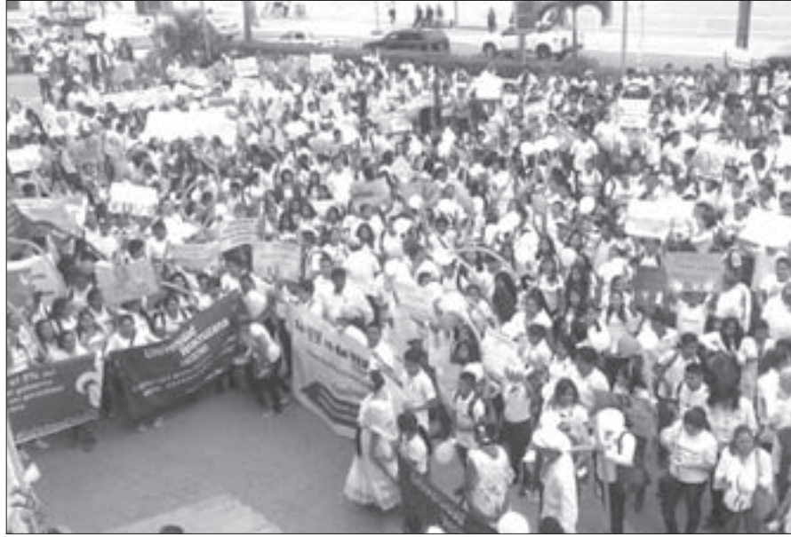
En Tuxpan marcharon desde las facultades hasta el Palacio Municipal