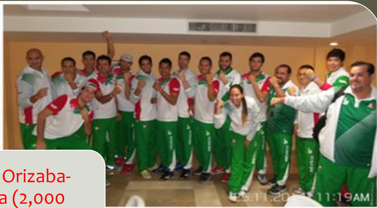
Campus Orizaba-Córdoba (2,000 pulseras).