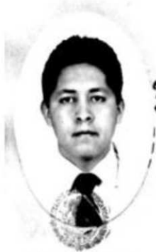
SECRETARÍA DE EDUCACIÓN PÚBLICA INSTITUTO TECNOLÓGICO DE ORIZABA DIRECCIÓN GENERAL DE CURSOS ESCOLARES

La Secretaría de Educación Pública por acuerdo del C. Presidente Constitucional de los Estados Unidos Mexicanos otorga a el C.