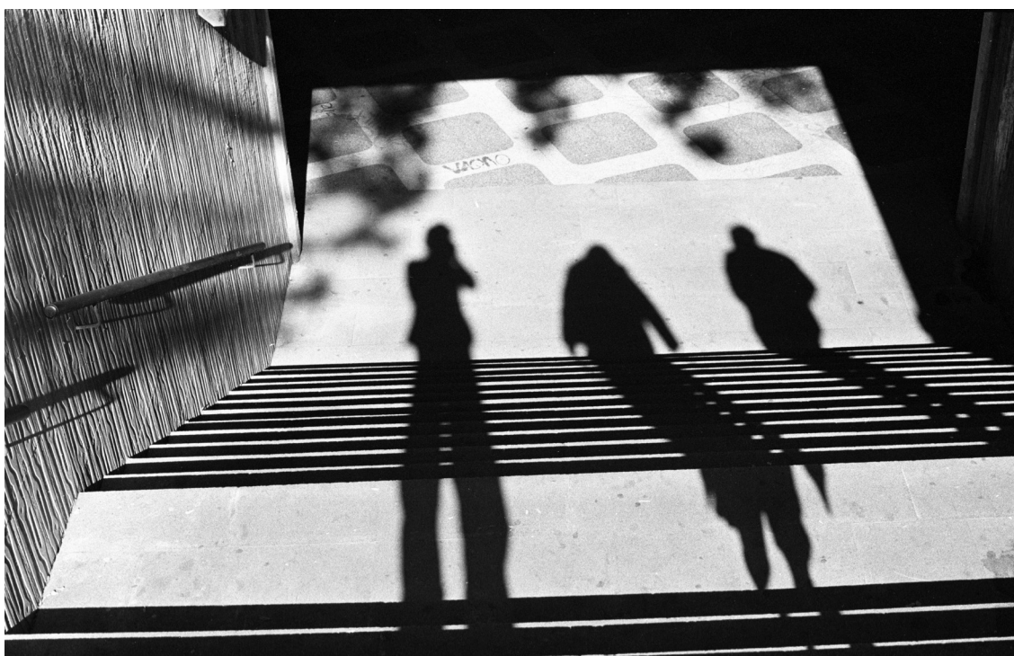
En el metro de Madrid, España. Octubre 2007.