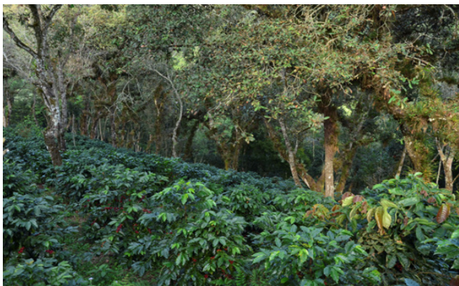
Fotografía 9: Finca en Ixhuatlán del café, Veracruz, Julio 2015.

En estos terrenos que se mantienen fértiles, pensaríamos que, situviéramos dinero, ahora sí que compraríamos unas dos “hectaritas” para sembrar, pero como somos pobres ¿dónde vamos agarrar dinero? (López, comunicación personal, 20 julio de 2011)