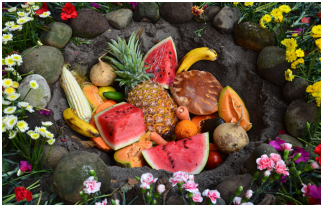
Fotografía 2: Xochitlalli, ritual indígena de agradecimiento por la cosecha, Comapa, Veracruz, Marzo 2013.

Si la imagen fotográfica señala un punto de vista, un modo de mirar, resulta clave la elección del momento y el objetivo de la captura, la técnica, el juego de la luz, el encuadre, las formas, los volúmenes, las perspectivas, la gama de grises o la paleta de colores. La sensibilidad de la mirada y la destreza técnica harían transparente el mensaje de la fotografía, para intentar conectar con el público a través del pensar, la emoción y el sentir.