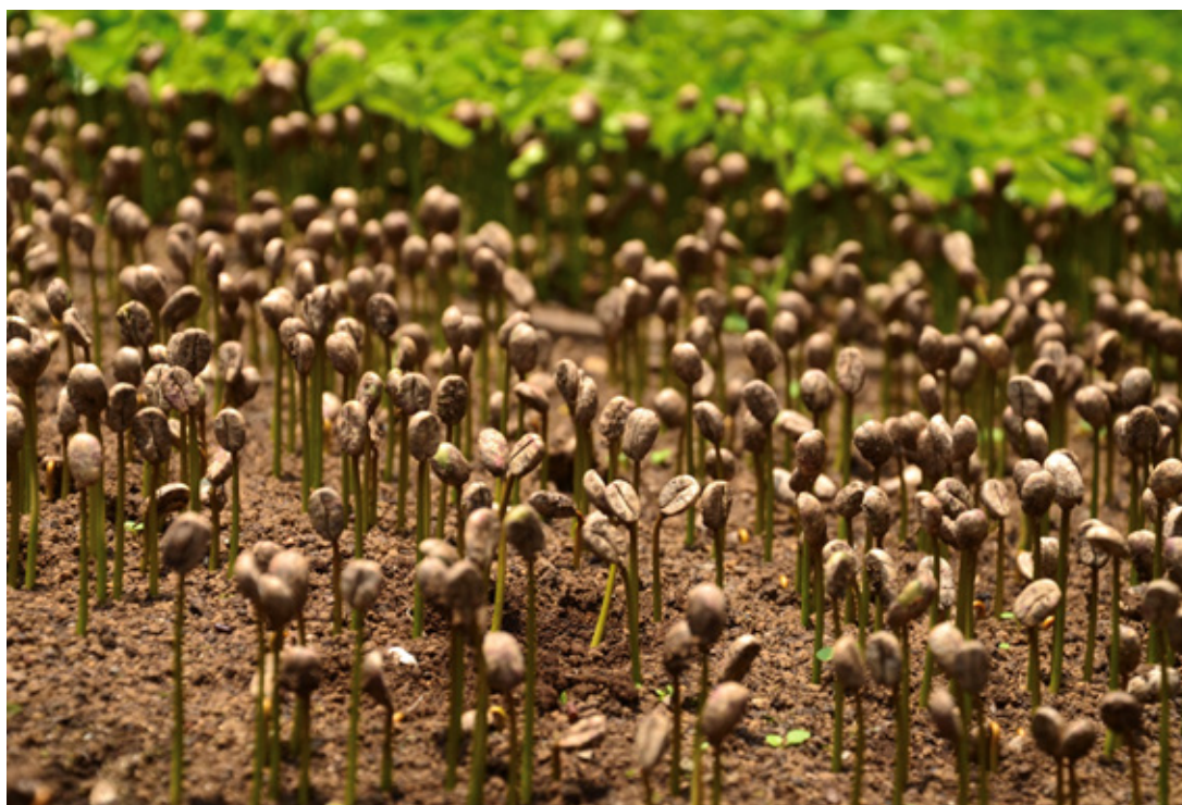
Fotografía 3: Invernadero de café en la fase Soldaditos, Centro Regional Universitario Oriente-Universidad Autónoma Chapingo, Huatusco, Veracruz, Febrero 2014.

A partir de la comercialización del café a nivel mundial, una de las rutas de ingreso a México fue por el Puerto de Veracruz. Los hacendados trajeron el café a nuestro país durante el régimen de Porfirio Díaz, y establecieron grandes fincas, respondiendo así a la creciente demanda internacional del grano. Desde entonces, la historia del café en Veracruz ha forjado una identidad a través de distintas generaciones que han hecho del cultivo una forma de vida.