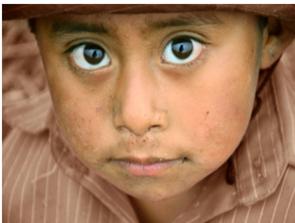
Fotografía 4: Niño jornalero, Comapa, Veracruz, Octubre 2012.

Las fotografías develan circunstancias y singularidades de lo registrado. Pero en la captura también está presente el azar, el acto fotográfico es un espejo del tiempo y las circunstancias sociales. Los niños y las niñas jornaleras que miran a la cámara, acompañan a sus padres y a sus madres a cosechar el grano y durante el resto del año viajan por temporadas a la pizca de chile o al corte de la flor en los estados de Sonora, Sinaloa, etc.