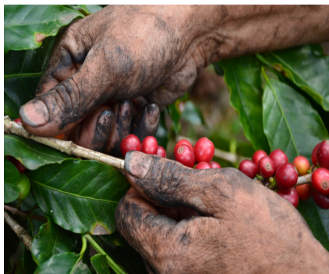
Fotografía 8: Corte de café, Ixhuatlán del café, Veracruz, Marzo 2014.

De las faldas del Pico de Orizaba o de la Sierra de Zongolica, viajan a la región de Huatusco familias enteras para trabajar temporalmente en el corte de café, viven en barracas que construyen -con madera y lámina- los cafetaleros contratistas. Los jornaleros y jornaleras comen frijol, chile y tortillas, a veces carne de pollo o chicharrones, alimentos que no siempre consumen en su lugar de origen.