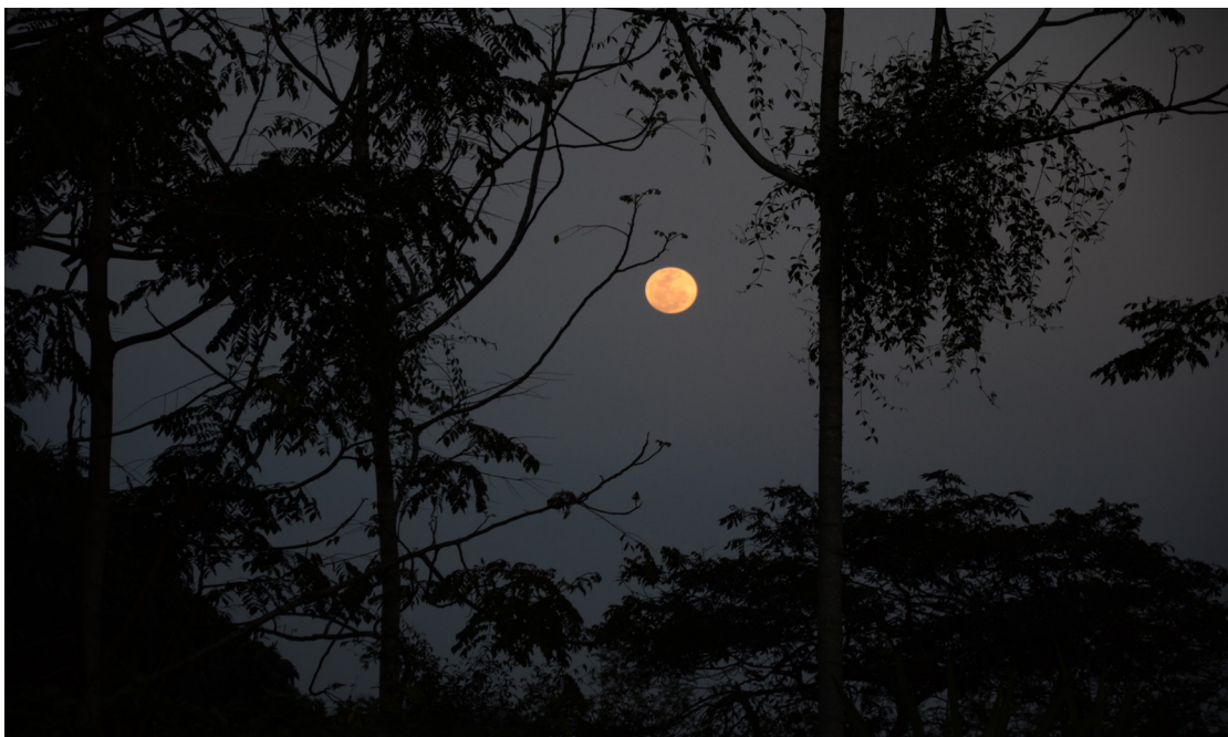
Fotografía 1: Atardecer en el Bosque de Niebla, Finca La Herradura, Briones, Veracruz, Abril 2013.

Para el oficio de sociólogo, con la fotografía se anotan situaciones, objetos y espacios que la palabra escrita no alcanza a nombrar; también es un rito social y una forma de valorar la alteridad en la interacción del trabajo de campo, que es de ida y vuelta: “Yo te fotografío porque eres importante para mí, porque lo que haces y lo que dices me interesa, y porque además esta fotografía puedo devolvértela porque sé que a ti también te va a gustar” (Bourdieu, 2012, 4m32s-4m48s).