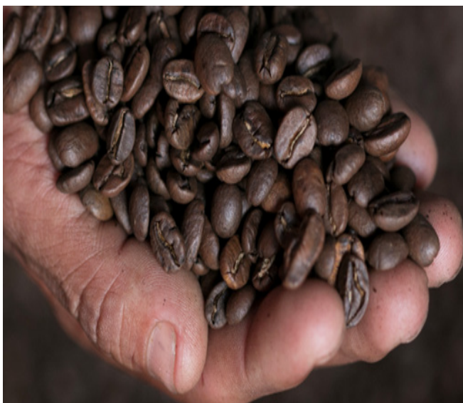
Fotografía 7: Tostado de café, cafetería Expreso, Huatusco, Veracruz, Junio 2015.

De las faldas del Pico de Orizaba o de la Sierra de Zongolica, viajan a la región de Huatusco familias enteras para trabajar temporalmente en el corte de café, viven en barracas que construyen -con madera y lámina- los cafetaleros contratistas. Los jornaleros y jornaleras comen frijol, chile y tortillas, a veces carne de pollo o chicharrones, alimentos que no siempre consumen en su lugar de origen.