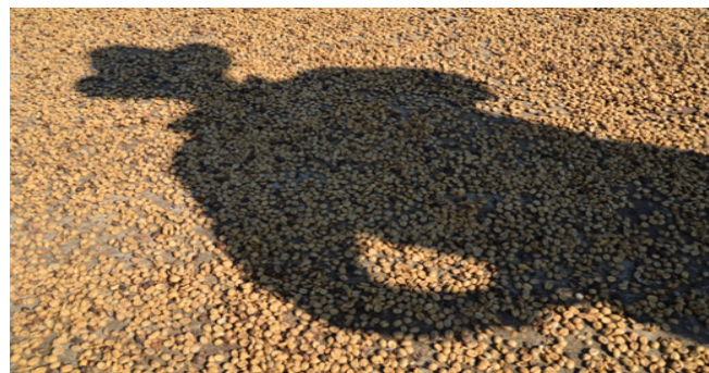
Fotografía 5: Secado al sol, Cosautlán, Veracruz, Mayo 2013.

La cultura cafetalera en Veracruz está marcada por contrastes y desigualdades sociales. Por un lado, se reconoce el café de alta calidad que se produce en la región, con premios y reconocimientos a nivel internacional por su cafecultura sustentable. Por otro lado, gran parte del sector cafetalero se encuentra desorganizado, a merced de las transnacionales de alimentos y de las fluctuaciones del precio del café en la Bolsa de Valores de New York.