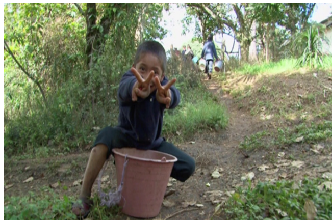
Fotografía 12: Niños jornaleros, Finca EL Mirador, Veracruz, Diciembre 2012.

Si las imágenes fotográficas confirman una visión del mundo, entonces, su práctica y su consumo juegan un papel estratégico en la construcción de las identidades y en la lucha ideológica. No todo puede decirse con palabras, necesitamos las imágenes y los testimonios para narrar historias y socializar el conocimiento. Por ejemplo, en la era de la información, el documento visual es clave no sólo para comunicar, sino para la investigación, la ciencia y la tecnología. En ese sentido, cabe aclarar que las intenciones del ojo mecánico no determinan la significación de la fotografía, ya que seguirá su propio curso impulsada por los caprichos y las lealtades de quienes le encuentren alguna utilidad. (Sontag, 1979)