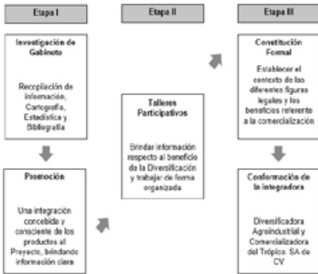
Figura 1. Metodología de desarrollo organizacional