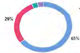
Gráfico 2. Grado de satisfacción de los participantes del curso-taller Programa interno de protección civil . (grupo 15 de octubre 2024)

1. ¿Cuál es tu grado de satisfacción con los conocimientos que adquiriste en el curso?