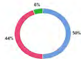
Gráfico 4. Grado de satisfacción de los participantes del curso-taller Primer respondiente en primero auxilios . (grupo 23 octubre)

1. ¿Cuál es tu grado de satisfacción con los conocimientos que adquiriste en el curso?