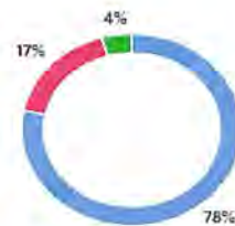
Gráfico 5. Grado de satisfacción de los participantes del curso-taller Uso y manejo de equipos de extinción . (grupo 25 octubre)