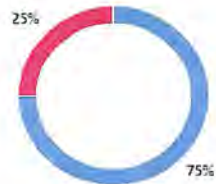
Gráfico 3. Grado de satisfacción de los participantes del curso-taller Primer respondiente en primero auxilios . (grupo 17 octubre)

1. ¿Cuál es tu grado de satisfacción con los conocimientos que adquiriste en el curso?