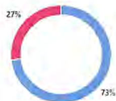
Gráfico 7. Grado de satisfacción de los participantes del curso-taller Medidas generales de seguridad para realizar trabajos en altura . (grupo 30 octubre)

Como parte de las acciones de oportunidades de mejora, y para retroalimentar el grado de satisfacción que ya se tiene de los usuarios sobre las capacitaciones, se diseñó un instrumento de evaluación respecto a la conformación y/o actualización de la Unidades Internas de Gestión Integral del Riesgo el cual considera las siguientes dimensiones: