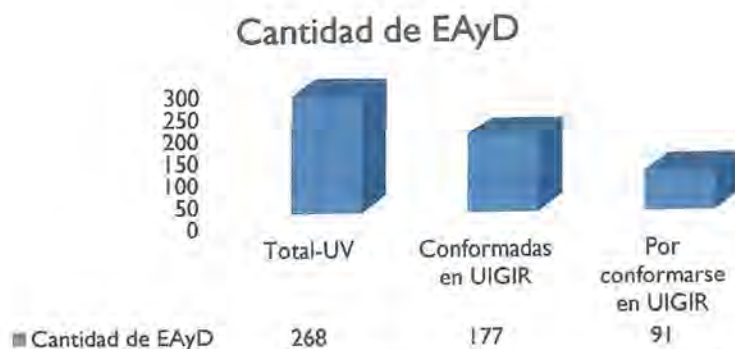
Grafico 1. Número de Entidades Académicas y Dependencias conformadas.

Asimismo, durante el 2024, la Dirección del SUGIR, recibió la solicitud de actualización de diversas actas de conformación debido a cambio en sus integrantes, dichos ajustes fueron aplicados en nuestra base de datos.