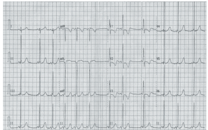
Figura 1. Electrocardiograma de un paciente con diagnóstico de Síndrome de Wolff Parkinson White.