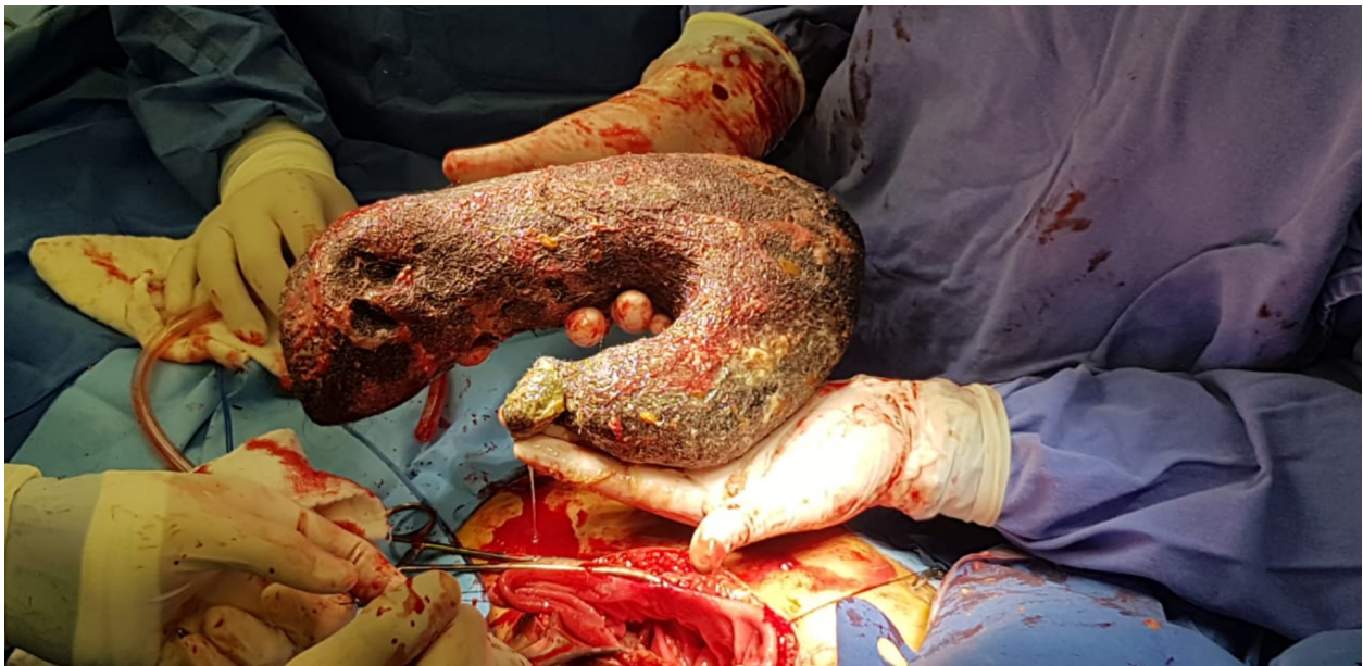
Figura 3.- Posteriormente se extrae el tricobezoar en su totalidad, el cual, como se observa, adoptó la forma del estómago.