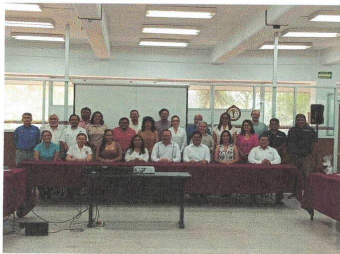
Fotografía 3. Fotografía grupal con los integrantes del Presidium e integrantes de las instituciones que integran la Red de Sustentabilidad y Acción Climática de la Región Sur Sureste de la ANUIES.