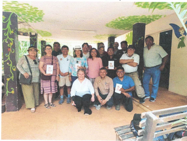
Fotografía 11. Visita y recorrido en el Parque Metropolitano del Sur Yu'u, Tsil por parte de los integrantes de la Red de Sustentabilidad y Acción Climática de la Región Sur Sureste de la ANUIES.