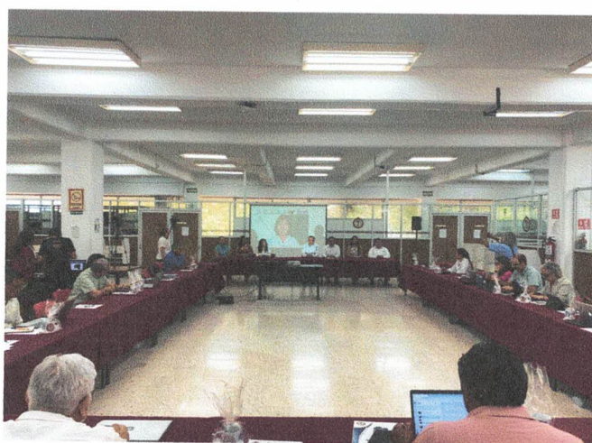
Fotografía 2. Palabras de la Dra. Consuelo Natalia Fiorentini Cañedo Rectora de la Universidad Autónoma del Estado de Quintana Roo y Actual Presidenta del Consejo Regional Sur Sureste de la ANUIES, durante la inauguración de la 37° Reunión de la Red.