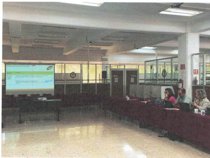
Fotografía 7. Presentación de resultados y avances de la Comisión de Gestión y Fortalecimiento por parte de la Mtra. Cecilia Limón Aguirre del Colegio de la Frontera Sur.