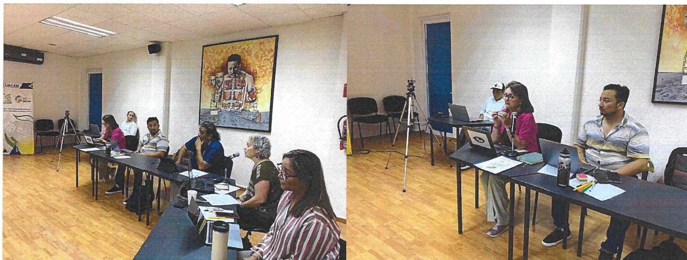
Fotografía 6. Presentación de las propuestas del Plan de Trabajo 2025 por parte de las Comisiones.