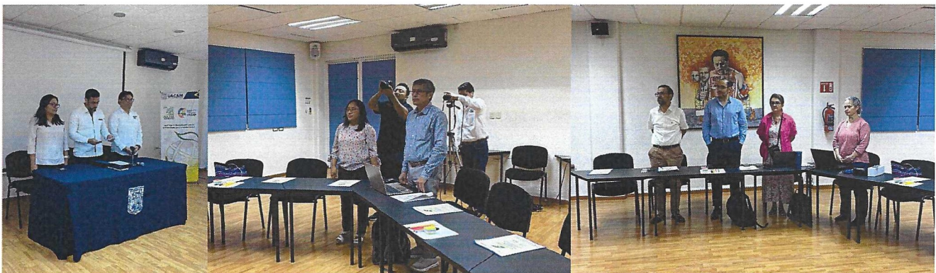
Fotografía 1. Inauguración de la reunión con la participación de las autoridades de la Universidad Autónoma de Campeche, la Coordinación y Secretaría Técnica de la RESAC.