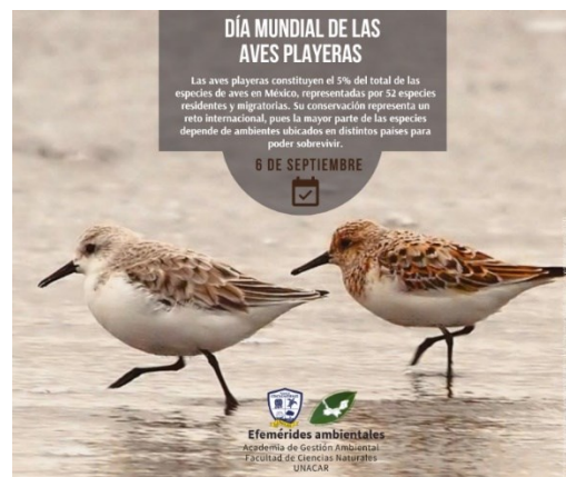
Imágenes de las publicaciones sobre efemérides ambientales publicadas en el periodo enero-diciembre 2022.