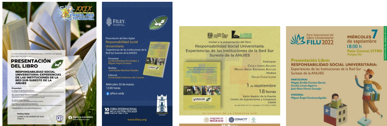
Carteles oficiales para la difusión electrónica de los eventos.

Después de la publicación del libro digital en enero de 2022, se realizó su presentación en el XXIX Encuentro Universitario de Ciencia, Arte y Tecnología de la Universidad Autónoma del Carmen, el 14 de marzo; en la Feria Internacional de la Lectura de Yucatán (FILEY) de la Universidad Autónoma de Yucatán, el 30 de marzo; en la Feria Internacional del Libro de las Universitarias y los Universitarios de la Universidad Nacional Autónoma de México, el 1 de septiembre; y en la Feria Internacional del Libro Universitario (FILU) de la Universidad Veracruzana, el 7 de septiembre.