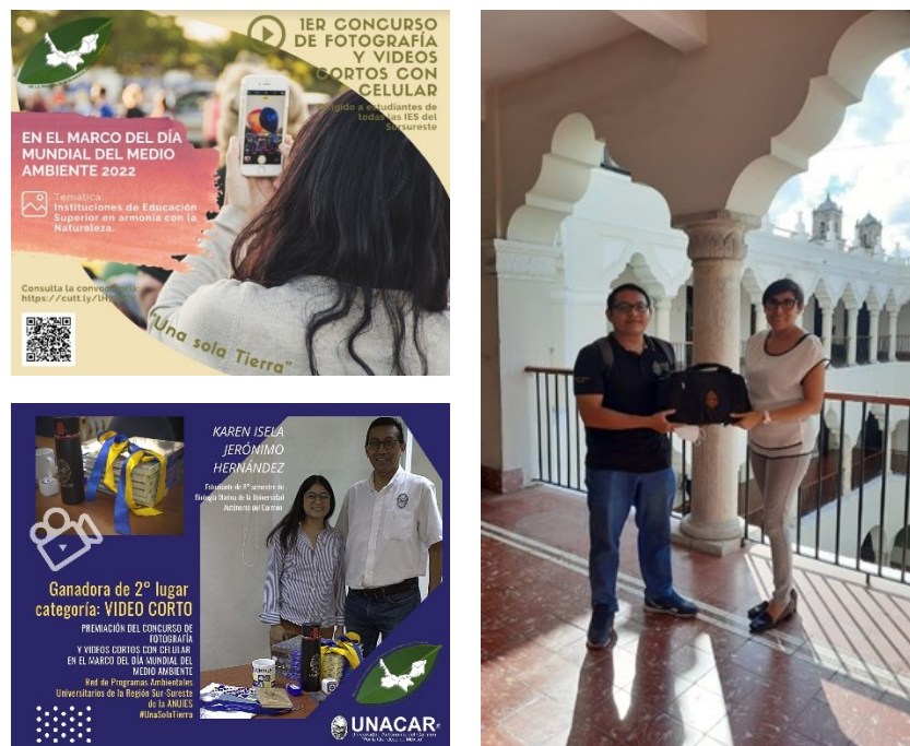
Cartel de convocatoria y entregas de premios del concurso de fotografía y video “Instituciones de educación superior en armonía con la Naturaleza”.

En total se recibieron 8 fotografías y 4 videos de integrantes de la Universidad Autónoma de Yucatán, de la Universidad Autónoma del Carmen y de la Universidad Cristóbal Colón. La premiación fue realizada en la modalidad virtual, en el marco de la 32.ª reunión de la Red PAI, ocurrida el 27 y 28 de octubre de 2022.