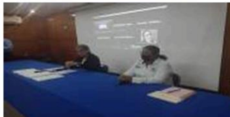
Imágenes obtenidas del informe de labores 2021-2022