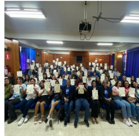
Imágenes obtenidas del informe de labores 2022-2023 y 2023-2024