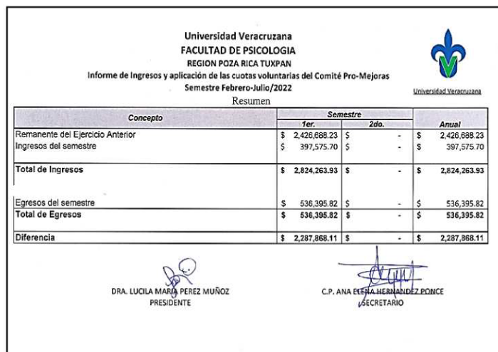
Figura 3. Resumen de Informe financiero febrero-julio 2022 del Comité Pro-Mejoras

El programa educativo de la Licenciatura en Psicología, del fondo 822 Subsidio Estatal Ordinario 2022, con fecha de corte al 30 de septiembre de 2022 tiene un monto de $205,270.05, presentado en la figura 4 y 5.