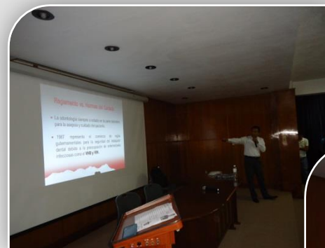
Conferencia "Control de Infecciones"