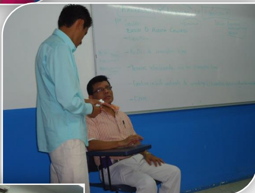
Curso PROFA "Ambientes de Aprendizaje"