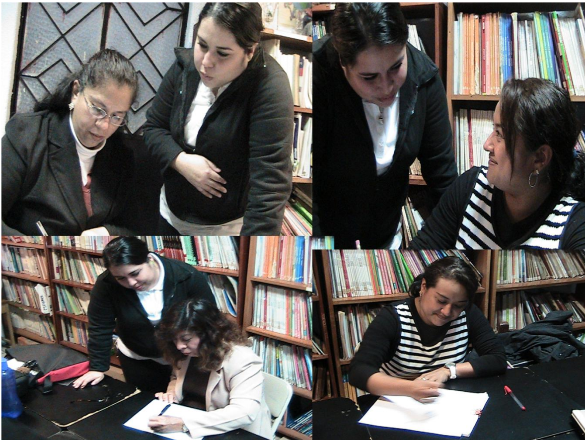
Fotografía N7: Sesión 6, redacción de las autobiografías.

El día 12 de enero de 2015 les pedí a las profesoras que escribieran su autobiografía con la finalidad de conocer un poco más de su vida, a pesar de la explicación que les di, es decir, que fueran narrativas al escribir, ellas fueron muy precisas, se las regresé como dos veces a excepción de la maestra de Español, ya que ella si fue narrativa al escribir. A pesar de que se las regresé dos veces, las autobiografías fueron muy generales, pero conocí más a las maestras, me atrevo a confesar que derrame algunas lágrimas al leer la vida de cada una de las profesoras, ya que son personas que han tenido una serie de vivencias fuertes, dignas de respeto y orgullo.