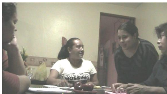
Fotografía N10: Sesión 9.

Gestora: Gracias maestra. Ya para terminar, hablamos sobre nuestras prácticas docentes enfocadas a la planeación, y les voy a pedir que contesten la evaluación, que me pareció la sesión y que aprendí. Les recuerdo escribir sus reflexiones en el cuaderno y nos vemos primero Dios el próximo jueves.