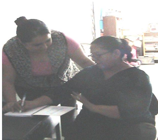
Fotografía N2: Explicación del cuaderno docente a la maestra de español.

Las profesoras se mostraron interesadas, me prestaron atención y no hubo dudas. Quedamos en reunirnos el próximo jueves 13 de noviembre de 2014.