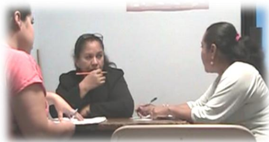
Fotografía N5: Sesión 4.

Gestora: Así es, les voy a recordar otra vez que tengan presente el cuaderno docente, yo sé lo complejo que es escribir, es un obstáculo que tenemos por el tiempo, y más que las conozco y sé que son excelentes maestras, y bueno con esto cerraríamos, vamos a tener la próxima sesión primero Dios el jueves, para abordar reflexiones en torno a la evaluación y también quisiera, ya voy hablar específicamente con ustedes un tiempo individual, para hablar un poco de los procesos metacognitivo que estamos desarrollando de esta narrativa que ustedes están compartiendo en casa sesión, ya más adelante lo voy hablar con ustedes, y bueno sé que tienen su tiempo limitado y se tienen que ir, por eso hasta aquí corto. Muchas gracias maestras por su valioso tiempo. Nos vemos el próximo jueves.