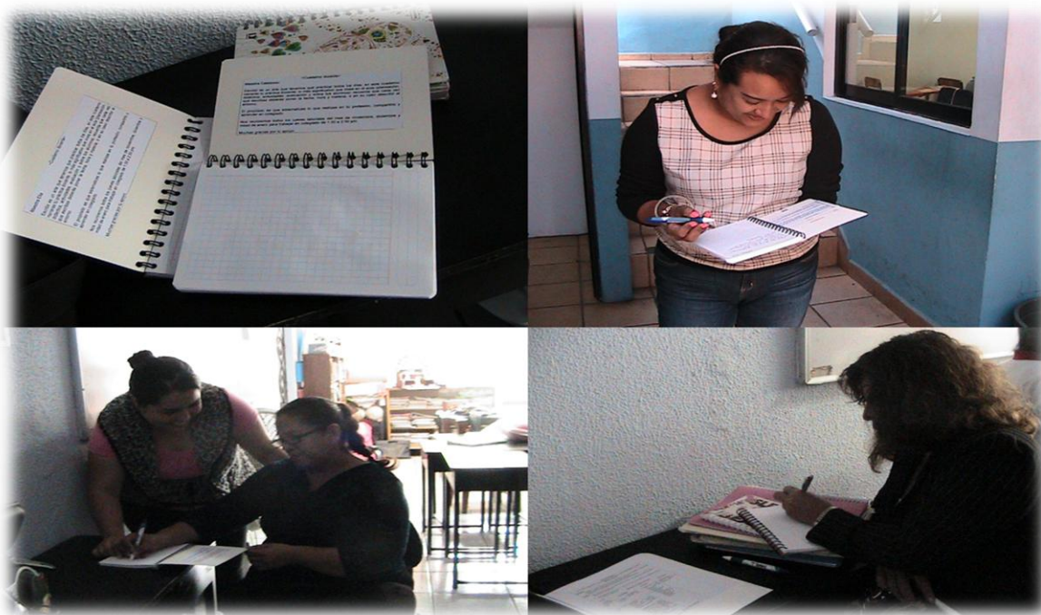
Fotografía N1: Sesión 1, explicación del cuaderno docente, 07/11/14.

El día viernes 07 de noviembre de 2014 realicé la primera sesión programada. Tuve que haberla aplicado oficialmente en la planeación el día 30 de octubre pero no pude intervenir porque asistí con mi tutora al Congreso ACCEDES 14 . Otro inconveniente que se me presentó es que las profesoras que pertenecen al proyecto participaron en eventos que organizó la escuela por el día de muertos. La semana siguiente el día jueves no me fue posible reunirme con las profesoras porque asistí al Taller “Metodología biográfico narrativa” 15 ., por lo tanto tuve que