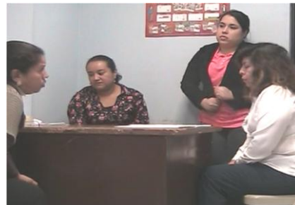
Fotografía N8: Sesión 7, Retroalimentación.

Gestora: Gracias maestra, esta retroalimentación me ayudó a mí y espero les haya ayudado a ustedes a direccionar el sentido de este espacio colegiado. Nos vemos la siguiente sesión para narrar nuestras experiencias sobre la elaboración de la planeación