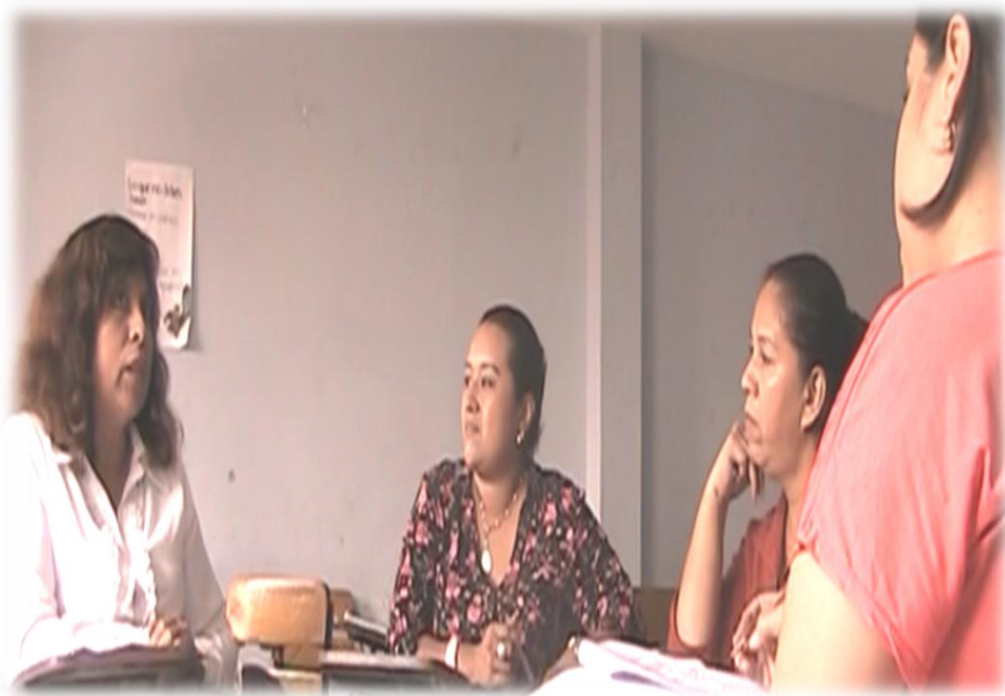
Fotografía N6: Sesión 5.

Gestora: Muchas gracias maestras, yo escucho y han sido muy ricas sus narraciones, quisiera que en este pedacito de papel me apoyaran con la evaluación del día de hoy, ¿qué me pareció la sesión del día de hoy y que aprendí?, quisiera que en el aprendizaje, fueran un poco más precisas, específicamente que han aprendido, o que han reflexionado en este tiempo que hemos estado trabajando en colegiado, les doy su tiempo y en la siguiente sesión regresando de vacaciones vamos a analizar lo que son las evaluaciones desde la primera sesión, hasta la de hoy que hemos tenido. Bueno esto sería todo.