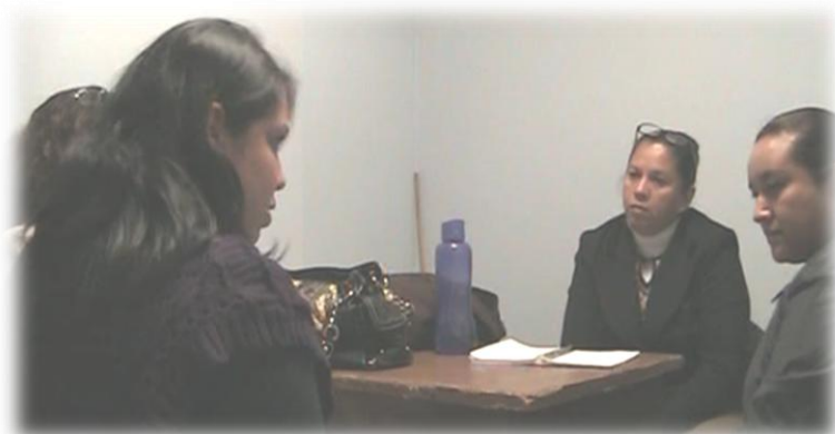
Fotografía N3: Segunda sesión en colegiado.

Gestora: Es de mucho aprendizaje la verdad, bueno dado al poco tiempo que ustedes tienen, nos despedimos, yo se que tienen muchas actividades. Gracias por su tiempo a pesar de que están muy ocupadas y que tienen trabajo en la tarde, pero si les encargo la evaluación, es, ¿qué me pareció la sesión? y ¿qué aprendí?, se nos va a quedar de tarea porque yo sé que no tienen tiempo ahorita de contestarla. La siguiente sesión se pospone por el desfile del 20 pero vamos a comenzar con las evaluaciones de esta sesión.