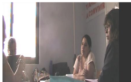
Fotografía N9: Sesión 8.