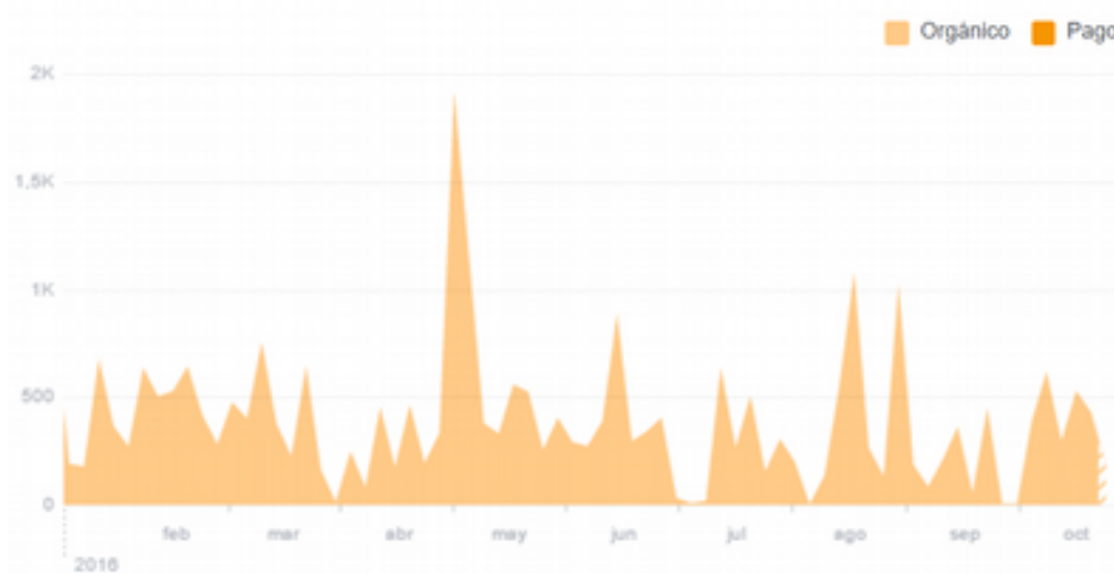
Figura 2. Cantidad de visitas a la página Facebook de la coordinación en el periodo enero-octubre 2016

En la página 3 de la Coordinación Regional se puede observar los anuncios de mayor impacto en la audiencia. En esta figura se observa que las noticias relacionadas con las convocatorias de movilidad internacional y las noticias de logros en movilidad de nuestra región son las noticias con mayor cantidad de accesos.