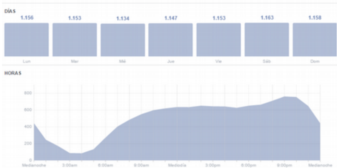
Figura 4. Distribución de los accesos a la página Facebook de la Coordinación Regional distribuidas por día y por horario.

En la Figura 4 se puede observar como las visitas a la página Facebook organizadas por horario y por día de la semana. En la figura se muestra que no hay diferencia entre los días de las semanas para mostrar información en la página Facebook mientras que si hay diferencia en los horarios donde el mejor horario para mostrar noticias es entre nueve y las once de la noche.