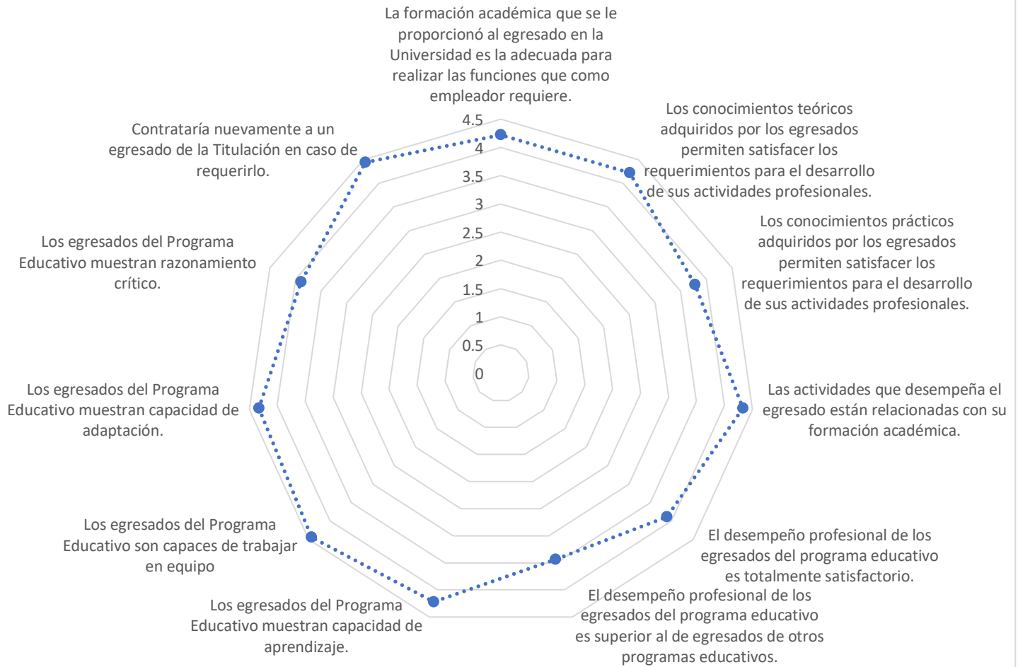
GRÁFICO DE EVALUACIÓN

El Grado de Satisfacción de los Empleadores con respecto al programa educativo es de 4,11 sobre 4.5.