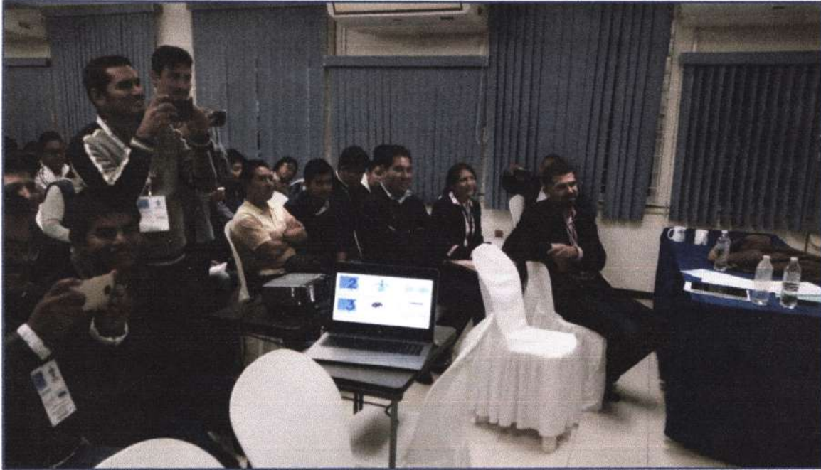
Aspecto general del evento