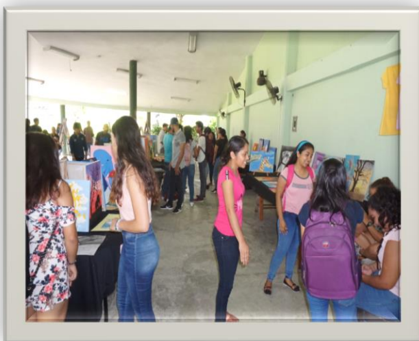
Tabla 18. Actividades del Taller Libre de Artes.