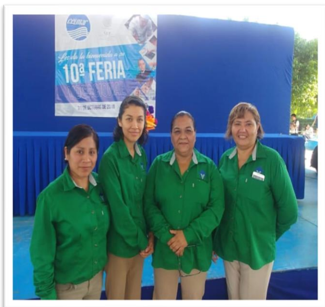
Tabla 13. Promoción de los Programas Educativos. Fuente: Secretaria Académica Facultad.