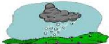
hailing It's hailing.