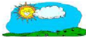
partly cloudy It's partly cloudy.