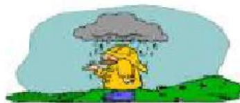
rainy It's raining.