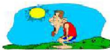
hot It's hot.