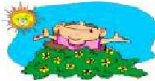
perfect/beautiful It's beautiful.