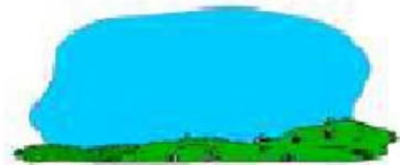
clear It's clear.