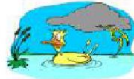
stormy It's stormy.