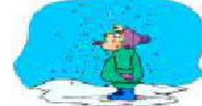
snowy It's snowing.