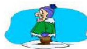
cold It's cold.