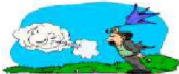
windy It's windy.