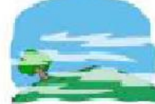
foggy It's foggy.

Para preguntar acerca de cómo es el clima.