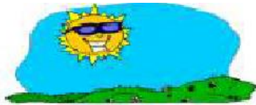
sunny It's sunny.