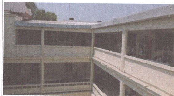
F4: EXTERIOR 2DO NIVEL