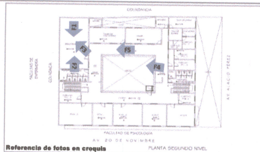
Referencia de fotos en croquis