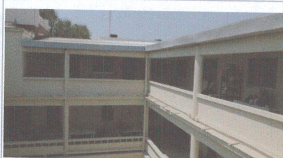
F4: EXTERIOR 2DO NIVEL