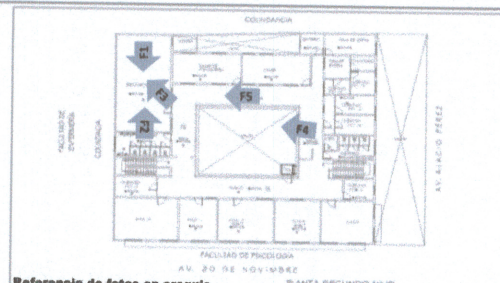
Referencia de fotos en croquis