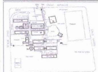
MANAGUA ESO, BERLIN, MADRID, PANAMA, COL. NUEVA MINATITLAN MANZ 27 Y 31, MINATITLAN, VBR.