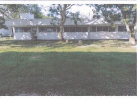
F3: Vista Exterior lateral