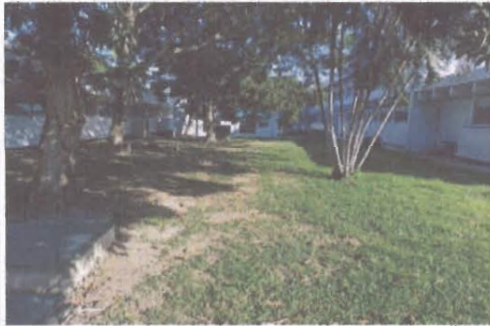
F1: Vista Exterior frontal