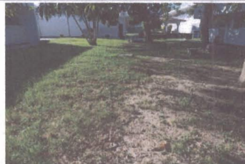
F4: Vista Exterior posterior