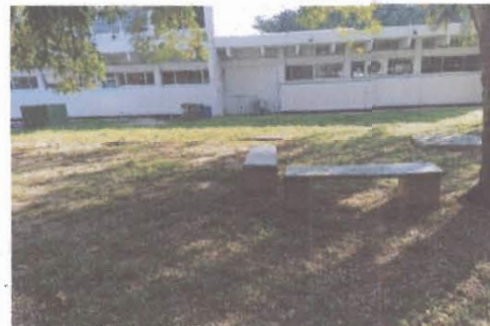
F2: Vista Exterior lateral